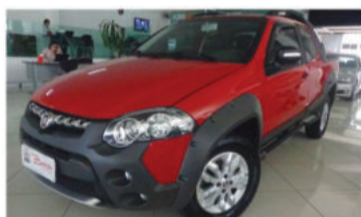
STRADA ADVENTURE CD 1.8 MPI 16V - 2013 2 portas, Flex