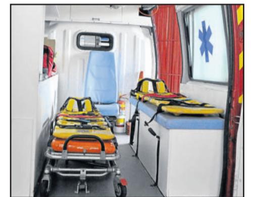
A ambulância tipo C fará atendimento pré-hospitalar sem medicação