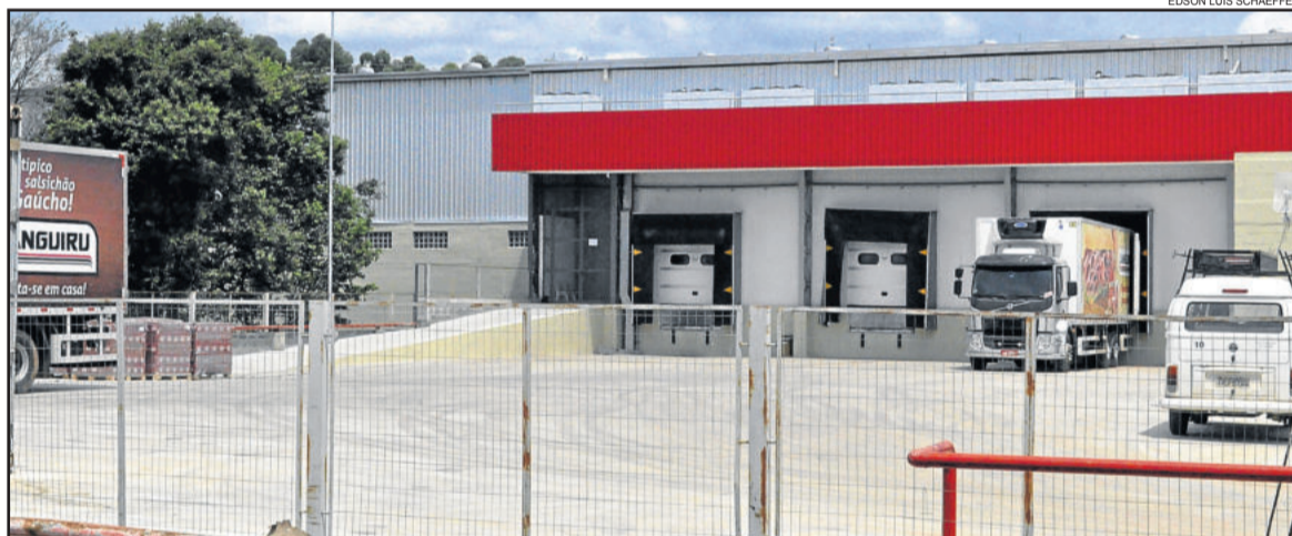
Novo CD da Languiru já está em funcionamento

O presidente ainda observa que o novo Centro de Distribuição também permite uma revisão e reestruturação geográfica dos outros 9 CDs existentes, que eram mantidos em cidades mais próximas. “Antes tínhamos necessidade de mantermos CDs próximos, como em Farroupilha, Passo Fundo, Santa Cruz do Sul. Com o novo CD em Teutônia, talvez alguns dos CDs próximos não serão mais necessários”, coloca.