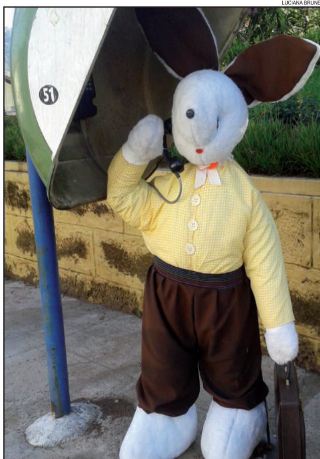
Decoração para a Páscoa já embeleza Colinas