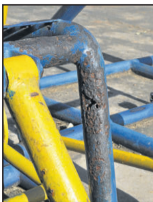
Ferrugem, devido a ação da chuva e do sol, é um dos fatores que estraga os equipamentos