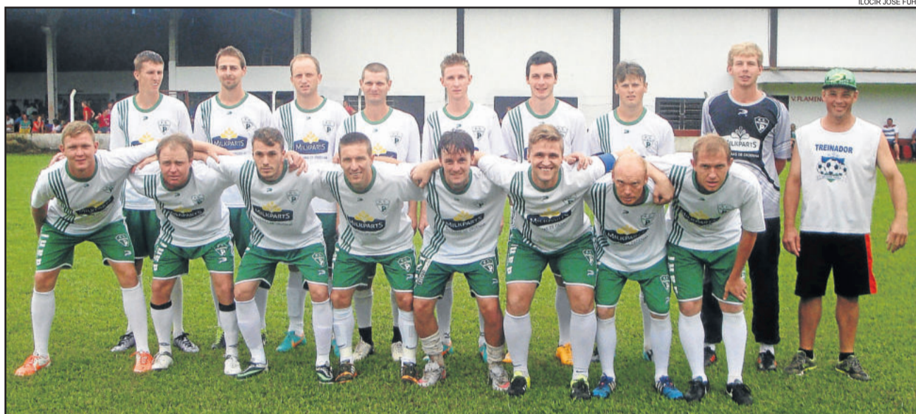
Palmeiras, de Westfália