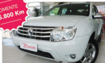
DUSTER DYNAMIQUE 2.0 16V - 2015 4 portas, Automático, Flex