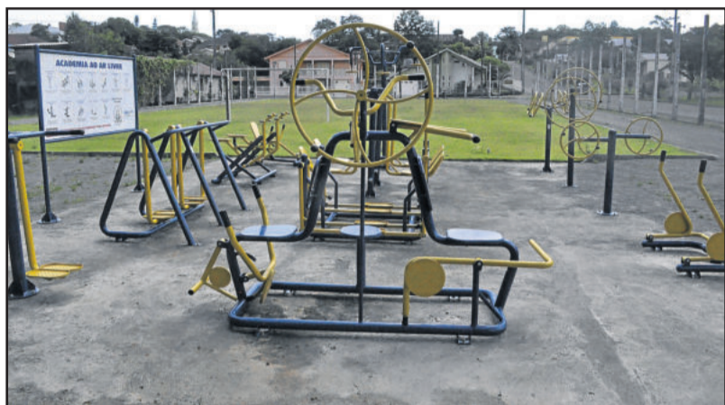
Academia na área de Lazer na Rua Maurício Cardoso, no Bairro Teutônia, também está em boas condições de uso