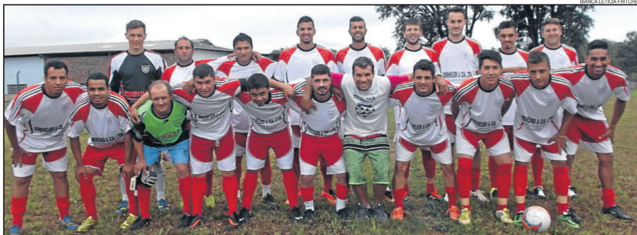
União da Germano

Nos aspirantes, o destaque é o confronto entre líder e lanterna da chave A, Atlético Gaúcho e Flamengo, respectivamente. Neste domingo, os jogos ainda começam às 15 horas nos Aspirantes e 17 horas nos Titulares.