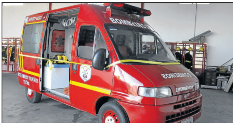
Novo veículo adquirido pelo Corpo de Bombeiros Voluntários