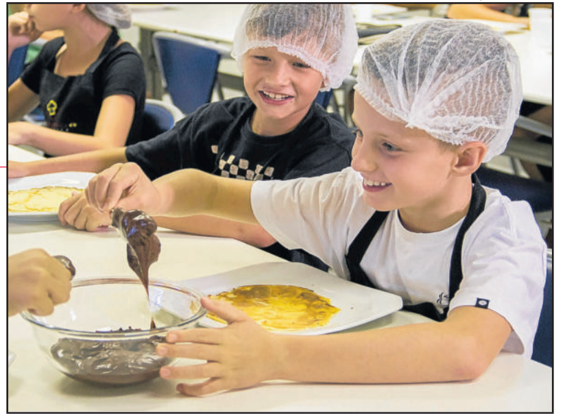
Oficina Minichefes reuniu 19 crianças

Dezenove crianças participaram da oficina Minichefes, que ocorreu na Univates na quarta-feira