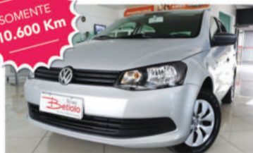
GOL TRENDLINE 1.0 - 2015 4 portas, Flex

Ar condicionado Direção hidráulica Vidros elétricos R$ 33.900