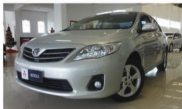
COROLLA XEI 2.0 16V - 2013 4 portas, Automático, Flex