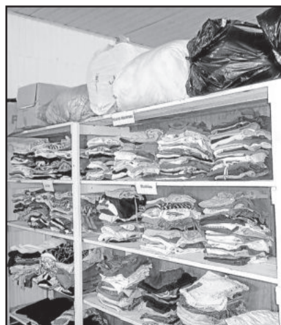
Roupa para doação

Muitas destas roupas sem condições de serem usadas acabam sendo utilizadas para confecção de tapetes, panos, por artesãos ou costureiros que transformam estes "descartes" em produtos manufaturados que vendidos contribuem para complementar a renda familiar.