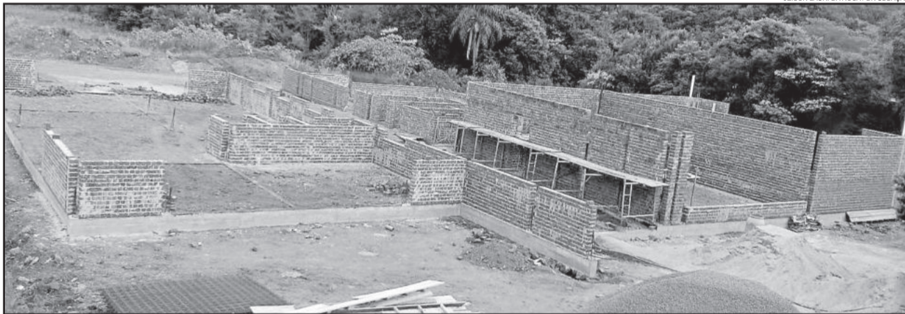
Obras da nova sede seguem em ritmo acelerado