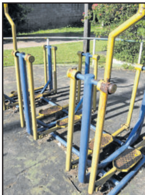
Academia do Parque Poliesportivo é uma das que necessita de mais manutenção