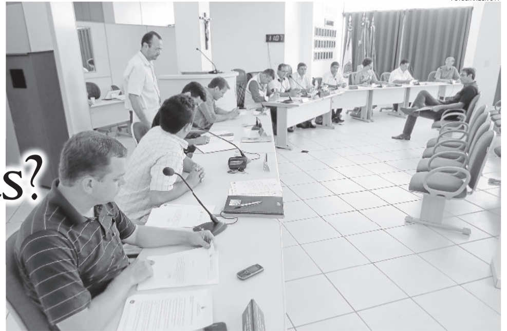
Vereadores de Teutônia acumularam R$ 101,2 mil em diárias