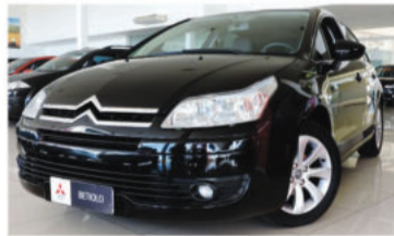
C4 GLX 1.6 16V - 2012 4 portas, Flex