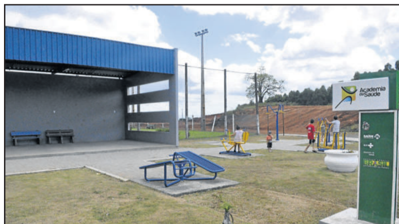
No Parque Municipal de Fazenda Vilanova, academia foi totalmente substituída e conta também com espaço coberto para atividades

A Prefeitura acredita que o modelo poderá servir de referência para outras cidades brasileiras. A empresa deverá fazer a manutenção corretiva e preventiva das academias, o que inclui soldas, pintura, reposição de peças e equipamentos previstos no