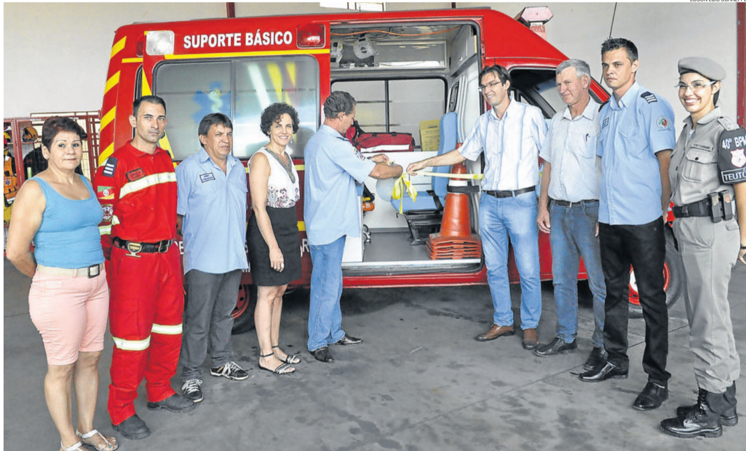
Nova viatura de resgate e remoção (URT) foi apresentada à comunidade e autoridades na manhã de ontem, sexta-feira, na sede da corporação. TEUTÔNIA > 10