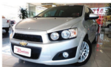
SONIC LTZ 1.6 MPFI 16V - 2013 4 portas, Automático, Flex