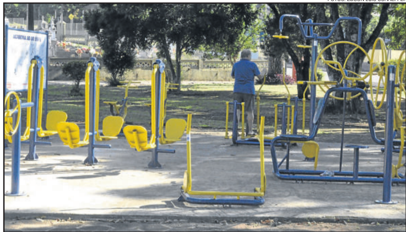
A maioria das academias está em condições de uso, como a praça na Comunidade Evangélica do Bairro Canabarro