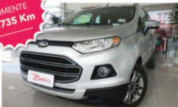
ECOSPORT FREESTYLE 2.0 - 2015 4 portas, Automático, Flex