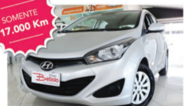
HB20 COMFORT 1.6 FLEX 16V - 2015 4 portas, Flex