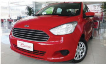
KA + SE 1.5 - 2015 4 portas, Flex