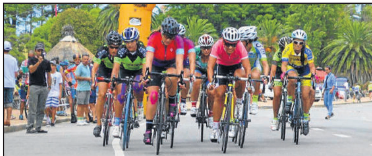
Atletas de equipes se revezavam para neutralizar adversárias

Além de enfrentar essa maratona de quatro provas em quatro dias, a maioria das competidoras formava uma equipe, com estratégias montadas. “Trabalhavam em equipe fugas e mais fugas. Consegui neutralizar algumas. Graças a Deus não tive nenhuma queda, porque houve muitas no percurso”, destaca. Ela disputou com atletas do Uruguai, Argentina, Chile e Brasil, usando equipamen- tos de alta qualidade.