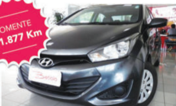
HB20 COMFORT PLUS 16V FLEX - 2015 4 portas, Automático, Flex