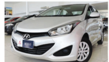
HB20S COMFORT STYLE 1.6 16V - 2015 4 portas, Automático, Flex