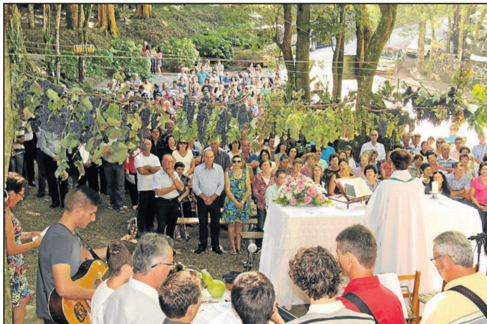
Celebração será amanhã, domingo, dia 14

Acontece na próxima terça-feira, dia 16, uma audiência pública para debater a segurança em Garibaldi. O encontro é aberto à comunidade, uma vez que o assunto diz respeito à sociedade. A audiência pública será realizada às 19 horas, na Câmara de Vereadores de Garibaldi, localizada na Travessa 31 de Outubro, no Centro do Município.