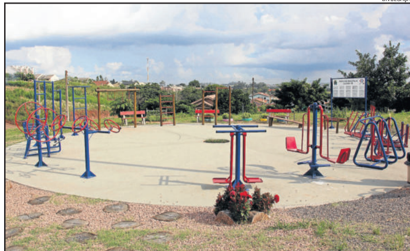
Academia do Bairro Montanha, em Lajeado