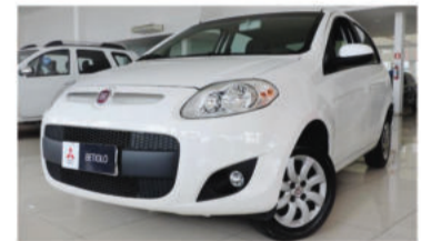
PALIO ATTRACTIVE 1.4 8V - 2014 4 portas, Flex

Ar condicionado Direção hidráulica Vidros elétricos R$ 33.900