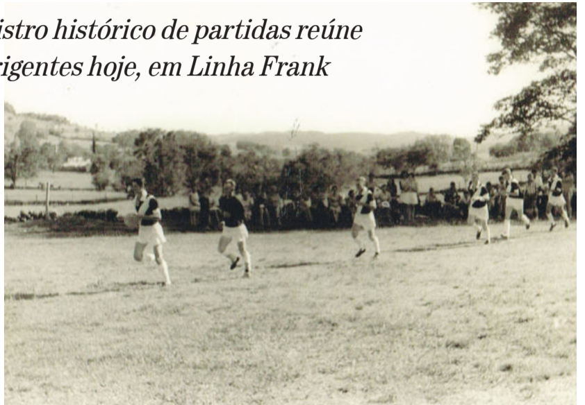
A Sociedade Esportiva Bandeirantes é provavelmente a única entidade amadora da região, que possui um rico e precioso arquivo histórico registrado durante 8 anos

E como fica mais fácil lembrar de fatos quando eles estão registrados em “preto e branco”. A Sociedade Esportiva Bandeirantes é provavelmente a única entidade amadora de toda a região - e quem sabe até do Estado - que possui um rico e precioso arquivo histórico registrando, durante cerca de 8 anos todos os jogos realizados, com escalações, adversários, local das partidas, datas e gols marcados; de Aspirantes e Titulares.