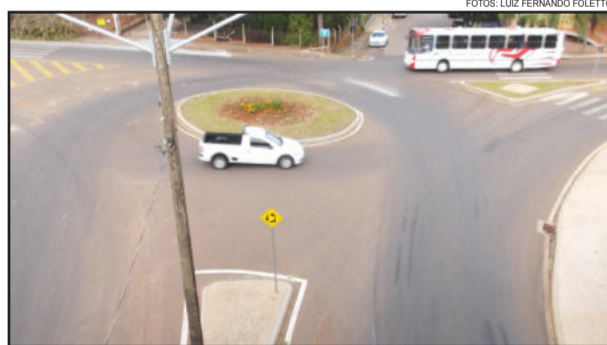
Local receberá sinalização vertical e horizontal