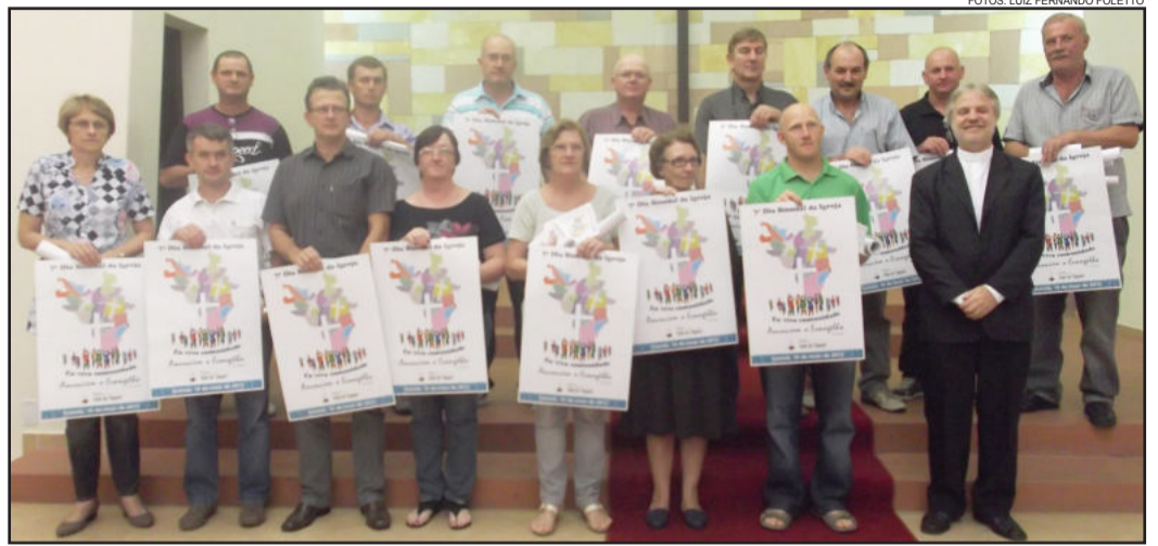
Lideranças das 59 Comunidades e das 15 Paróquias receberam cartazes da campanha

Para isto, estão convidados grupos das comunidades do Sínodo e também a Comunidade Evangélica São Lucas de Porto Alegre, que mantém uma casa que recebe pessoas doentes e familiares que