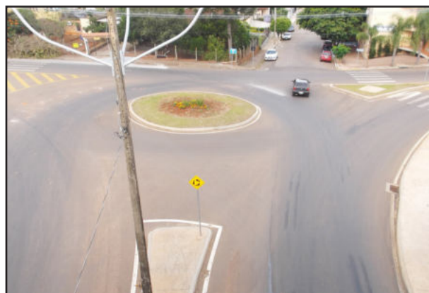
Placas de Pare serão implantadas em forma de sinalização horizontal no solo e vertical em forma de placas