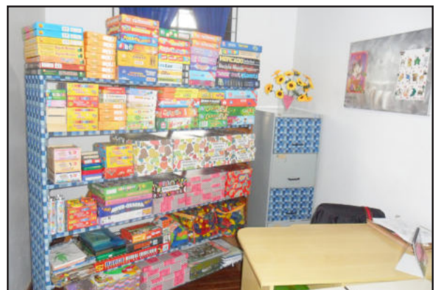
Cerca de 100 jogos pedagógicos foram adquiridos para a qualificação do saber

Atualmente, as turmas do 1º, 2º e 3º ano estão participando das aulas por serem as turmas onde a alfabetização e o letramento se fazem mais necessários. Foram adquiridos cerca de 100 jogos pedagógicos para a realização das aulas e das oficinas psicopedagógicas da escola.