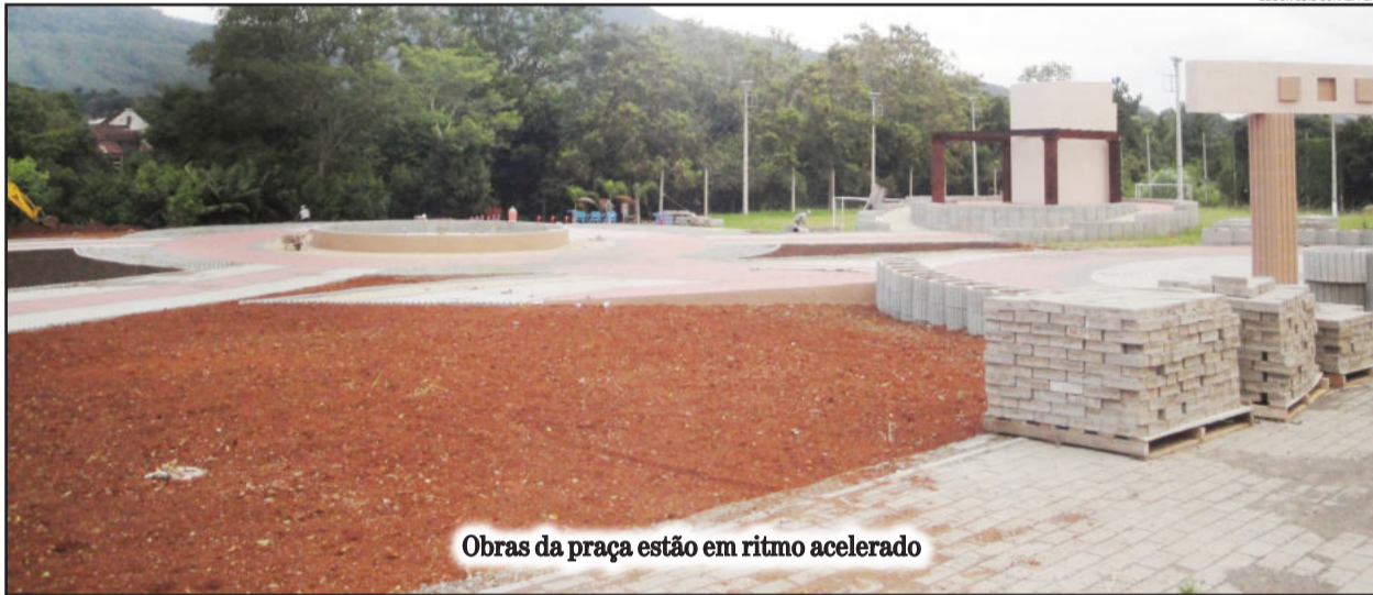
Obras da praça estão em ritmo acelerado

A programação para o dia 11 de maio inicia às 15 horas, com atividades para as escolas junto a praça. Às 19 horas está prevista a inauguração da praça, com show de fogos e iluminação especial. E a partir das 20 horas, haverá show com a banda Tchê Guri.