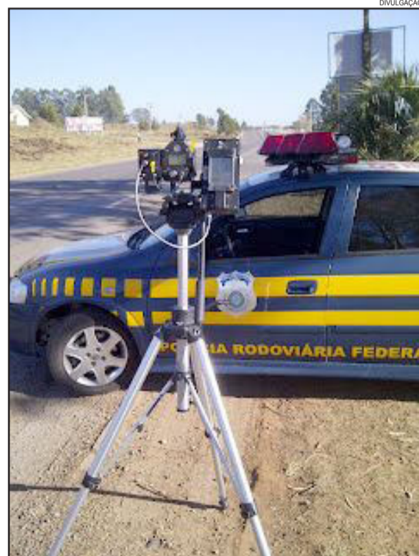
Em todo o Rio Grande do Sul, foram 15,2 mil multas aplicadas pela Polícia Rodoviária Federal somente no fim de semana de Páscoa