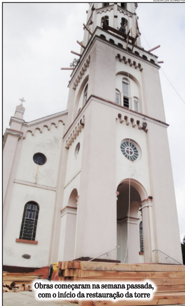
Obras começaram na semana passada, com o início da restauração da torre

A restauração contempla a limpeza e tratamento, inclusive com a aplicação de cupinidas, de todas as partes da igreja.