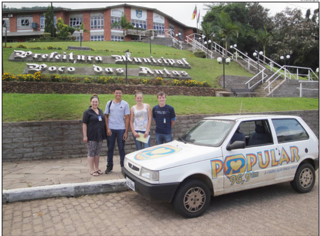
Caravana Popular esteve no município de Poço das Antas na terça-feira

Na terça-feira, a equipe foi a Poço das Antas (foto), onde foi bem recebida pela comunidade poçoantense.