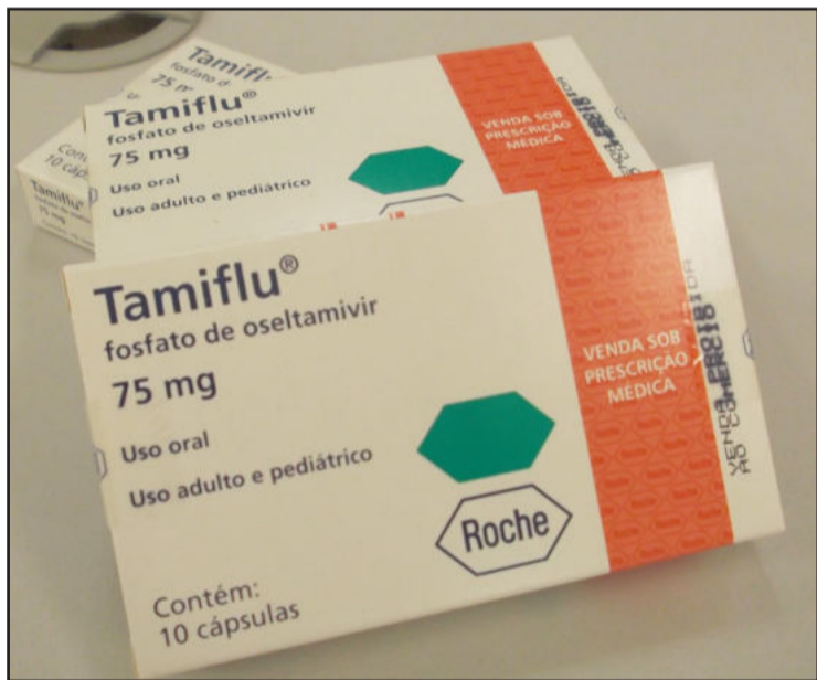
Tamiflu é indicado em casos da gripe influenza

Os sintomas da influenza se caracterizam pelo comprometimento das vias aéreas superiores, com congestão nasal, coriza, tosse, rouquidão, febre, mal estar, dor no corpo e cefaléia (dor de cabeça).