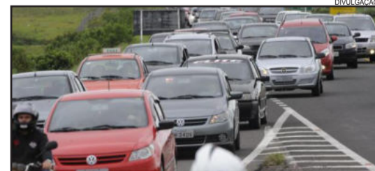
Motoristas gaúchos podem ser impedidos de dirigir com novo sistema do Detran

O condutor que tiver a habilitação cassada ficará impedido de dirigir por dois anos. Após esse período, se o condutor quiser recuperar a carteira, será preciso partir do zero e refazer todas as etapas para formação de condutores, como se estivesse obtendo a primeira habilitação. Quem tem a habilitação suspensa ou cassada, mas continua dirigindo,