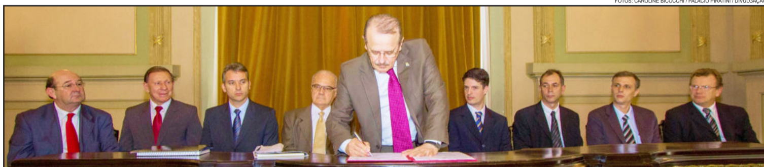
Governador Tarso Genro assina Protocolo de Intenções com as empresas Nutrifont-BRFoods e Lativale

Os investimentos foram viabilizados a partir da alteração da legislação de ICMS, que prevê um incentivo para a produção de um grupo de subprodutos lácteos. Essa é uma das ações que foi gestada no âmbito do programa setorial da agroindústria/leite, um dos setores estratégicos da Política Industrial do Governo do Estado, coordenado pela Secretaria