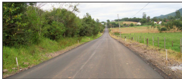
Asfaltamento visa melhorar a trafegabilidade e o escoamento da produção, além de interligar Teutônia com Poço das Antas