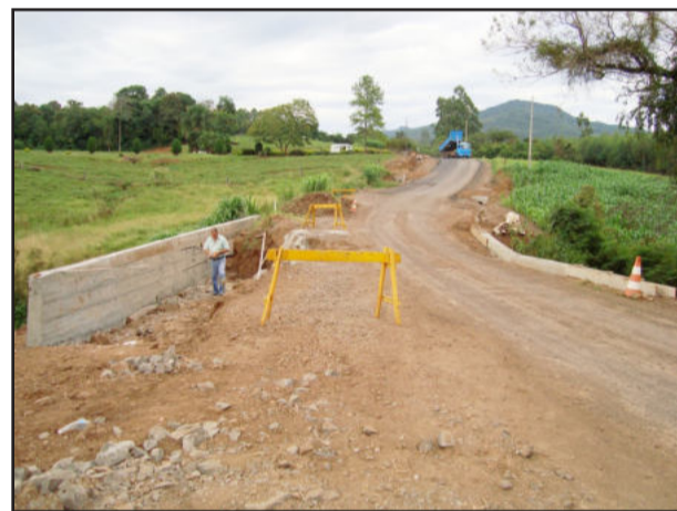
Ponte recebeu obra de contenção, com muro de arrimo

regularização da pista, deixando tudo pronto para receber a segunda etapa, que consiste na colocação da base asfáltica.