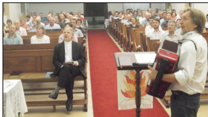
Encontro de lideranças foi realizado em Estrela