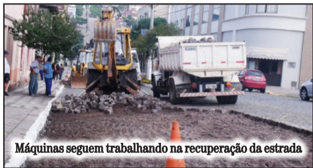
Máquinas seguem trabalhando na recuperação da estrada