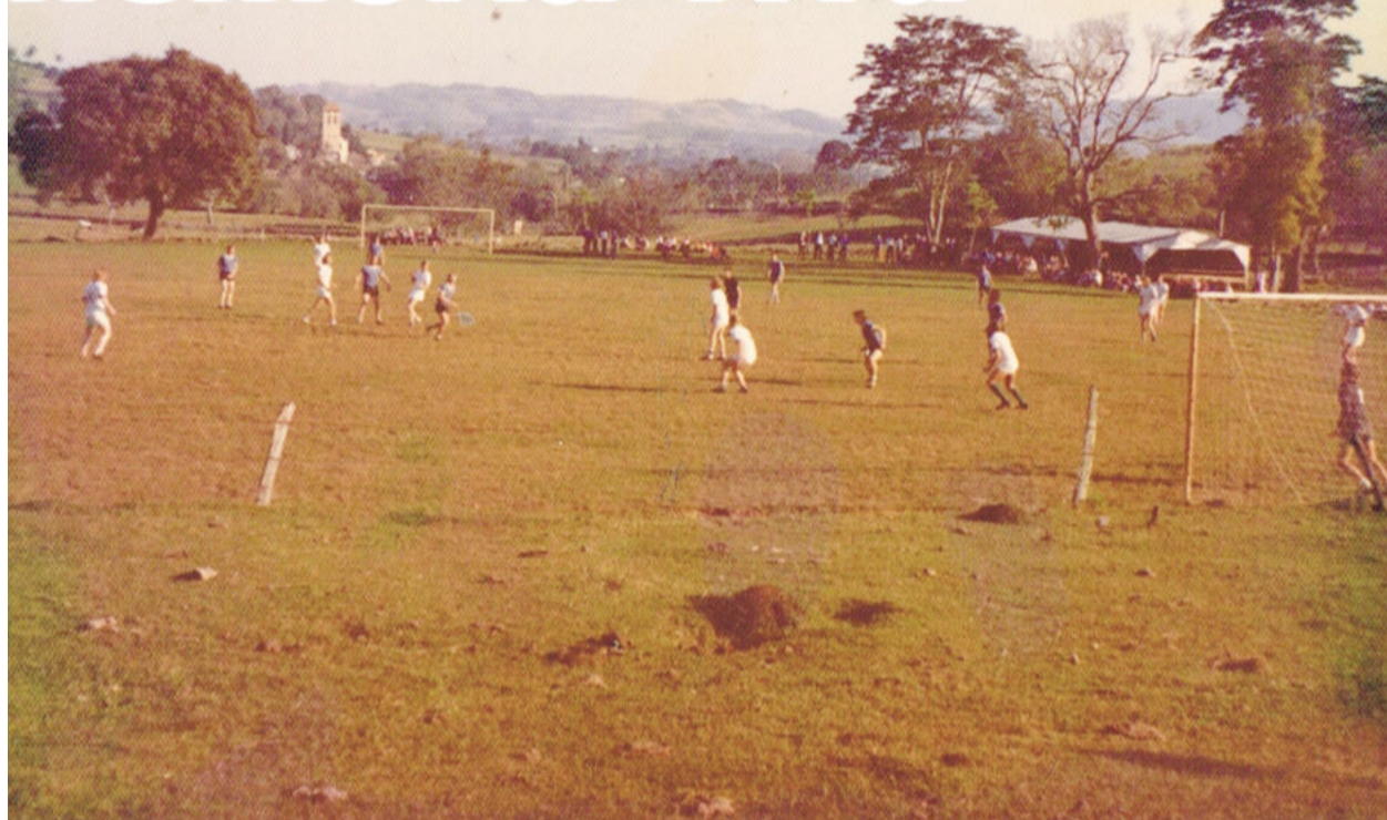
Praça Esportiva do Bandeirantes, em Linha Frank, foi inaugurada em setembro de 1969

nense de Linha Schmidt; 4º lugar, Palmeiras de Linha Paissandu.