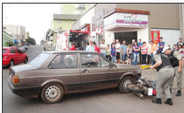
Colisão envolveu um Voyage e uma motocicleta

O motociclista foi encaminhado com lesões leves pelo Samu para atendimento no Hospital Ouro Branco. Esse foi o 114º acidente em 102 dias deste ano no perímetro urbano de Teutônia, conforme contagem da Brigada Militar.