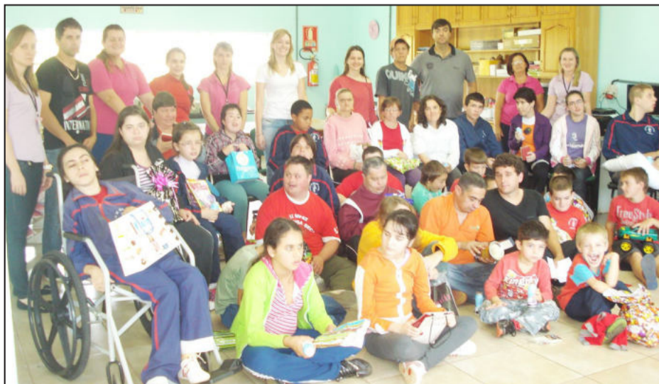
Voluntários do projeto com os estudantes da Apae