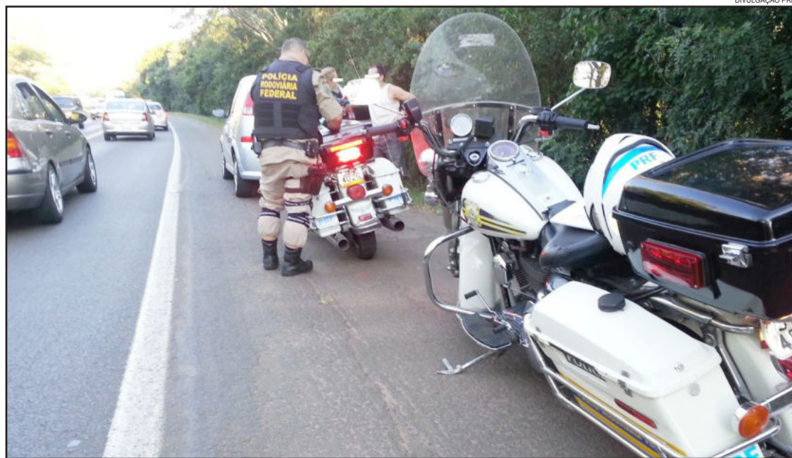
Na BR-386, foram 4.460 infrações registradas pela PRF no feriado de Páscoa

Se o condutor for flagrado dirigindo 20% acima do permitido para a via, ele está incorrendo em uma infra-