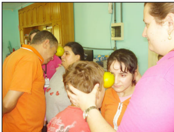
Um dia especial de atividades foi realizado

“Elaboramos várias brincadeiras, fizemos uma mini gincana, na qual no final todos saíam vencedores”, explica Aline. Os