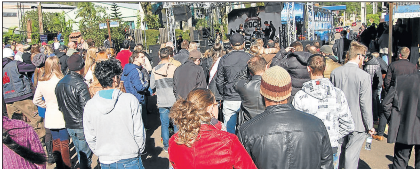
Evento, que ocorre em sua quarta edição, já é tradicional em Imigrante, reunindo pessoas de toda a região

Nos dias 15 e 16 de julho, a Praça Municipal Henrique Brückner, no Centro de Imigrante, será palco da quarta edição do Dia Mundial do Rock. O festival contará com a participação de treze bandas, além de encontro de motos e carros antigos. O in-