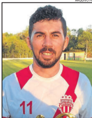
Kiki tem 15 gols no campeonato

Nos Aspirantes, o Gaúcho goleou o Flamengo da Germano por 5 a 0, enquanto que Saidera e Ribeiense empataram por 1 a 1, também na primeira semifinal do Amador de Teutônia.