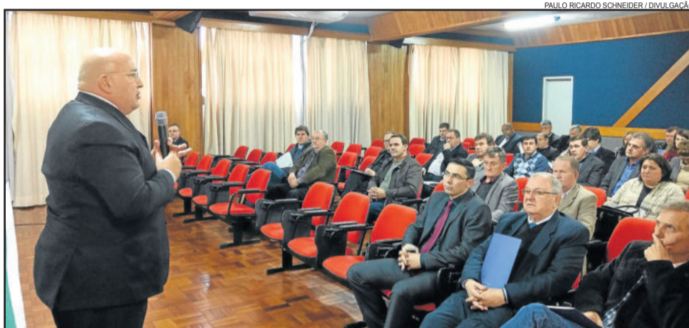
Vice-presidente financeiro da Fecomércio falou sobre prejuízos com a pirataria

"Precisamos reagir contra isto. Não somos contra a importação, mas deve haver um equilíbrio", acrescentou. Os participantes lembraram que no ano passado, em função da importação, houve uma queda no preço do leite em R$ 0,40 em apenas dois meses. Citaram que o projeto