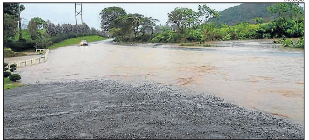
Após período de chuva, situação da rodovia é ainda pior