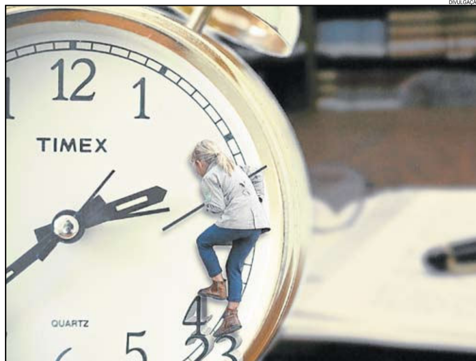
Carlos Barbosa não teve nenhum registro de trabalho infantil em 2017

Em nível de Brasil, o ano de 2000 registrou 3,9 milhões de crianças e adolescentes, entre 10 a 17 anos, ocupadas. Já em 2010, eram 3,4 milhões. Pelos dados referentes a 2001 em nível de Brasil, o IBGE constatou 4,4 milhões de crianças e adolescentes, entre 5 e 17 anos, que não frequentavam a escola, e dos quais 1,081 milhão tinha ocupação e outros 3,34 milhões não tinham ocupação.