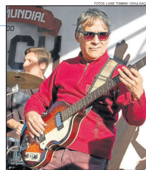
Público pode conferir shows de rock

O 4º Dia Mundial do Rock será realizado pela Associação Cultural de Imigrante e conta com o patrocínio Master do Município de Imigrante, patrocínio Ouro de Sicedi, patrocínio Prata da Salva Craft Beer, e patrocínio Bronze das Lojas Benoit.