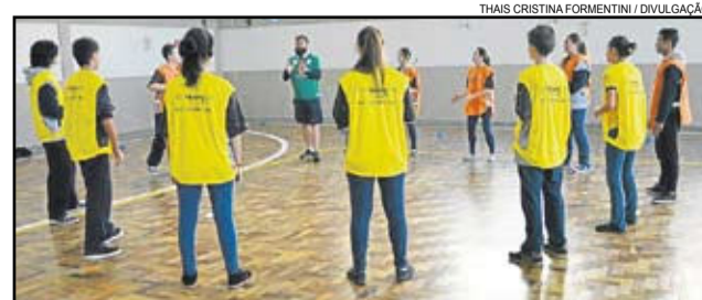
Torneio acontece no dia 9 de julho