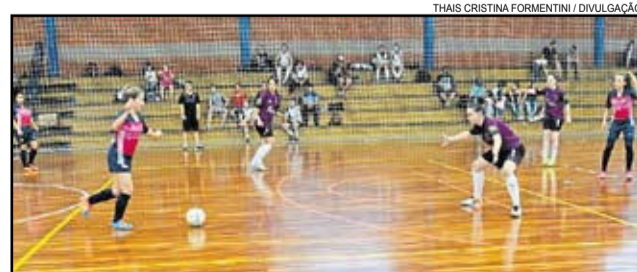
Torneio acontece no dia 9 de julho

Premiação - Campeãs, Vice-campeãs e 3ª Colocadas: Troféu, 11 medalhas e 10 ingressos para o FestiQueijo 2017; Artileira e Goleira menos vazada (entre as 04 finalistas): Troféu e ingresso para o FestiQueijo 2017.