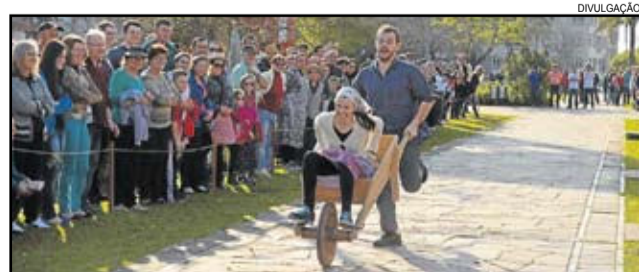
Competição integra o FestiQueijo

Em caso de condições climáticas desfavoráveis, o evento será transferido para o dia 23 de julho.