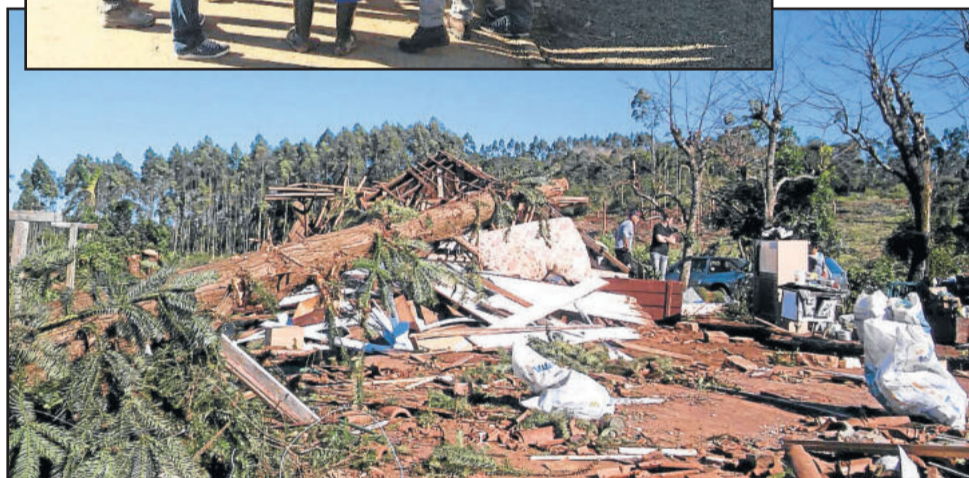
Temporal/tornado atingiu várias residências em Maratá

Semana passada, um grupo teuto-niense se organizou para auxiliar os atingidos