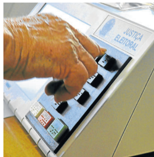
Recomendação é não deixar para a última hora

Em caso de dúvida, confira o título: os eleitores já cadastrados têm a inscrição “Identificação Biométrica” no documento. Eleitores que não têm mais a obrigatoriedade do voto também precisam realizar o procedimento, uma vez que não fazê-lo pode implicar em cancelamento do título e consequentemente do CPF. O Cartório Eleitoral está localizado na Avenida 1 Leste, em frente à Câmara de Vereadores, e funciona de segunda-feira a sexta-feira das 10h às 17h, sem fechar ao meio-dia.