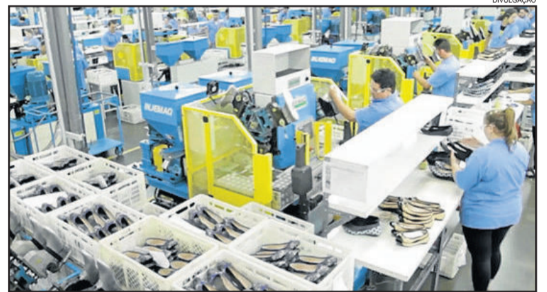
Incentivo é importante para a continuidade do setor calçadista

Segundo o presidente, a guerra fiscal entre os Estados só prejudica o Rio Grande do Sul. “O custo de produzir no Rio Grande do Sul é maior devido