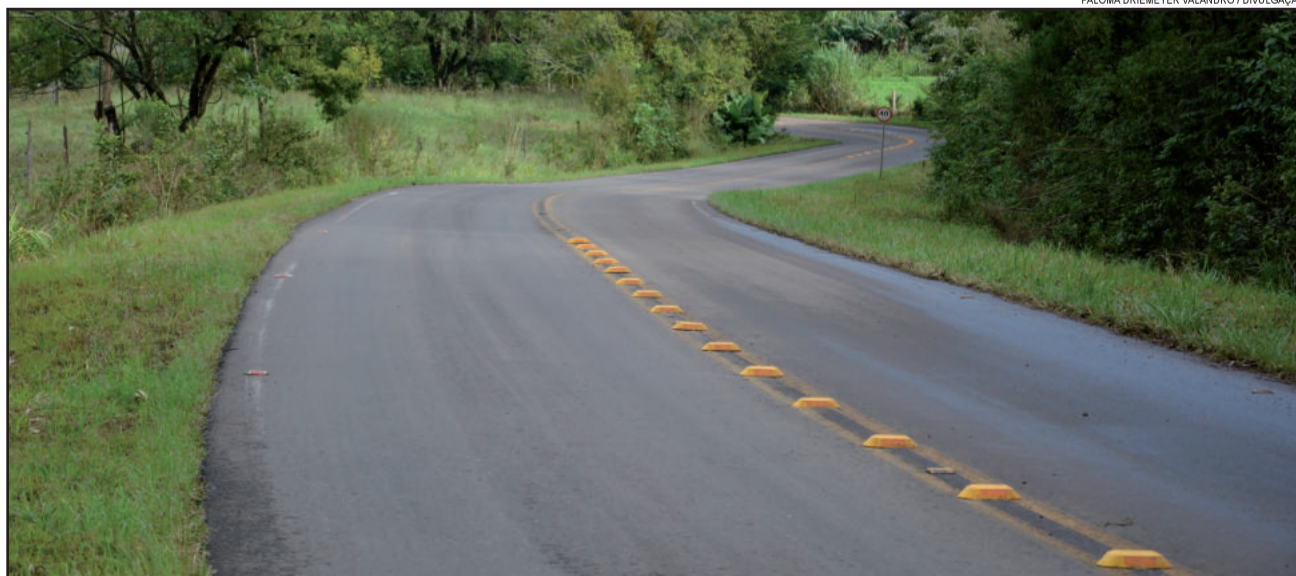
PALOMA DRIEMEYER VALANDRO / DIVULGAÇÃO