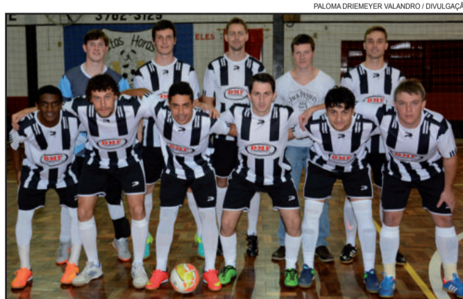
Real Madrid, categoria Força Livre

Na próxima sexta-feira, dia 14 de julho, acontece a segunda rodada da competição, tendo por local o Ginásio Municipal de Linha Paisandu, a partir das 19h30min. A oitava edição do Campeonato Municipal de Futsal é uma realização da Administração Municipal de Westfália, por meio da Secretaria de Educação, Cultura, Turismo e Desporto (SMEC), em parceria com o SESC Farroupilha.