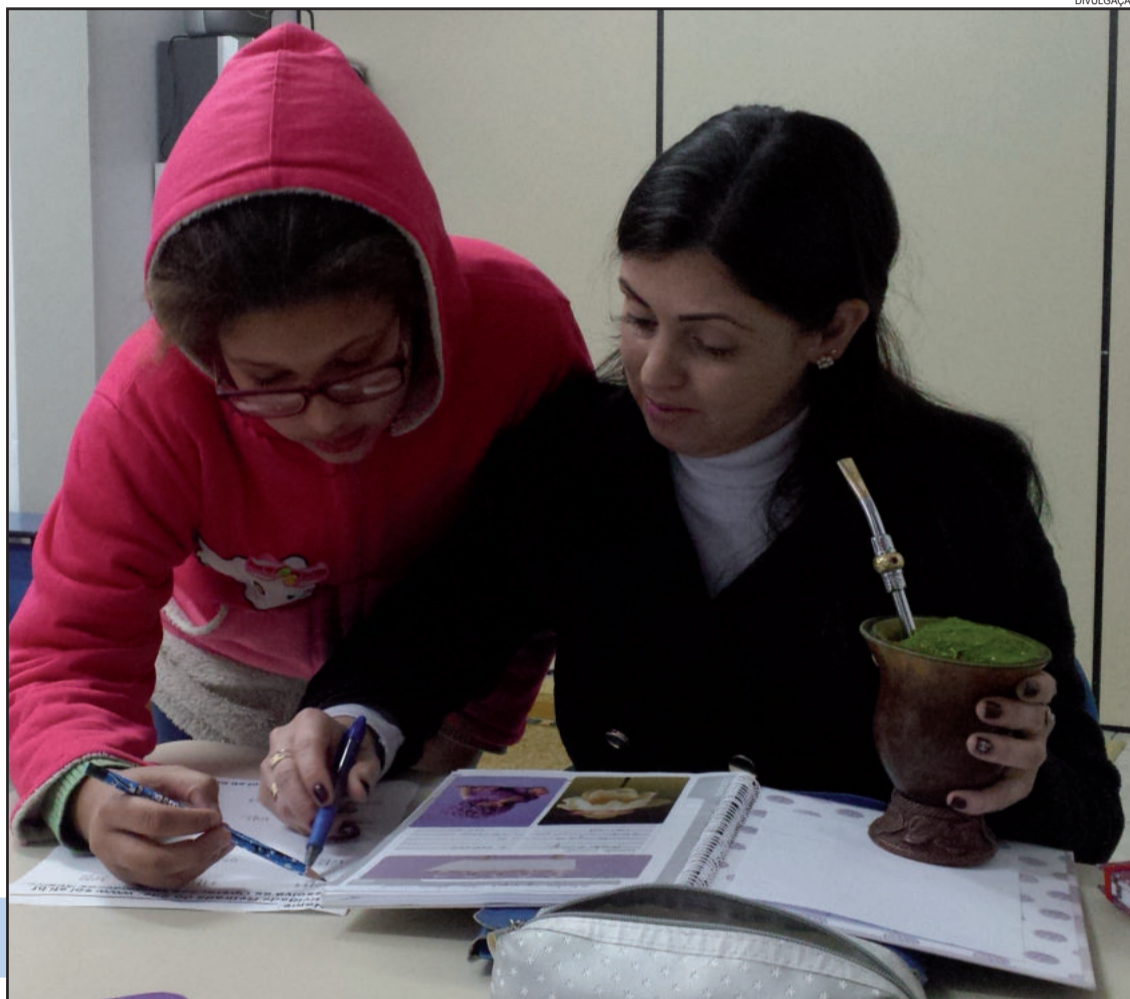
Aulas de reforço são ministradas na biblioteca

As turmas de reforço são definidas com base no desempenho escolar que apresentam em salas de aula, sendo os alunos encaminhados através de suas escolas. O reforço é dinâmico, interativo e, trabalhado coletivamente, reformulando atividades e construindo novos meios que levem os alunos a aumentar a autoestima e a “descobrir” suas habilidades e possibilidades.