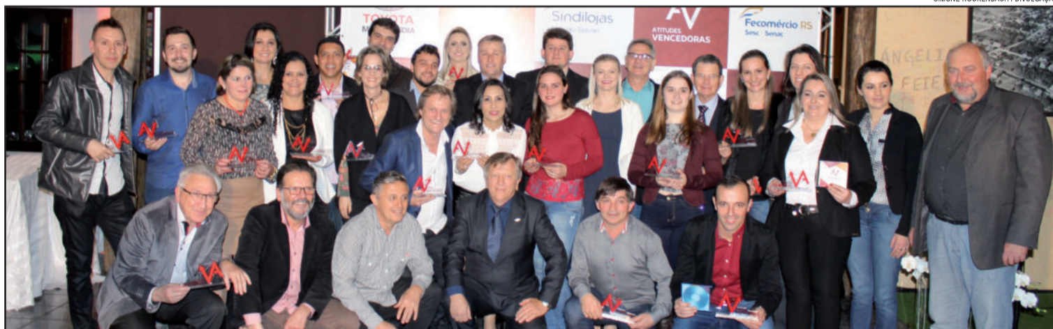
Vencedores foram premiados por autoridades e membros da diretoria do Sindilojas-VT