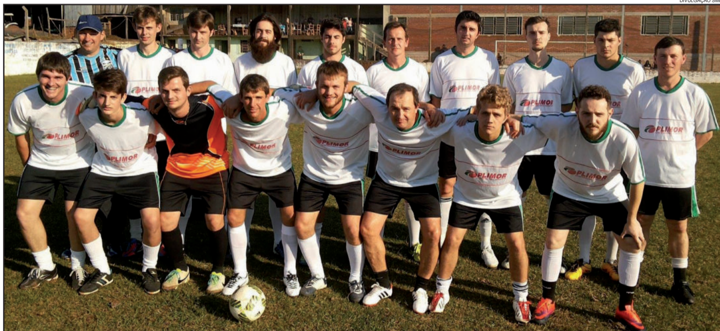
Elenco do Novo Paraíso perdeu jogo em casa e a chance de seguir na briga pelo título