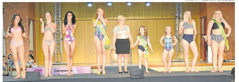
Ao final de seu momento, cada loja realizou um desfile coletivo de sua coleção