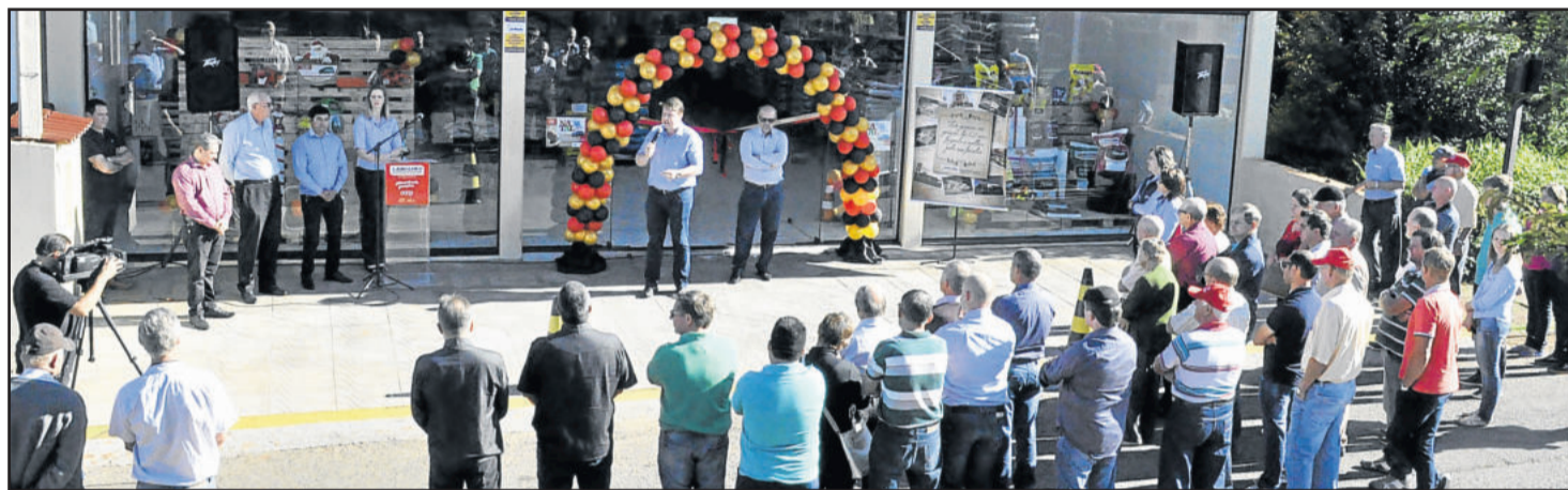
À loja do Agrocenter do Bairro Canabarro foi anexada uma sala comercial onde antes funcionava um bazar

Ao meio-dia, a programação de aniversário retornou a Teutônia, quando foi servido o tradicional almoço de confraternização, na Associação dos Funcionários da Languiru. Na ocasião, ainda, houve apresentação do Conjunto Instrumental do Colégio Teutônia.