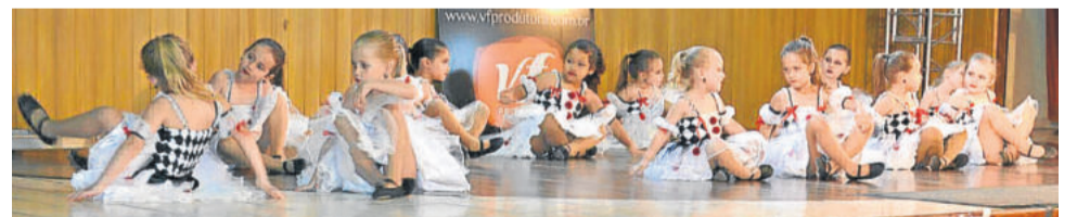
Movimentu's apresentou nove coreografias