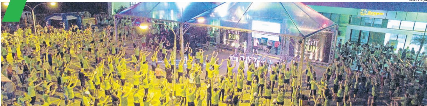
3ª edição da corrida e caminhada noturna tem 2 mil participantes inscritos e será sábado, dia 18. Confira o trajeto que será percorrido pelos atletas. TEUTÔNIA > 19