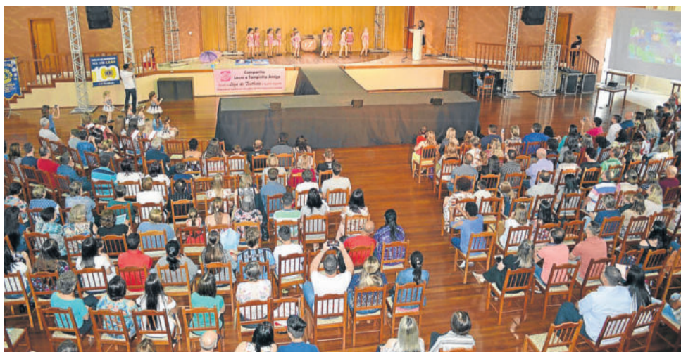
Grupo de Danças Movimentu's em cena