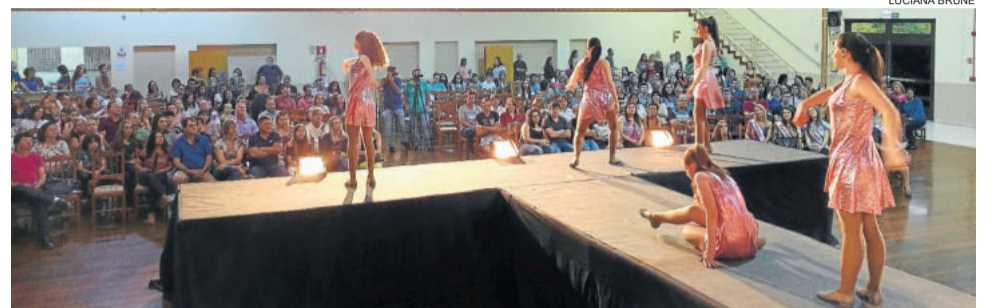
Movimentu's brilhando no palco do Fashion Day

uma desfile de modas das lojas participantes, de forma intercalada, fazendo assim uma junção entre moda e passarela com arte e palco.