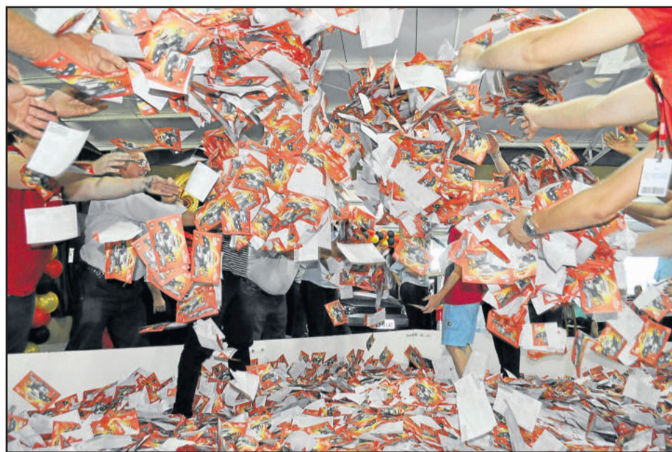
Durante a programação de aniversário, foi feito o primeiro sorteio da Temporada de Prêmios

O próximo sorteio ocorre no dia 27 de dezembro, no Supermercado Languiru do Bairro Languiru. Na oportunidade, serão sorteados um novo Voyage Trendline, uma moto CG 160 Start, um iPhone 7, um vale-compras de R$ 1.000,00, dois vale-compras de R$ 750,00, dois vale-compras de R$ 500,00 e dois vale-compras de R$ 250,00. Cada R$ 70,00 em compras nos Supermercados Languiru, lojas Agrocenter Languiru e na Fábrica de Rações (somente pessoa física) dão direito a um cupom.