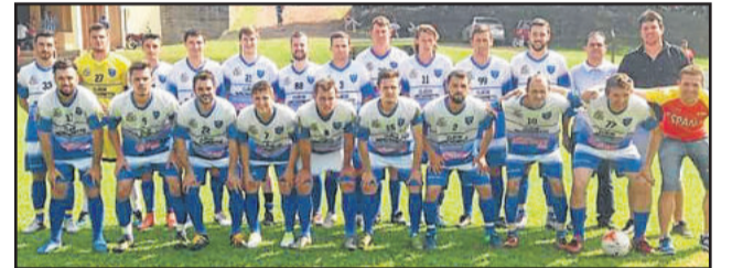
Independente é o campeão da Copa Diamaju