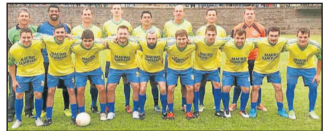
São José A ficou vice-campeão da Copa Diamaju