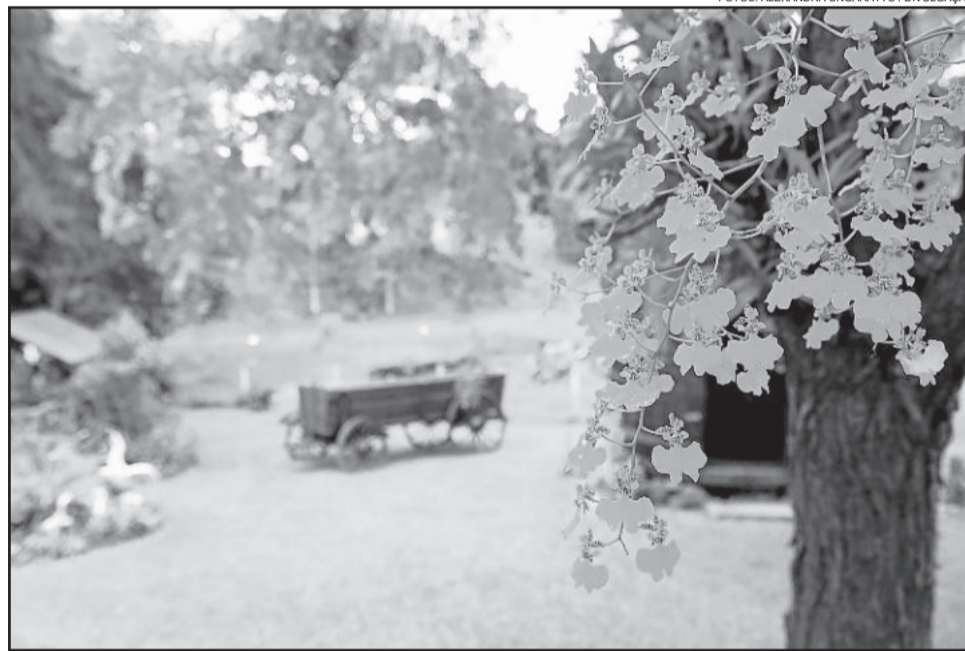
Evento será recebido pela pela Vaccaro Vinhos e Espumantes