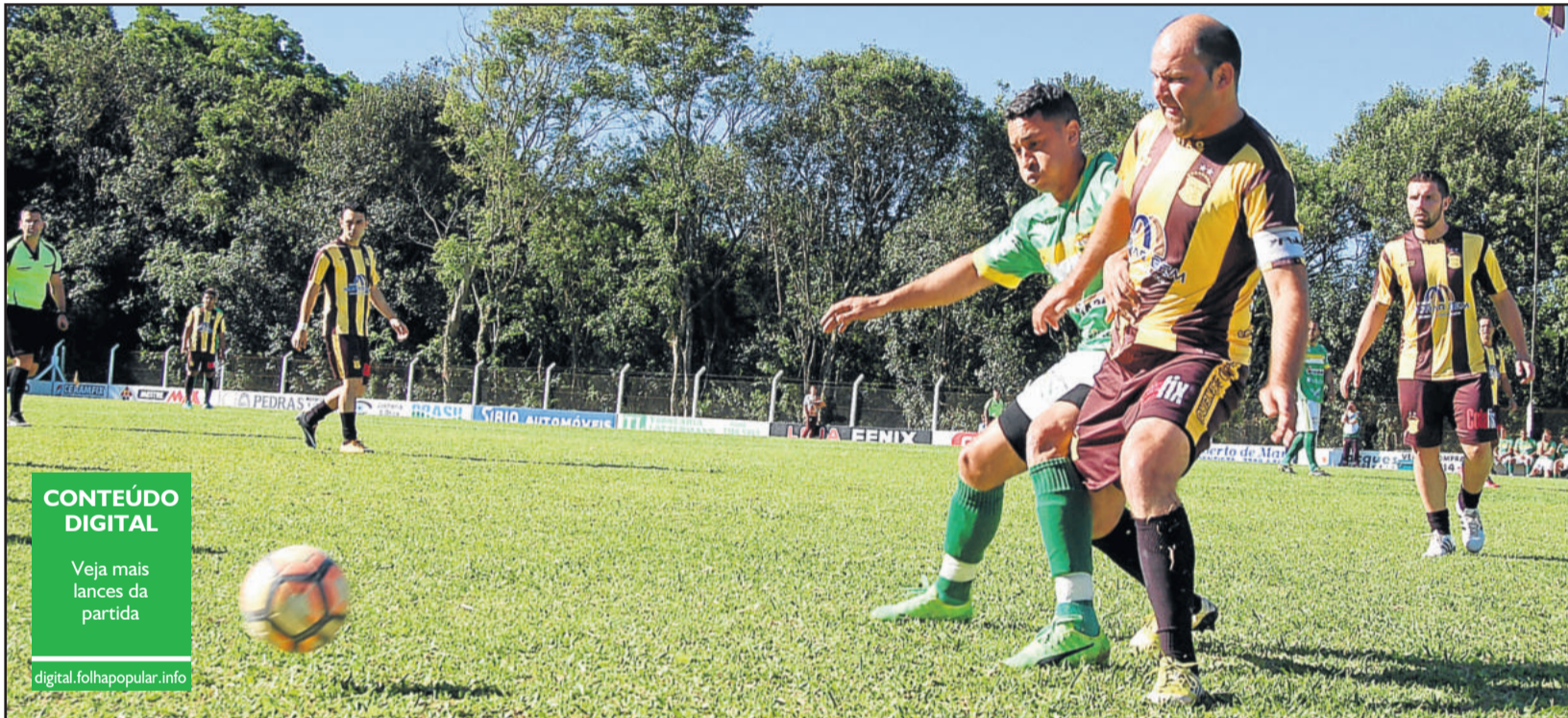
Jogo entre União Carneiros e Palanque foi muito disputado