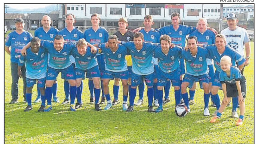
Assespe terá a vantagem de jogar por dois empates na final