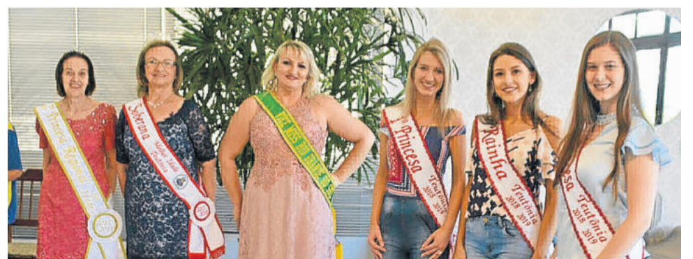
Soberanas e miss receberam o público