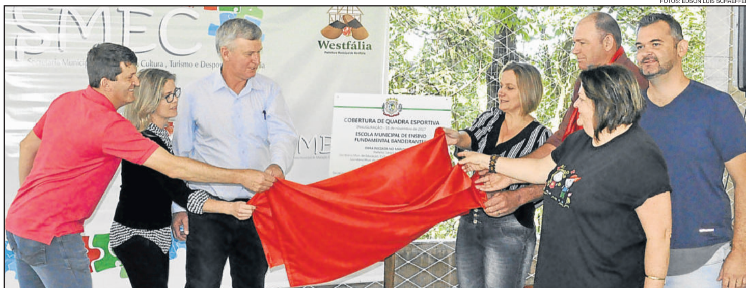
Inauguração da quadra coberta ocorreu na manhã de sábado