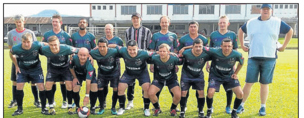
Gaúcho eliminou o time de melhor campanha e deve fazer o primeiro jogo da final em casa