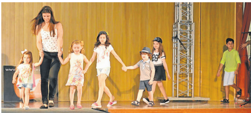
Muitas tendências para todas as idades foram apresentadas na passarela