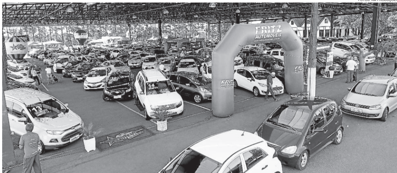
Feirão reuniu vendas no Pavilhão Multiuso da Prefeitura

As vendas participantes neste ano foram: Fritz Automóveis, Sérgio Veículos, Strada Veículos, Centro Automóveis, Esquina Center Veículos, Viévi Automóveis, Schaefer Automóveis e Betiolo Novos e Seminovos. O evento é organizado pelas vendas em parceria com a Câmara de Indústria Comércio e Serviços (CIC) de Teutônia, com apoio do Município de Teutônia.