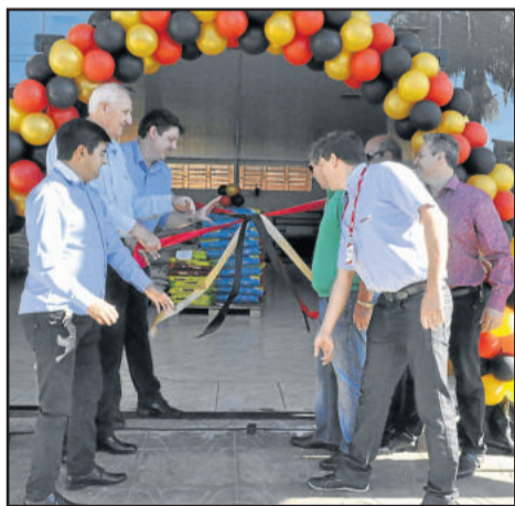
Ampliação do Agrocenter do Bairro Canabarro foi uma das inaugurações

A partir das 10h30min, a programação seguiu em Arroio do Meio, onde foi inaugurada mais uma unidade da loja Agrocenter Languiru, no centro da cidade. Em seguida, ocorreu a inauguração do Supermercado Languiru, também em Arroio do Meio, que passa a contar com novo espaço, como o Café Languiru.