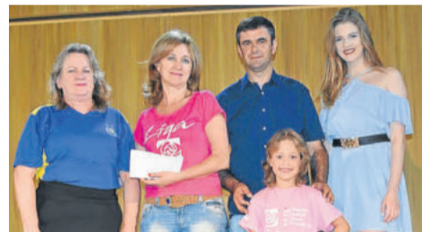
Entrega simbólica da doação à Liga Feminina