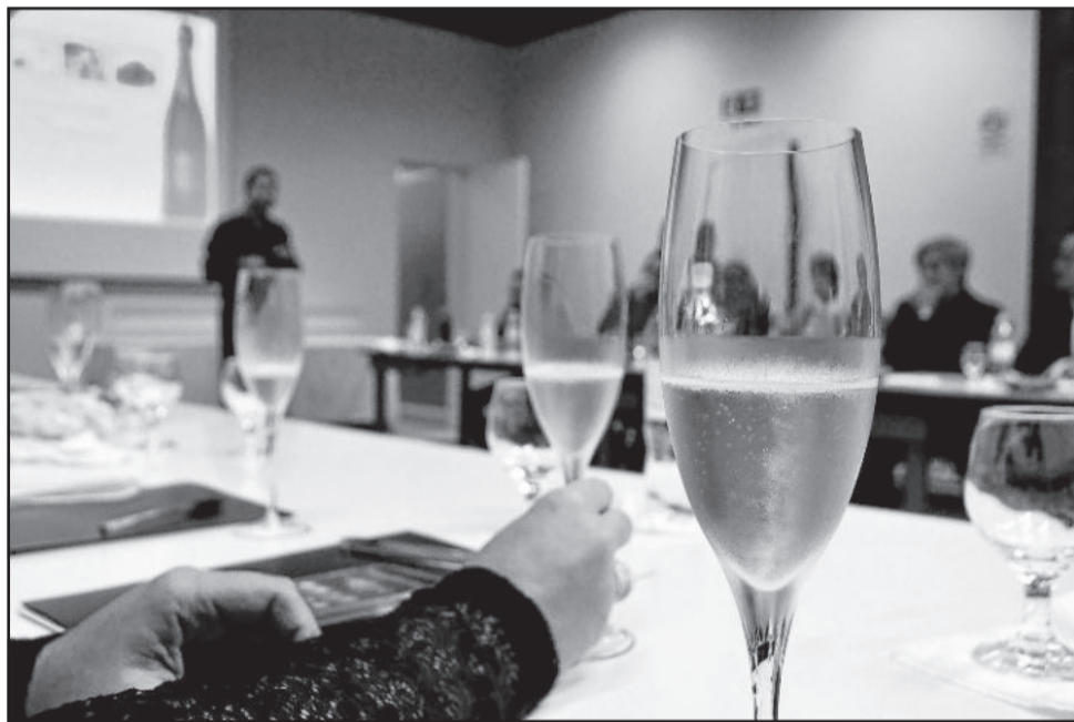
A Confraria do Espumante foi idealizada em 2013 pela Prefeitura de Garibaldi