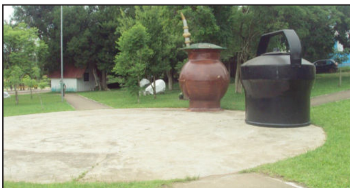
Cuia e chaleira estão em novo local

beleza, é necessário que todos cuidem e fiscalizem. “Tudo que é investido no nosso município é através dos impostos e é patrimônio público. Quem tiver sugestões de melhorias, pode entrar em contato com o Gabinete da Primeira-Dama. Da mesma forma agradecemos a colaboração, carinho e comprometimento de todos, para que nossa Paverama se torne cada vez mais bela”, destaca.