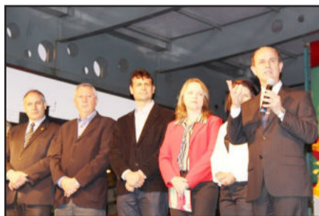
Prefeito destacou importancia do período