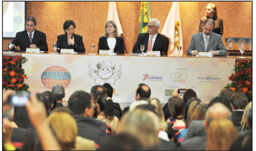
Prêmio foi entregue em Brasília

Qualidade da merenda é destacada pelos estudantes nas pesquisas anuais de satisfação