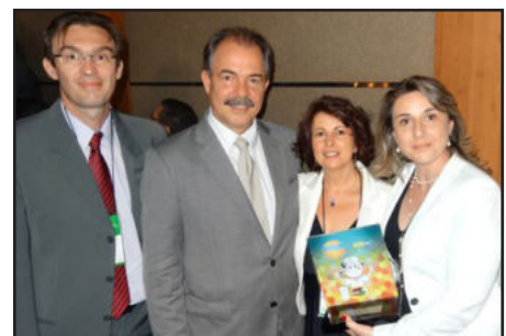
Representantes de Teutônia com o ministro Aloizio Mercadante

Neste ano, 26 municípios em todo o Brasil receberam o Prêmio, que é dividido em categorias de premiação regionais e são elas: Eficiência e Educação Alimentar e Nutricional, Valorização Profissional das Merendeiras, Participação Social, Merenda Indígena e/ou Quilombola, Valorização da Agricultura Familiar. Além destas categorias regionalizadas, serão premiados também municípios brasileiros que utilizam produtos orgânicos e/ou da sociobiodiversidade na alimentação escolar.