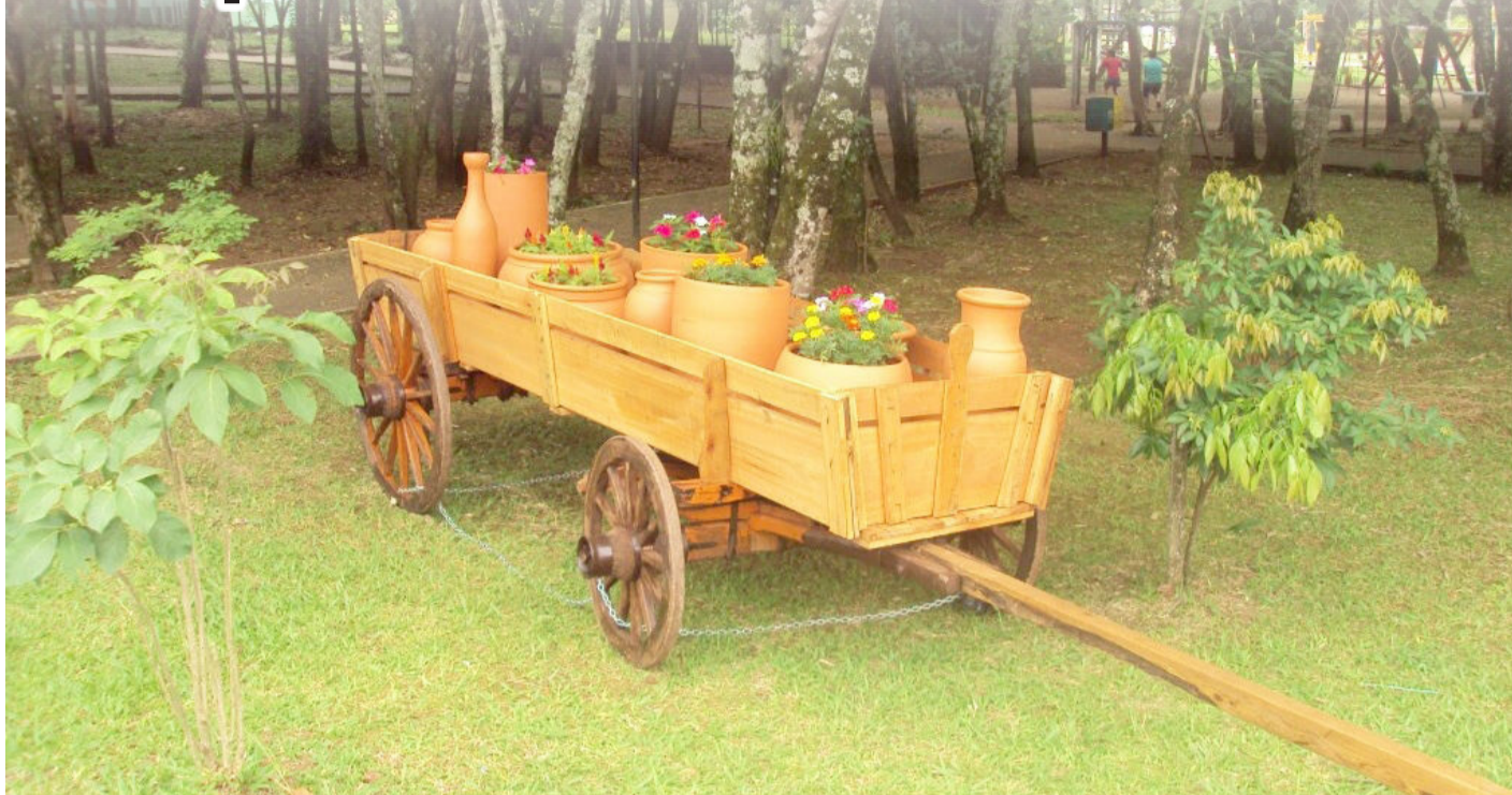
Uma das carroças doadas está no Parque

O Parque 13 de abril está passando por diversas remodelações, que estão sendo feitas pelo Gabinete da Primeira-Dama. Nas duas entradas principais, foram retirados os postes de madeira que sustentavam flores com espinhos, que estavam em estado precário, podendo ocasionar quedas e machucar quem passasse por ali. No local, foram construídos novos canteiros