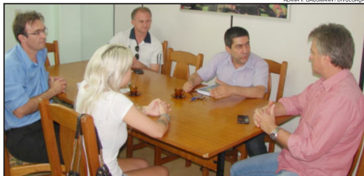
Em reunião com a APANTE, foi definido o auxílio

Os recursos servem para a manutenção das atividades da entidade, principalmente para a castração e tratamento de animais abandonados até sua doação. O projeto de Lei está em fase de elaboração e será encaminhado para a sessão da Câmara de Vereadores no dia 19 de dezembro.