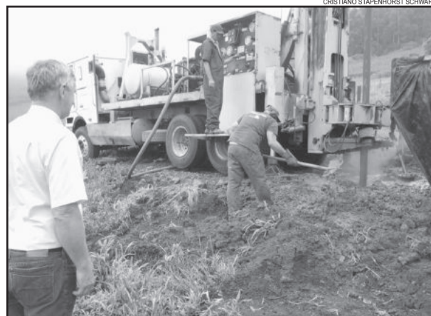
Landmeier acompanhou perfuração na Picada Horst

A parceria consiste na cedência por parte do Estado de caminhões específicos: perfuratriz, carregamento de canos e bomba d'água além dos profissionais da área. Ao Município compete o pagamento das diárias dos funcionários, alojamento e alimentação. A Administração Municipal também está colaborando com o apoio de um funcionário público e de retroescavadeira. A localização dos poços foi elaborado por geólogo levando em conta o melhor ponto para captação de água subterrânea.