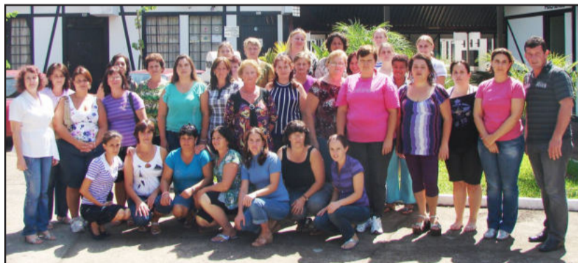
Profissionais que atuam na alimentação escolar recebem treinamento constante

Os municípios de todo o Brasil se inscrevem de forma voluntária, respondendo a um formulário de avaliação com diversas perguntas.