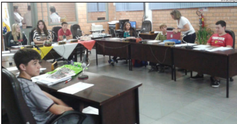
Câmara Mirim realizou o último encontro