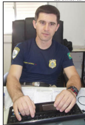
Comandante lembra que o objetivo da PRF não é multar e sim reduzir o número de acidentes na rodovia