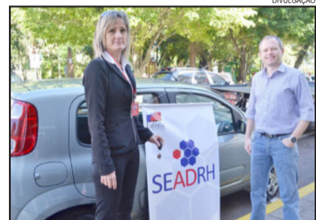
Veículo adquirido com redução de custos

Lagemann diz que será realizado nos próximos dias o leilão de sucatas que estavam na antiga-Polar por vários anos e que, aos poucos, está promovendo a renovação da frota. "Enviamos projeto ao Governo Federal para aquisição do Kit do Conselho Tutelar, que prevê entrega de veículo e equipamentos", conclui.