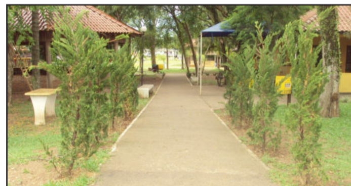
Entrada principal foi remodelada