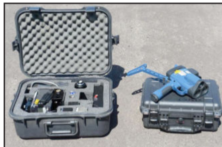
Novo equipamento chegou à PRF

Será testado também pela PRF um bafômetro que não necessita que o motorista assopre para registrar se ele está ou não embriagado. Somente ao falar perto do equipamento já será possível saber se o condutor ingeriu bebida alcoólica.