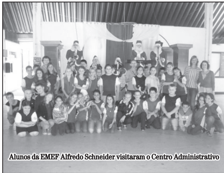
Alunos da EMEF Alfredo Schneider visitaram o Centro Administrativo