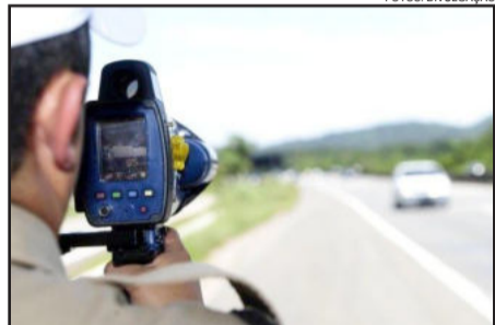
Câmera de longo alcance permite melhor controle da velocidade