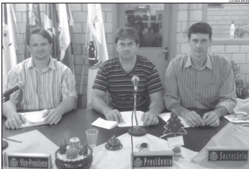
Mesa diretora 2014

A Câmara de Vereadores estará em recesso até o mês de fevereiro de 2014, mês em que serão realizadas duas sessões ordinárias, a exemplo do que acontece em dezembro.