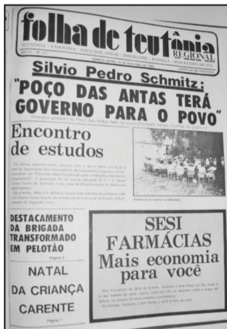
Ortografia mantida conforme edição da época

Para o seu Natal ser mais feliz, participe da campanha Natal da Criança Carente.