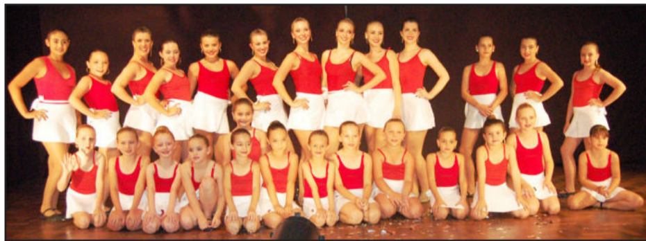
Grupo de Danças Movimentu's

O Grupo de Danças Movimentus realizou seu show anual na noite de quarta-feira, dia 11 de dezembro, no auditório do Colégio Teutônia. Dependências lotadas para assistir a graciosidade de bailarinas de diferentes idades, num espetáculo com 14 coreografias, criadas em ritmos diversos. O grupo é formado hoje por 27 bailarinas, das categorias infantil (a partir dos 4 anos) até a categoria adulta.