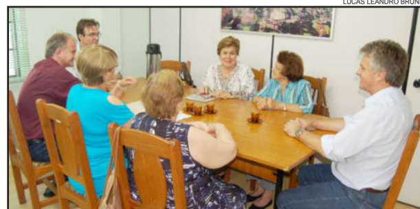
Reunião com o Clube de Mães Lar da Amizade

No documento, a entidade também manifestou a apreensão para solucionar impasses quanto a: um terreno na Rua Helmut Hemann; e da área na Rua Alfredo Closs, utilizada como horta e pomar da Escola de Educação Infantil Cirandinha.