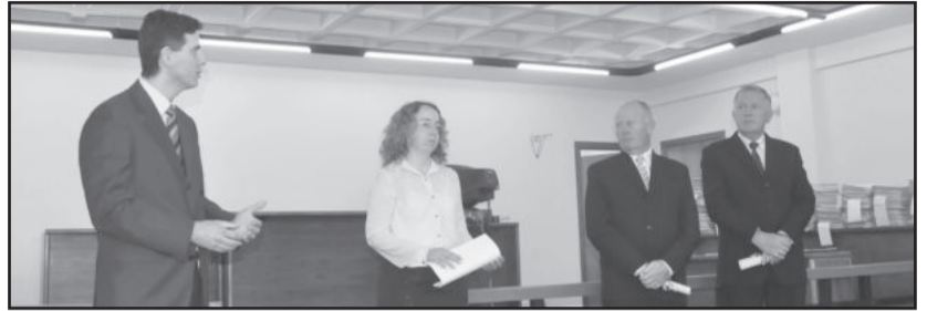
Solenidade de diplomação ocorreu no Fórum de Estrela