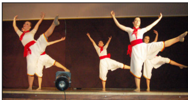
Ritmo gauchesco também fez parte do espetáculo