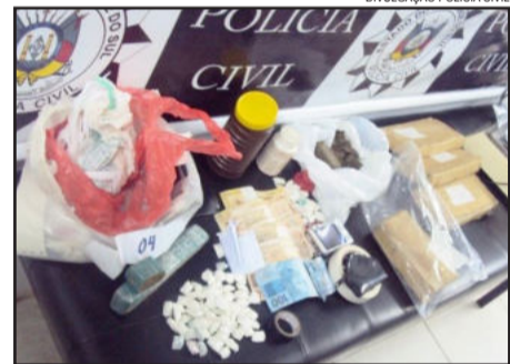
Drogas foram apreendidas nesta quinta-feira