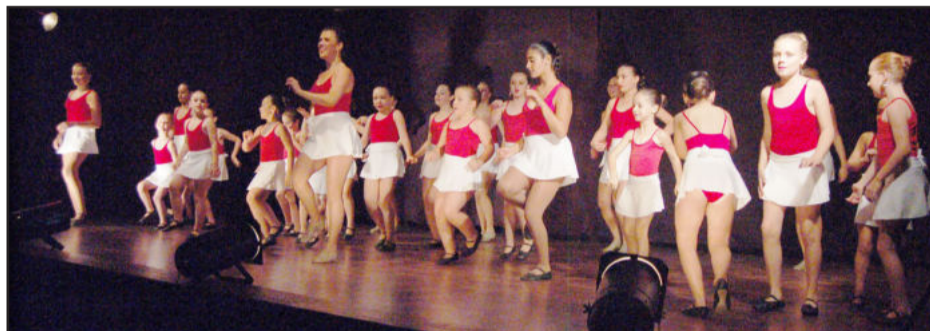
Apresentação coletiva do Grupo

“A Dança é minha Vida, é minha essência! Fazer a cada ano um espetáculo diferente e cheio de imaginação é o meu objetivo para o Movimentu's. Fazer a plateia vibrar com os batimentos pulsionados pelos corações de minhas bailarinas, é o melhor sentimento que uma coreógrafa pode ter. E isso senti na noite deste show, a conexão entre o que eu coreógrafa penso, o que minhas bailarinas expressam e o que a plateia sente. Pensar, expressar e sentir, tudo conectado e envolvido num mesmo olhar, num mesmo ritmo, numa mesma forma”, explica a professora, emocionada ao assistir as apresentações de suas alunas.