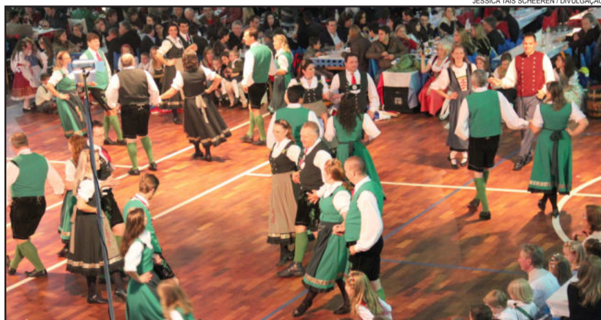
Grupos Folclóricos retratam meio século