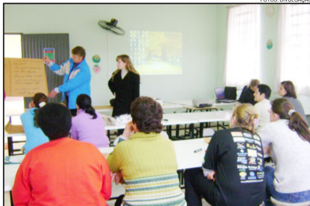
Profissionais que atuam na alimentação escolar recebem treinamento constante