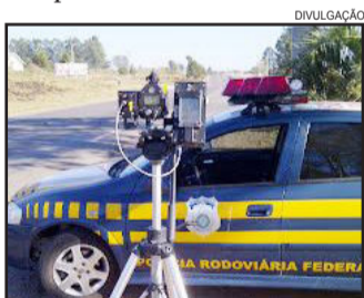
Em apenas 4 horas PRF flagrou mais de 600 condutores com o modelo anterior de radar fotográfico

O condutor que for flagrado acima da velocidade permitida para a via em até 20% está sujeito a uma infração média com multa de R$ 85,13 e 4 pontos no prontuário (CNH). Já o condutor que for pego dirigindo acima da velocidade entre 20% e 50% estará incorrendo em uma infração grave, sujeito a multa de R$ 127,69 e 5 pontos no prontuário do condutor. Já o motorista que desrespeitar a velocidade permitida para a via em mais de 50% e