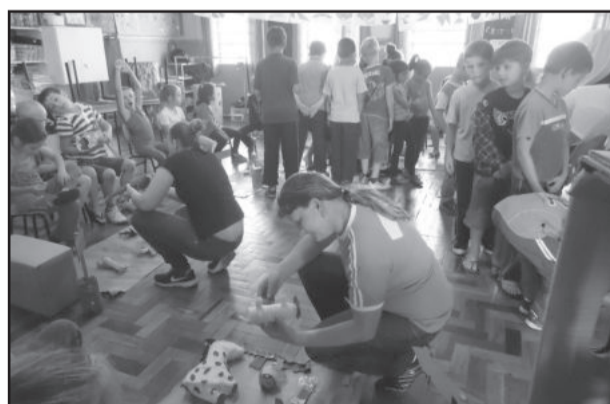
Alunos da EMEF Leopoldo Klepker estudaram, confeccionaram e apresentaram animais para os familiares

A visitação ao Jardim Zoológico de Sapucaia do Sul, juntamente com as turmas do 1º, 2º e 3º ano B, aconteceu no mês de outubro e foi uma experiência inesquecível. O entusiasmo dos alunos evidenciou-se na solicitação de realizarem novamente o passeio. Todos os alunos receberam um DVD com registros do passeio.