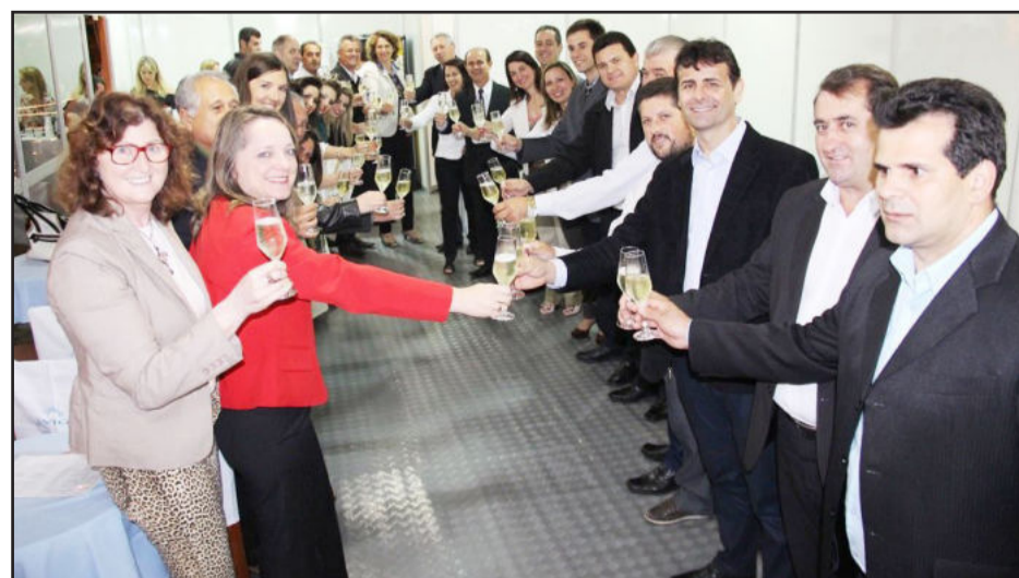
Parceiros e comunidade brindaram a chegada de mais um Natal Borbulhante