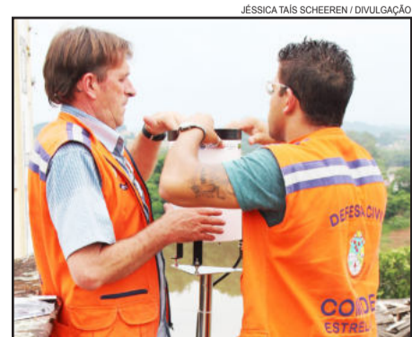
Pluviômetros foram instalados permitirão maior precisão nas informações

Os equipamentos somam-se as régua eletrônicas instaladas em Estrela, Marques de Souza, Muçum, Encantado e Veranópolis, para o monitoramento das águas.