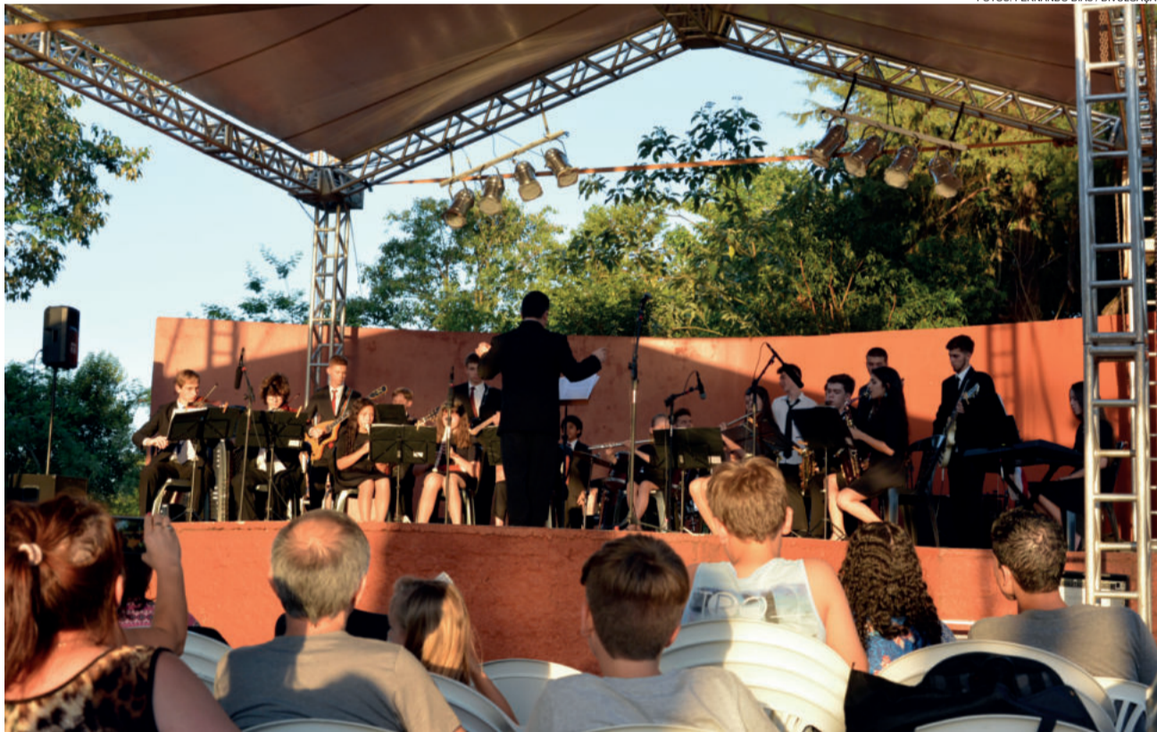
Orquestra do Martin Luther