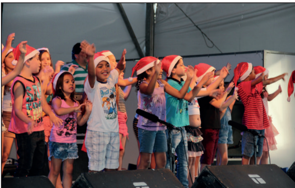
Natal Encantado já emocionou pais e comunidade em 2016