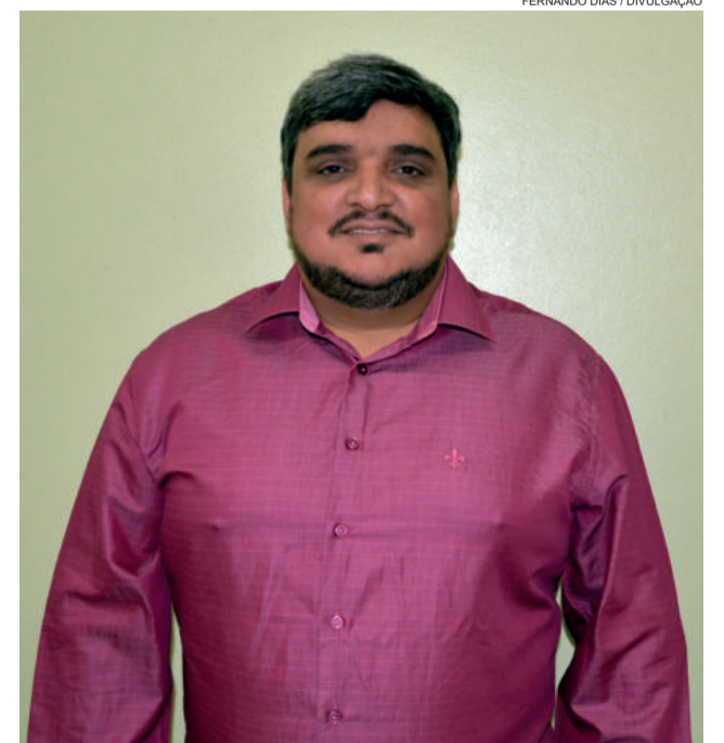
Secretário Tego confirmou dia 17 o carnaval em Bom Retiro