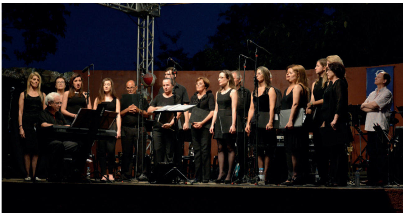
Coral Municipal de Encantado