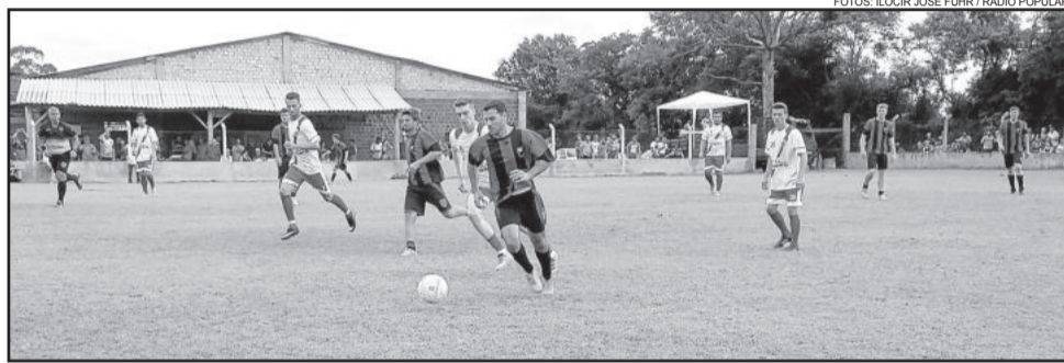
Flamengo (com a bola) e Atlético Gaúcho se entretaram na Linha Germano