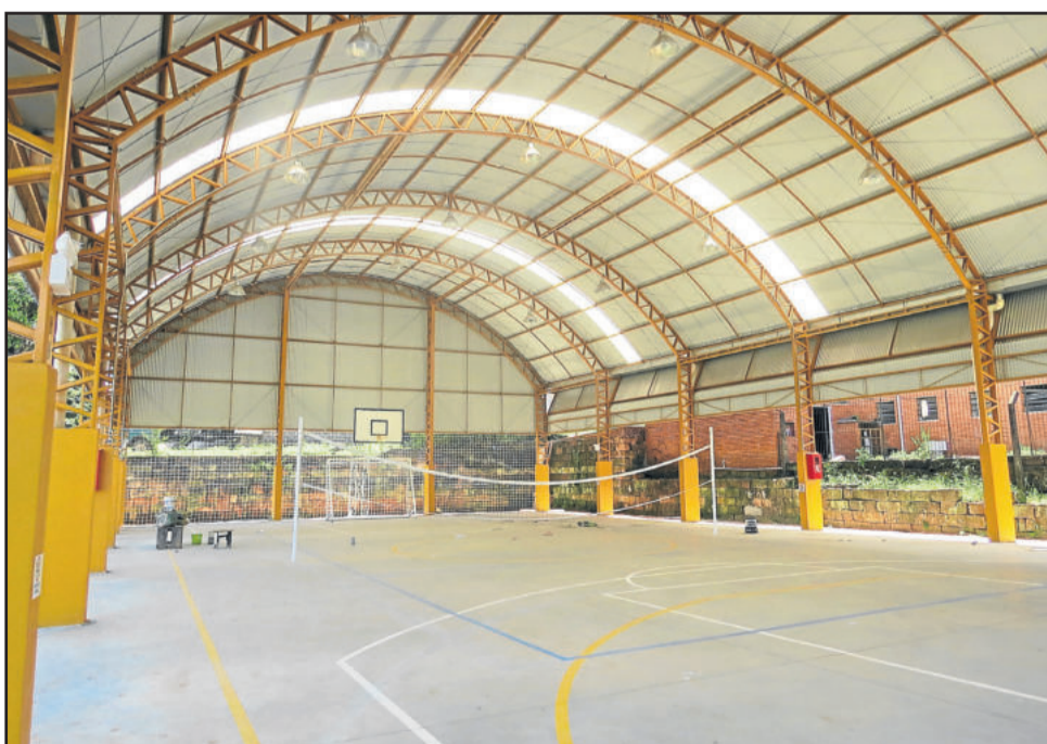
Quadra recebe os ajustes finais para ser entregue à comunidade

FEVEREIRO 24, 25 E 26 Bairro Daltro Filho