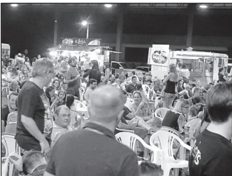
Praça de alimentação ficou lotada todos os dias, a exemplo de sábado à noite