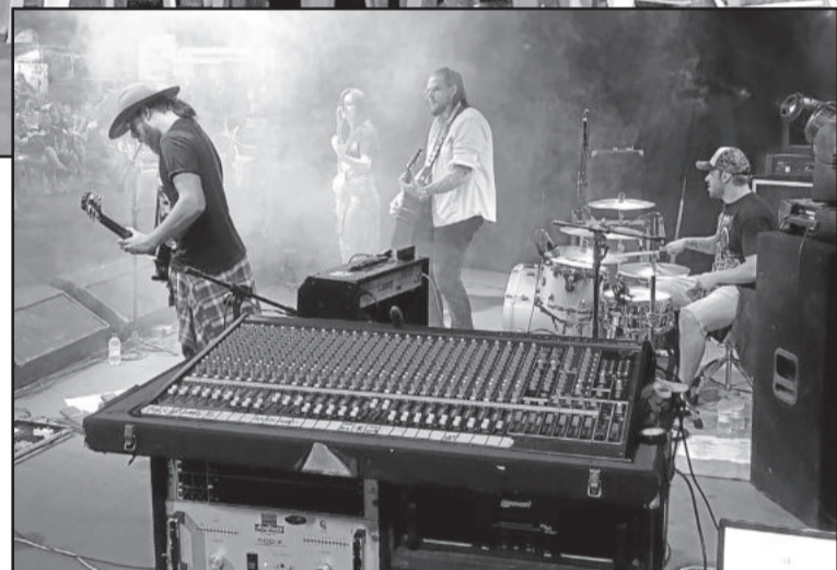
Atrações musicais também fizeram parte do evento

No aspecto turístico, a comissão organizadora percebeu e observou várias pessoas de fora, como Lajeado, Estrela, Encantado, Caxias do Sul. “Diria que superou os objetivos, porque no domingo alguns food trucks já não tinham mais todos os lanches, pois venderam a mais do projetado pelo tamanho da cidade. Inclusive, venderam mais do que em eventos