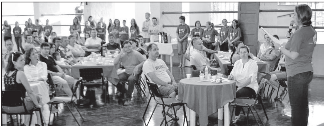
No dia 10 de fevereiro ocorreu o tradicional café da manhã para pais e estudantes novos, com apresentação institucional e do corpo docente