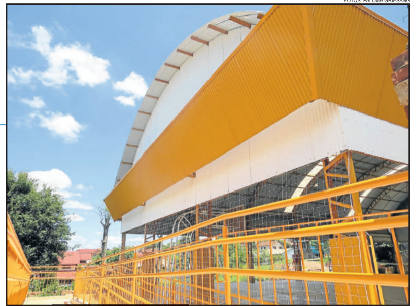
Depois de quase 20 anos, quadra coberta está quase pronta para uso