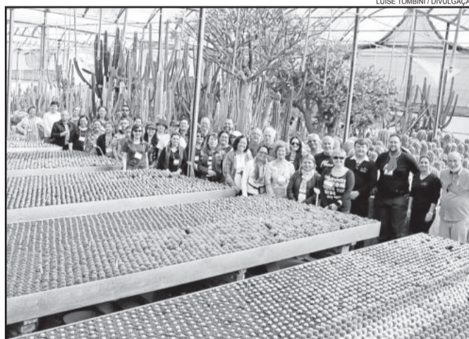
Grupo de agentes que participou da Fimtur em agosto de 2016

Pela quarta vez, o Município de Imigrante, no Vale do Taquari, será um dos destinos da Fimtur Business, evento de workshop e visitas técnicas voltado para agentes de viagens. Cerca de 60 agentes estarão visitando o município nesta sexta-feira, dia 17 de fevereiro.