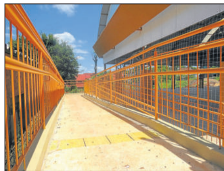
Estrutura conta com acessibilidade