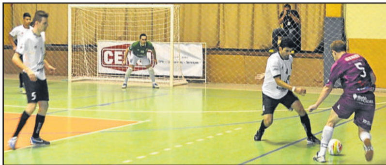
BGF de Silon Júnior (5) estreou com vitória diante da ASTF