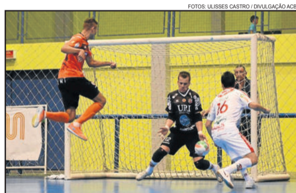
Contra o Atlântico, ACBF foi impiedosa e goleou