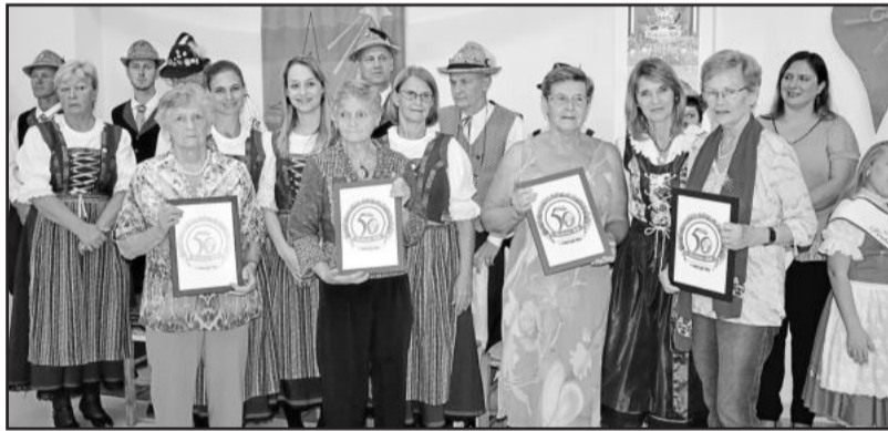
Senhoras da organização do primeiro baile, em 1966, foram homenageadas

Já o prefeito Rafael Mallmann acredita que o Festival do Chucrute é uma vitrina de Estrela. Visitantes de todo o país e até de fora desembarcam na cidade no mês de maio em busca de uma festa familiar, repleta de tradições germânicas.