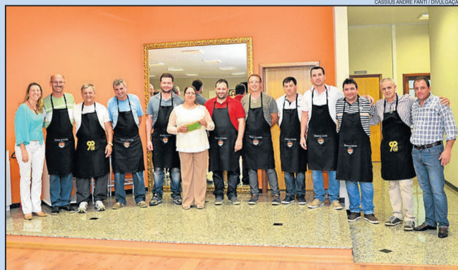
Casa de Repouso Arco-Íris recebeu R$ 2.280,00 durante o jantar, realizado na noite de sexta-feira, dia 10