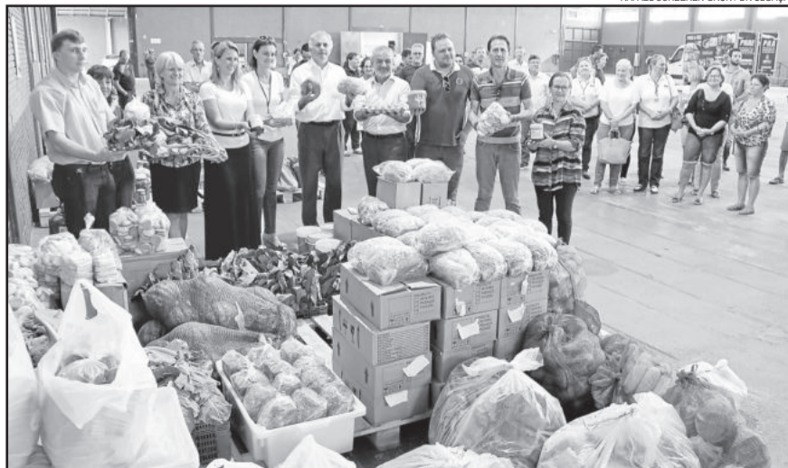
Autoridades exibiram parte dos produtos que serão adquiridos de 82 famílias de agricultores