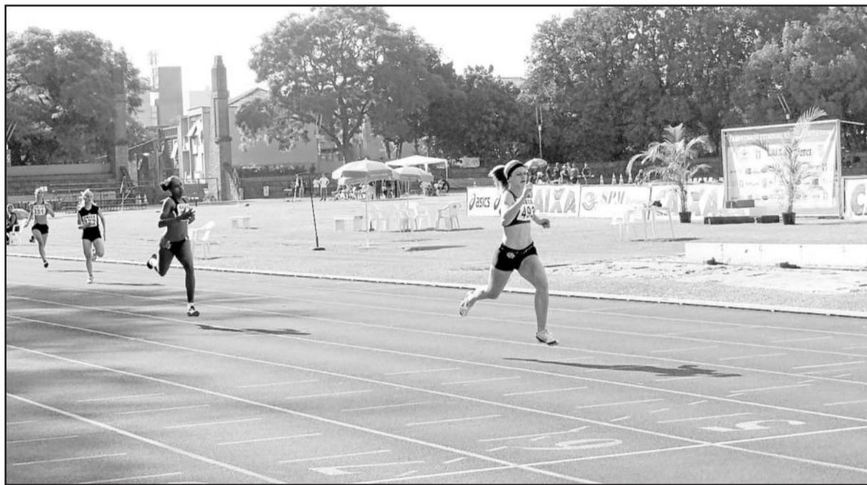
Atleta teutoniense é destaque nas provas de atletismo desde o período em que era estudante do Colégio Teutônia. Atualmente ela cursa Arquitetura na Univates

O Campeonato Estadual Adulto de Atletismo é considerado o mais forte do Rio Grande do Sul e nesta edição reuniu cerca de 200 atletas, entre eles competidores olímpicos como Fabiano Peçanha na prova de 800m, Kléberson David (800m) e a grande estrela do atletismo nacional,