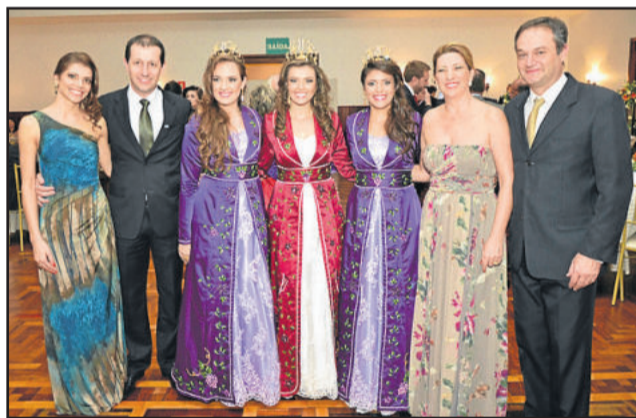
Soberanas com os presidentes da CIC e CDL

espumantes brasileiros' o evento proporciona aos visitantes, a degustação dos melhores espumantes, atrações artísticas e culturais e farta gastronomia.