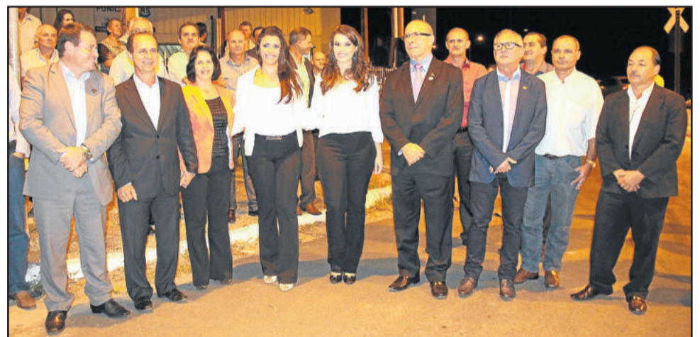
Autoridades compareceram a solenidade realizada nas proximidades do Monumento Giuseppe Garibaldi