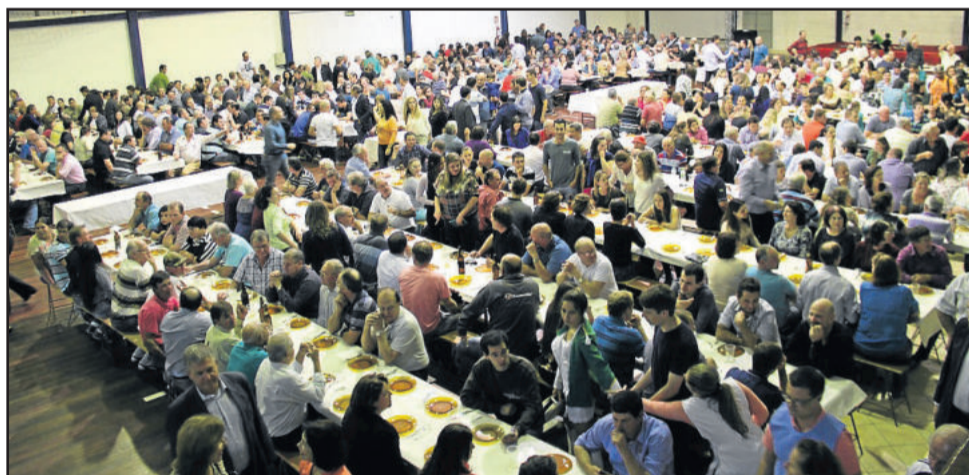
Mais de mil pessoas prestigiaram a inauguração da revitalização do acesso principal a Garibaldi