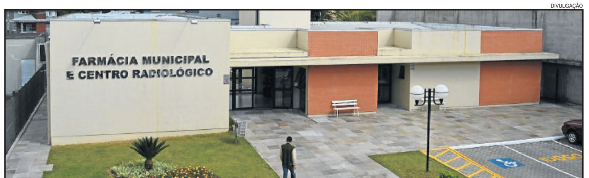
Com o Centro Radiológico, serviço se tornou mais rápido e prático

O Centro Radiológico está localizado ao lado do Centro de Saúde, em prédio construído pelo poder executivo, que abriga também as instalações da Farmácia Municipal.