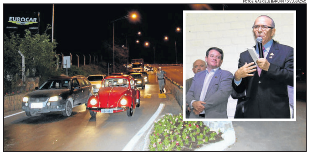
Ministro Eliseu Padilha acionou o novo sistema de iluminação do trevo de acesso ao Município

Ao som da banda marcial da Escola Dante Grossi, as pessoas foram recepcionadas nas proximidades do monumento Giuseppe Garibaldi. Em seu pronunciamento, o prefeito Antonio Cettolin destacou que a revitalização é um marco na história do município e foi possível graças ao apoio do Ministro Eliseu Padilha, quando na época deputado, recebeu o prefeito e viabilizou a destinação dos recursos. “Esta obra de revitalização representa segurança aos garibaldenses e aos visitantes, e integra o pacote de 50 obras que estão sendo realizadas este ano, algumas já realizadas e outras em andamento”.