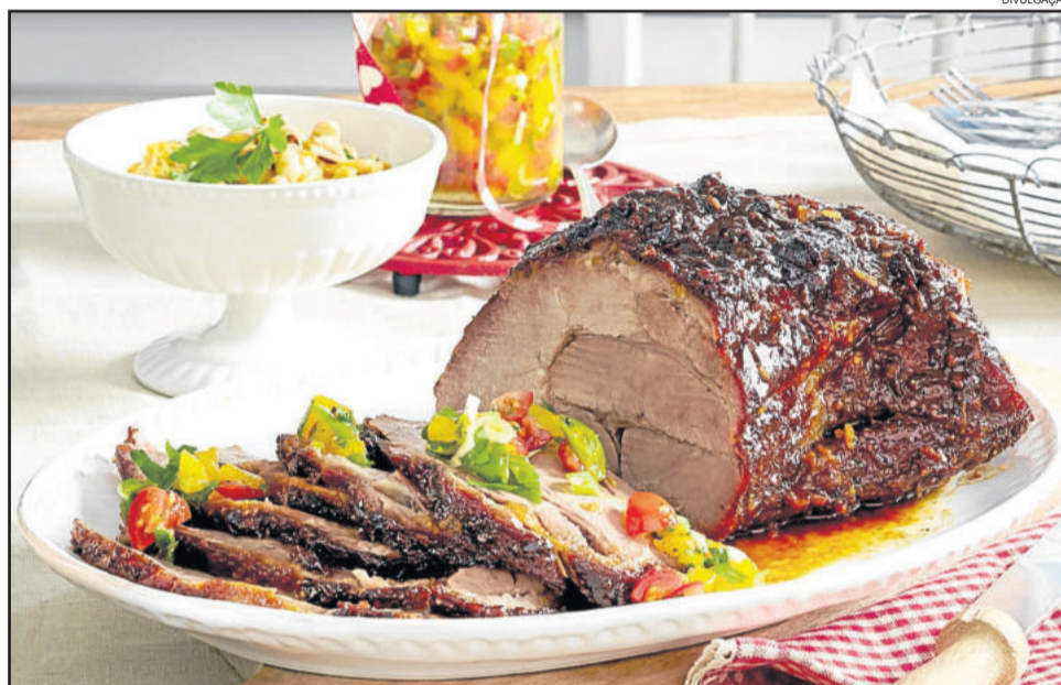
O Schweinebraten pode se tornar o prato oficial de Teutônia