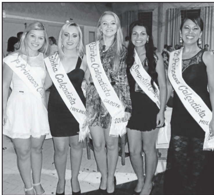
Soberanas calçadistas auxiliaram nas homenagens