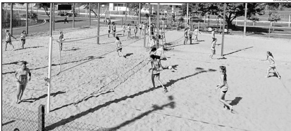
Equipes treinaram na areia do Parcão, em Estrela