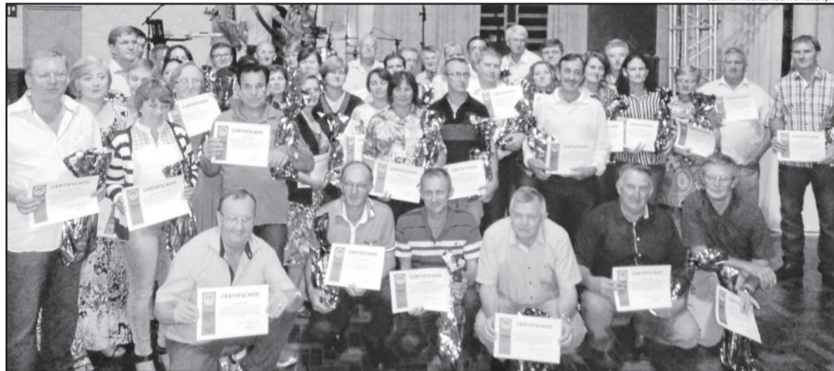
Pessoas com mais de 30 anos de filiação foram homenageadas