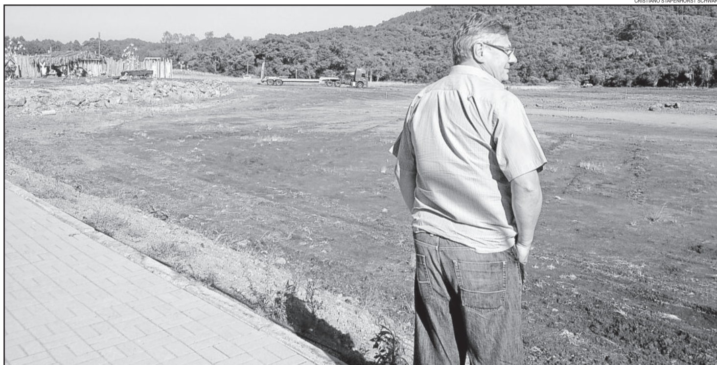
Máquinas trabalham na terraplenagem da área

A primeira etapa do parque de eventos contou com a preparação do palco natural para as apresentações artísticas. Agora a fase é de terraplenagem em toda a área para o escoamento da água e nivelamento do terreno onde será construído o campo de futebol e as raias para atletismo. O projeto de construção do CTG já está tramitando e deverá iniciar em breve.