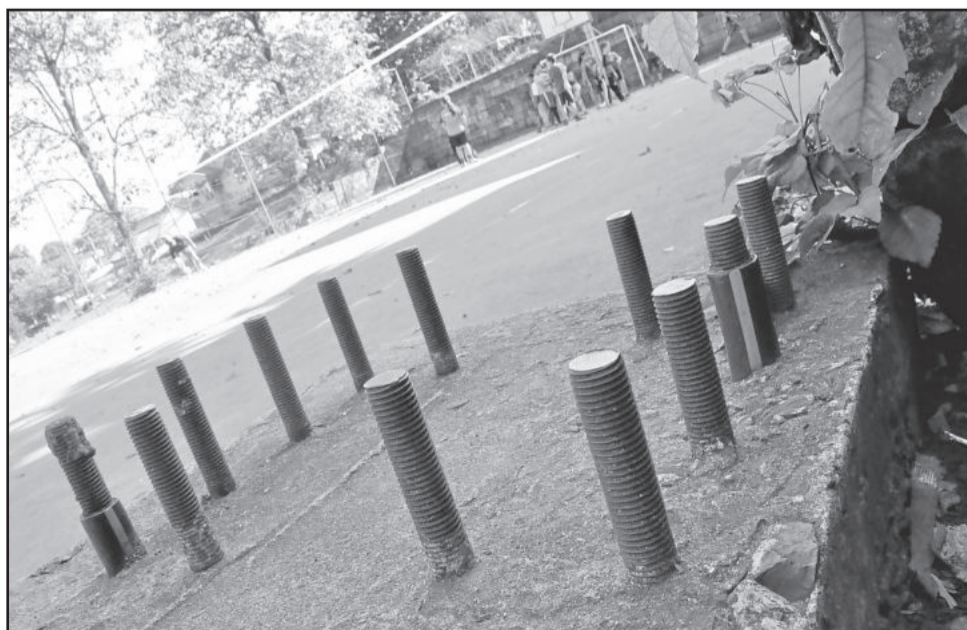
Estrutura aguarda para receber os pilares da cobertura

A escola luta pela construção da obra há quase 20 anos. Neste período, vários governos de diferentes siglas partidárias passaram pelo Estado e prometeram que a obra seria feita, porém, até hoje, apenas a quadra e a estrutura para receber os pilares da cobertura foram construídos. Os parafusos estão enferrujando.