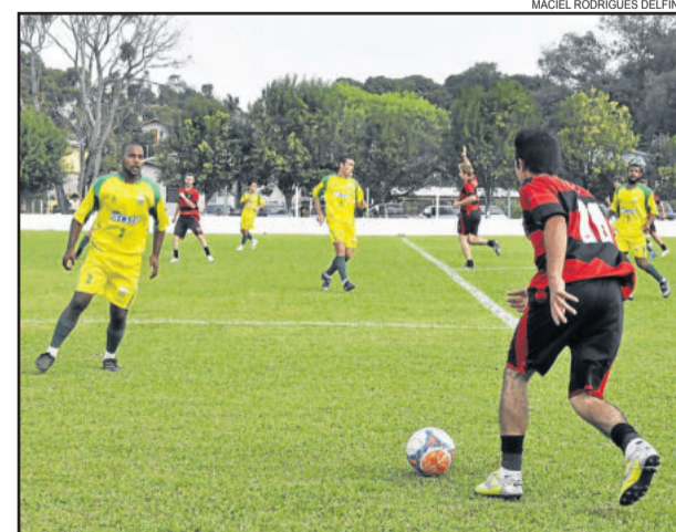
Flamengo perdeu pela primeira vez no campeonato, na casa do adversário