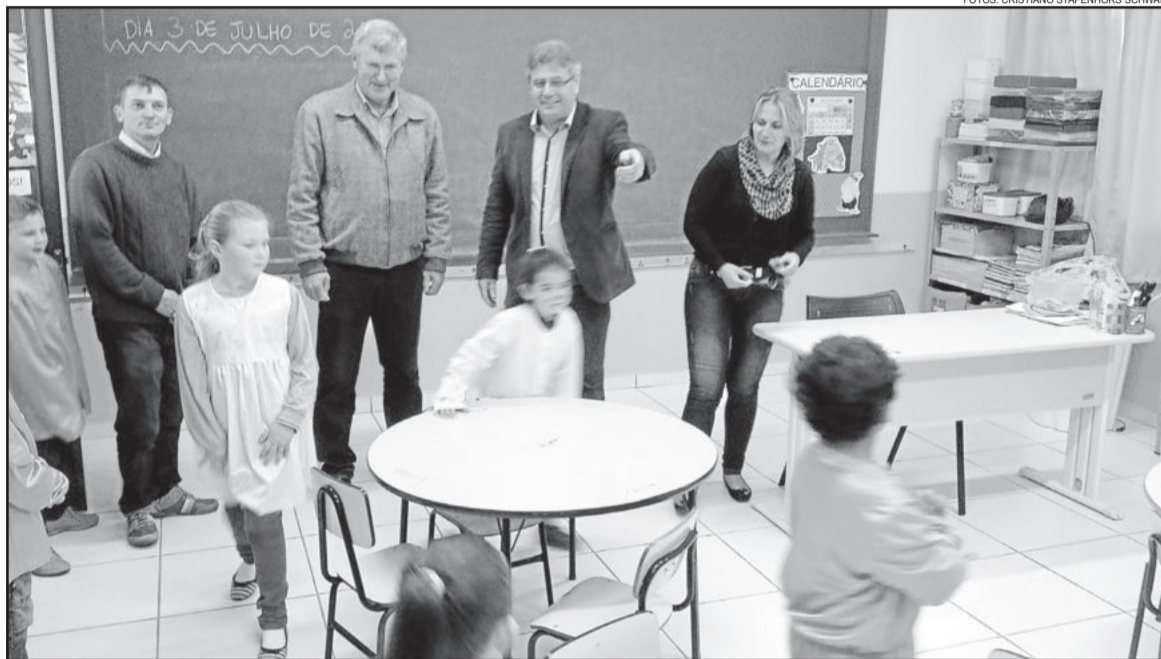
Alunos estão felizes com as novas salas de aula

A diretora da Escola Cátia Brune falou emocionada das dificuldades pela qual o educandário passou. “No início de Westfália havia a possibilidade de fechar, mas com esforço dos professores e das famílias a escola continuou