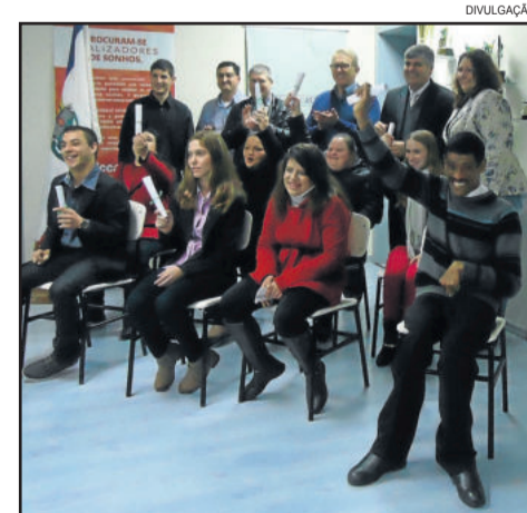
Turma do Jovem Aprendiz

Rua Carlos Arnt, 1244 (Galeria do Wessel 2º piso)