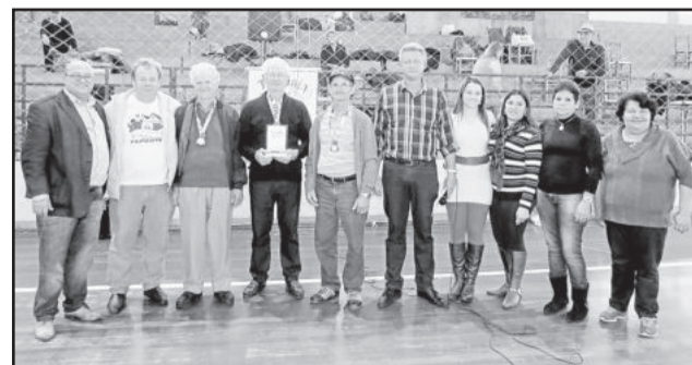
1º Lugar Bocha - Poço das Antas