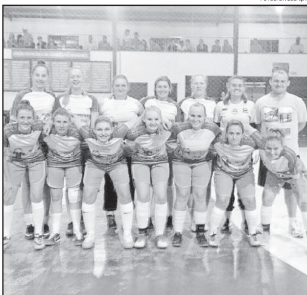
Morro das Alemoas, terceiro lugar no feminino