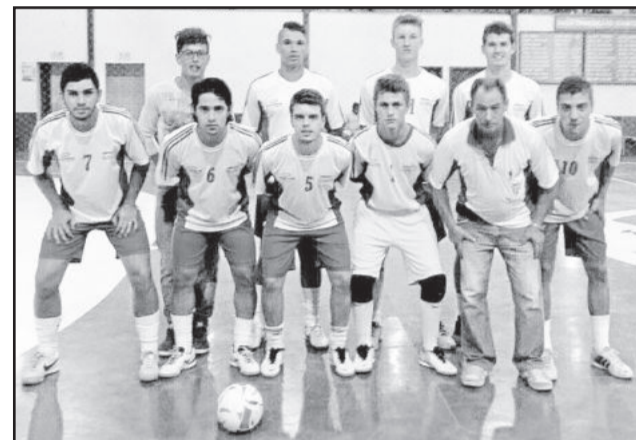
Amigos do Queiroz Sub-21, terceiro lugar