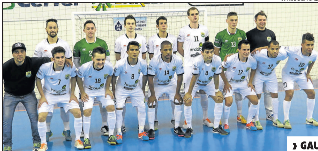
Teutônia Futsal folga neste sábado e volta a jogar dia 25