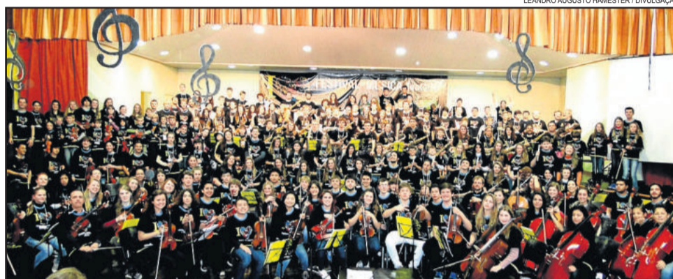
Festival de Música de Teutônia é uma oportunidade de aperfeiçoamento e opção cultural diferenciada

No trabalho com os estudantes, cujas atividades integram a programação pedagógica, serão 18 renomados professores em 16 cursos de instrumentos musicais e três oficinas. Essa formação propõe alternativas e novos direcionamentos para o fazer