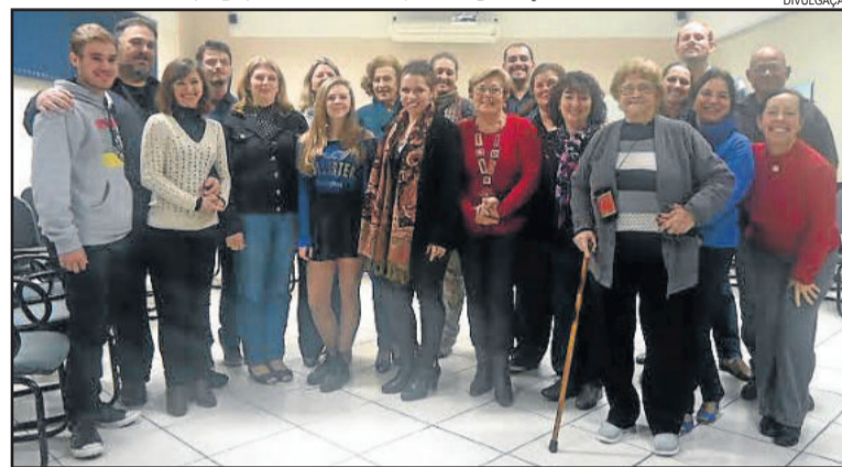
Participantes do sarau deste domingo