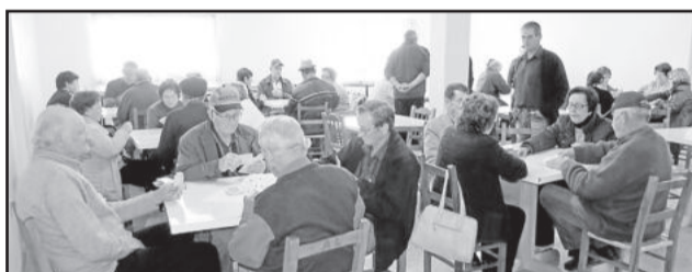
3ª idade se divertiu com a canastra

A programação iniciou às 9h com o pronunciamento de autoridades e o juramento dos atletas. Ao todo cinco municípios participaram do evento, com várias equipes, em diferentes modalidades, os quais foram Teutônia, Estrela, Lajeado, Poço das Antas e Westfália.