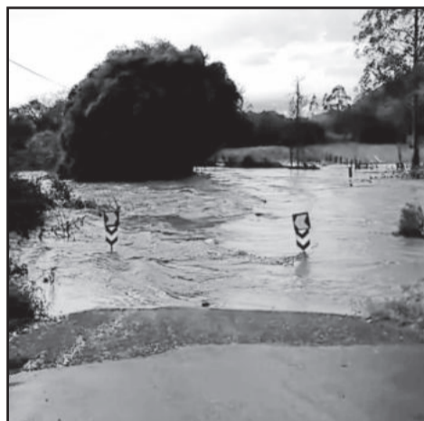
Trechos em Teutônia foram completamente impossíveis de transitar