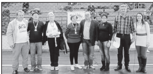
1º Lugar Bolão feminino - Grupo Bem me quer - Teutônia