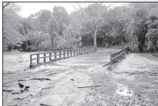
Ponte da Seca Baixa coberta pelas águas

Estradas cobertas de água na Ernesto Alves