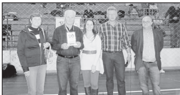
1º Lugar Bolão masculino - Grupo Amizade - Languiru