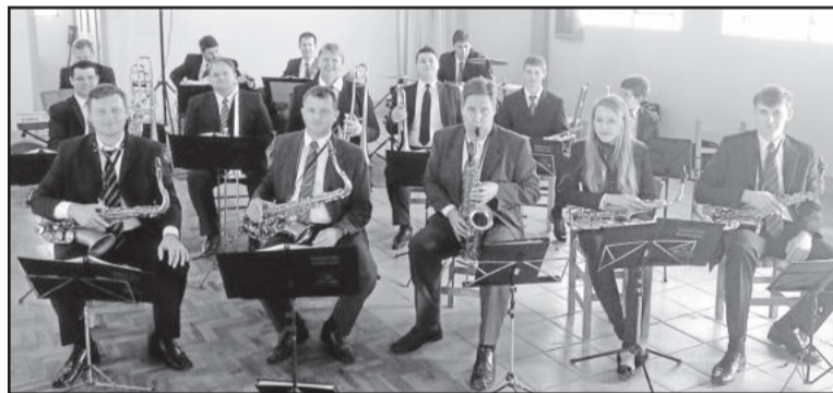
Orquestra de Westfália se apresentou

Na fala final o Prefeito Marasca enalteceu os investimentos na localidade e na Educação. “Asfaltamos o morro Wietholder e trecho da Transcitrus que interliga com Teutônia. Contribuímos na reforma aqui do Centro Comunitário e, agora, ampliação da Escola. Essa obra fecha um ciclo de investimentos em todos os educandários do interior. No Centro, a Escola Estadual continua como a mais moderna do Estado e a ampliação da Escola Municipal Vila Schmidt em 3 pavimentos está na fase final. O ginásio esportivo do Complexo Escolar já está pronto. Investir na formação do ser humano é a melhor forma de se avaliar o gestor público”, finalizou Marasca.