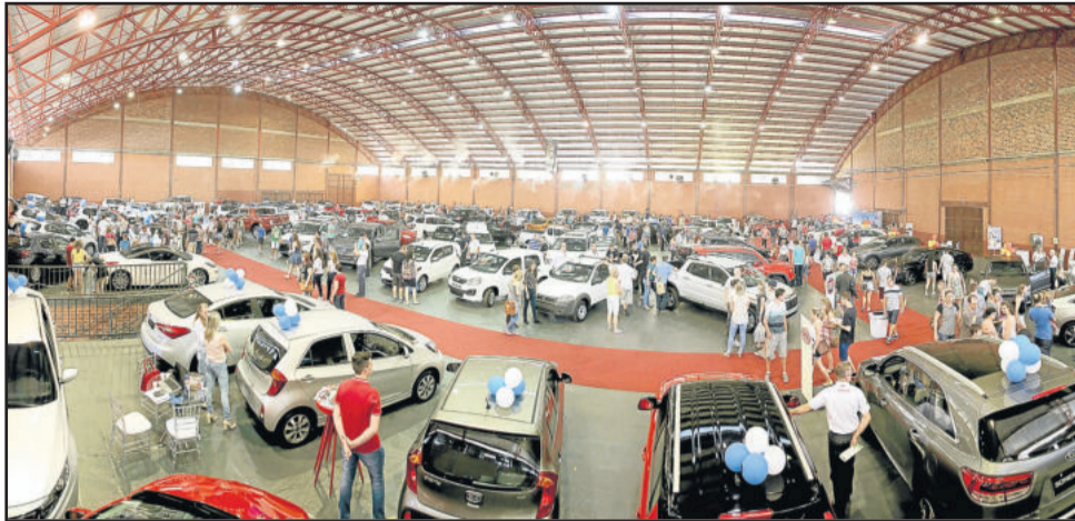
Duelo de Gigantes é uma das atrações