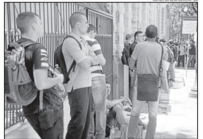
Dos futuros soldados que vão integrar as fileiras da corporação, 1.040 serão destinados ao policiamento ostensivo e 260 ao Corpo de Bombeiros Militar

Os alunos serão distribuídos entre as Escolas de Formação e Especialização de Soldados em Montenegro, Osório, Porto Alegre e Canoas.