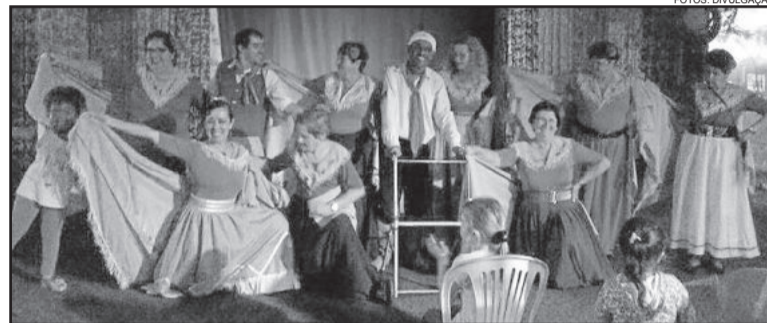
Melhor Idade apresentou "O Vento"