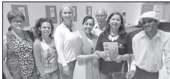
No lançamento da coletânea na Feira do Livro