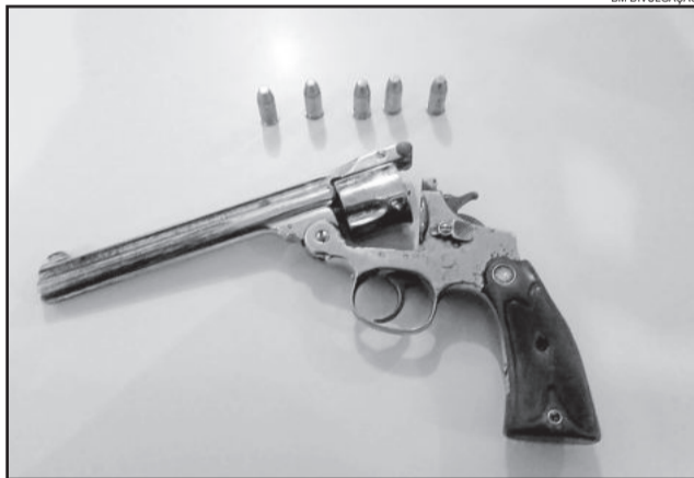
Arma foi encontrada durante revista

A Brigada Militar de Estrela prendeu um homem por porte ilegal de arma de fogo por volta das 22h15min de sexta-feira, dia 11 de novembro. Os policiais realizavam buscas a um veículo envolvido em uma tentativa de homicídio, quando abordaram um Gol com características semelhantes. Eles localizaram com o condutor um revólver calibre 38 muniado e com 5 cartuchos intactos. Em princípio, não havia relação com a tentativa de homicídio.