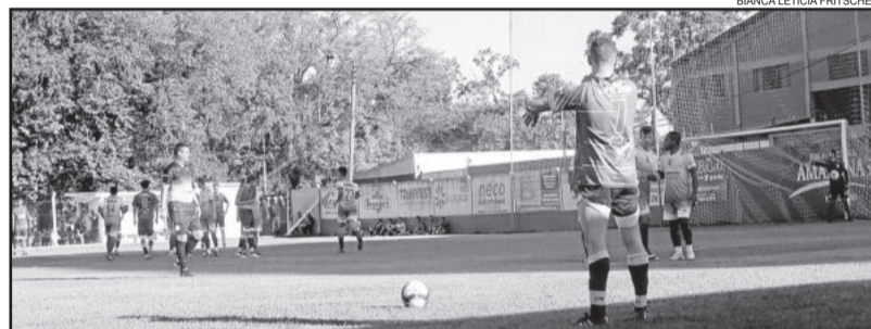
Aimoré não conseguiu aproveitar as oportunidades

Com a vitória, o São Cristóvão quebra a invencibilidade do Aimoré e reverte a vantagem de jogar pelo empate. No próximo domingo, em Estrela, o São Cristóvão precisa do empate para chegar à final do campeonato. Ao Aimoré apenas a vitória interessa para poder decidir a vaga nas penalidades.