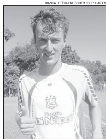
Schia, do União Campestre, craque nos Aspirantes