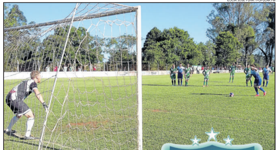
Cobrando penalidade máxima, Gavião descontou para 4x1 ainda na etapa inicial