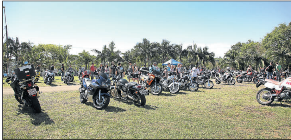
Expovale Moto Show foi uma das atrações do final de semana

vendedores e gerentes presentes, no sábado e domingo. As marcas participantes são: Toyota - Chevrolet - Fiat - Ford - Honda - Peugeot - Kia - Volkswagen - Hyundai.