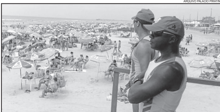
Do total, 709 se inscreveram para atuar em águas de mar e 211 para águas internas

Em busca de uma oportunidade de emprego, 920 pessoas se inscreveram no processo seletivo de contratação de salva-vidas civis temporários para a Operação Golfinho, da Brigada Militar. Desse total, 709 se inscreveram para atuar em águas de mar e 211 para águas internas. Neste ano, estão sendo oferecidas 600 vagas, o dobro da edição passada.