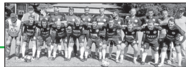
Juventude da Frank, Teutônia, segue com a melhor campanha e domingo aplicou 8 a 0