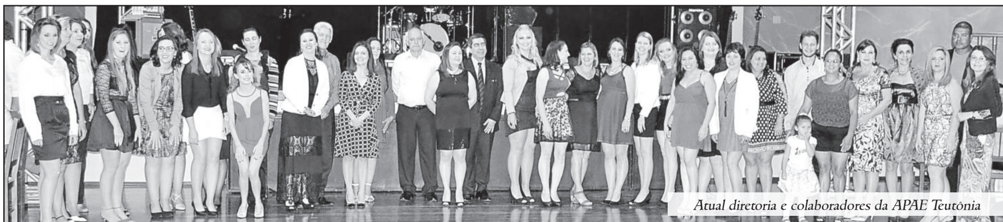
Atual diretoria e colaboradores da APAE Teutônia