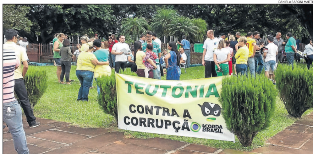
Manifestantes se reuniram na esquina do Centro Administrativo

O protesto iniciou com a entoação do Hino Nacional Brasileiro e encerrou, por volta das 11 horas, da mesma forma. Toda ação foi de forma pacífica, sem nenhum incidente.