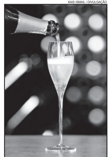
Rota do Espumante

permanecem mais de 24 horas no destino) e mais visitantes”, define. A mudança no quadro turístico de Garibaldi também se deve ao aumento de investimentos que o setor recebeu, sendo que, apenas em 2015, com os recursos para a revitalização da Buarque de Macedo aumentou mais de 100% se comparado a 2013.