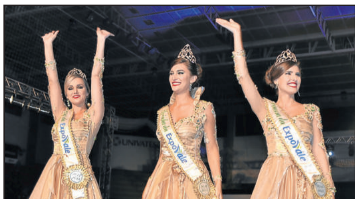
Despedida da corte 2014