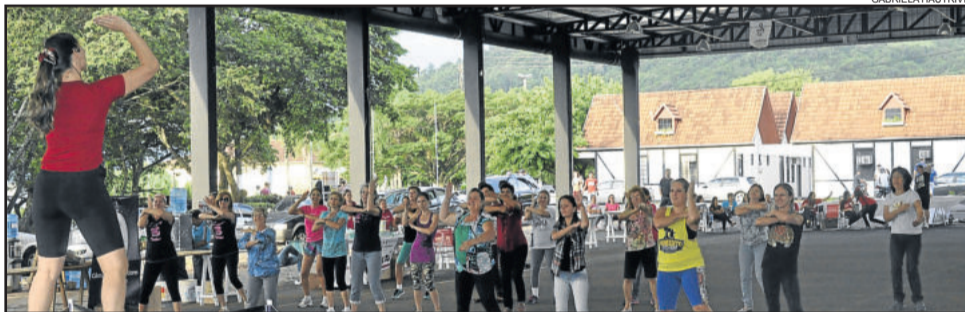
Ritmos de música animaram a mulherada