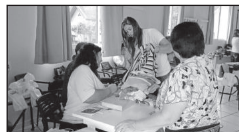
Roupas tiveram preços acessíveis

ECONOMIA NO TRANSPORTE DE ENCOMENDA? REDE ENCOMENDAS Facilitando a sua vida. Sta. Cruz do Sul - Venâncio Aires Vale do Taquari Caxias do Sul - Porto Alegre 3720-3157