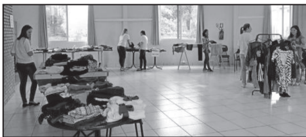
Brechó contou com peças de todos os modelos e tamanhos