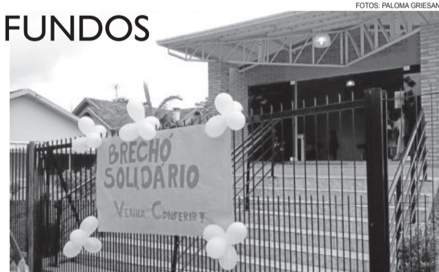
Brechó ocorreu na Casa da Juventude na Comunidade Evangélica Redentor