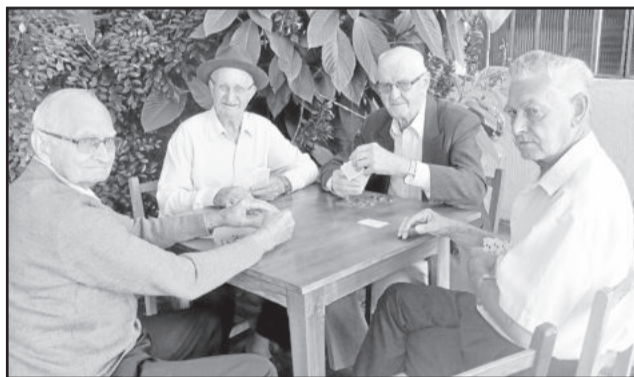
Separados em grupos, os participantes realizaram jogos durante o todo o dia

Uma das curiosidades do carteadado é o “tempo bom”. Em 19 anos de evento, apenas uma vez choveu (em 2014) e os jogos foram realizados dentro do ginásio. Nos demais anos, todas as vezes as atividades acontecem com mesas espalhadas pela Praça da Paz. O evento é uma realização da Comunidade de Seca Baixa, com apoio da Prefeitura Municipal de Imigrante.