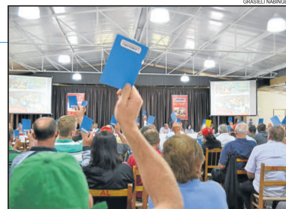
Associados aprovaram proposta para destinação das sobras do exercício 2015

Por fim, após leitura dos pareceres favoráveis da auditoria independente e do Conselho Fiscal, ocorreu