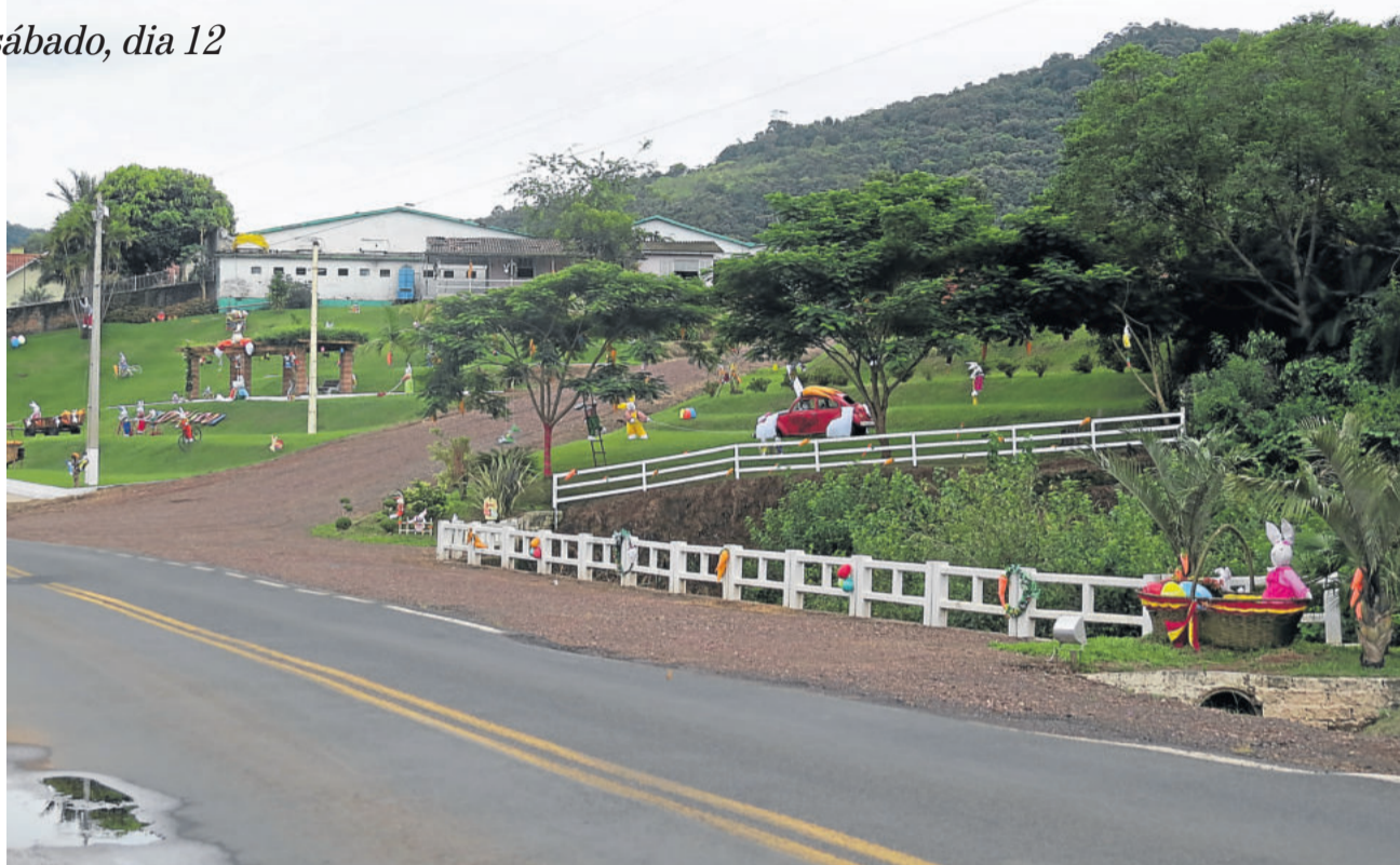
Neste ano, a novidade é o trenzinho que leva os visitantes até os principais pontos turísticos do Município

Para melhor organização, as escolas já podem agendar visita com a Secretaria Municipal de Educação, Cultura e Desporto, através do telefone (51) 3760-1158 ou do e-mail educacao@colinasrs.com.br .