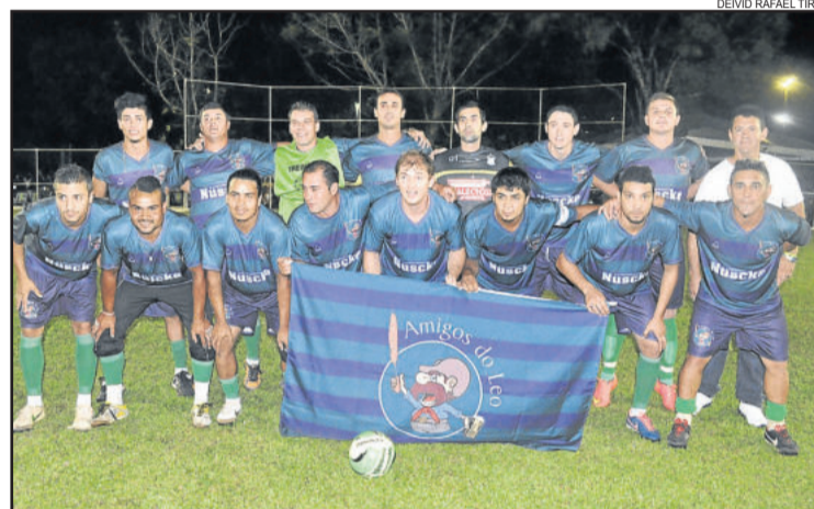
Amigos do Leo - Força Livre

As finais do 36º Campeonato Aberto de Verão da Languiru acontecem na próxima sexta-feira, dia 18, com as partidas de Master, Veterano, Feminino, Sub-20 e Força Livre. O horário previsto para o início da rodada de finais é 19h30min, no campo 1 da Associação dos Funcionários da Cooperativa Languiru. A Popular FM transmite ao vivo todas as emoções da Categoria Força Livre e traz o tempo e placar das demais partidas, com intervenções ao vivo.