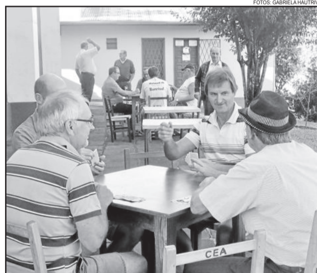
Os jogos foram disputados ao longo da segunda-feira