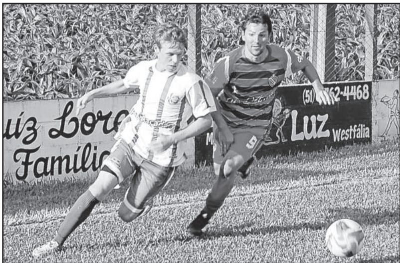
Juventude de Roger (e) foi superior ao Riograndense de Alex