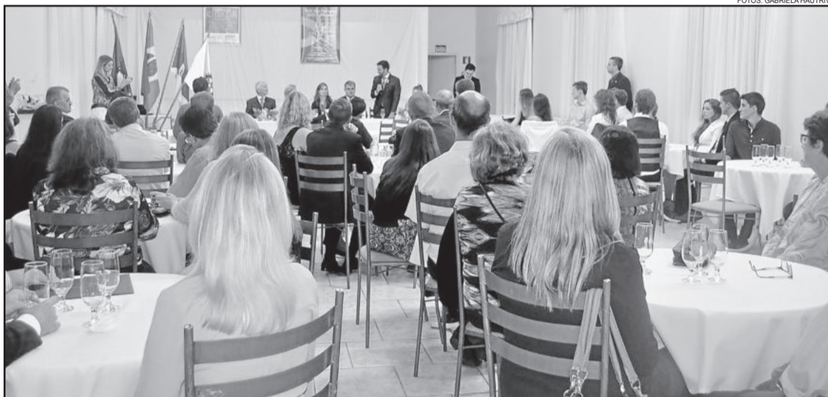
Representantes do Rotary Club e membros do Rotaract estiveram presentes no evento