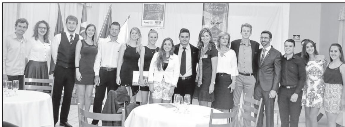
Integrantes do Rotaract de Teutônia