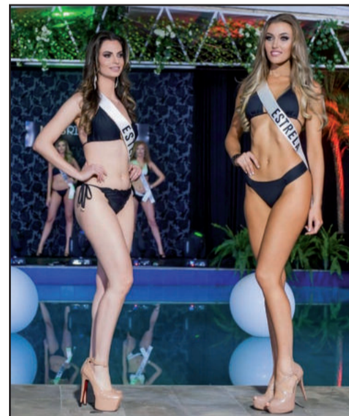
Etapa contou com 48 modelos, e 20 avançaram para a final