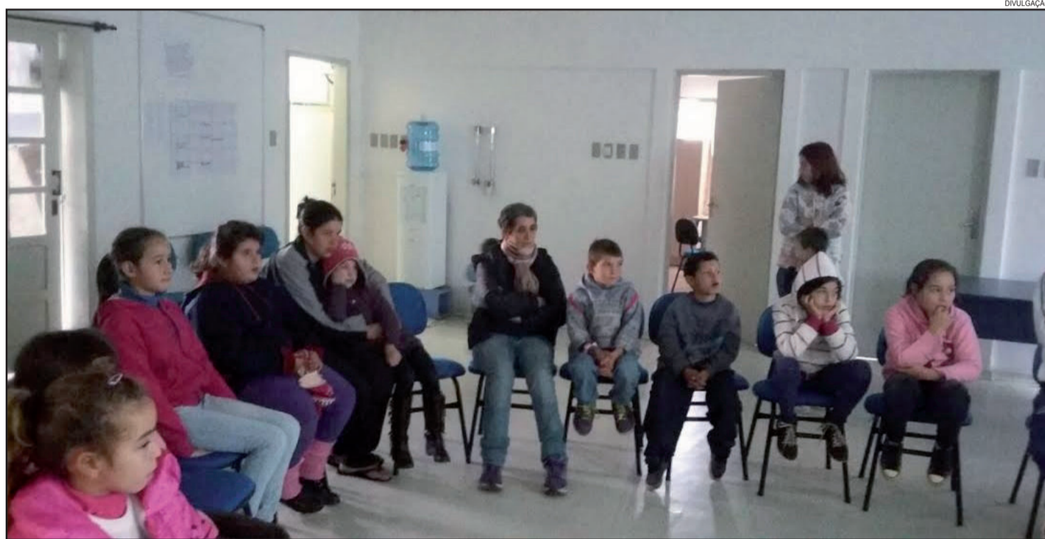
CRAS desenvolve atividades alusivas ao Combate ao Abuso e Exploração Sexual Infantil I

demais grupos. No caso de qualquer suspeita de que esta situação esteja acontecendo, as denúncias podem ser feitas através do Disque 100 ou junto ao Conselho Tutelar.