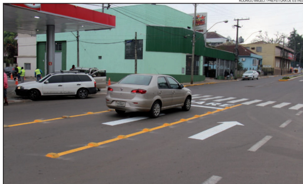
Dados auxiliarão num estudo das medidas a serem tomadas como também na avaliação de resultados daquelas ações já realizadas

laborar na tomadas de atitudes por parte dos responsáveis. “É um relatório que traz local, datas, horários e possíveis causas. Isto pode sim ajudar as autoridades a tomarem decisões mais próprias e pontuais”, explica ele.