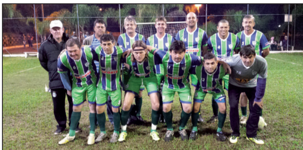
Guaíba: Veteranos é o primeiro finalista da competição