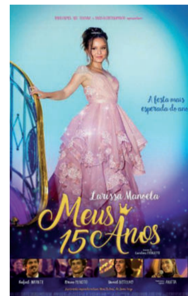
MEUS 15 ANOS

Aos quatorze anos de idade, Bia (Larissa Manoela) descobre que vai ganhar uma grande festa de quinze anos. Mas tem um problema: a garota sonhadora e apaixonada por música não tem muitos amigos para convidar ao evento, por ser pouco popular na escola. Ela conta com a ajuda do único grande amigo, Bruno, e do pai Edu, para consertar a situação.