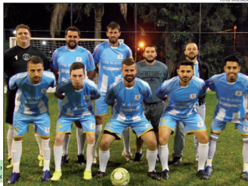
Timão Los Blefes