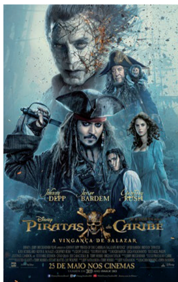
PIRATAS DO CARIBE A VINGANÇA DE SALAZAR

Envolvido em uma inédita aventura, um desafortunado Capitão Jack encontra os ventos da má sorte soprando ainda mais forte quando piratas fantasmas assassinos liderados por seu antigo inimigo, o terrível Capitão Salazar (Bardem), escapa do Devil's Triangle, determinado a matar todos os piratas no mar... inclusive ele. A única esperança de sobreviver do Capitão Jack está em procurar o lendário Tridente de Poseidon, um artefato poderoso que concede a quem o possui o poder total de controlar o mar.