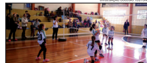
Evento movimentou as quadras do Colégio Teutônia em mais de 100 jogos

O próximo grande evento de mini vôlei já começou a ser preparado e divulgado. Será no dia 12 de outubro, no Dia das Crianças, quando o Colégio Teutônia e a Juventus realizam o 2º Festival Teutônia de Mini Vôlei na Grama.