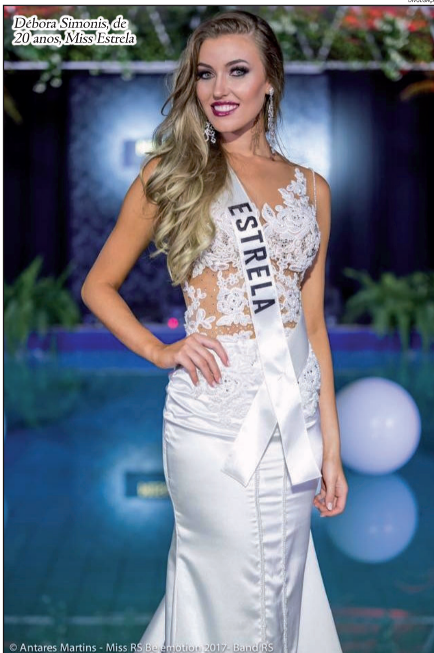
Miss RS Be emotion 2017- Band/RS