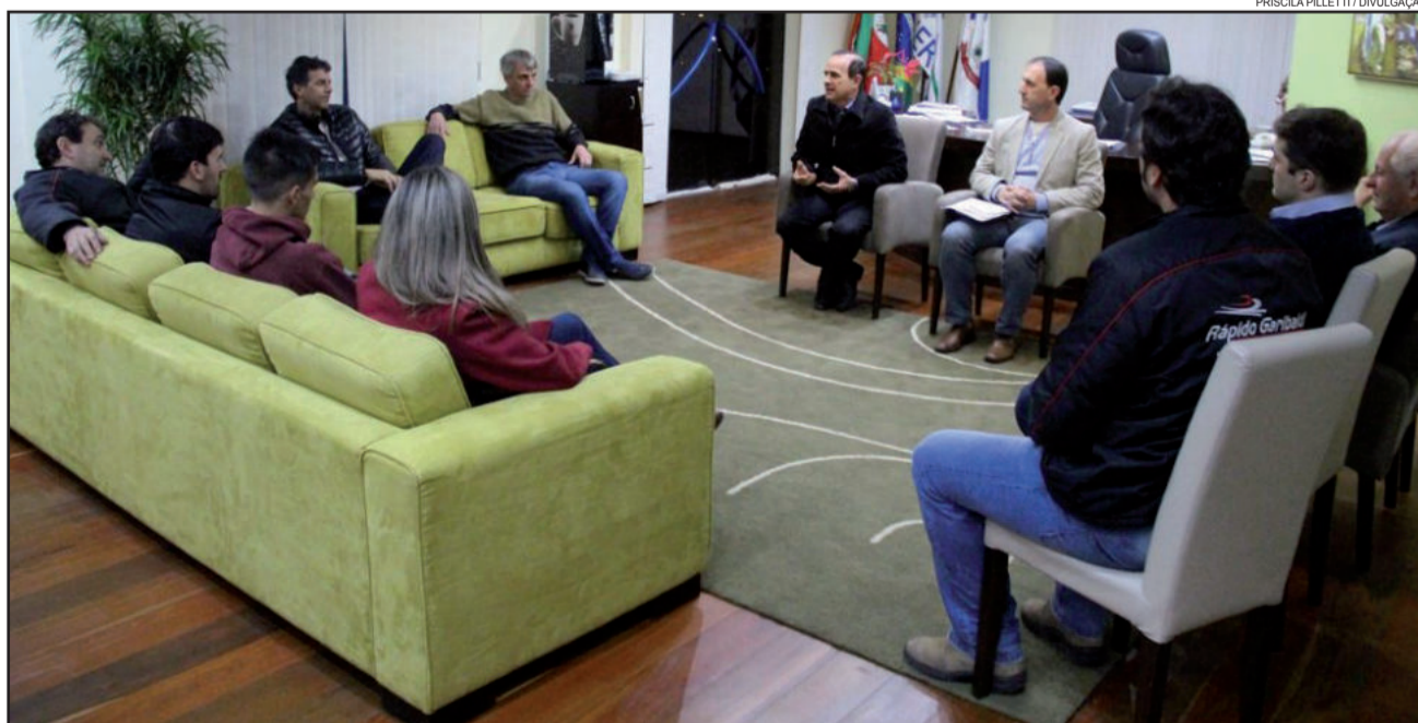
Representantes dos times vencedores do Campeonato Citadino de Futsal 2017 de cada categoria receberam a respectiva premiação

A relevância do Citadino de Futsal de Garibaldi fica comprovada com o local da entrega oficial da premiação: no gabinete do prefeito. Representantes dos times vencedores do Campeonato Citadino de Futsal 2017 de cada categoria receberam a respectiva premiação nesta terça-feira, dia 13 de junho, do prefeito Antonio Cettolin.