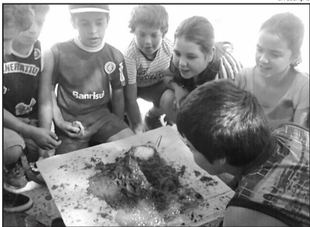
Trabalho em grupo entre os alunos da EMEF Jardelino.