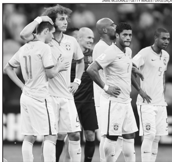
Seleção Brasileira tentou, mas não conseguiu o 3º lugar

Depois da goleada para a Alemanha na terça-feira, dia 8, a Seleção Brasileira fechou a Copa do Mundo de 2014 com mais um resultado ruim. Dessa vez, a diferença no placar foi menor, mas, mesmo assim, deixou uma impressão ruim da equipe da casa. A Holanda de Robben saiu na frente ainda na primeira etapa e não deixou a "peteca" cair.