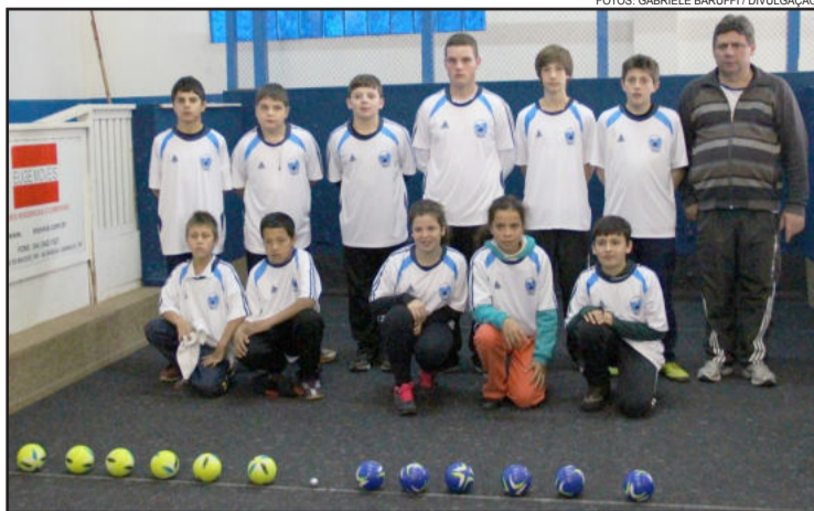
Alunos e treinador

O projeto Liga Mirim é coordenado pela Liga Garibaldense de Bocha e conta com o financiamento da Prefeitura, através da secretaria de Esportes e Lazer por meio do Programa Municipal de Financiamento para Desenvolvimento do Esporte e Lazer de Garibaldi - Findel. Interessados ainda podem fazer sua inscrição junto à Liga Garibaldense de Bocha pelo telefone 3462-3687.