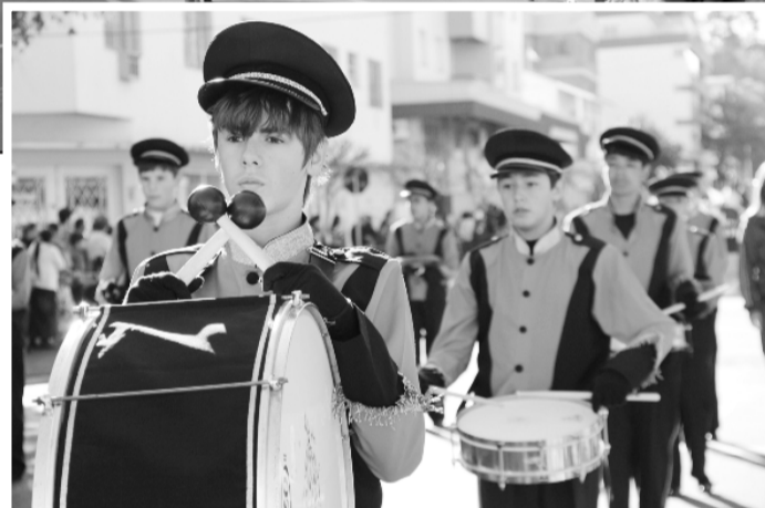
Desfile cívico de 2013