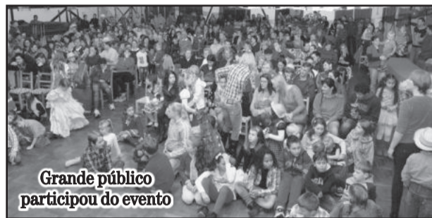
Grande público participou do evento