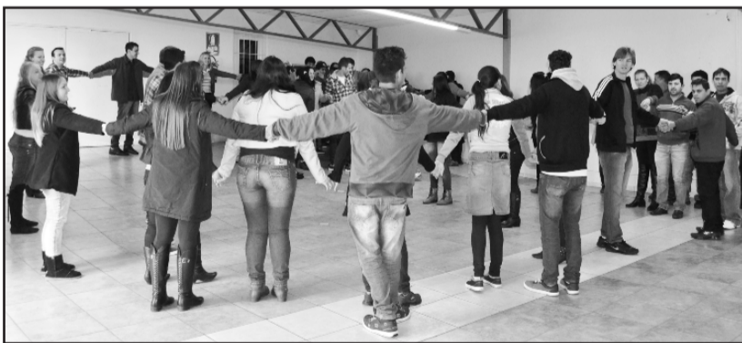
Dinâmica em grupo ressaltou a importância do trabalho em equipe