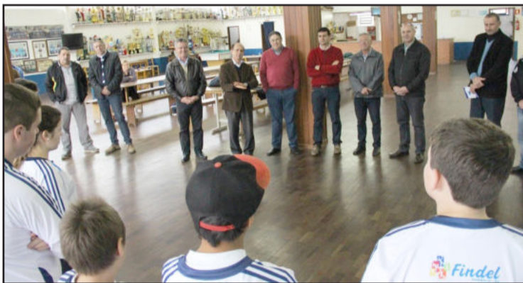
Prefeito Antonio Cettolin falou aos presentes