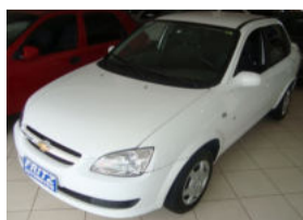
Classic LS 1.0, 4P R$ 24.900,00