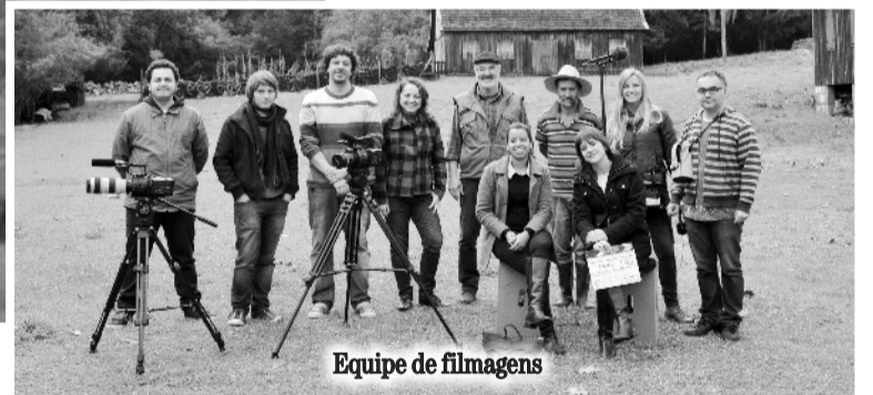
Equipe de filmagens