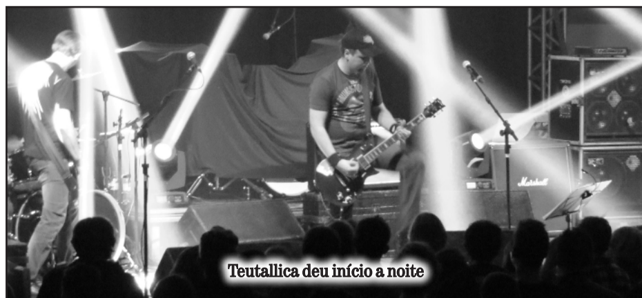
Teutallica deu início a noite