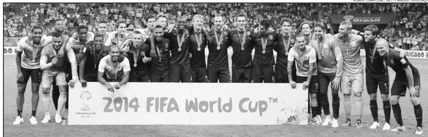
Holanda conquistou o 3º lugar da competição