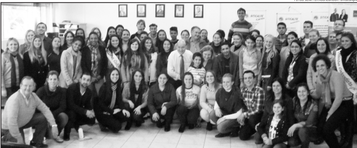
80 jovens de Teutônia e Parobé participaram do evento