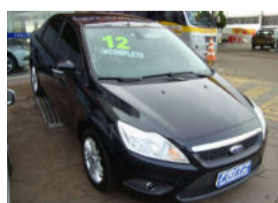
Focus Sedan 2.0 R$ 47.800,00

Aberto de segunda a sexta das 8h às 18h30min. Sem fechar ao meio dia e nos sábados das 8h às 16h.