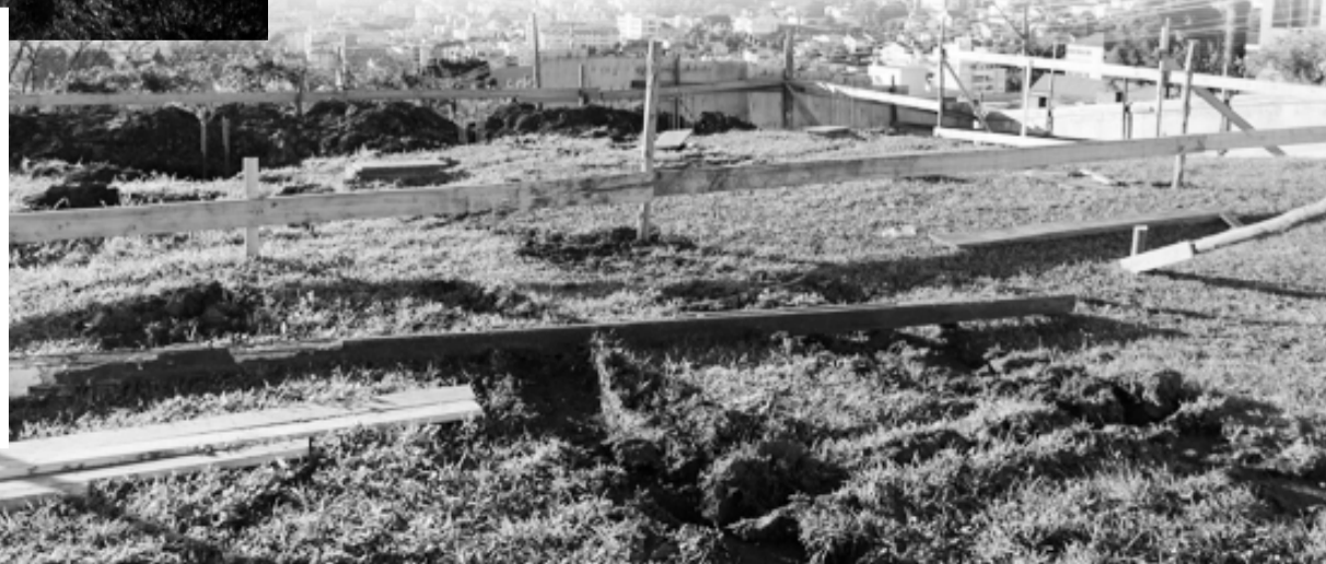
Mirante Bella Visione tem previsão para ficar pronto em outubro. Na foto de cima (com a igreja) uma noção de como será a vista