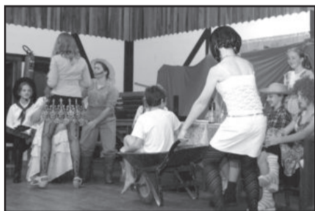
Jovens realizaram apresentações