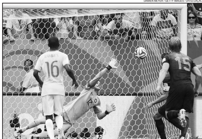
Van Persie abre o placar para a Holanda de pênalti