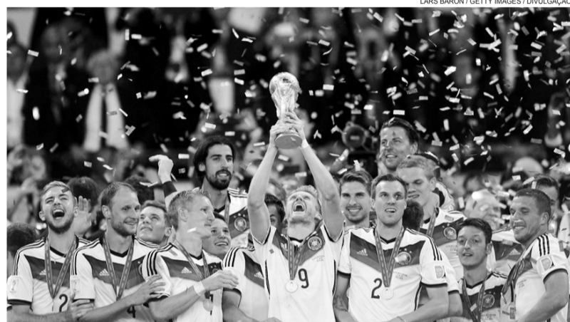
Mario Götze fez o único gol da final no 2º tempo da prorrogação e deu o Tetracampeonato para a Alemanha

Lionel Messi foi eleito o melhor jogador da Copa do Mundo