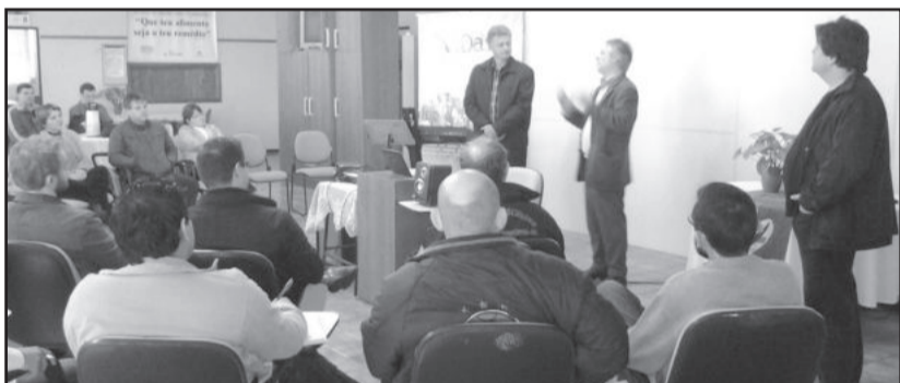
Curso teve início no sábado, dia 12 de julho

O Curso Profissionalizante de Regência Coral é uma parceria da Administração Municipal de Teutônia, através da Secretaria de Cultura e Turismo, do Sínodo Vale do Taquari e do Instituto Federal do Rio Grande do Sul. A realização se dará através do Programa Nacional de Acesso ao Ensino Técnico e Emprego (Pronatec).