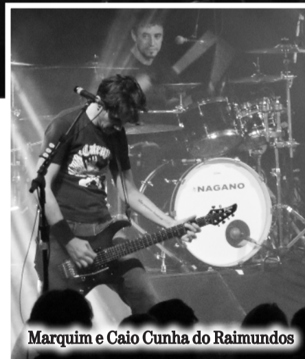
Marquim e Caio Cunha do Raimundos