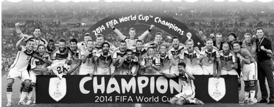
Alemanha conquista o quarto título da Copa do Mundo

Confira os destaques da Copa Craque da Final: Mario Götze Melhor Jogador da Copa: Lionel Messi Artilheiro: James Rodriguez Melhor Goleiro: Manuel Neuer Revelação da Copa: Paul Pogba Melhor Disciplina: Colômbia