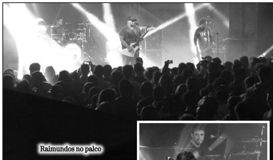
Raimundos no palco

Para os próximos 30 dias, o Raimundos tem mais de dez show confirmados por todo o Brasil, principalmente no estado de São Paulo.