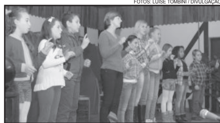
Apresentação na linguagem de libras

Após as apresentações, o público pode se divertir com brincadeiras e se deliciar com os lanches típicos, como pipocas e rapaduras. Os organizadores também criaram um cantinho da foto, para quem quisesse registrar a presença no evento de uma forma diferente.