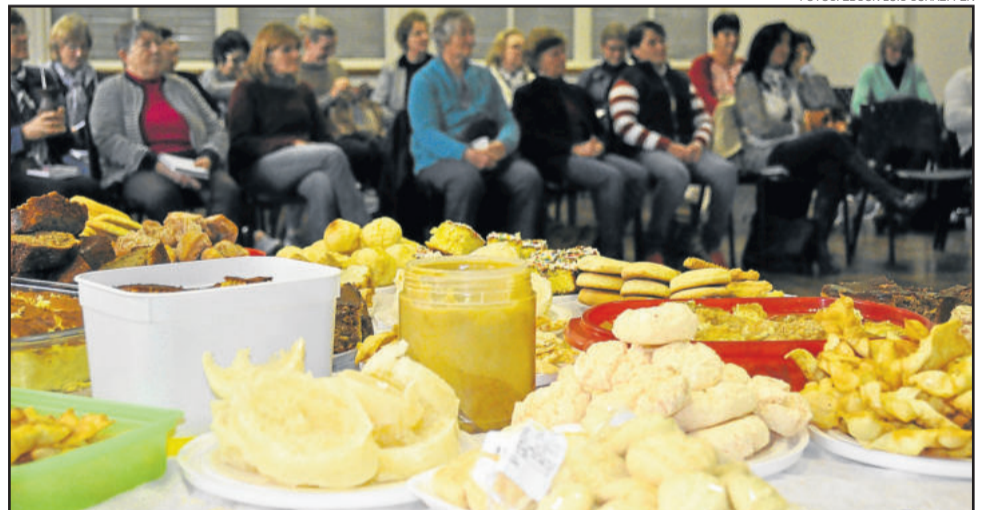
Receitas de antigamente foram resgatadas no livro