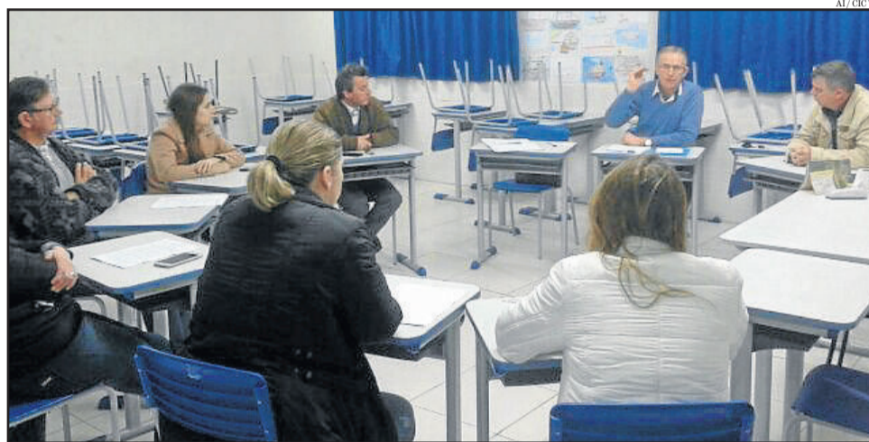
Terceira reunião do grupo de articulação com participação da CIC VT

O prefeito lamentou ainda que a troca de cautelas da campanha para estimular o comér-