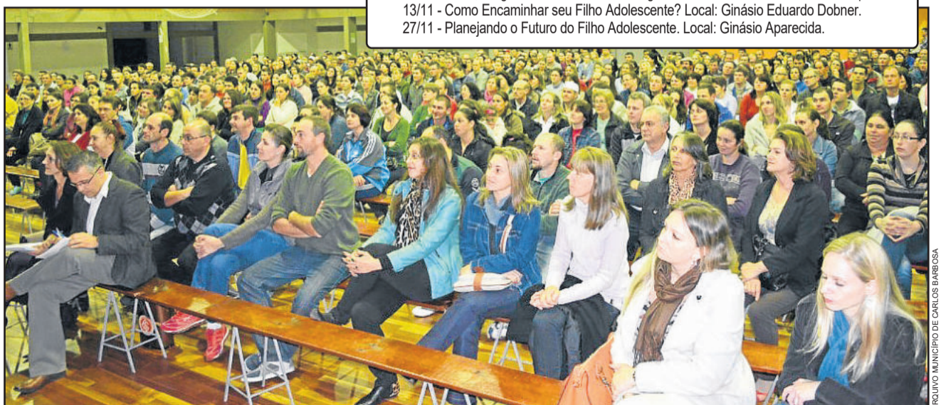
ARQUIVO MUNICIPAL DE CARLOS BARBOSA

Todos os encontros acontecem das 19h às 20h30