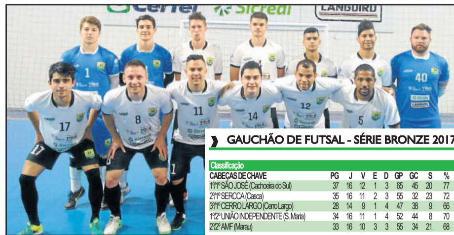
▶ GAUCHÃO DE FUTSAL - SÉRIE BRONZE 2017