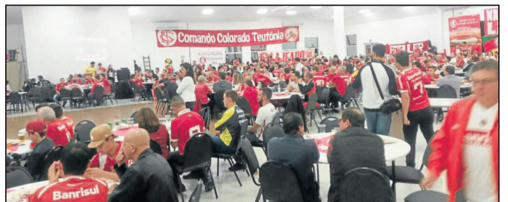
Evento reuniu consulados de toda região