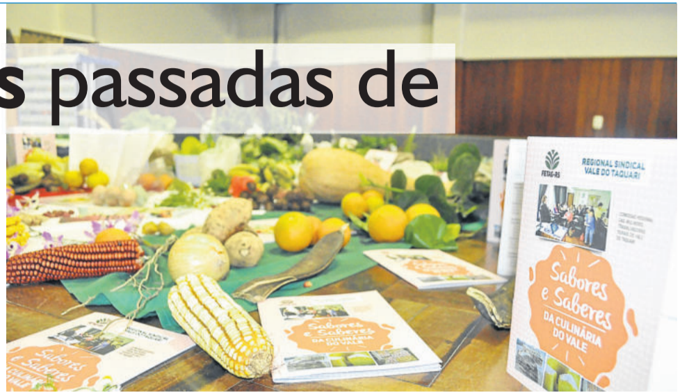
Livro traz receitas que foram passando por gerações