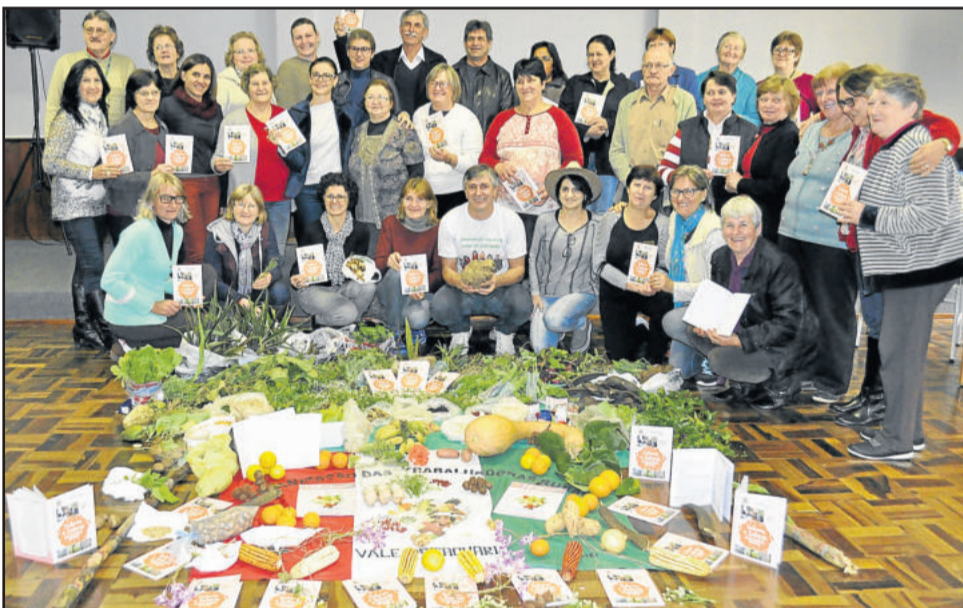
Mulheres trabalhadoras rurais contribuíram com as receitas que podem ser conferidas no livro