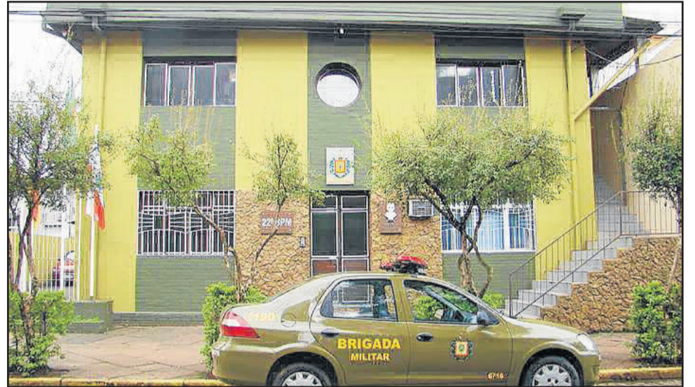
Sistema vai ser operado pelo BPM de Lajeado

As informações sobre quantidade de câmeras e a localização serão mantidas em sigilo por questão de segurança. O monitoramento será feito pela Brigada Militar, através da Sala de Operações do 22º Batalhão da Polícia Militar (BPM) de Lajeado, que recendo o alerta vai realizar o atendimento da ocorrência.