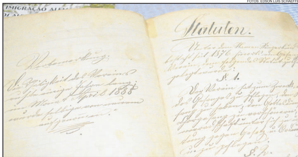
Primeiro livros de atas conta a fundaao do coral, em 1877

A Sociedade de Cantores Aliana  considerada um dos mais antigos coros do