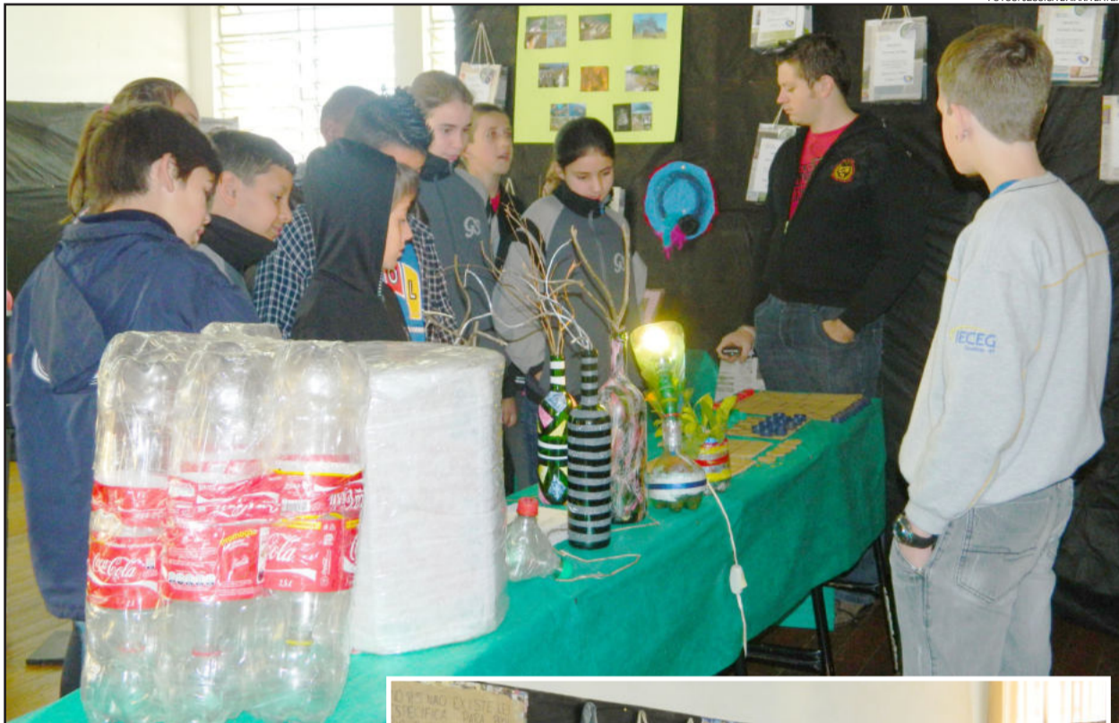
Alunos de diversas escolas de Teutônia visitaram a FEICEG

A 21ª FEICEG encerrou ontem, dia 14. Foram dois dias de atividades no IECEG envolvendo os alunos e outras escolas do município que prestigiaram o evento. A FEICEG deste ano, realizou diversas ações sobre o lema: "Corrente do Bem. Seja um elo desta ação!", entre os quais estavam os projetos realizados pelos alunos da instituição.