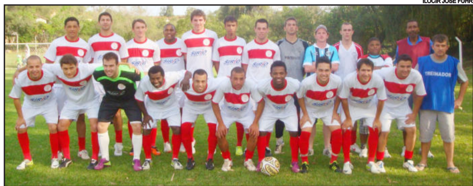
Equipe Delfino Costa enfrenta o São José amanhã

O Campeonato Regional Certel Aslivata 2012 - Copas Vales do Boa Vista e Vale do Forqueta - terão mais uma rodada importante neste domingo, dia 16 de setembro. As partidas valem a liderança dos grupos em disputa.