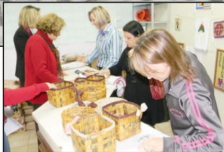
Visitantes aproveitaram a oportunidade para conhecer os trabalhos feitos na APAE

Ao todo, a APAE teutoniense, que atende 120 crianças de Teutônia, Paverama, Westfália, Brochier e Poço das Antas, foi contemplada com R$ 40 mil doados pela Associação Pró-Vida, R$ 22 mil repassados pela Prefeitura de Teutônia e outros R$ 20 mil pelo Rotary Club de Teutônia. Entre os investimentos realizados, a entidade adquiriu material de construção para as duas novas salas de aula, além de material de