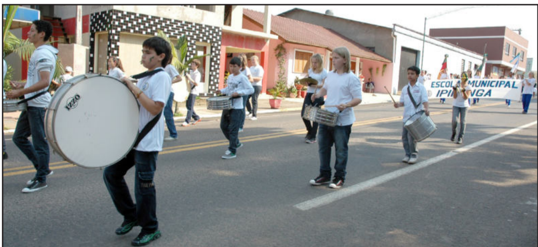
Banda coordenou o ritmo da marcha