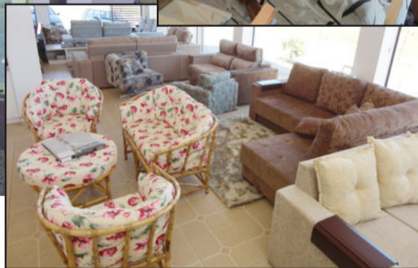
Variedade de opções na loja com lindos estofados para mudar seus ambientes