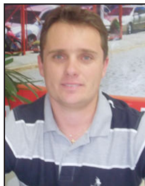
Ely comenta que chegou a ter prejuízos em alguns automóveis

lhão de veículos. O volume foi considerado recorde desde a instalação da indústria automobilística no país era previsto inicialmente para 31 de agosto, mas prorrogado até outubro de 2012. A previsão da Fenabrave é que, no acumulado de 2012, sejam comercializados 2,88 milhões de automóveis.