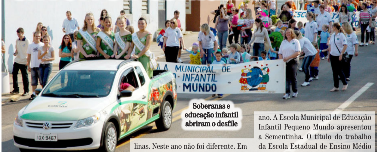
Soberanas e educação infantil abriam o desfile

ano. A Escola Municipal de Educação Infantil Pequeno Mundo apresentou a Sementinha. O título do trabalho da Escola Estadual de Ensino Médio de Colinas foi "Em nossas mãos está a mudança" e a Escola Municipal de Ensino Fundamental Ipiranga trouxe o tema "Andar com Fé".