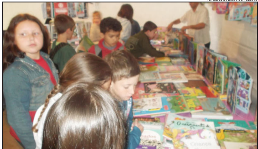
Crianças preferiram as obras infantis de Carosel e de Rebeldes