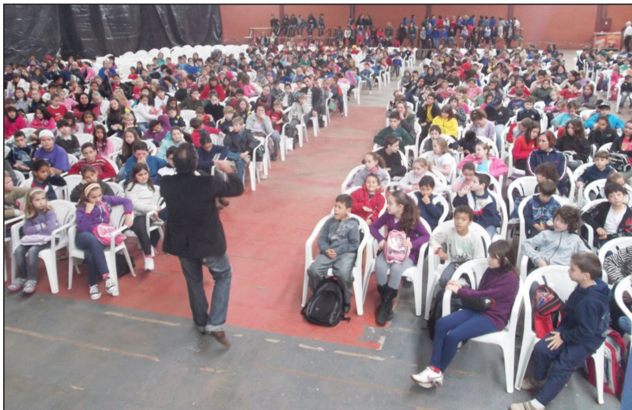
Iotti palestrou para a galerinha infantil

18h - Encerramento da sétima Feira do livro de Lajeado.