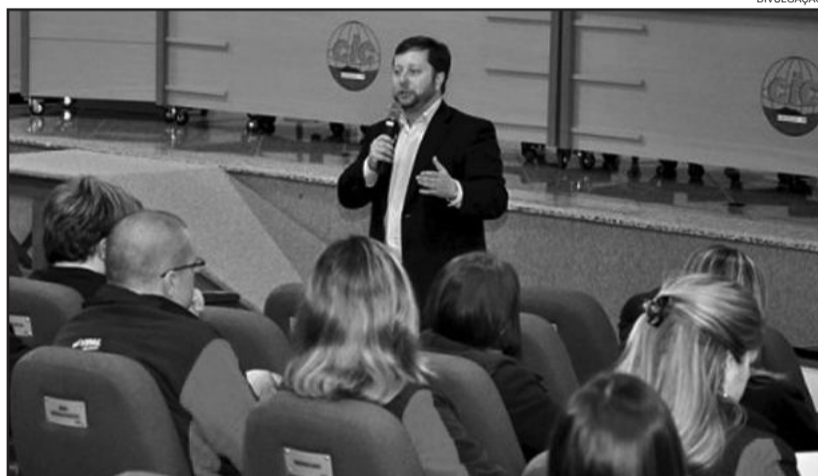
Risco de inadimplência é inerente a quem oferece crédito

10 - Qualificação é o caminho para o sucesso. A excelência nas vendas e manutenção do cliente passam pelo preparo de sua equipe na gestão e tratamento com seu cliente.