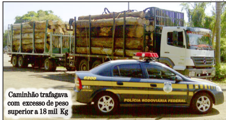
Caminhão trafegava com excesso de peso superior a 18 mil Kg