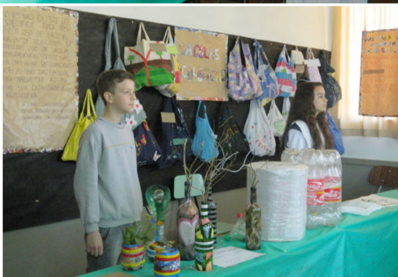
Alunos do IECEG explicavam aos visitantes o que foi produzido por eles

Na sexta-feira, dia 14, a partir das 8h, vários alunos de diversas escolas da cidade e a comunidade visitaram a FEICEG.