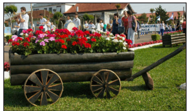
Escola Ipiranga, da Cidade Jardim