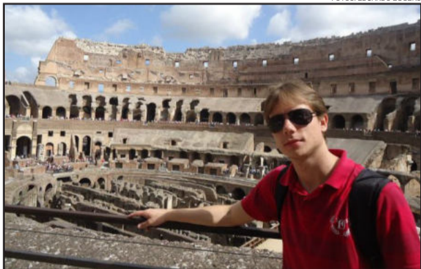
Estudante visitou Roma