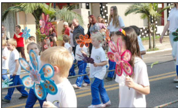
Público acompanhou a caminhada