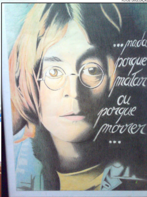
Johnn Lennon: Quadro que rendeu o 3º lugar na Teutoart de 2010