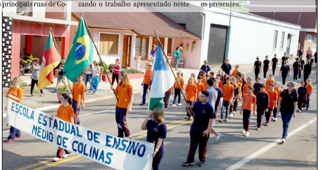
Alunos da Escola Estadual de Colinas

Em Colinas é tradicional a maciça participação da comunidade na programação de 7 de Setembro. Além das escolas, também as entidades do Município se organizam para participar do desfile, que percorre as principais ruas de Co-