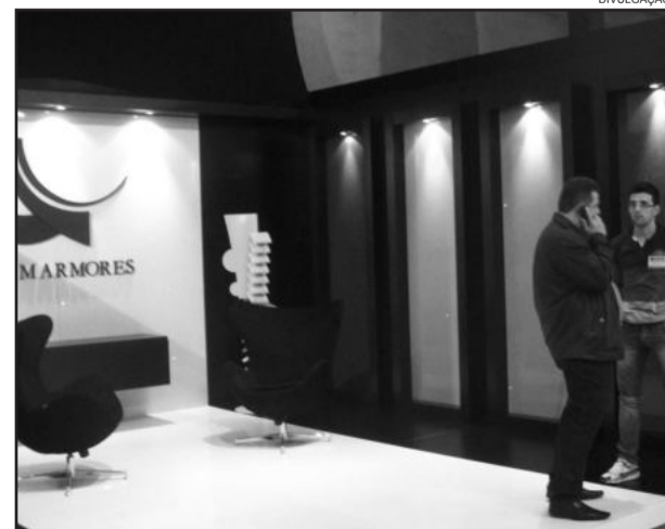
Expo Carlos Barbosa chega ao fim neste domingo

e Serviços (ACI), entidade que promove o evento.