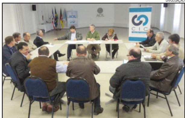
Em reunião realizada na CIC Vale do Taquari, prefeitos de sete cidades da região definiram estratégias para obter projetos e recursos para as duplicações

Somam-se a esses a crescente atividade econômica ao longo e no entorno, não só do trajeto em questão, mas também das regiões que ele conecta e cujas riquezas e pessoas por ali transitam; e a duplicação da BR-386, entre Estrela/Tabaí, que igualmente contribuirá para o aumento do fluxo de veículos.