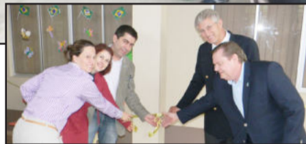
Descerramento da fita de inauguração das novas salas da APAE

A nova estrutura já está sendo utilizada e abriga uma sala para trabalhos da psicopedagogia e uma sala de aula. Atualmente a APAE de Teutônia conta com três profissionais fisioterapeutas, dois fonoaudiólogos, um assistente social, um terapeuta educacional, um auxiliar de cozinha, um secretário, seis professores, um psicopedagogo, um neurologista e dois estagiários.