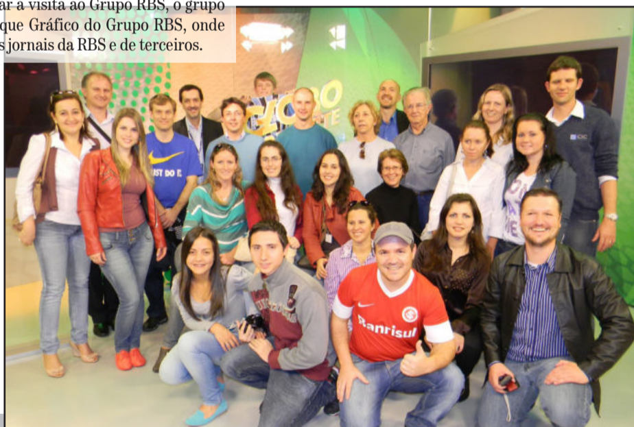
Alguns dos visitantes no estúdio do Globo Esporte, na RBS TV