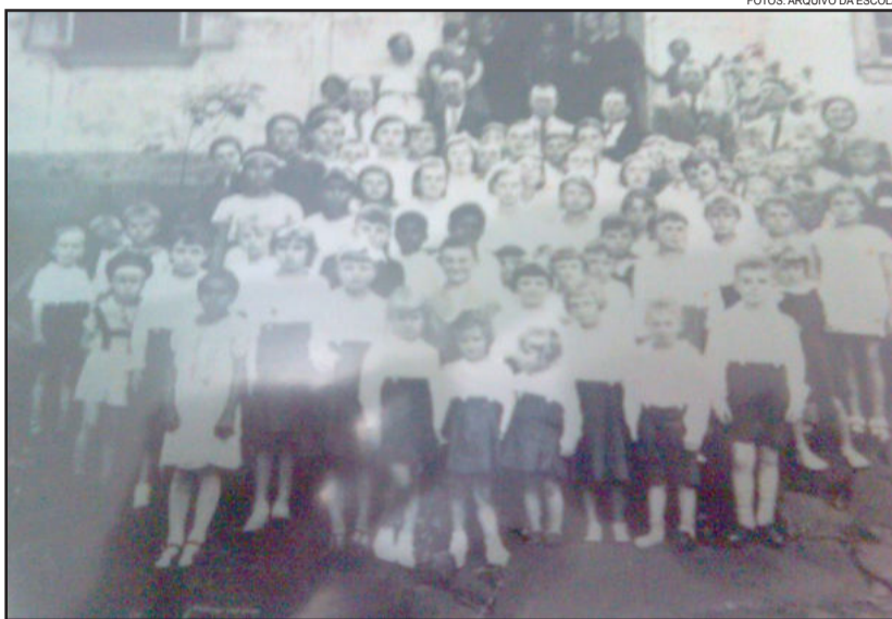
Em 1941, escola funcionava em prédio da Rua Carlos Arnt