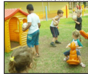
Momento de integração contou com brincadeiras no parque do Colégio Teutônia

O recreio de integração foi uma excelente oportunidade de aproximação entre os educandários e as crianças, com momentos de brincadeiras no parque do Colégio Teutônia. A iniciativa integrou as atividades