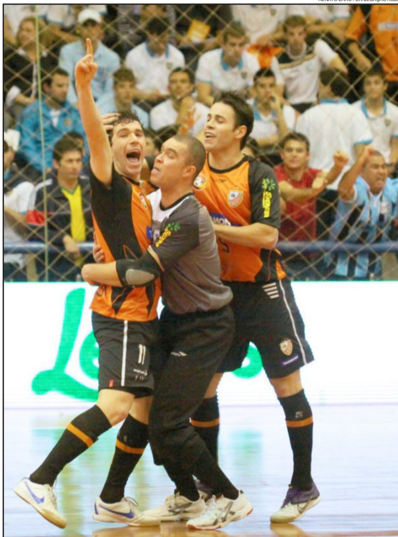
ACBF espera ginásio lotada para decisão pela semifinal da Liga Futsal neste domingo