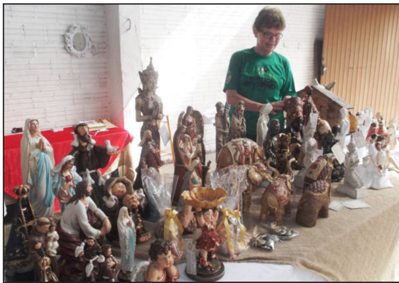
Imagens cristãs em gesso são bem vendidas com a proximidade do Natal