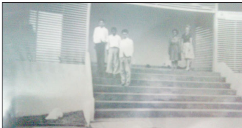
Prédio situado na Rua Tiradentes foi construído na década de 60, no antigo modelo das Brizoletas