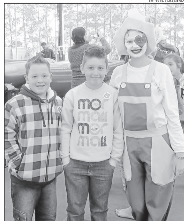
Palhaços animaram as crianças durante a festa