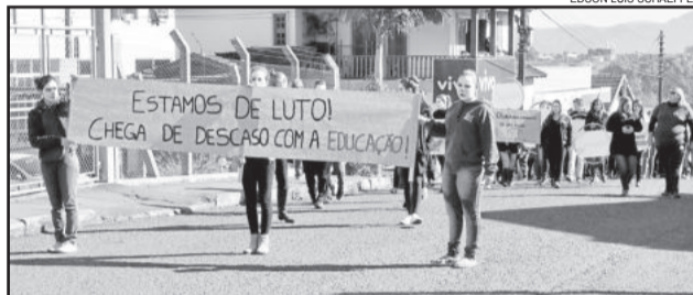
Alunos protestaram contra descaso com a educação

dos com essa situação. Porque, realmente, não entendemos como um Estado rico como o nosso passa por isso. E a gente tem que, de certa forma, ficar mendigando para a comunidade para poder tocar a escola", diz. Segundo ele, o educandário está com dificuldades para comprar material de limpeza e expediente, além de outras demandas.