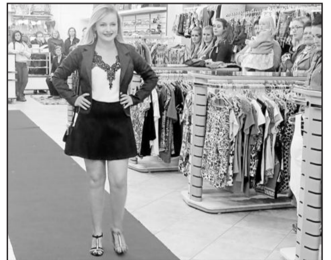
Modelos apresentaram os novos looks

As peças masculinas não fizeram parte do desfile, mas também fazem parte da nova coleção da loja. "Convidamos todos a vir conferir nossas novidades. Peças masculinas e femininas, saias, casacos e uma grande variedade de produtos", destaca Marla.