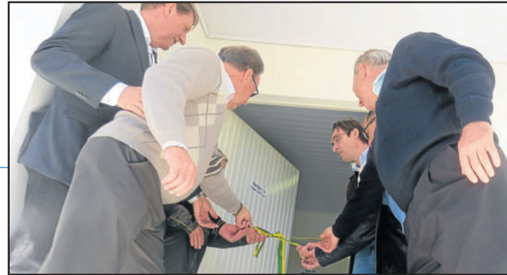
Desenlace da fita no momento da inauguração do entreposto

A solenidade ocorreu na manhã de sábado, dia 12, contou com a presença de autoridades, amigos e familiares do homenageado