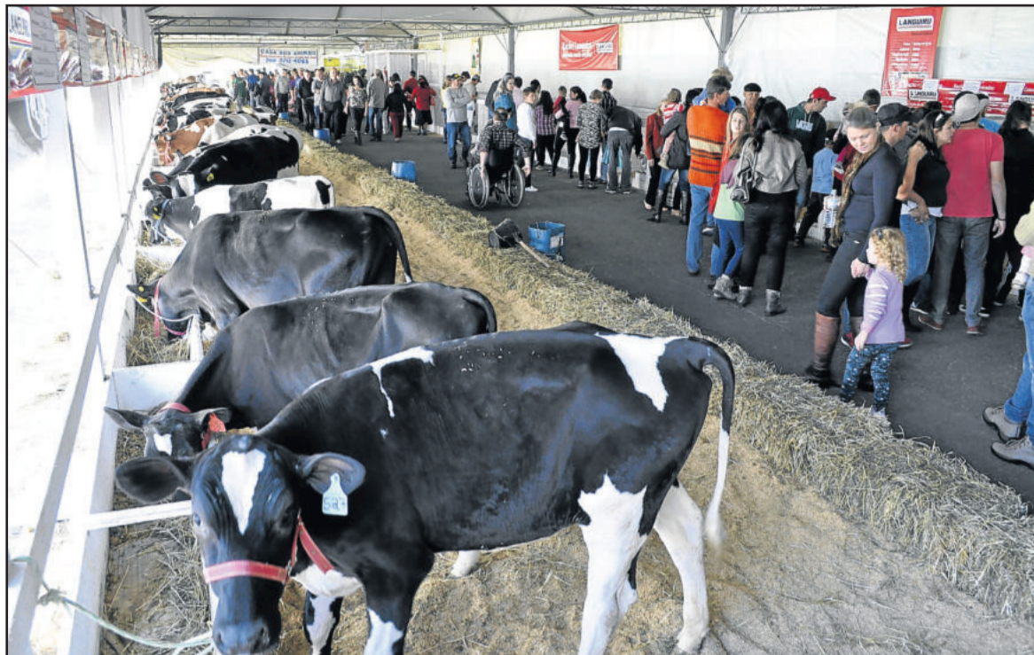
Exposição agropecuária foi uma das novidades da feira deste ano

município. O que mantém a cidade é a agricultura. Trazer a feira para o porto foi a melhor decisão, pois deu oportunidades ao setor primário em participar da feira”, enalteceu.