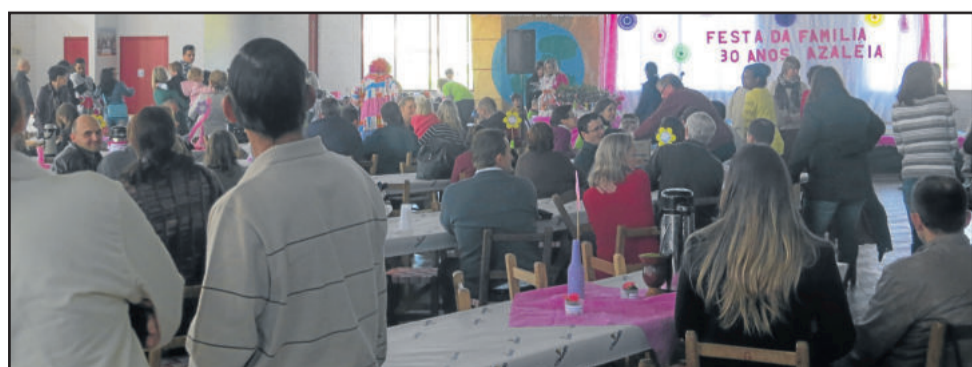
Pais, alunos e professores participaram do evento no sábado, dia 12

ajudar na ornamentação. Nas paredes, os pais puderam prestigiar os trabalhos realizados em sala de aula, expostos no dia do evento.