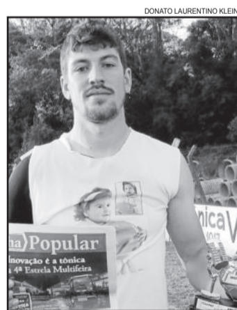
Colossi, do Ribereense, craque nos Titulares