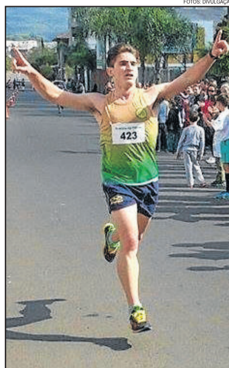
Em Encantado, vitória na categoria até 30 anos da Rústica da Independência