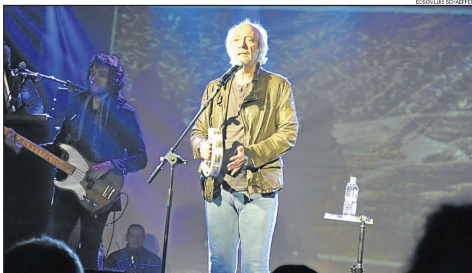
Erasmo Carlos foi a atração nacional da Estrela Multifeira