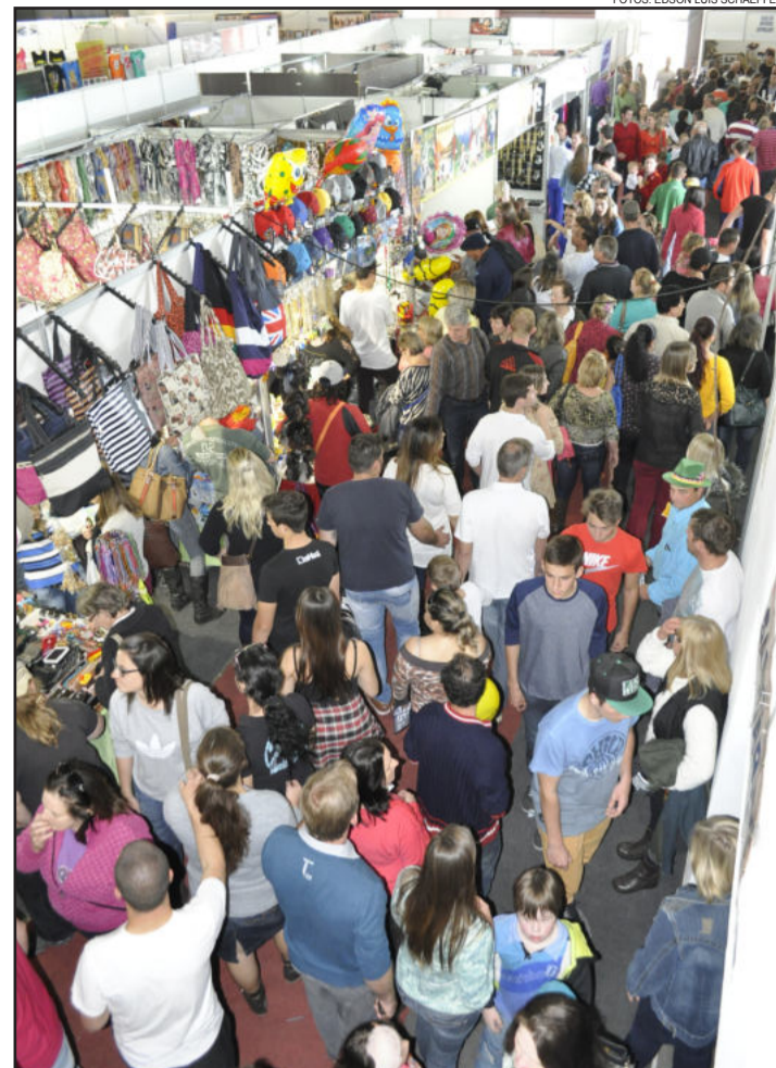
Corredores da exposição comercial, industrial e de serviços estiveram lotados no domingo

resultados da feira. “A feira foi um sucesso. Trabalhamos muito para essa feira acontecer e público reconheceu à altura. Concretizamos a Estrela Multifeira como um dos maiores eventos da região. Acertamos em cheio em trazer a feira para o porto”, afirmou.