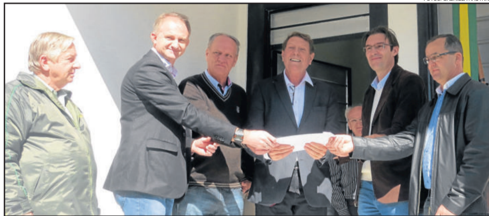
Entrega da cópia da Lei que denomina o Entrepasto de Mel Auro Kich