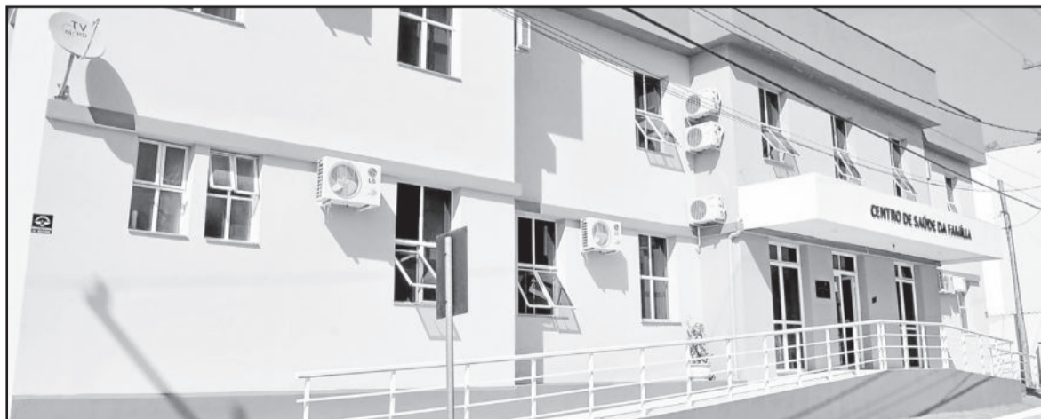
Centro de Saúde está em meio à polêmica