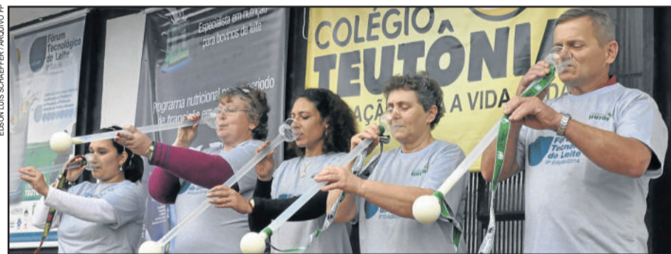
Concurso Leite em Metro será, novamente, uma das principais atrações do Fórum

Orientadores conduzirão os grupos na visita técnica. Em caso de chuva, as atividades também devem acontecer na SER Gaúcho.