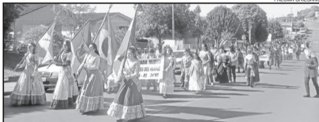
Passeio iniciou na Rua Carlos Arnt e se dirigiu até a sede do CTG

Este ano, o desfile não contou com a presença dos cavalarianos. Tradicionais nos desfiles Farrupilhas, este ano não puderam participar, devido aos problemas com a doença no mormo em todo Estado. Sem cavalos, o patrão acredita que o desfile foi prejudicado. "Para o tradicionalismo prejudica. O desfile é focado em cima dos cavalarianos. Mas como aconteceu esse problema do mormo, não podemos nos responsabilizar de botar o desfile com os cavalarianos. Mas faz muita falta; é um prejuízo bem grande", pontua.