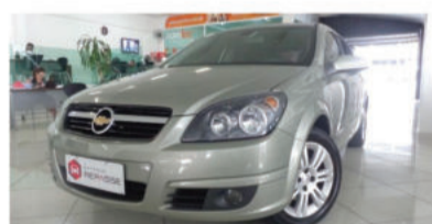
VECTRA GT 2.0 MPFI 8V - 2009 Bege, 4 portas, Flex - IRB-2805.