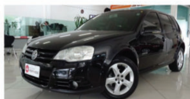
GOLF SPORTLINE 1.6 MI 8V - 2008 Preto, 4 portas, Flex - INU-3580.

VEÍCULOS COM OS MELHORES PREÇOS DO MERCADO