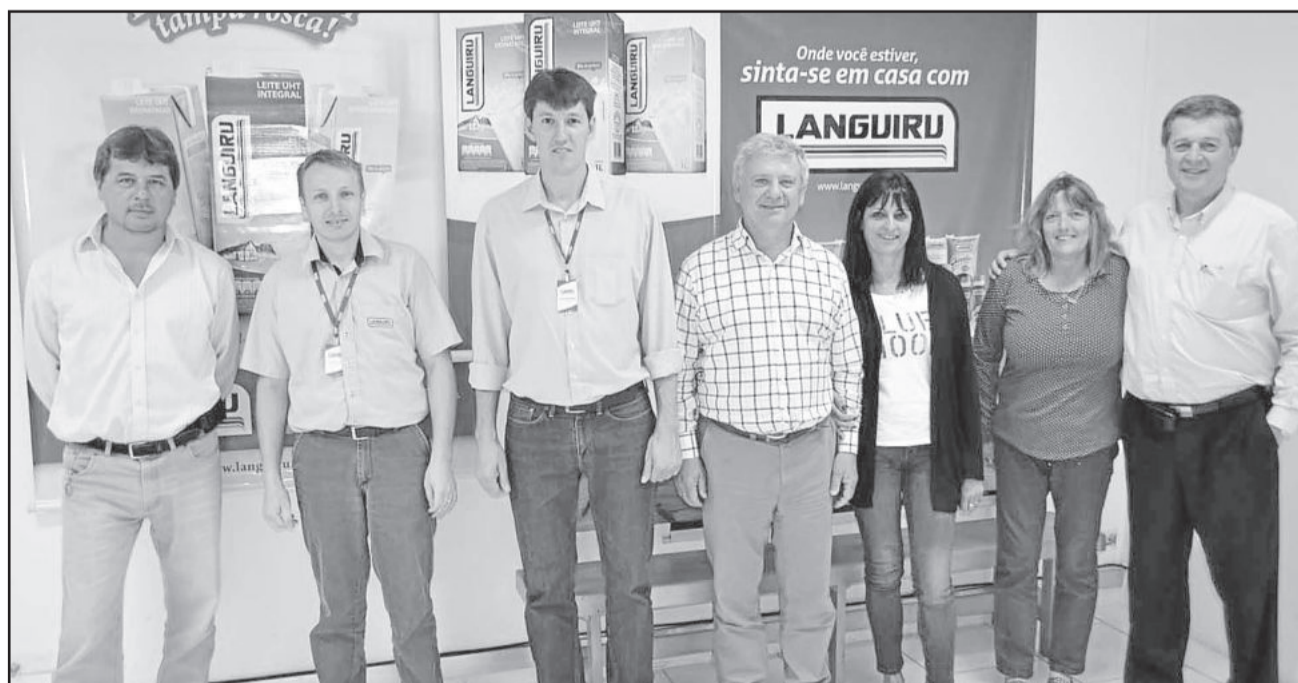
Argentinos da SanCor foram recebidos na Indústria de Laticínios da Cooperativa Languiru, em Teutônia

Produz mais de 150 produtos diferentes e exporta para mais de 30 países, entre eles Argélia, Venezuela, Chile, Estados Unidos, Cuba, Rússia, Paraguai, Peru, Senegal, Malásia, Brasil, Bolívia e Uruguai.