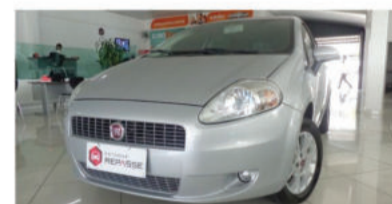
PUNTO ELX 1.4 8V - 2009 Prata, 4 portas, Flex - JVJ-6996.