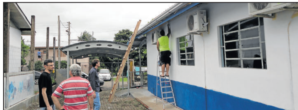
Implantação de calhas em escolas