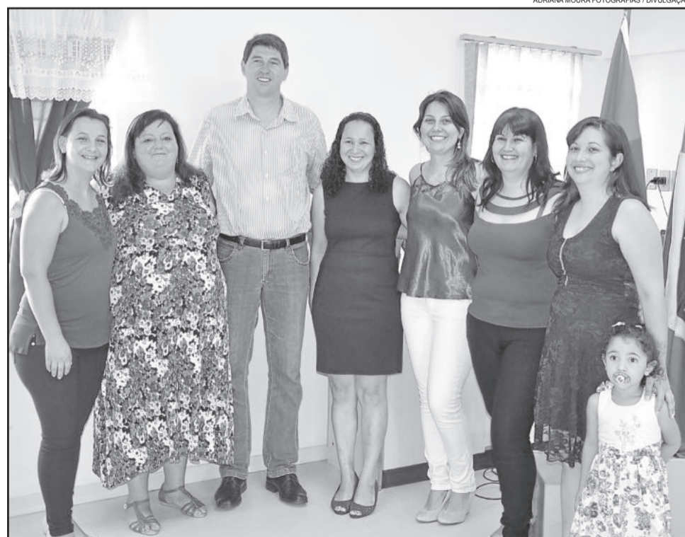
Prefeito Vanderlei Markus e novas conselheiras tutelares

Foi feito também um agradecimento às conselheiras tutelares que deixaram o cargo. As eleições sempre ocorrerão em todo o Brasil um ano após as eleições para Presidente da República. Os telefones de contato do Conselho Tutelar de Paverama são os seguintes (51) 3761-1141 e (51) 9955-2539.