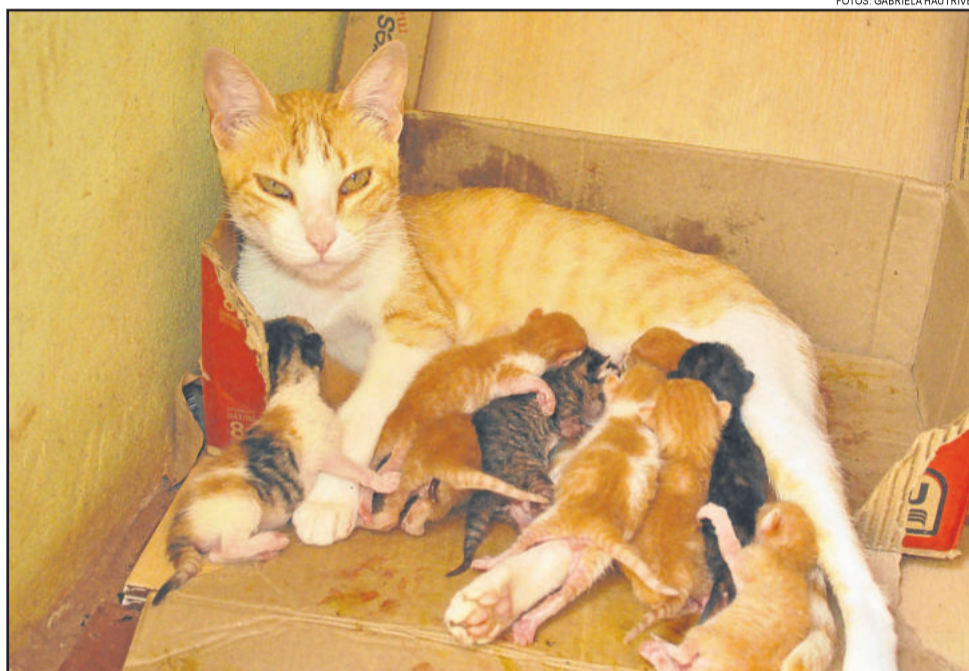
Alguns filhotes não conseguem espaço para se alimentar