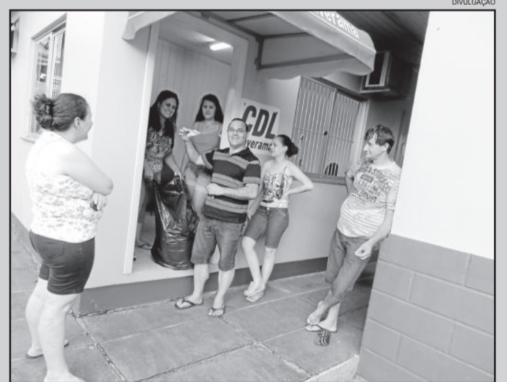
Momento do sorteio da CDL Paverama

O próximo sorteio está marcado para o dia 15 de abril. Na oportunidade, serão sorteados R$ 2 mil em dinheiro, e dois vale-compras de R$ 1 mil. O terceiro sorteio será após o Dia das Mães e terá como prêmio uma Biz 100 OKm.