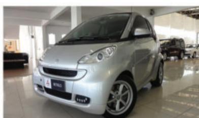
SMART FORTWO PASSION 1.0 TURBO - 2012 Prata, 2 portas, Automático, Gas. - IVX-3491.