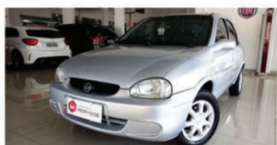
CORSA SEDAN CLASSIC 1.0 MPFI 8V - 2003 Prata, 4 portas, Gasolina - IKZ-6710.

Desembaçador traseiro, Rádio e CD Player. R$ 13.900