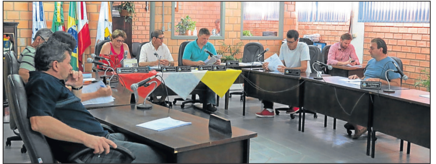
Câmara realizou primeira sessão do ano