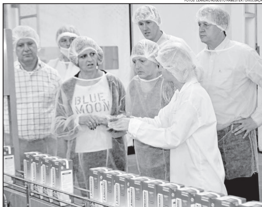
Grupo elogiou acolhida, variedade e qualidade dos produtos Languiru

Por fim, os argentinos convidaram a cooperativa teutoniense a visitar a SanCor no país vizinho, em especial a unidade de industrialização e comercialização de produtos lácteos em Sunchales. Inclusive, está prevista visita técnica dos jovens que participam do Programa de Sucessão Familiar da Languiru à Argentina, programada pa-