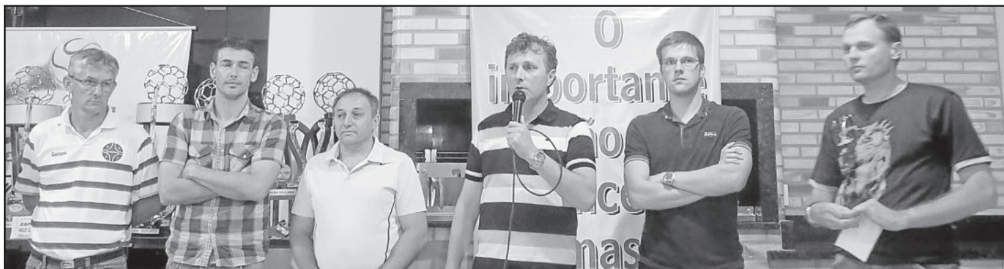
Membros da diretoria da Acate