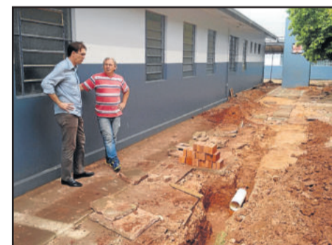
Melhorias na drenagem em escolas