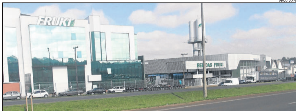
Matriz da Bebidas Fruki fica situada às margens da BR-386, em Lajeado

- Incentivos fiscais via Fundopem/Integrar, da Secretaria do Desenvolvimento do Estado - almeja ter um bom índice do Integrar; - Tamanho da área - precisa ser uma área de terras grande, de aproximadamente 100 hectares; - Terreno não pode necessitar de muita terraplenagem, uma vez que é cara; - Proximidade com uma rodovia - frente para uma BR ou ERS.