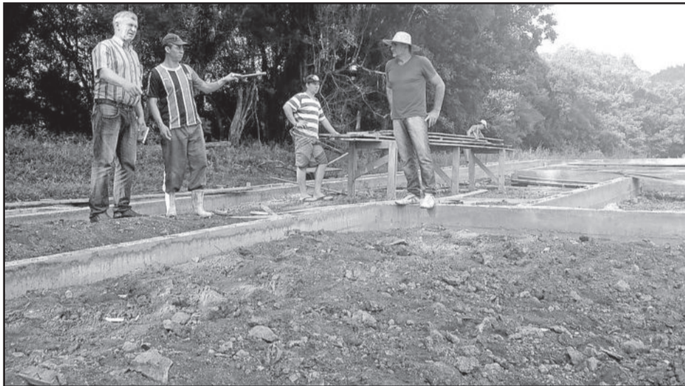
Centro de Eventos já está sendo construído

de eventos. "A equipe já trabalha na base da construção que dimensiona o tamanho do Centro Municipal de Eventos, que será mais uma opção para atender as entidades westfalianas. Além disso, será mais uma atração do grande Parque de Eventos Municipal que está sendo construído", comentou Landmeier.