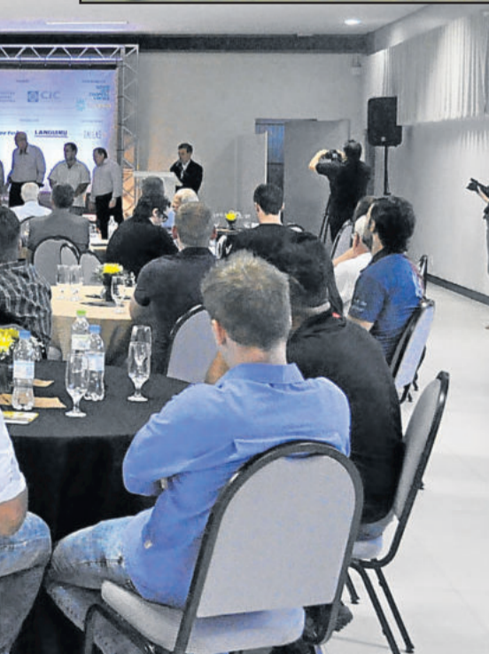
Convidados, autoridades e imprensa

>>> Mais detalhes sobre a Festa de Maio 2016 pelas redes sociais, na página do Facebook - Festa de Maio de Teutônia RS - e pelo site oficial do evento - www.festademaiodeteutonia.com.br .