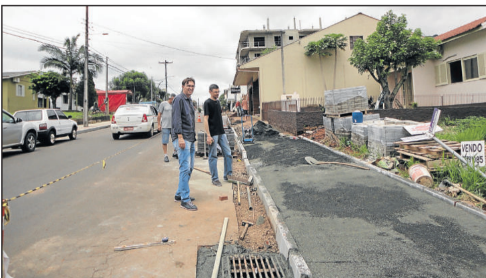
Trechos das ruas Major Bandeira e 3 de Outubro receberão calçadas padronizadas