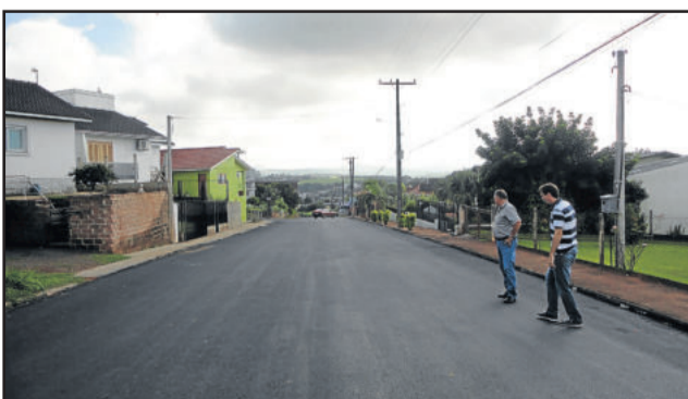
Rua Ernani Júlio Sippel recebeu capa asfáltica