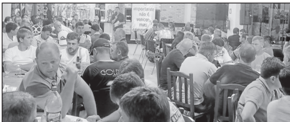
O lançamento ocorreu na noite de quinta-feira, no Encontro da Bola, em Teutônia

Outro destaque importante feito pelo organizador é referente aos jogadores que pertencem a determinados clubes e estes não estarão participando das competições em 2016. Na Taça da Amizade, os atletas não podem defender a camisa de outros times, mesmo não tendo sua equipe em atividade. Já no Campeonato Municipal, todos os jogadores foram liberados para jogar em outras equipes. Essas decisões foram tomadas pelos próprios clubes, através de votação.