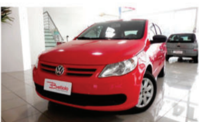
GOL 1.0 MI 8V - 2012 Vermelho, 4 portas, Flex - IUE-7952.

Ar condicionado, Rádio e CD Player. R$ 23.900