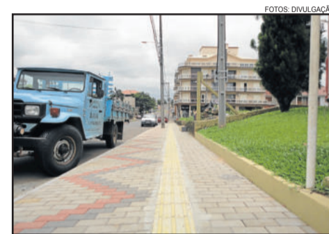
Revitalização das calçadas de Languiru

Biondo e o secretário de Obras visitaram os dois novos reservatórios em inox e com capacidade de 96 metros cúbicos, (96.000) litros cada, com 11 metros e 90 centímetros de altura. Os reservatórios foram instalados na Rua Osvaldo Dienstmann, quadra 294, Bairro Canabarro. O investimento foi de R$ 190 mil, com recursos próprios do município. Este investimento se torna importantíssimo para a melhoria no abastecimento de água do Bairro Canabarro.