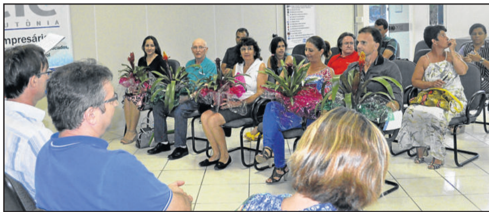
Os cinco empossados ganharam um mimo do Comdica