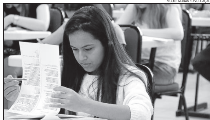
Prova única de redação será aplicada no dia 24 de janeiro

Também recebem inscrições os processos seletivos para Medicina e Odontologia