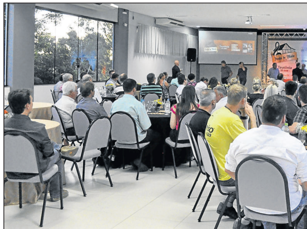
Lançamento da grade de shows foi realizado no auditório da CIC e reuniu co