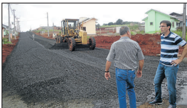
Rua Guilherme Schneider Sobrinho está em obras