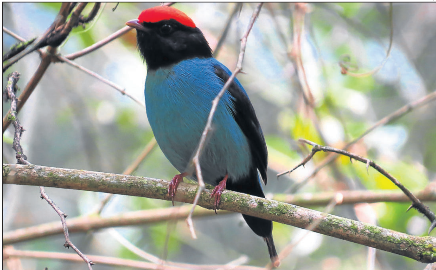
Espécie Chiroxiphia caudata (Tangará) será uma das observadas no Jardim Botânico

A observação será acompanhada por ornitólogos e observadores de aves experientes da região, com o intuito de auxiliar os participantes a identificar as aves através da visualização e do