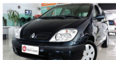
SCÉNIC EXPRESSION 1.6 16V - 2004 Azul, 4 portas, Flex - ILS-9408.