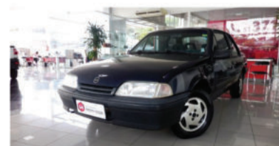
MONZA SL 2.0 8V - 1993 Azul, 2 portas, Álcool - BET-7668.

Desembaçador traseiro, Rádio e CD Player. R$ 13.900