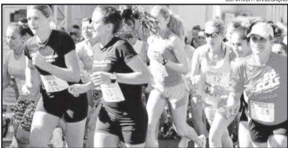
Mulheres poderão correr distâncias de 3Km ou 5Km ou caminhar 3Km