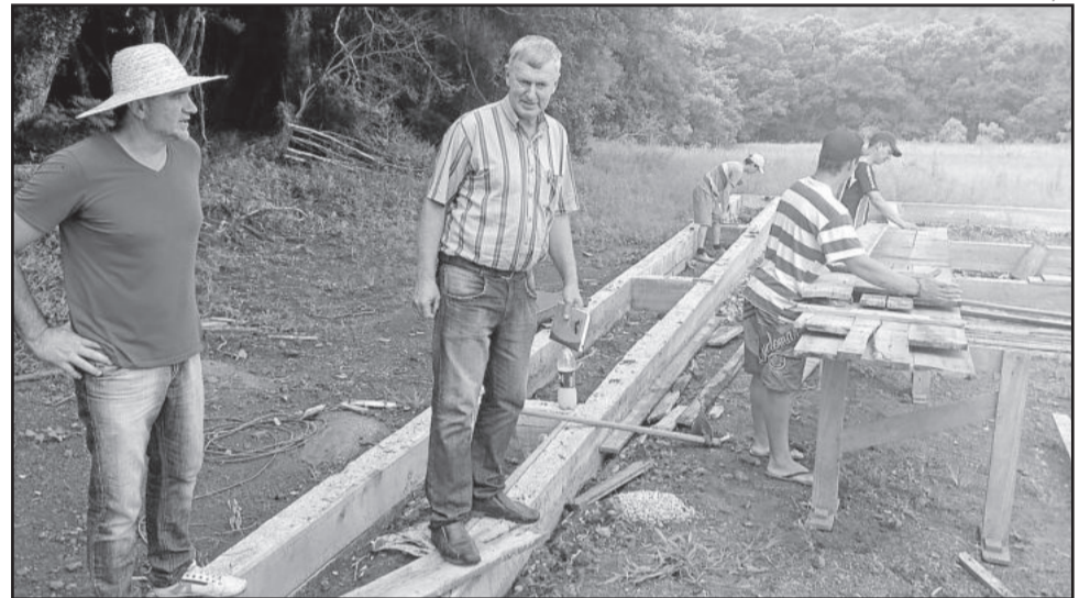
Bagatini e Landmeier acompanham obra de perto