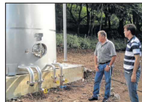
Implantação de reservatórios de inox