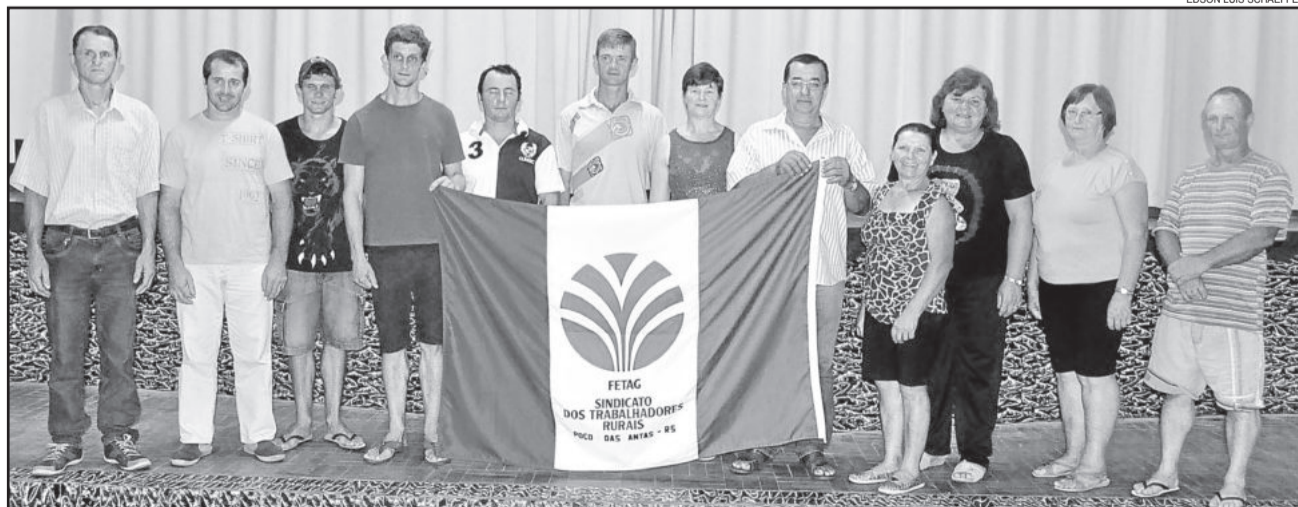
Nova diretoria foi empossada na terça-feira