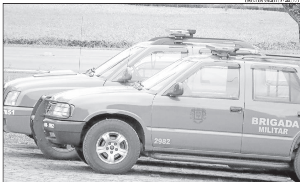
Brigada Militar do Vale do Taquari modificou a atuação em função da falta de policiais

Quem tem assinatura de jornais e revistas é importante entrar em contato com a empresa responsável e pedir a suspensão do serviço por determinado período ou pedir para que algum amigo ou familiar recolha o material. Para quem tem pátio com grama, ele indica que contrate um jardineiro para aparar a grama. “A aparência de abandono nas residências chama a atenção dos criminosos”, pondera.