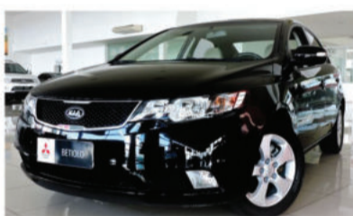
CERATO EX 1.6 16V - 2010 Preto, 4 portas, Gasolina - ITG-8142.