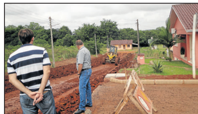
Rua Princesa Daiana receberá asfaltamento