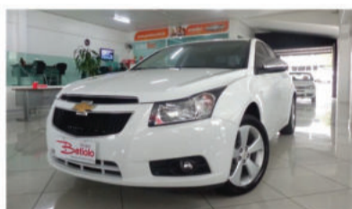
CRUZE LT 1.8 ECOTEC 16V - 2012 Branco, 4 portas, Automático, Flex - FPC-5001.