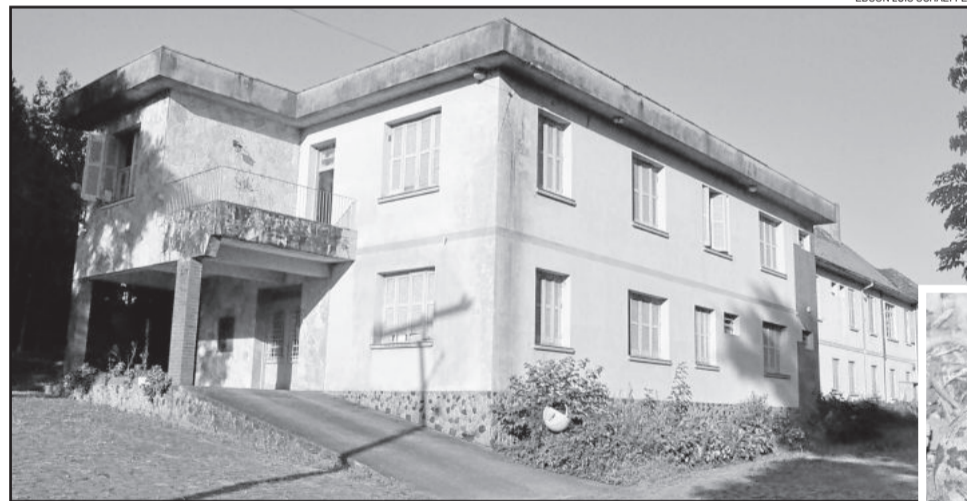
Por muito tempo, o antigo hospital de Poço das Antas foi referência em aplicação de soros antiofídicos

De acordo com a bióloga, 80 a 90% dos ataques de cobras no Estado são de jararacas e cruzeiras, espécies para as quais o baixo estoque de soro mais preocupa. Já os medicamentos contra picadas de cascavéis e corais também estão em estoque baixo, mas o número de ataques também é menor. “No ano passado, tivemos só dois ataques de corais registrados”, informa. O estoque de antídotos para picadas de aranha está em situação administrável no Estado.