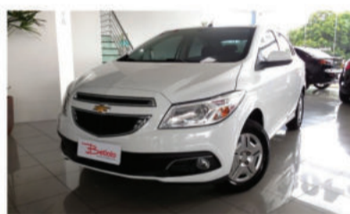
PRISMA LT 1.0 SPE/4 8V - 2013 Branco, 4 portas, Flex - JDC-2929.