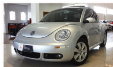
NEW BEETLE 2.0 MI 8V - 2010 Prata, 2 portas, Gasolina - FVF-4245.