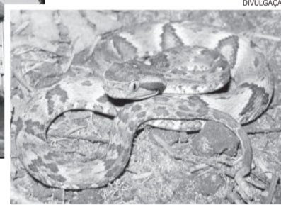
Os ataques de jararaca são os mais frequentes, mas estoques de soro estão reduzidos