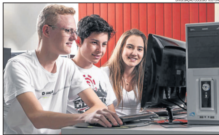
DIVULGAÇÃO COLÉGIO TEUTÔNIA

A grande procura pelos cursos profissionalizantes do CT está baseada no diferencial de sua proposta técnico-pedagógica, associada à qualificação do corpo docente. “Nossa proposta destaca o viver e o conviver no espaço escola, espaço onde o ensinar e o apren-