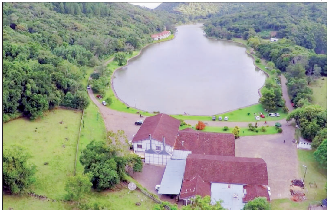
Lagoa da Harmonia sedia mais um evento diferenciado

Toda corrida será regada com muita música e após o término da competição haverá apresentação da banda de rock Balaio de Gato. Os interessados em participar já pode realizar a inscrição, que até dia 10 de fevereiro tem preço promocional. Ela pode ser feita no endereço http://valdoesporte.com.br/site/inscricao/evento/id/931 . O evento é organizado pela HÁ Eventos Esportivos e tem apoio de Empório Gastrô e Lagoa da Harmonia.