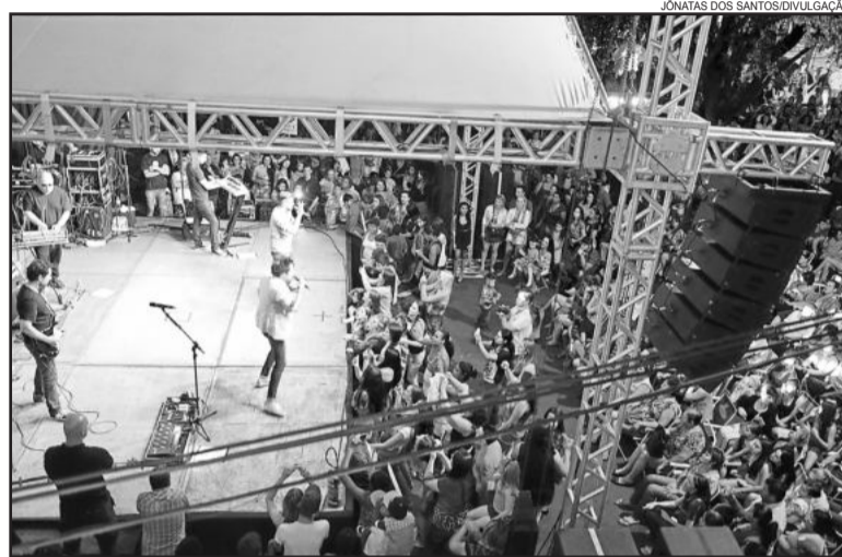
Dupla sertaneja Lucas e Felipe foi uma das atrações

Sexta-feira tem show para gaúcho nenhum botar defeito. A Secre-