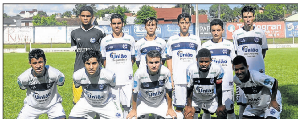
São José, de Porto Alegre