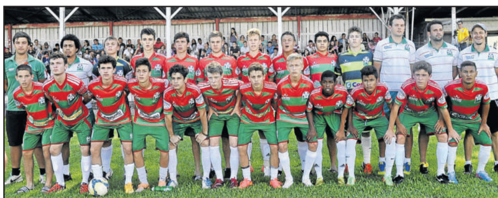
Juventus, de Teutônia