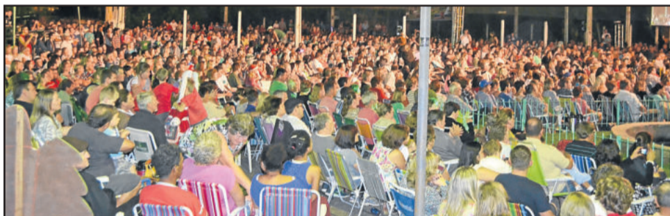
Centenas de pessoas lotaram a Praça dos Pássaros