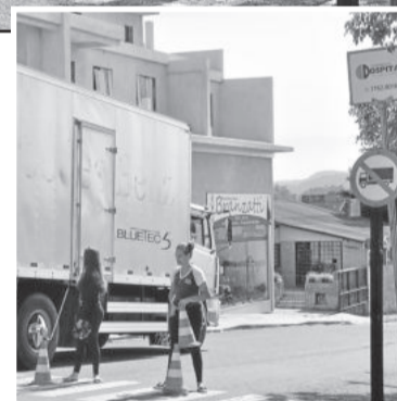
Enquanto colocavam cones na via, um caminhão seguiu na contramão

O pedido de mais educação está para os caminhoneiros em entender que na escola tenta-se estudar e aos órgãos públicos fica o pedido de respeito pelos 75 anos da Escola Reynaldo Affonso Augustin.