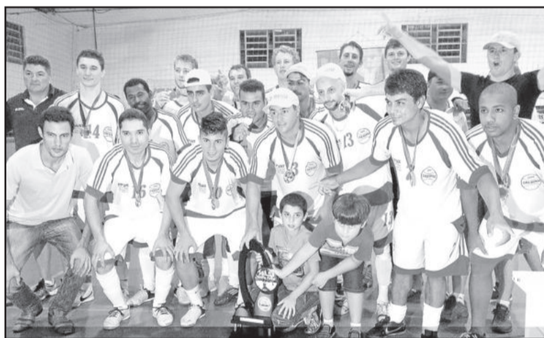
Gira Mundo, campeão do Força Livre