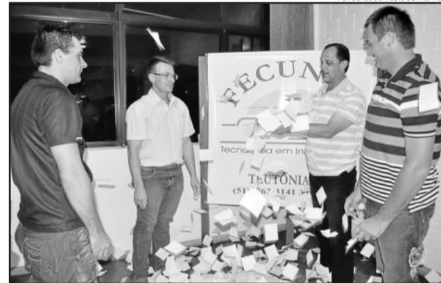
Sorteio premiou um produtor com uma novilha