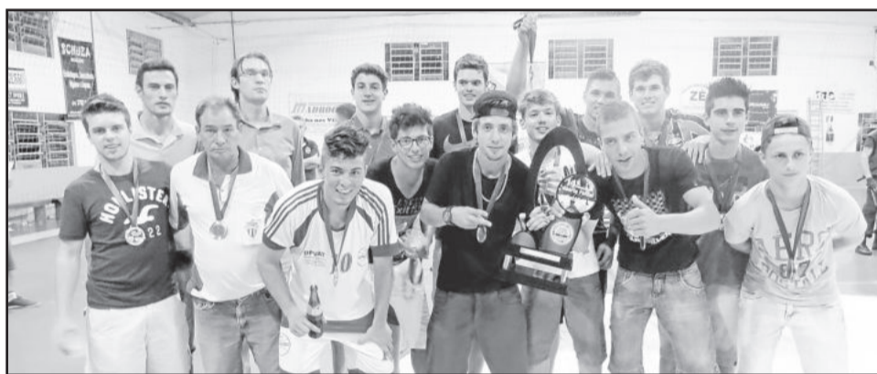
Campeão do Sub-20, Amigos do Queiroz