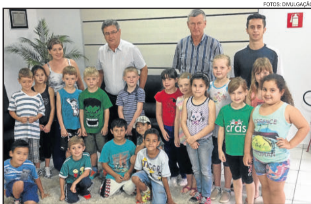
Prefeito e vice-prefeito receberam as crianças no gabinete