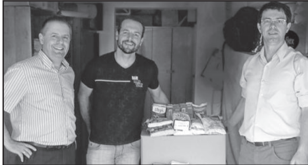
Para a Comunidade Católica de Canabarro

A Sicredi Ouro Branco agradece todos os participantes por proporcionar a solidariedade junto às entidades da nossa região.