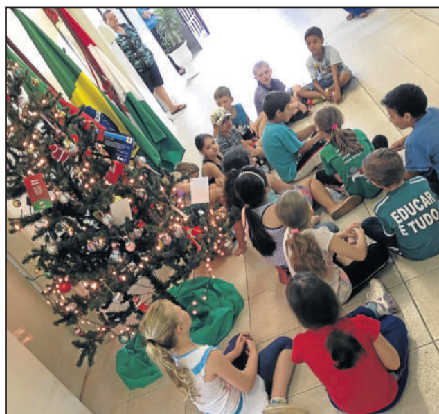
Alunos cantaram ao redor do pinheirinho