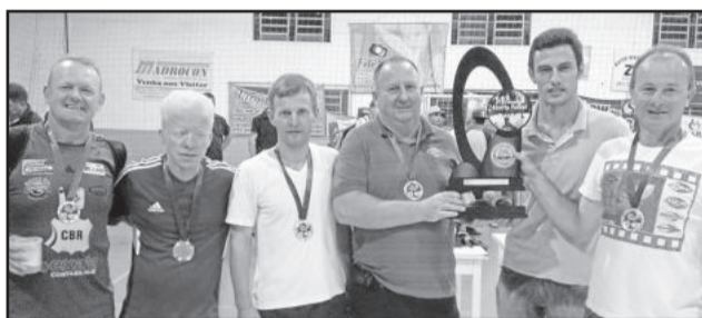
Campeão do Veterano, Viévi Automóveis