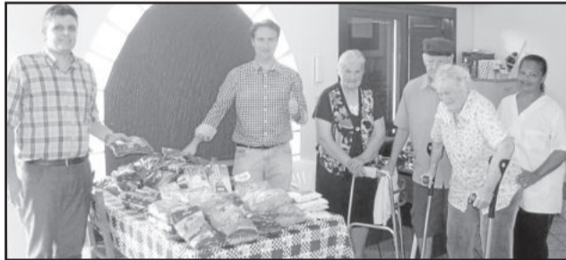
Lar de Idosos Ressoar, no Bairro Alesgut, Teutônia