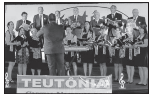
Coral São Jerônimo