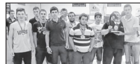
IMEEC vice-campeão do Sub-20