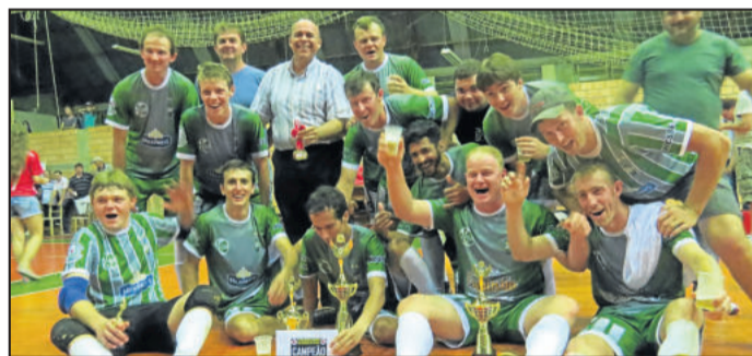
Campeões no Força Livre, Morro do Alemão