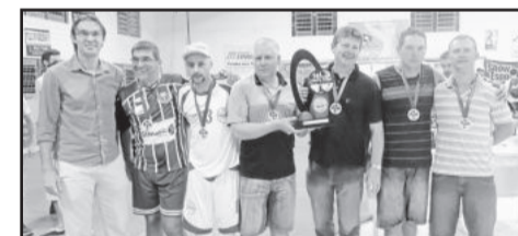
Vice-campeão do Veterano, Super Link