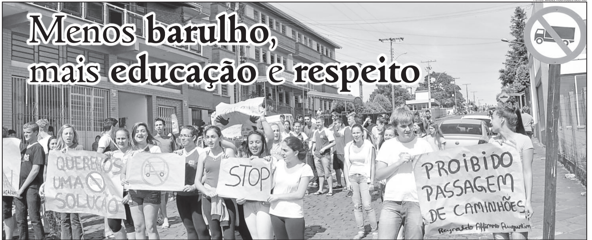
Cansados do barulho dos caminhões, alunos do ensino médio protestaram ontem pela manhã, bloqueando a passagem dos veículos na quadra diante da escola