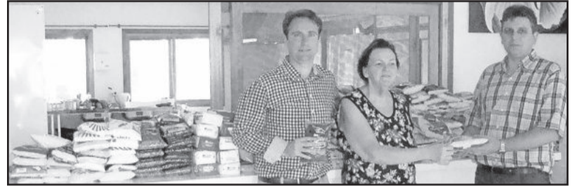
Lar de Idosos Trindade - Boa Vista Fundos, Teutônia