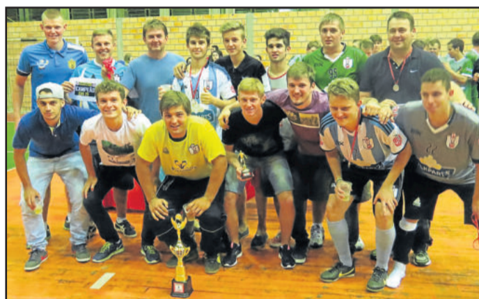
Saidera ficou campeão no Sub-20