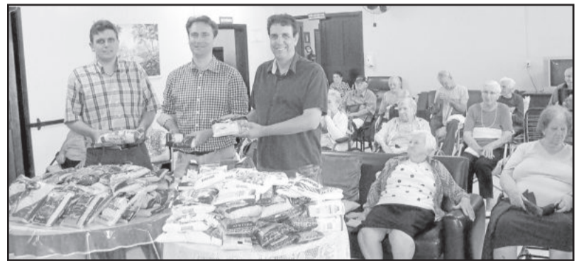
Lar de Idosos Opa Haus - Bairro Teutônia, Teutônia