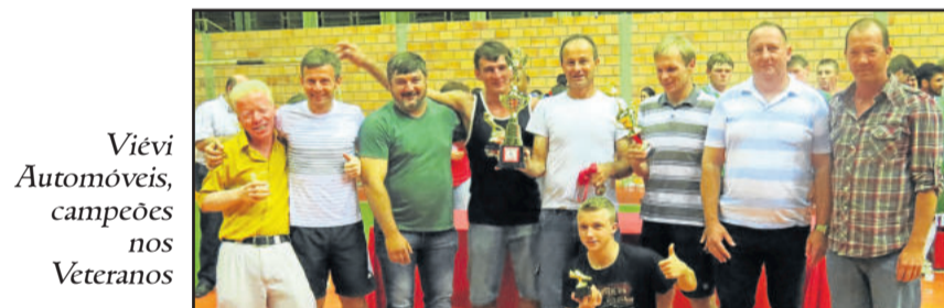
Viévi Automóveis, campeões nos Veteranos