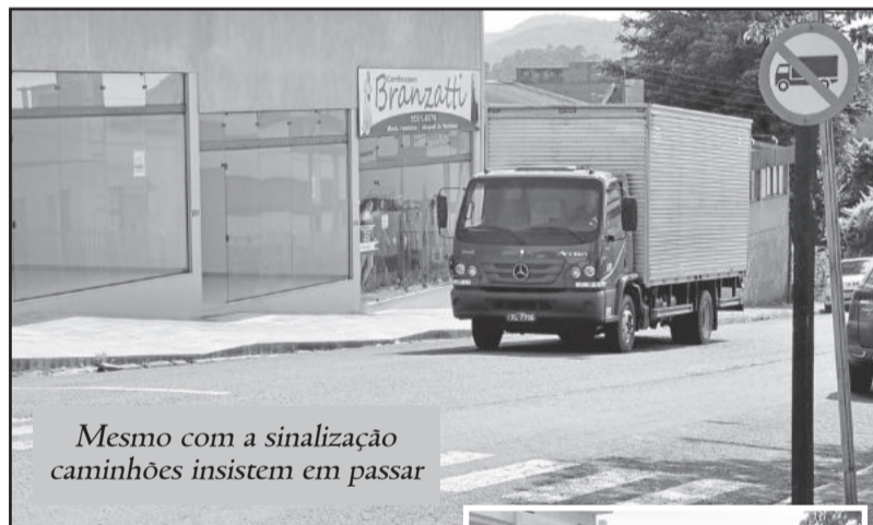
Mesmo com a sinalização caminhões insistem em passar

outro caminhão. Mesmo com placa de proibição, parece que ela nem existe. Uma solução que poderia ser feita é colocar policiamento, pelo menos nos períodos de maior fluxo. Nas primeiras semanas não precisaria multar, mas em uma medida educativa, alertando e depois ficar mais um tempo cobrando, autuar, multar se for o caso. Não vejo outra alternativa a não ser mexer no bolso do sujeito", aponta.