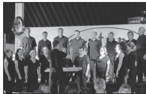
Coral Municipal de Teutônia