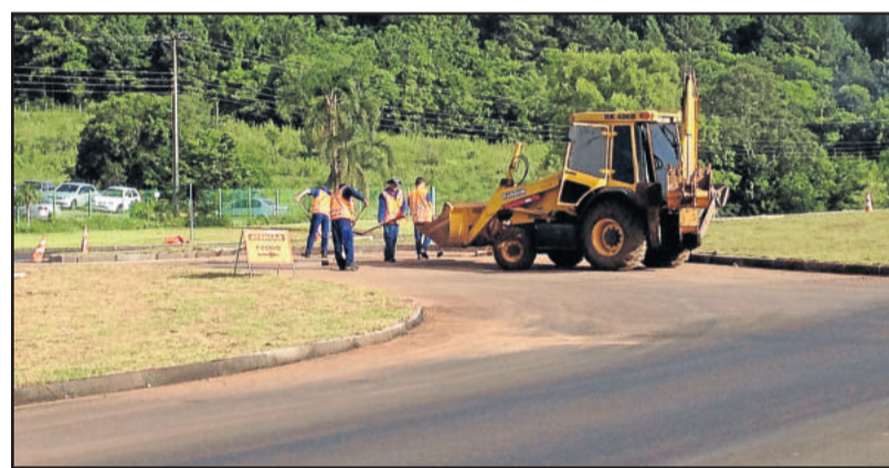
Construtora Giovanella está concluindo obras com antecedência

649.428,95 através da Construtora Giovanella. O custo dos serviços será pago com o dinheiro arrecadado no pedágio de Boa Vista do Sul. A EGR administra, desde junho de 2013, dois trechos da RSC-453: um, de 56,7 quilômetros, entre Estrela e Garibaldi e outro, de 29,45 quilômetros, entre Venâncio Aires e Lajeado. Nos dois trechos, a EGR está promovendo obras de recuperação e restauro do pavimento desde março deste ano. Um consórcio formado pelas empresas Conpasul, Giovanella e Simonaggio está executando o serviço.