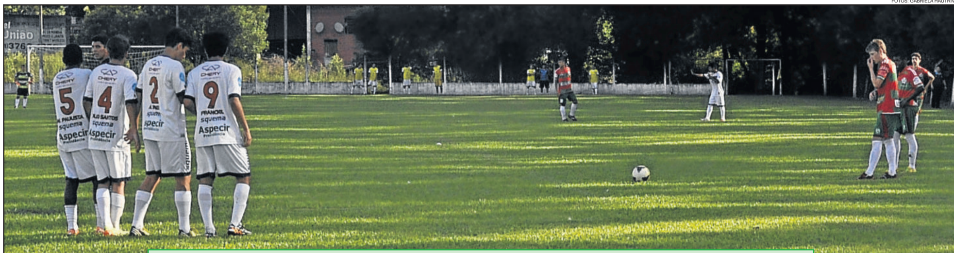
Juventus tentou, mas não conseguiu segurar o São José na primeira partida da final