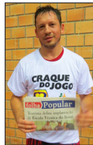
Lazinho do Viévi Automóveis foi eleito o Craque do Jogo nos Veteranos