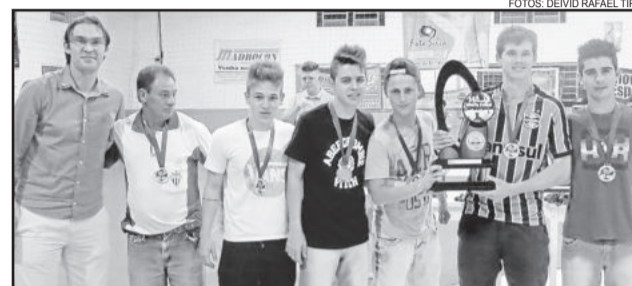
Amigos do Queiroz, campeão no Sub-17