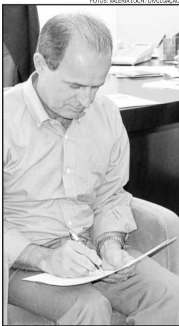
Prefeito Antonio Cettolin assina o termo

A Administração Municipal assinou, no dia 11 de dezembro, um termo de parceria para a construção de um novo empreendimento imobiliário, que possibilitará a construção de 97 unidades habitacionais, na Rua Bella Visione, localizada no Bairro Alfândega.