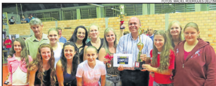
Morro das Alemoas, campeãs no Feminino

A 1ª Copa Irmãos Schneider/Só Alegria reuniu 25 equipes, distribuídas em quatro categorias, que competiram desde o dia 23 de agosto.