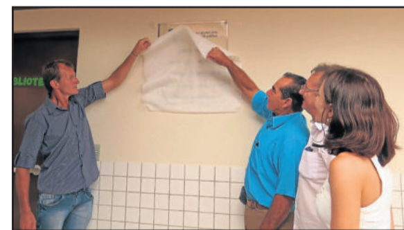
Autoridades fizeram o descerramento da placa inaugural