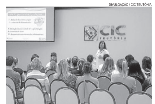
Palestra contou com 40 participantes

A palestrante ainda frisou motivos para que as empresas participem do Liquida Teutônia: o comércio vive de promoções, concorrência com campanhas de outras cidades, obsolescência dos produtos, redução de custos promocionais, liberar espaço, obter lucro e enfrentar a crise. Além disso, ainda elencou sete passos para uma liquidação de sucesso: