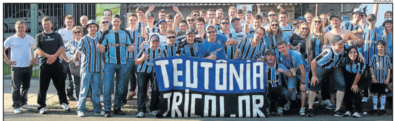
Evento tricolor acontecerá na quinta-feira, na Associação dos funcionários da Languiru (MiMi)