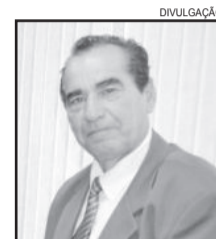
Prefeito de Fazenda Vilanova, Pedro Antônio Dornelles