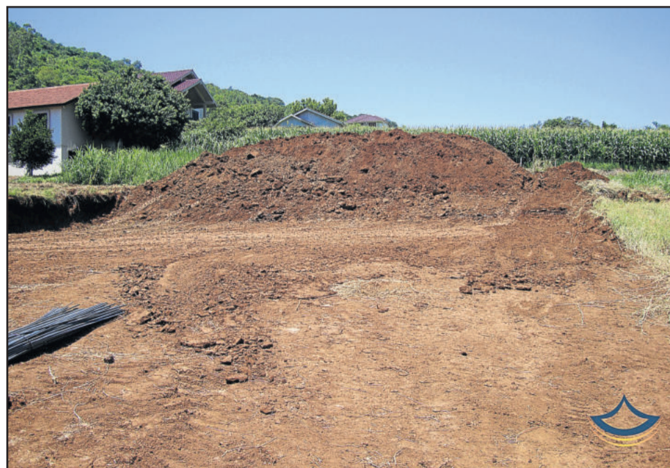
Nas próximas edições de terças-feiras, a Folha Popular vai acompanhar todas as etapas de construção de uma casa: a obra desde o seu início até a finalização