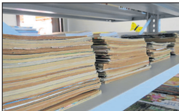
Novo educandário conta, ainda, com biblioteca