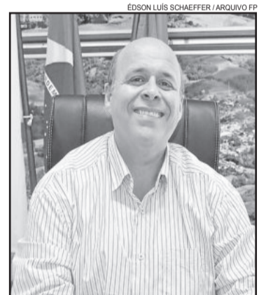
Prefeito de Imigrante, Celso Kaplan