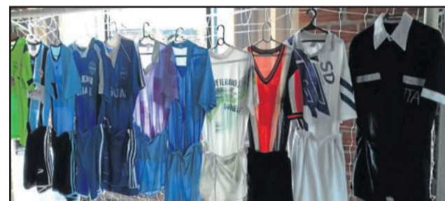
Fardamentos de várias temporadas foram expostos

Em campo, atletas atuais e ex-atletas do clube fizeram uma partida amistosa. No tempo normal, empate em 2 a 2. Nas cobranças de pênaltis (direto sequência alternada), o time de camisa Tricolor venceu o time de Azul Claro por 2 a 1.