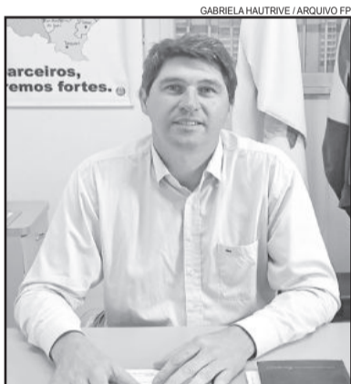
Prefeito de Paverama, Vanderlei Markus