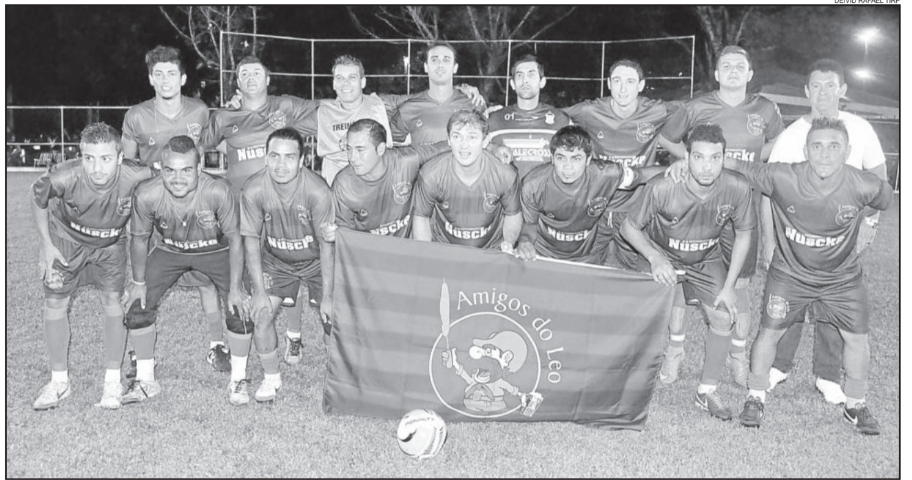
Amigos do Léo/Amaral DPVAT goleou o Baile de Munique

A última rodada da primeira fase será realizada na próxima quarta-feira, dia 17, e contará com quatro jogos divididos em três categorias (Master, Sub-20 e Força Livre). Na sexta-feira, dia 19, começam os jogos de mata-mata do Força Livre e do Master.