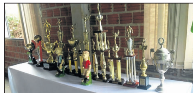
Troféus marcam conquistas do clube

A disponibilidade está condicionada a análise de crédito do associado. SAC Sicredi - 0800 724 7220 / Déficit Auditivos ou de Fala - 0800 724 0525. Ouvidoria Sicredi - 0800 646 2519.