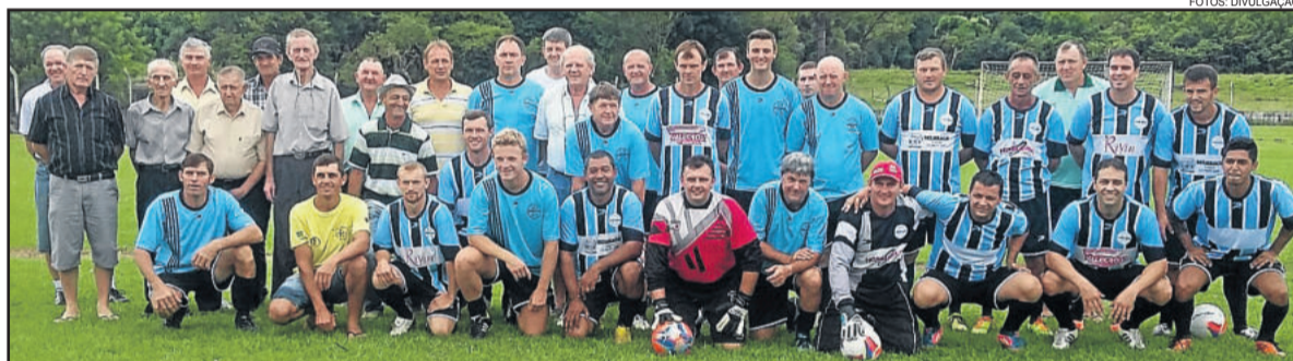
Jogo de integração reuniu atletas e ex-atletas do clube