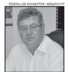
Prefeito de Westfália, Sérgio Marasca