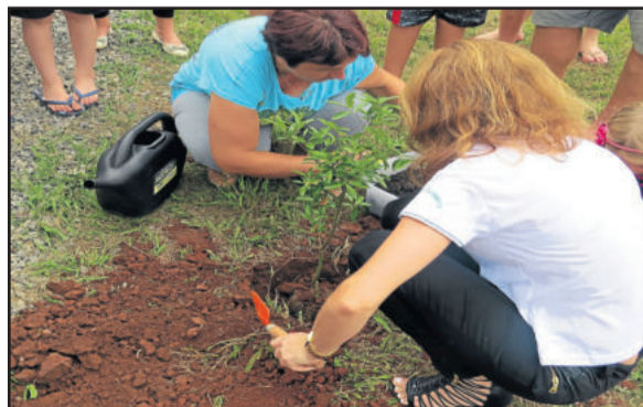
Plantação de muda de cerejeira marcou a inauguração