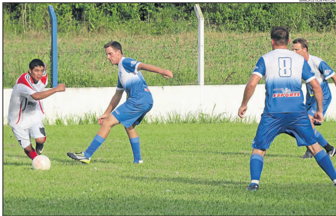
União da Germano de Dari (com a bola) venceu de virada ao Avante

Na próxima rodada, domingo, dia 21, o Avante vai a São Jacó enfrentar o Alto Taquari. Já o União joga em casa, diante do Ribeiense.