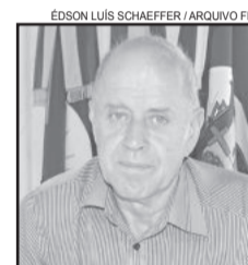
Prefeito de Poço das Antas, Glicério Ivo Junges