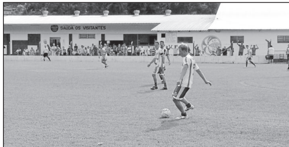
Mesmo com jogador a menos, Juventude fez seu gol, mas não conseguiu segurar a vitória