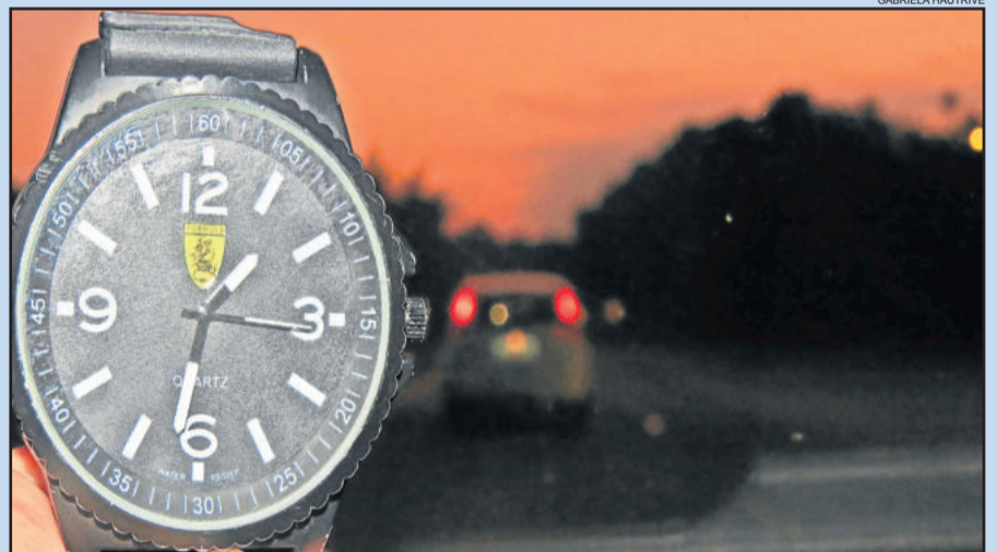
À 0h de domingo, é preciso atrasar o relógio em uma hora