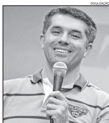
Prefeito de Taquari, Emanuel Hassen de Jesus