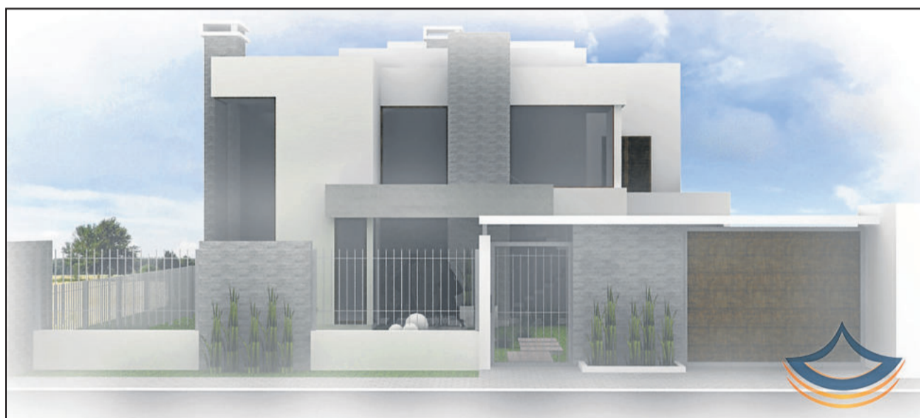
O projeto da casa já está pronta e obra será acompanhada também pelos proprietários