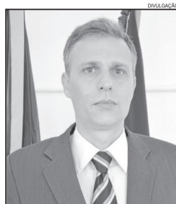
Prefeito de Estrela, Carlos Rafael Mallmann