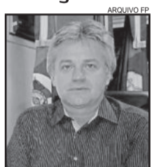
Prefeito de Teutônia, Renato Airton Altmann