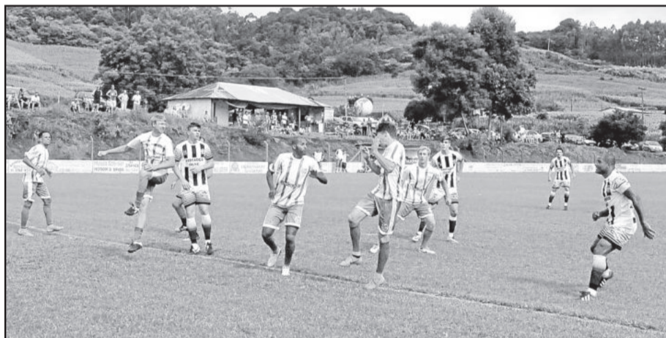
Ecas e Juventude fizeram um bom jogo na Linha Berlim