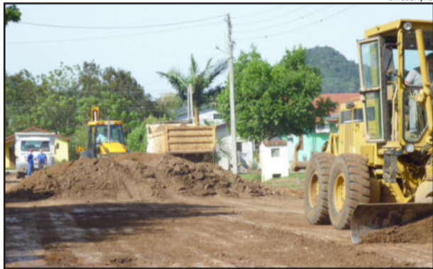
Rua 24 de Março será asfaltada