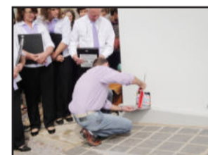
Fechamento da Urna do Tempo foi um dos atos da solenidade inauguração