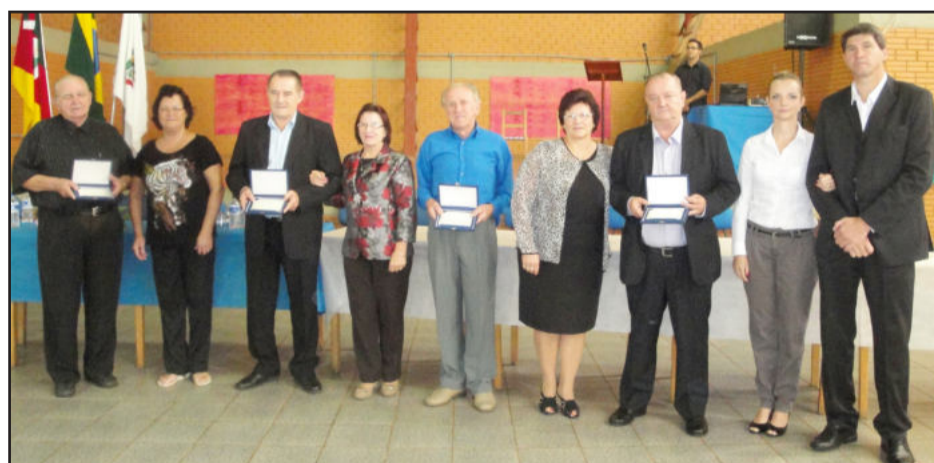
Ex-prefeitos foram homenageados