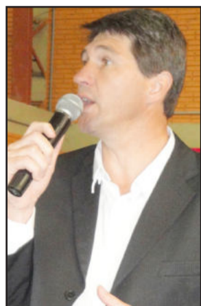
Prefeito Vanderlei Markus