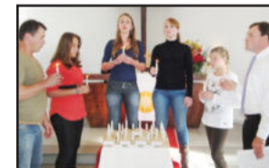
Coral Ecumênico Jovem