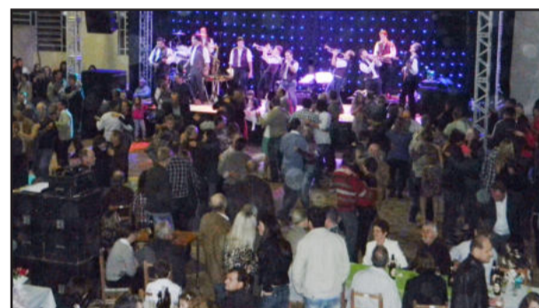
Público de diversas cidades esteve presente no baile, que foi um dos maiores da SUBV até hoje