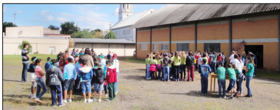
Gincana cultural mobilizou alunos do município