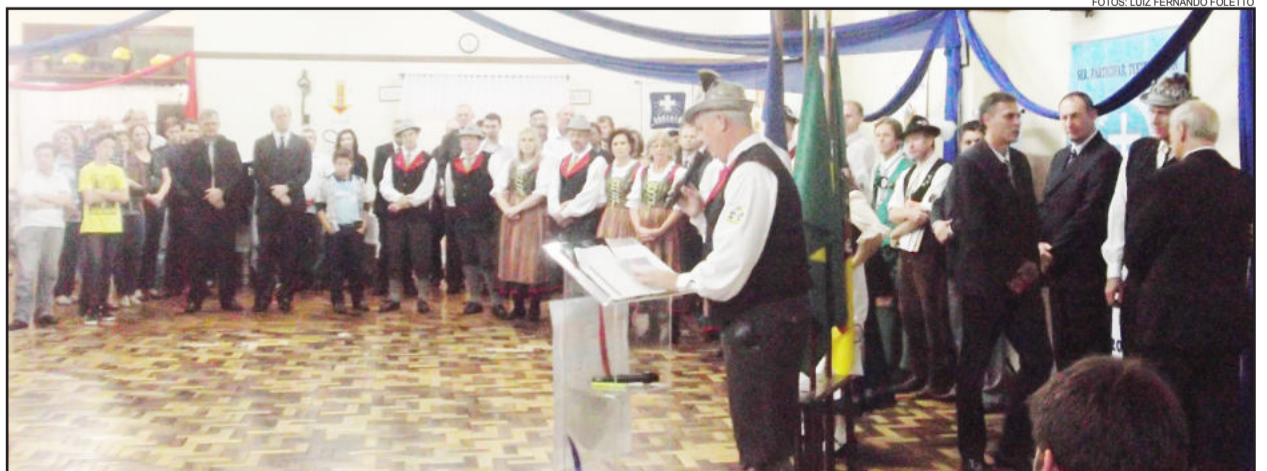
No lançamento foi apresentada a programação do Festival