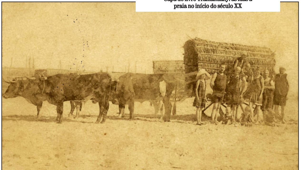
Família em trajes de banho ao lado da carreta de bois levava os banhistas do hotel Sperb até a praia