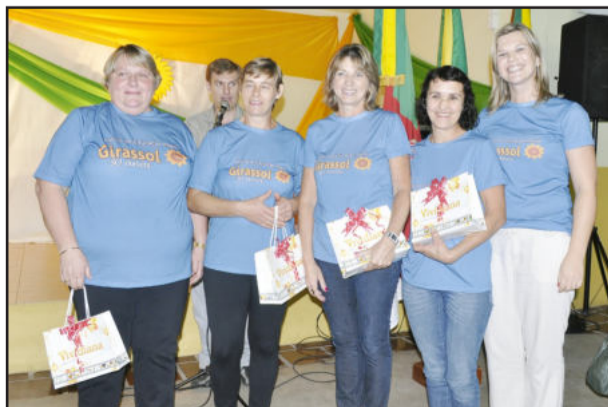
Atual diretora da Escola, com as quatro funcionárias que atuam há mais tempo na Girassol