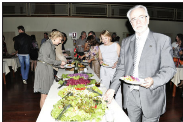
Buffet de saladas e arroz foi acompanhamento