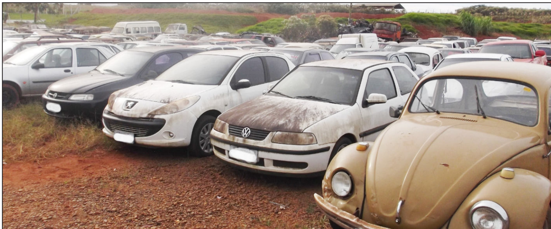
Serão leiloados cerca de 220 itens