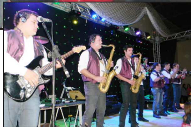
Orquestra La Montanara animou o evento

A diretoria da SUBV de Boa Vista - Poço das Antas agradece aos colaboradores, patrocinadores, pessoas que se empenharam ajudando no serviço da jantã, que foi servida na mesa, e, em especial, a todas as pessoas que compareceram no evento, fazendo deste um dos maiores bailes da história.