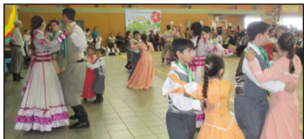
Entidades locais realizaram apresentações artísticas

Depois da solenidade foi realizada a gincana cultural "Paverama, Minha Terra, Meu Chão", envolvendo os alunos das escolas do município. O objetivo foi resgatar a história do município. Paralelamente, aconteceram apresentações artísticas com talentos locais do CTG Querência do Tio Pedro, Grupo de Danças Origens, Grupo Alegria de Viver e CTG Estância do Siqueira.