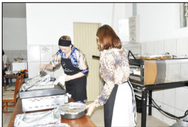
Dedicação no preparo dos pratos especiais