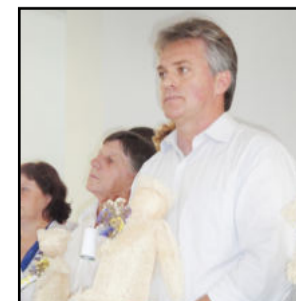
Prefeito Renato Altmann destacou a união da comunidade