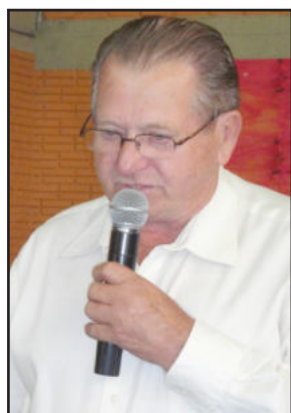
Vice-prefeito Edgar Hauenstein