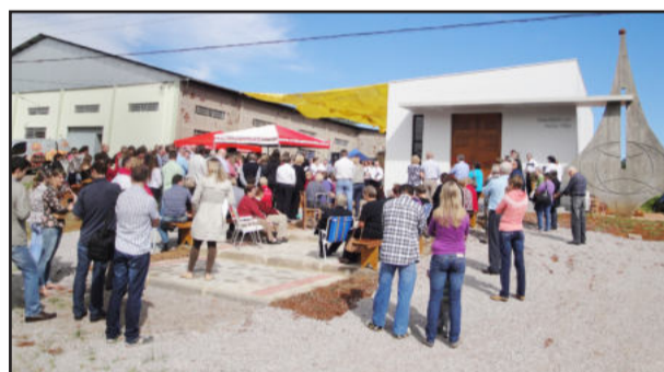
Inauguração grande número de membros e autoridades