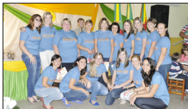
Equipe de professoras e colaboradoras da Girassol