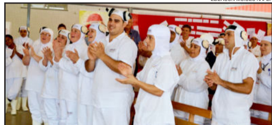
Colaboradores participaram de programação especial, marcado pelo "Parabéns" coletivo

se dedicam e integram a família Languiru, num verdadeiro trabalho em equipe", frisou, lembrando que hoje a empresa é a terceira maior cooperativa do Rio Grande do Sul.