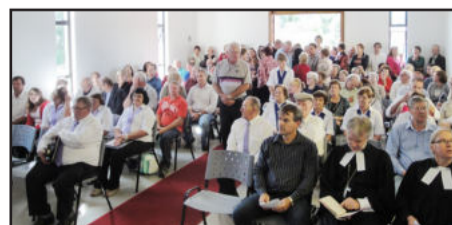
Culto festivo integrou a programação e lotou a igreja