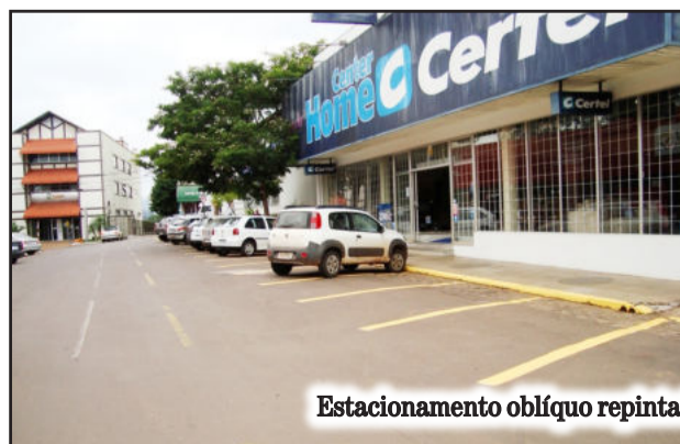
Estacionamento oblíquo repintado na Rua Arthur Pilz em Languiru