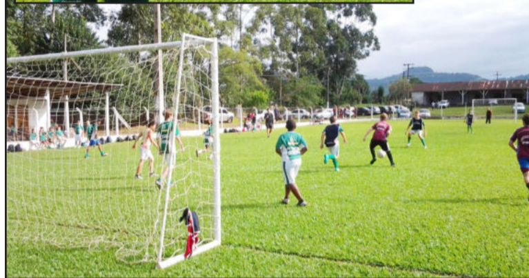
Jogos movimentaram cerca de 300 alunos dos núcleos da Juventus