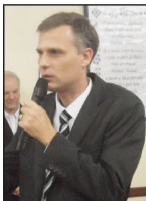
Prefeito de Estrela falou sobre a importância do evento para o município

Evento: Encontro e apresentação de grupos de danças folclóricas de outras cidades com o Tradicional Café da tarde opcional por quilo. Entrada: 1 kg de alimento não perecível Local: Centro Comunitário Cristo Rei Início: 16 horas