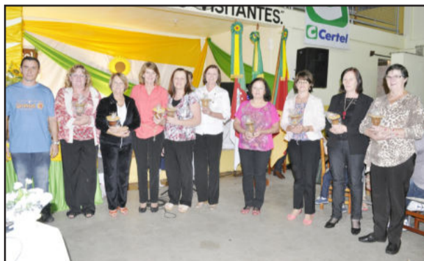
Atual presidente com a primeira diretoria da entidade, homenageada na noite