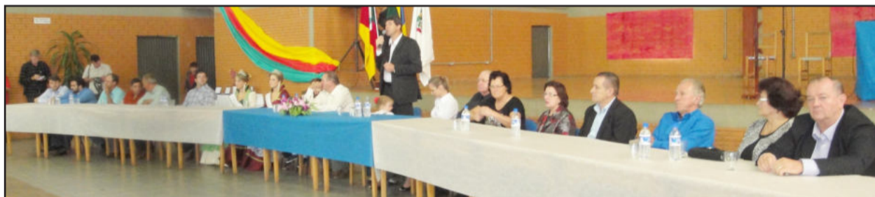
Autoridades locais prestigiaram a cerimônia