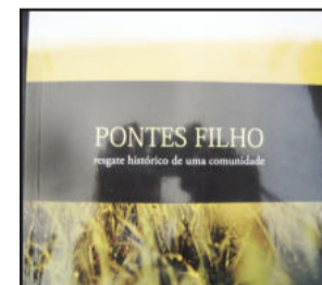
Livro conta história da comunidade