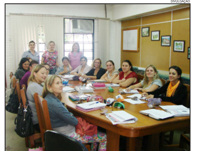
Encontro com as direções das escolas de educação infantil

Azaléia, que apresentou a dinâmica do "barco". Apresentou que em cada navio tem um capitão e um destino, e a escola é um grande barco, sendo importante continuar a remar com alegria, amor e coragem. Ainda teve a troca de experiências onde cada escola entregou seu calendário escolar com o planejamento das atividades de 2013. O próximo encontro ficou para dia 07 de maio.