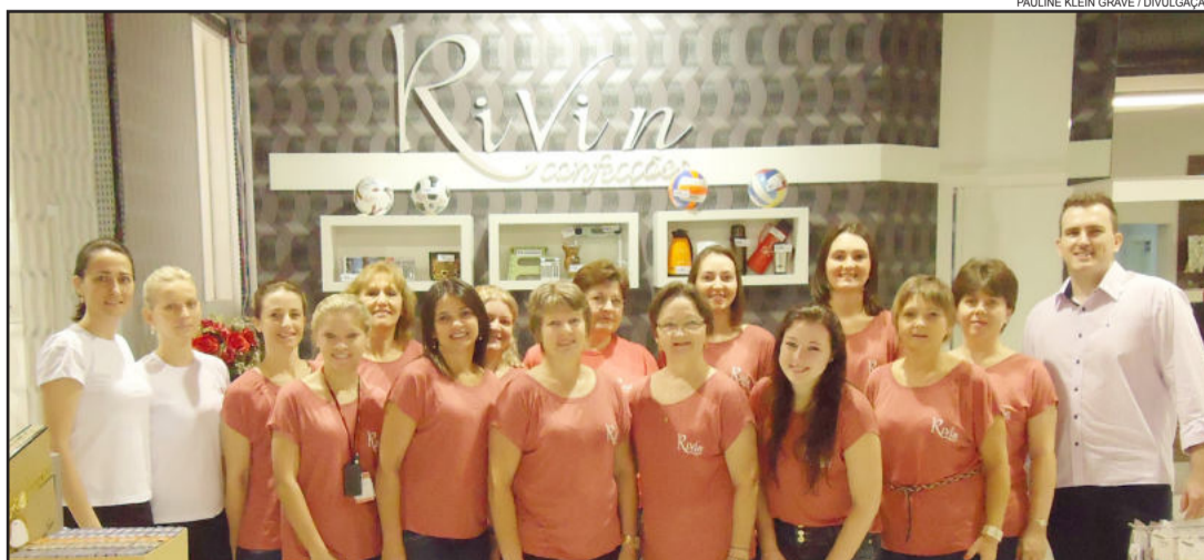
Equipe da Rivin Confecções