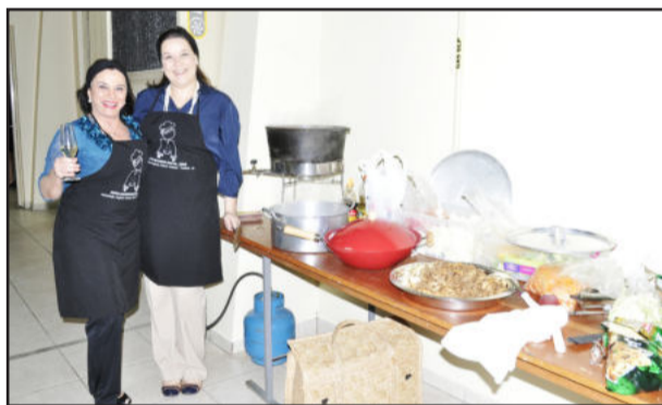
Muita descontração na cozinha, no bastidor do preparo dos pratos