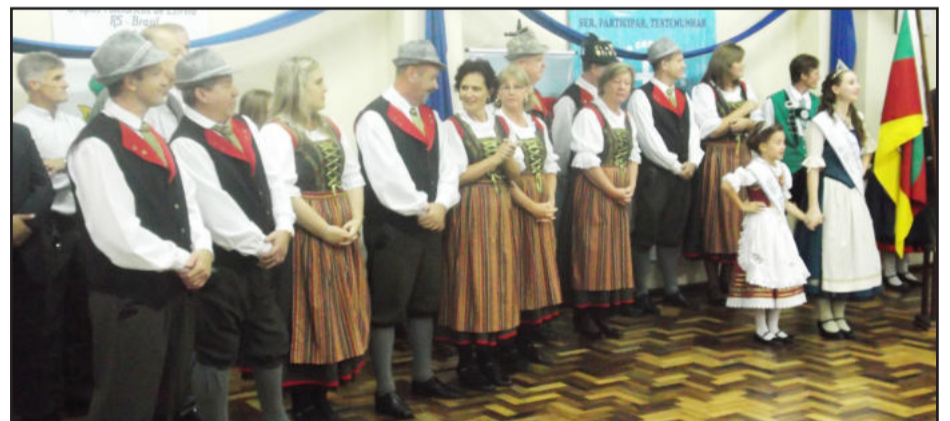
Evento aconteceu sexta-feira dia 12 e reuniu autoridades locais, comunidade evangélica e comunidade em geral