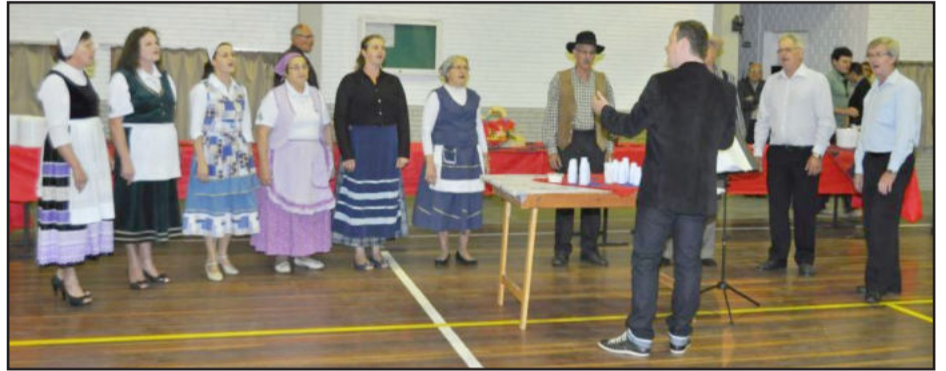
Coral Vozes promove o Filó Italiano em Daltro Filho