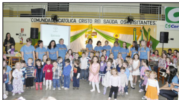
Apresentação dos alunos da escola