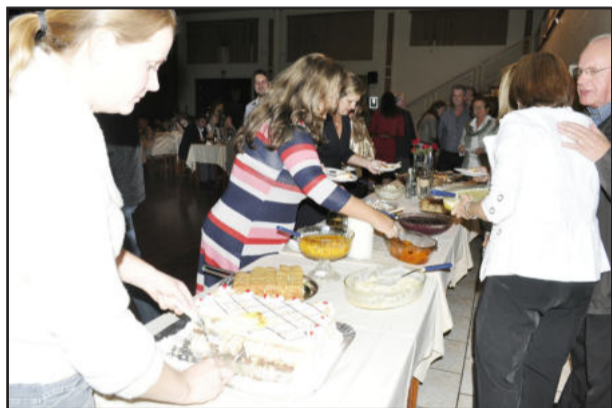
Público também desgustou mesa farta de sobremesas