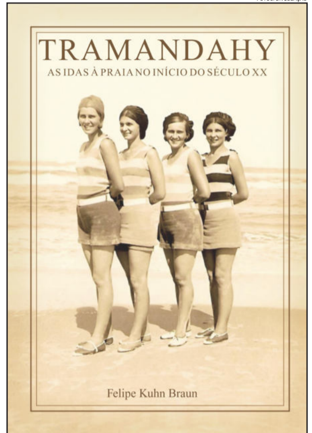
Capa do livro Tramandahy: as idas à praia no início do século XX

Felipe Braun descreve, passo a passo, como era a viagem até a praia, as acomodações do Hotel Sperb e os anos iniciais de ocupação. Revela que ir do Vale dos Sinos ao litoral, no começo do século XX, levava três dias e meio de viagem sobre uma carreta de bois, numa estrada em péssimas condições, uma verdadeira aventura. O livro é ilustrado com dezenas de fotos da época. Tem 125 páginas. O lançamento ocorreu às 20h na Fundação Schöffel, em Novo Hamburgo.