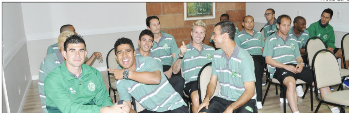
Juventude ficou hospedado no Baviera Park Hotel