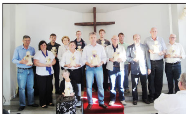
Alguns dos colaboradores que receberam a homenagem