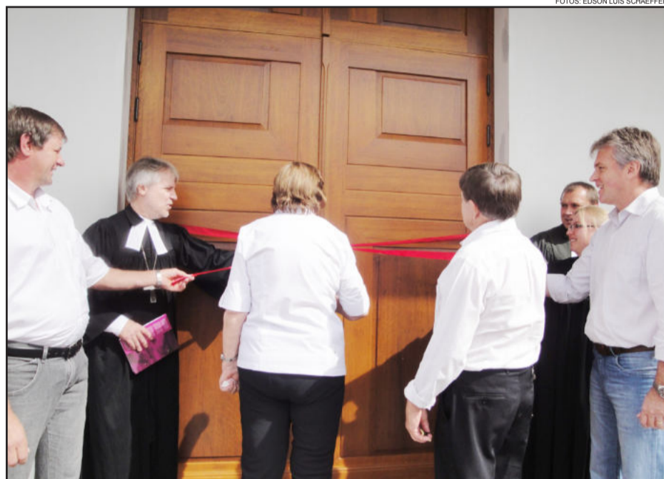
Desenlace da fita marcou a inauguração oficial