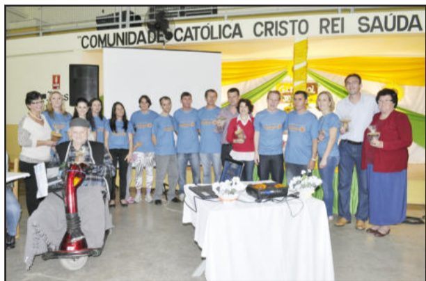
Autoridades e voluntários homenageados, junto com a diretoria da Escola