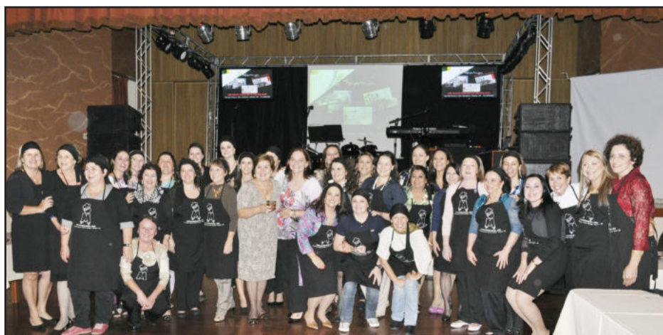
Voluntárias que prepararam os pratos