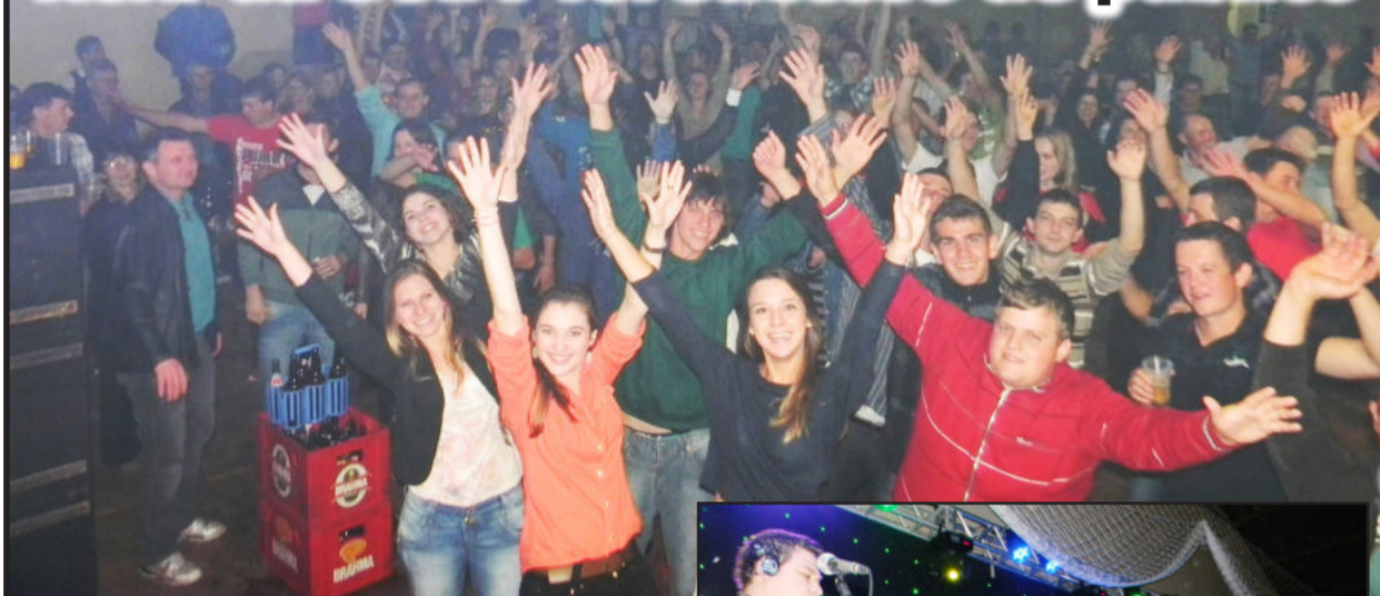
Cerca de 800 pessoas participaram do Kerb da SUBV

A Sociedade União de Boa Vista (SUBV) Poço das Antas realizou no sábado, dia 13, seu baile de Kerb. Cerca de 800 pessoas fizeram o baile superar a expectativa dos organizadores e ser um dos maiores da SUBV até hoje. Diversos municípios estiveram representados: Barão, Salvador do Sul, São Pedro da Serra, Boa Vista do Sul, Carlos Barbosa, Caxias do Sul, Montenegro, Tupandi, Teutônia, Westfália e Estrela. Um bom público da própria comunidade e de localidades vizinhas do município de Poço das Antas também se fez presente.