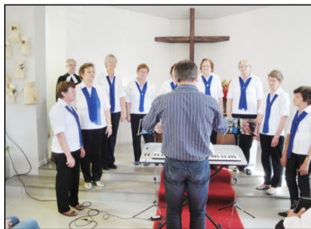
Coral da OASE