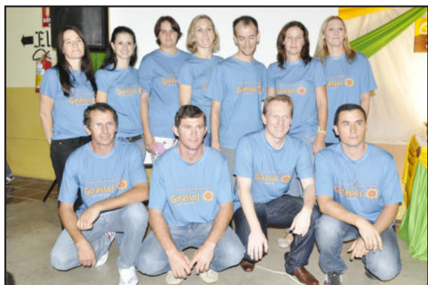
Atual diretoria da Escola de Educação Infantil