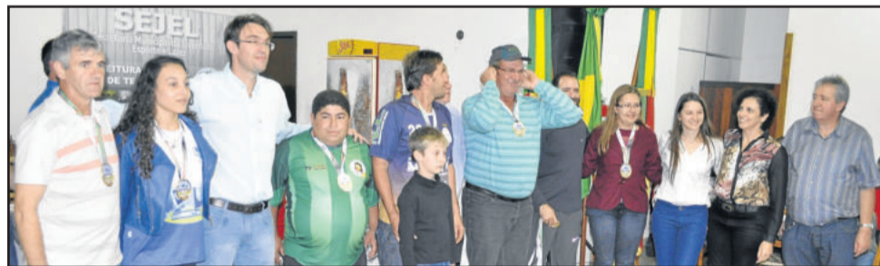
Mesários das equipes que participaram do Municipal foram premiados