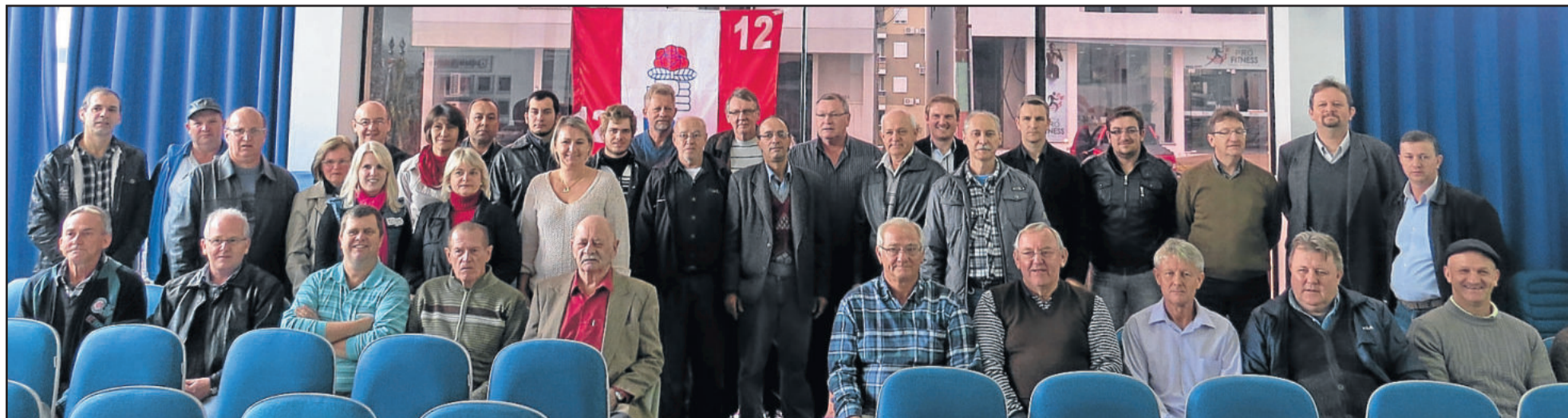
Encontro ocorreu na manhã do sábado, na Câmara de Vereadores