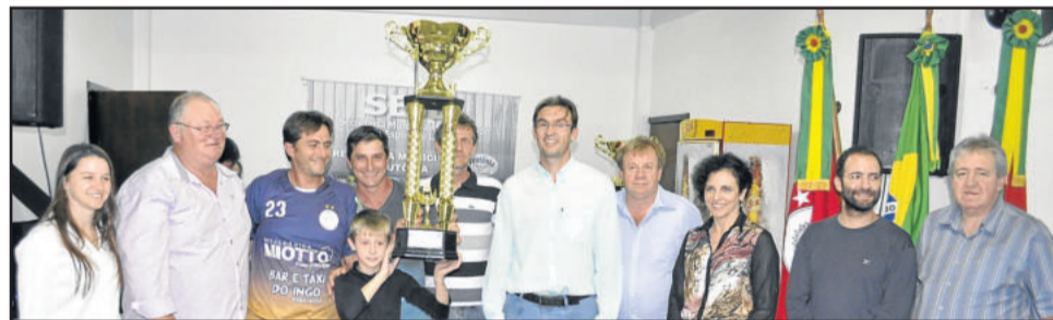
Juventude, vice-campeão dos Titulares