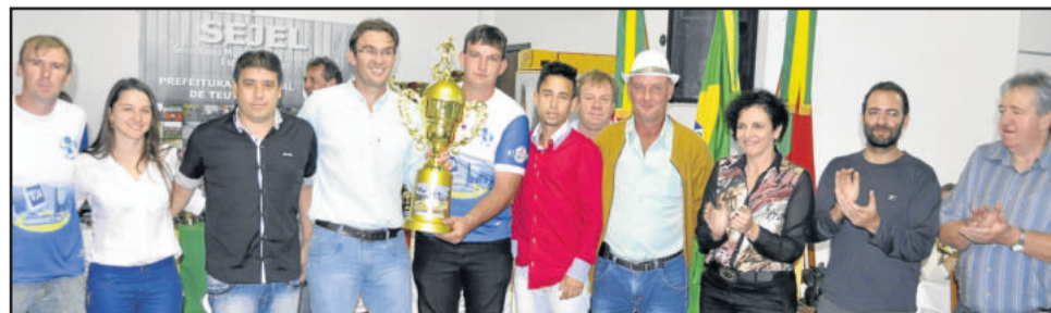
Avante foi o campeão dos Aspirantes