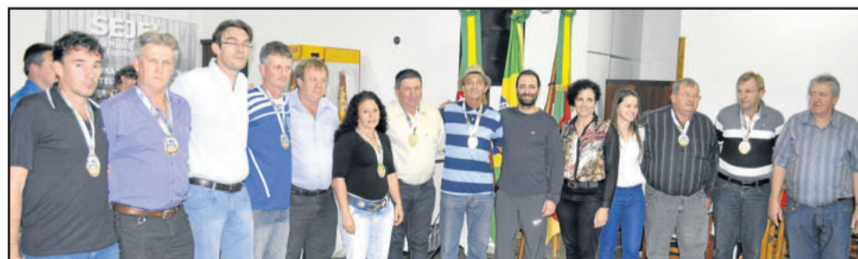
Também foram premiados todos os presidentes das equipes que disputaram o Municipal