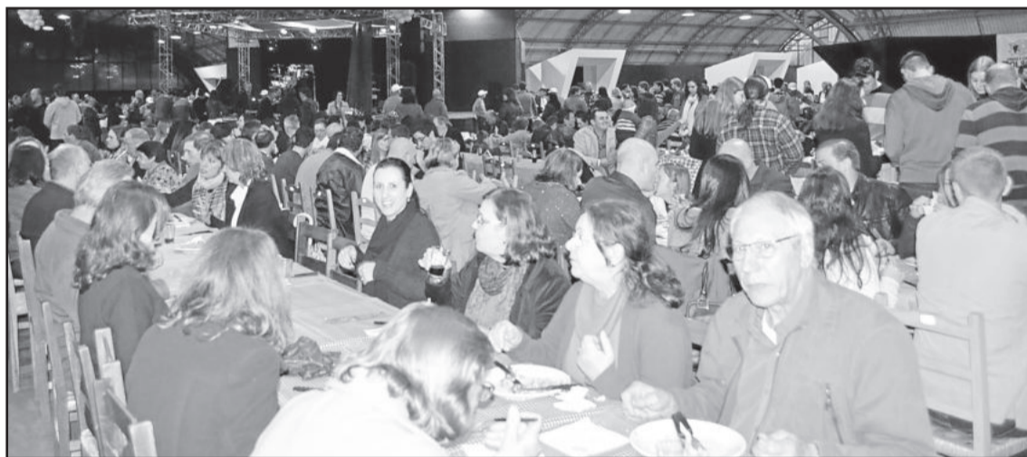
Público cumpriu expectativa, que era de 3 mil pessoas