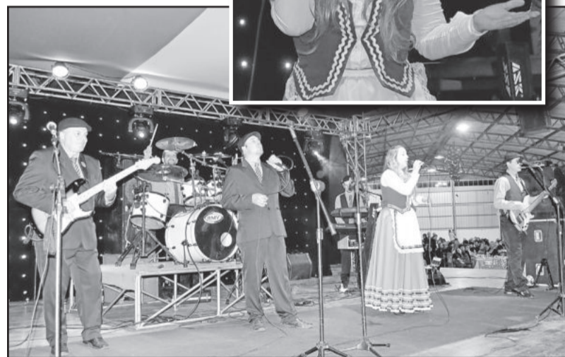
Musicale Kremony animou a festa no sábado