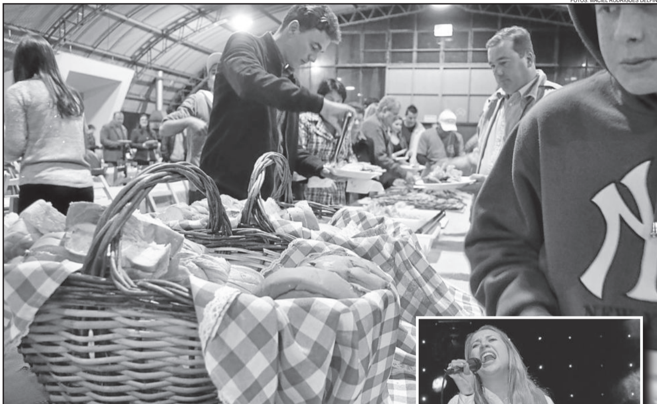
Festival ofertou mais de 8 mil quilos de alimentos

Desde 1981, o Festival Colonial Italiano vem sendo realizado. Em seus primórdios, com o objetivo de divulgar a Fenachamp. O evento se consolidou e tem a marca da Associação dos Veteranos que idealizou o evento e mantém viva esta tradição. O festival tem o mérito de ser um dos melhores da comida típica italiana na Serra Gaúcha.