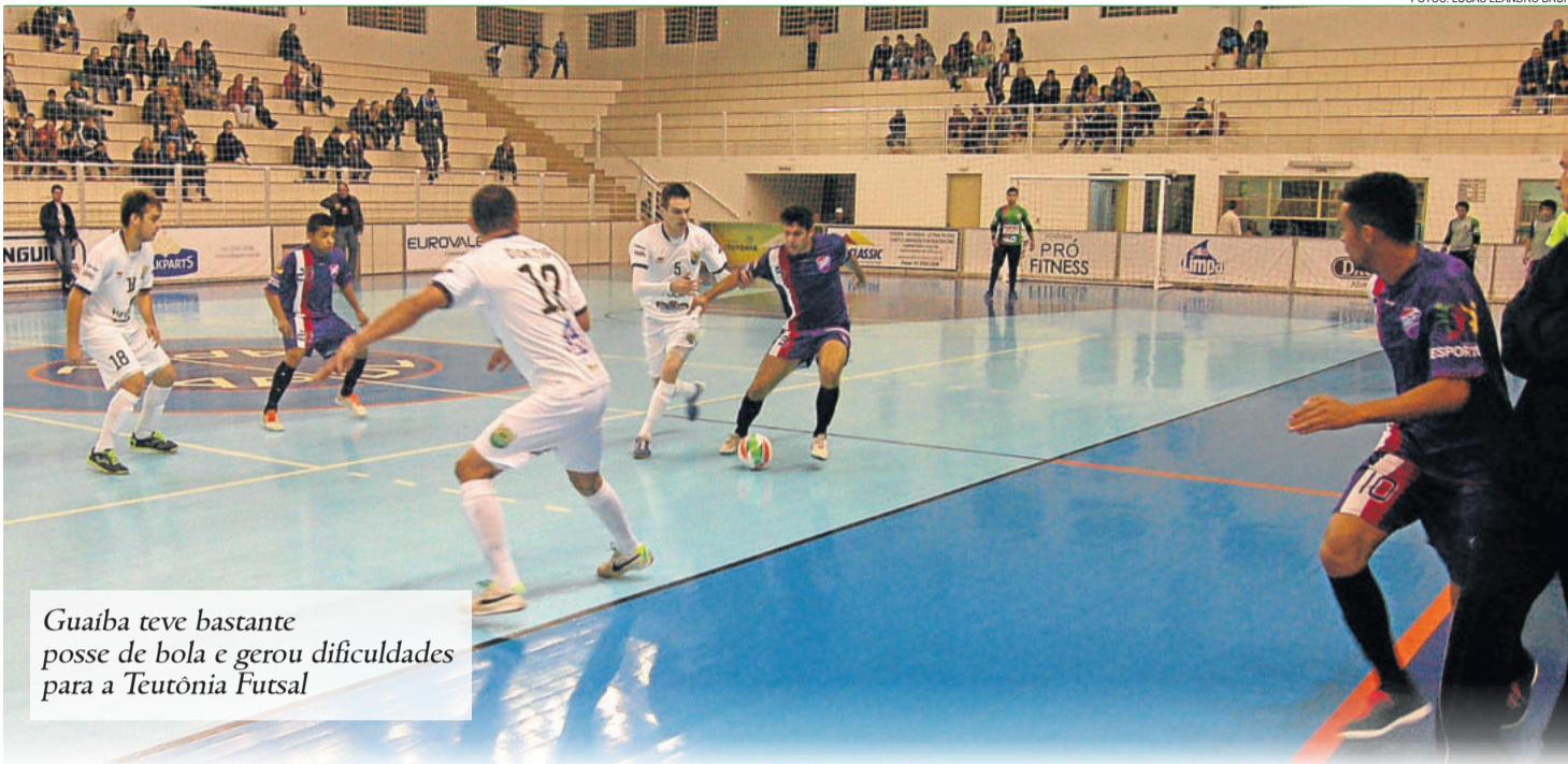
Guaíba teve bastante posse de bola e gerou dificuldades para a Teutônia Futsal