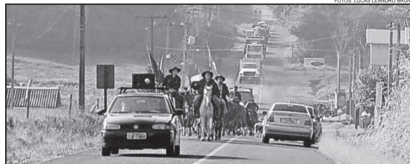
Cavalarianos, máquinas e veículos fizeram desfile desde Linha Germano até a sede do CCT, no Loteamento 8