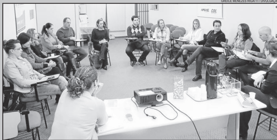
Durante o encontro, foram apresentadas ideias para divulgar o roteiro no evento

A Rota de Compras conta com 21 estabelecimentos participantes: Benvenuti, Calce bem, Calce Leve, Calzatto, Cantinho da Fofa, CM Malhas, Devorata, Disco Center, Dress, Enamorare, Espaço Decor, Exigent, Forh, Farroupilha Sports, Juila Modas, Meghi Confeções, Lojas Andreolio, Sabor Ecológico, Spasso Calçados, Villa Sorelle e Vinotage. Mais informações sobre o roteiro podem ser obtidas nos sites www.apeme.com.br/rota-compras/ e www.turismogaribaldi.com.br , além da fan page e do aplicativo Turismo Garibaldi.