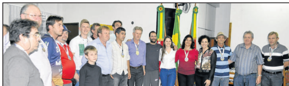
Técnicos de todas as equipes do Municipal de Teutônia reberam premiação