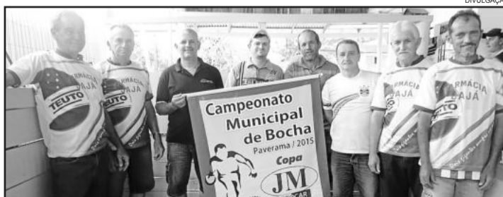
Canha do Eli

çada pelo adversário da rodada, Morro Azul. O Morro Azul por sua vez, mesmo com a derrota necessária de si mesmo para se classificar. Uma vitória, combinada com a derrota da Cidade Baixa classifica a equipe para as semifinais já na próxima rodada.