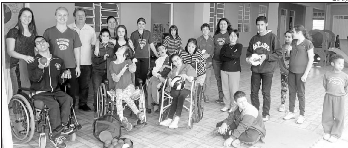
Alunos da APAE receberam materiais esportivos

Grande do Sul (IFSUL), que também se responsabilizará pela alimentação. A viagem será por conta da Apae de Teutônia, que necessita de patrocínio para este fim. Contatos pelo 3762-2450, com Rosângela. Depois, será a vez de participar da Olimpíada Nacional. No ano passado, os teutonienses participaram da Olimpíada Regional e Macrorregional.