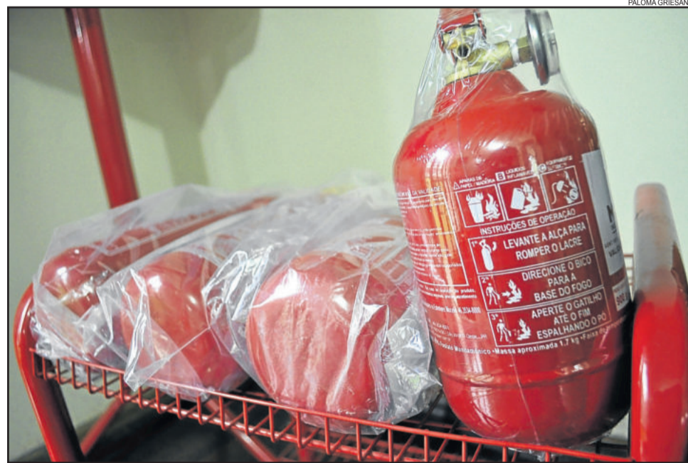
Obrigação do equipamento ABC foi prorrogada pela terceira vez

Antes da nova resolução do Contran, o extintor obrigatório era o do tipo BC. Com a mudança da legislação passa a ser o ABC. A diferença é o tipo de incêndios contemplados. O BC servia para dois tipos: incêndio provocado por líquidos inflamáveis (B) e incêndio em circuitos elétricos (C). O ABC, além de combater esses dois tipos, ainda serve no combate a incêndios em superfícies sólidas (A), como bancos e painéis. “Vamos supor que está pegando fogo no estofado do carro. A partir do tipo A ele vai ter condições de apagar o princípio de incêndio. Antes, com o extintor BC, ele não iria conseguir