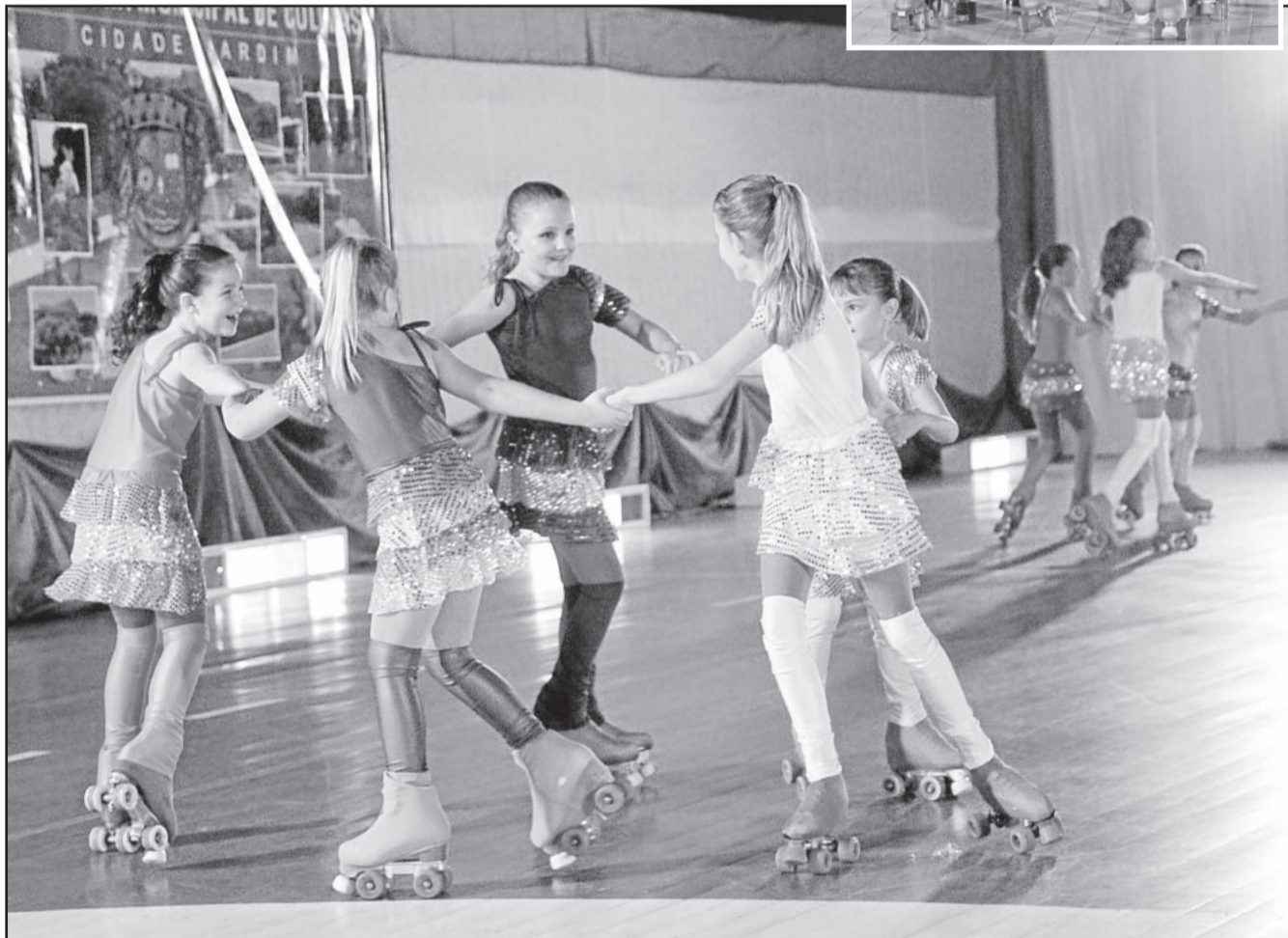
Patinadoras mostraram suas habilidades sobre patins

A Academia de Patinação Arte e Movimento existe há quatro anos em Colinas. Atualmente conta com 40 alunos na faixa etária dos 4 aos 15 anos.