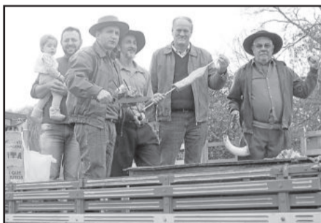
Até churrasco em cima do caminhão saiu para simbolizar a colheita

O CCT Querência Amada tem como principal proposta manter acesa a chama da cultura gaúcha.