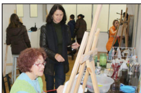
Oficina de pintura - Ponto Resgate da Memória