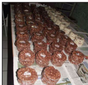
Rapaduras fazem sucesso