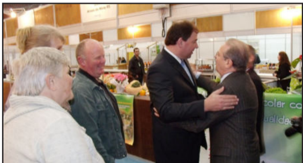
Agroind teve a presença do governador Tarso Genro

No painel "Agricultura familiar na alimentação escolar - desafios e oportunidade", Colinas destacou seu trabalho visando uma alimentação escolar com qualidade, atendendo as necessidades nutricionais com produtos agroecológicos, valorizando a produção local e hábitos alimentares. Os resultados alcançados estão sendo satisfatórios, com uma significativa expansão da produção para abastecer o mercado local (Feira Municipal e Rota Turística).