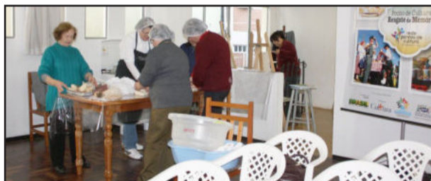
Sede do Ponto de Cultura Resgate da Memória