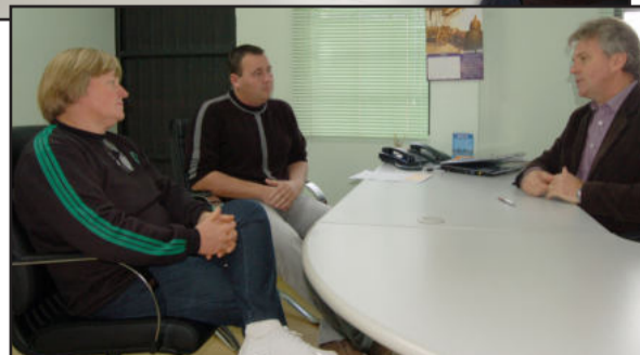
Município repassou recursos para o STR como auxílio ao milho safrinha

Na manhã desta terça-feira, dia 12 de julho, a Administração Municipal de Teutônia, através da Secretaria de Agricultura e Meio Ambiente, repassou um recurso de aproximadamente R$ 11 mil para o Sindicato dos Trabalhadores Rurais de Teutônia (STR). O valor refere-se ao subsídio aos agricultores para as sementes de milho da safrinha do programa Troca-Troca.