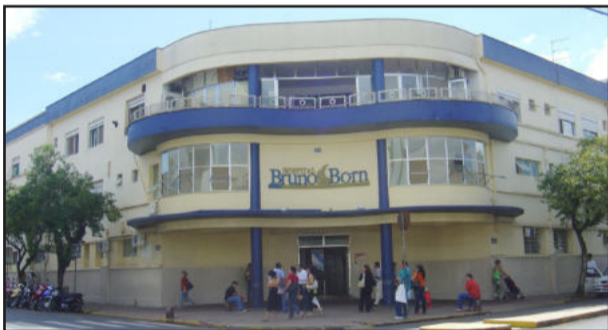
Fachada atual do Hospital e Antigo Hospital São Roque

E para comemorar esta passagem, hoje, dia 16 de julho, será realizado um jantar baile. Será no Clube Tiro e Caça, a partir das 20 horas, com animação da banda Bee Gess Cover, buffet de Telmo Both, homenagens a pessoas que fizeram parte da história do hospital e um espaço memorial, com a exposição de materiais antigos utilizados pelo hospital desde sua inauguração. Mais informações pelos telefones: 51-3714-7582 ou 3714-7548.