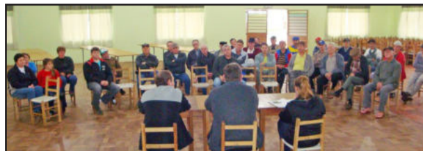
Encontro reúne moradores da localidade de Delfina

Na tarde da última quarta-feira, dia 13, ocorreu no salão da comunidade de Delfina a reunião descentralizada da Secretaria Municipal da Agricultura, com a presença de 30 moradores da localidade.