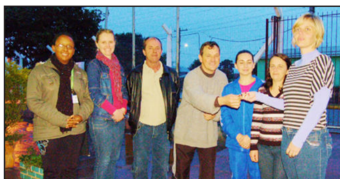
Entrega do controle do portão eletrônico