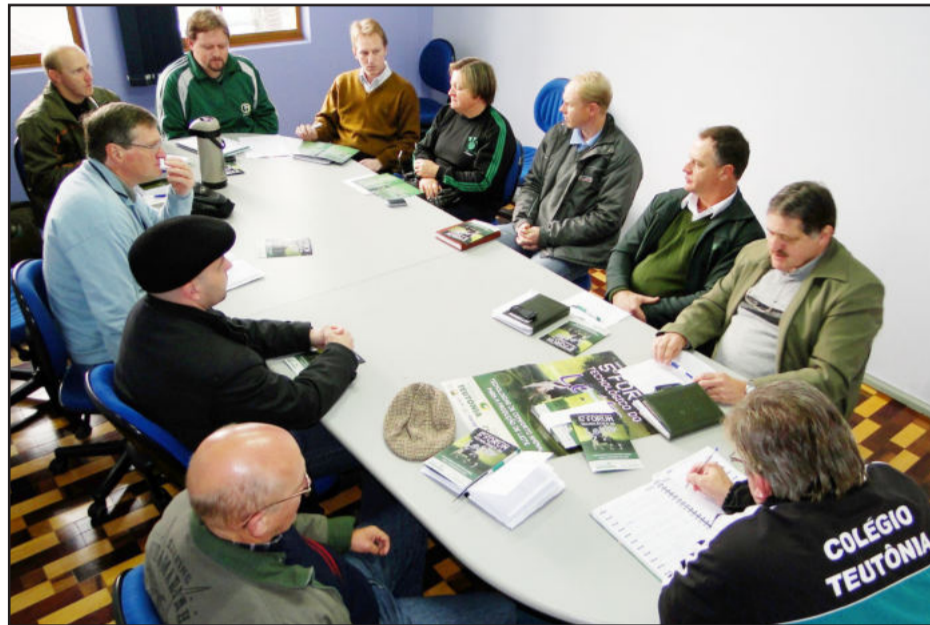
Comissão organizadora do evento esteve reunida na manhã desta terça-feira, dia 12 de julho

Mais de 20 empresas deverão expor seus produtos e serviços voltados direta e indiretamente ao leite no 5º Fórum Tecnológico do Leite, a ser realizado pelo Colégio Teutônia e parceiros nos dias 21 e 22 de setembro, com o tema "Tecnologias e conforto animal para a produção de leite".