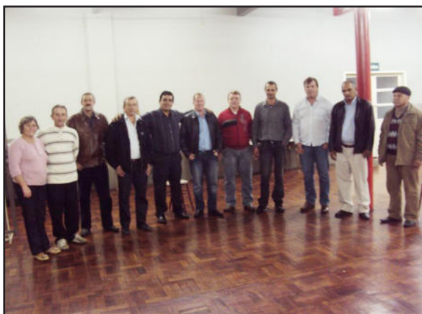
PMDB de Estrela renova seu quadro de filiados