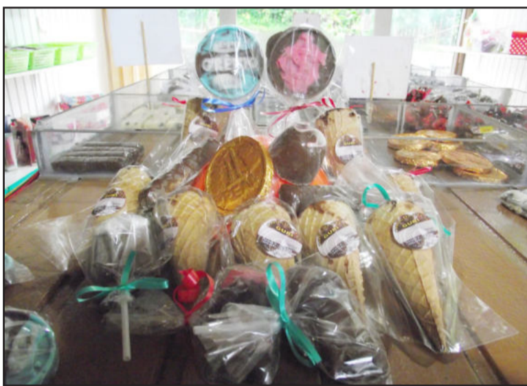
Variedade de produtos vai sendo ampliada