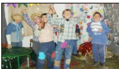
Arraiá da Alegria foi construído pelos alunos