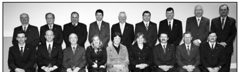
Tomou posse o novo Conselho da Sicredi Serrana