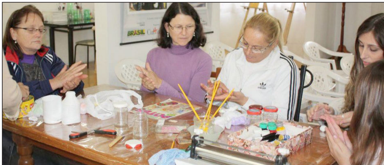
Oficina de Biscuit - Ponto Resgate da Memória

A Prefeitura de Garibaldi, através da Secretaria Municipal de Educação e Cultura, está trabalhando nas oficinas do Ponto de Cultura desde 2009. É um projeto pertencente ao Programa Mais Cultura, do Ministério da Cultura, criado pelo Governo Federal em 2006. Os três Pontos de Cultura de Garibaldi foram abertos em março deste ano.