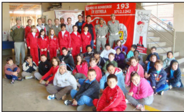
Participantes da solenidade de entrega dos uniformes

O projeto visa orientar crianças e adolescentes sobre como agir em casos de emergência e acidentes, além de desenvolver trabalhos sobre diversos temas, como drogas, violência, trânsito, meio ambiente, alimentação saudável e reforço escolar.