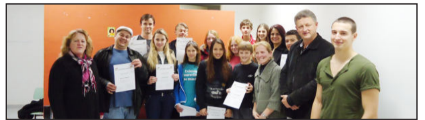
Alunos de alemão receberam certificados e retornam em agosto, após as férias

de Julho a todos interessados. A oficina é desenvolvida em parceria com auxílio realizado pela Administração Municipal de Teutônia, que se preocupa em valorizar a língua alemã, pois a cultura germânica é o berço da colonização de Teutônia. Dúvidas e inscrições podem ser feitas pelo telefone (51) 3762-1033.