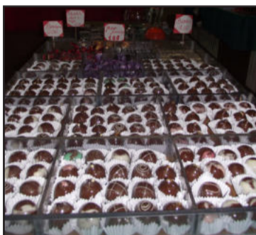
As trufas geram a maior produção