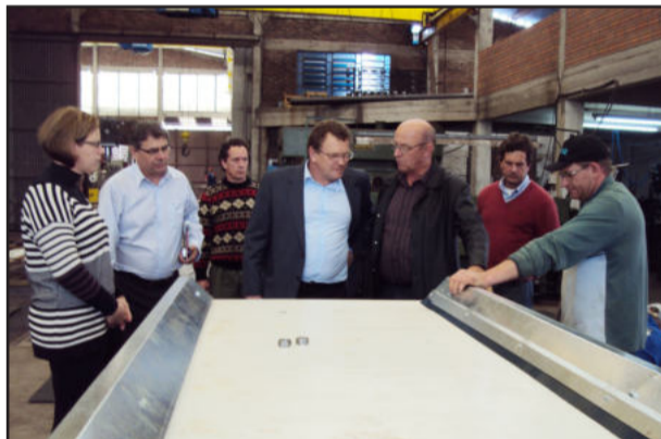
Visita à produção na Metalúrgica Wagner