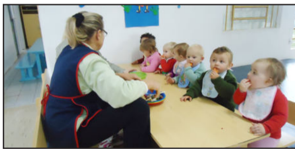
Alimentação escolar de Colinas tem produtos da agricultura familiar

O programa visa garantir a sustentabilidade socioambiental e econômica, ou seja, produzir com equilíbrio sem destruir a natureza e a saúde humana. São parceiros do projeto produtores agroecológicos, Secretaria Municipal da Agricultura, Secretaria Municipal da Educação, Emater, Conselho Municipal da Alimentação Escolar de Colinas, Sindicato dos Trabalhadores Rurais, Conselho Municipal de Desenvolvimento Rural de Colinas e Câmara de Vereadores.