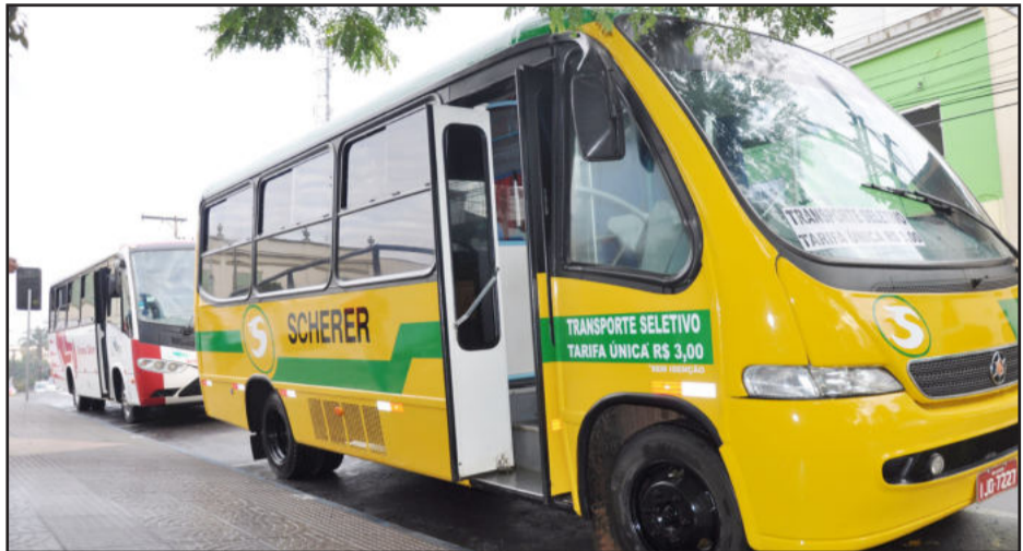
Micro ônibus a serem utilizados para o transporte seletivo em Lajeado

Com o objetivo de desafogar o trânsito de veículos na cidade de Lajeado e consequentemente melhorar o fluxo deles pelas vias, o governo municipal informa que a partir de segunda-feira, dia 18 de julho, serão oferecidos itinerários seletivos aos munícipes, de segunda a sexta-feira e também aos sábados pela manhã.