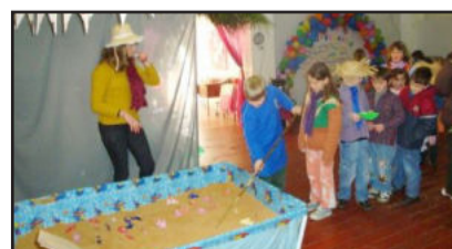
Pescaria animou a criançada