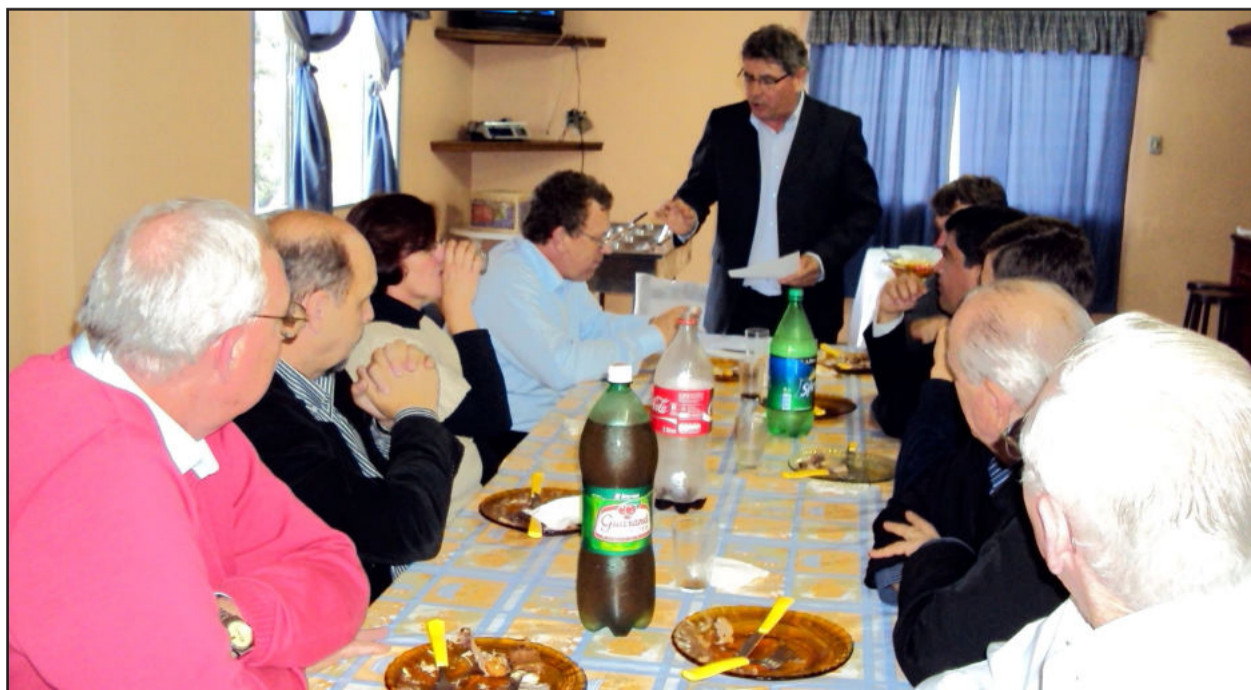
Reunião e almoço com lideranças