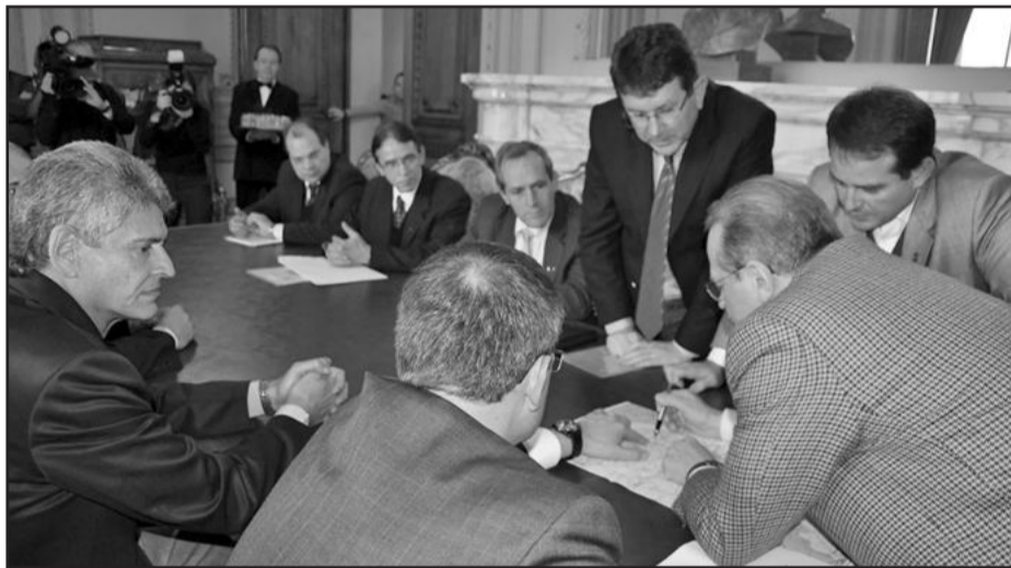
Entidades entregam pedido de federalização da RSC 470 ao governador

Os presidentes das entidades filiadas à Associação das Entidades Representativas da Classe Empresarial da Serra Gaúcha (CICS Serra) reuniram-se nesta quinta-feira, dia 14, com o governador Tarso Genro no Palácio Piratini. Além deles, esteve presente no encontro o presidente da CICS Serra, Ademar Petry; o prefeito de Garibaldi, Cirano Cisilotto; presidente da Associação dos Municípios da Encosta Superior do Nordeste (Amesne), Waldemar De Carli, prefeito de Veranópolis.