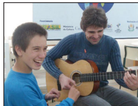
Oficina de Música - Ponto Fazendo a Diferença