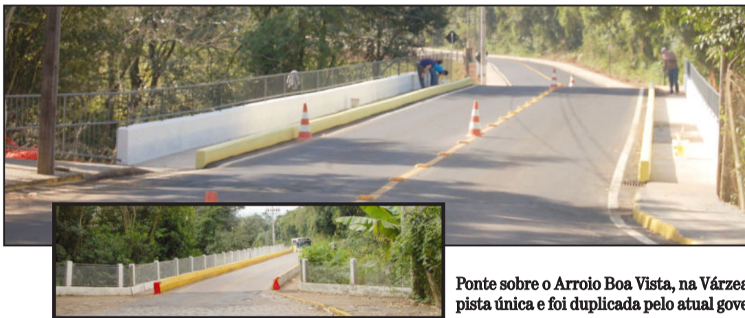
Ponte sobre o Arroio Boa Vista, na Várzea, tinha pista única e foi duplicada pelo atual governo