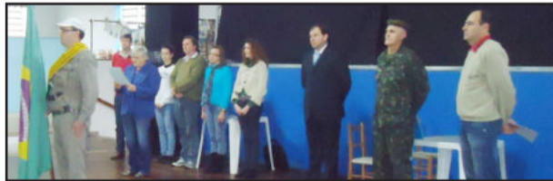
Juramento à Bandeira