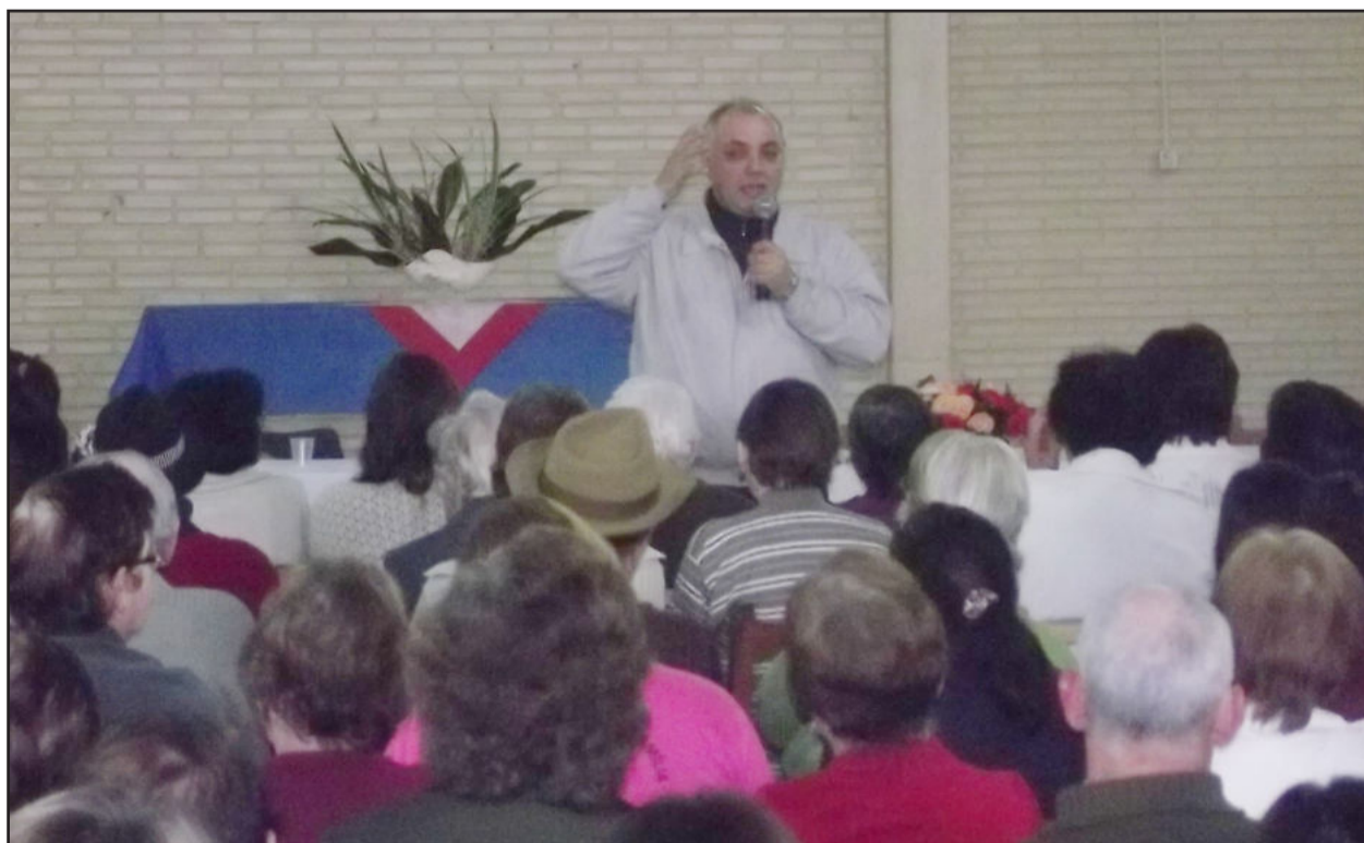
Conferência de Saúde de Paverama reuniu 150 municipais