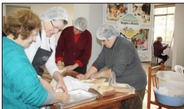
Oficina Preparo de Pão Colonial Italiano - Ponto Resgate da Memória