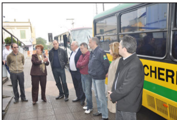
Carmen destacou que novos serviços atendem aos interesses da comunidade

Os horários e itinerários podem ser conferidos no site da Folha Popular: www.popularnet.com.br .