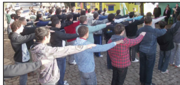
Os jovens da classe de 1993 prestaram juramento à Bandeira e foram dispensados do serviço militar