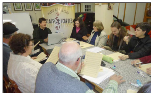
Oficina Teoria Musical - Ponto Cenas e Acordes