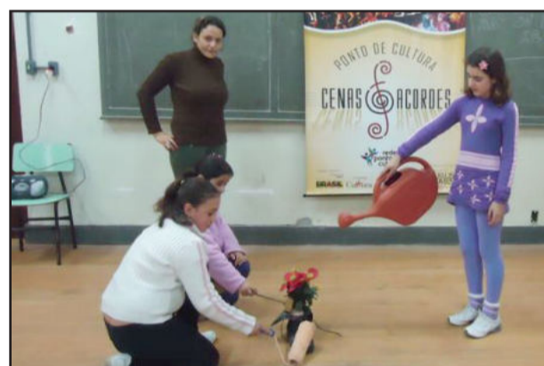
Oficinas de Teatro - Ponto Cenas e Acordes