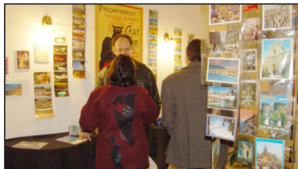
Exposição Postais do Mundo está ocorrendo