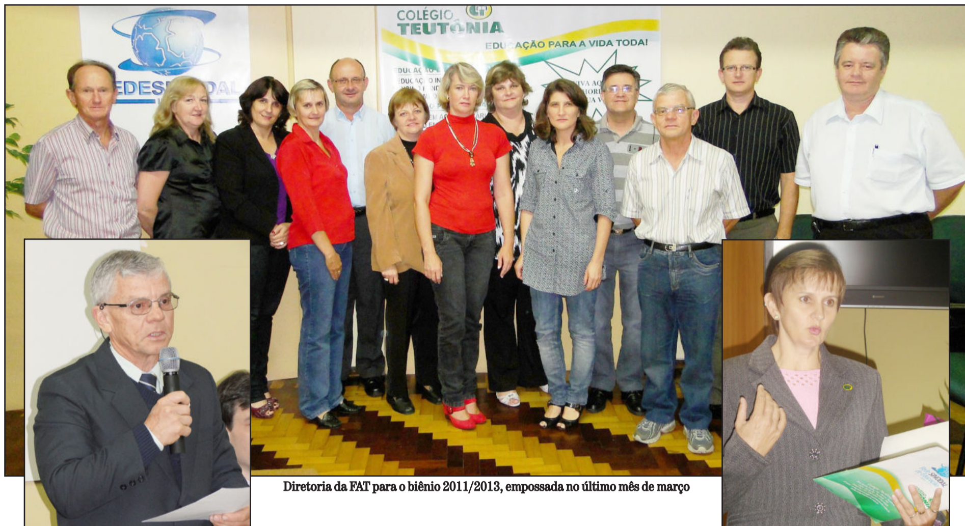
Diretoria da FAT para o biênio 2011/2013, empossada no último mês de março