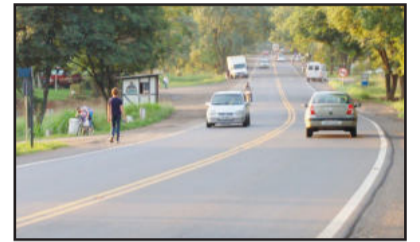
Via Láctea é uma rodovia perigosa