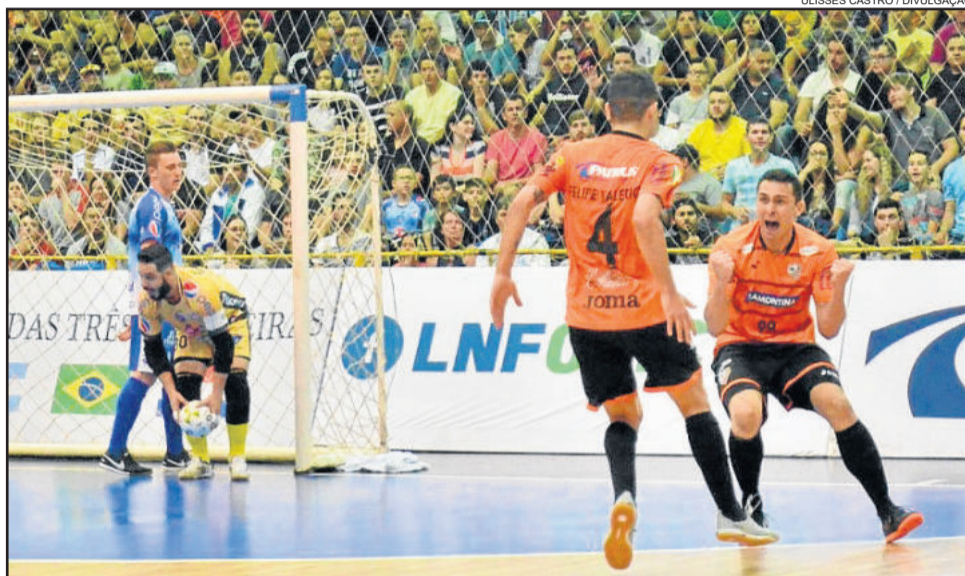
ACBF arrancou bom empate em Foz do Iguaçu

Antes de decidir a vaga na Liga Nacional, a ACBF terá uma partida decisiva nesta quinta-feira, dia 19, pela Liga Gaúcha de Futsal - Série Ouro. Jogará em casa, no Parque da Tramontina, diante do Guarany de Espumoso, a partir das 20 horas. A ACBF precisará vencer o jogo de volta das quartas-de-final do Gauchão (perdeu o primeiro por 4 a 3) para levar a disputa à prorrogação, quando terá a vantagem do empate, em função da melhor campanha.