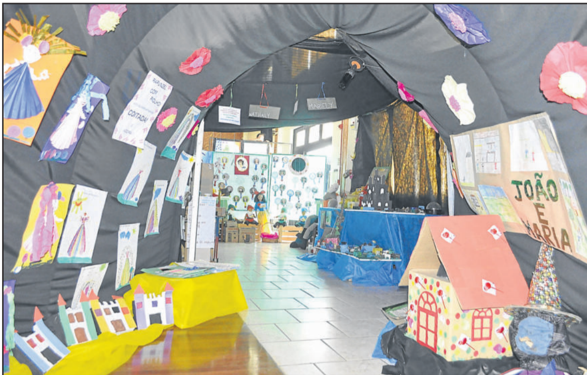
Mostra de trabalhos é um dos destaques da Semana Cultural

A 1ª Semana Cultural de Teutônia integra o projeto norteador da Secretaria de Educação: “Teutônia, quero te rica e grande em saber”.