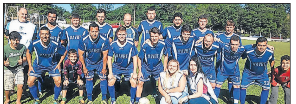
Flamengo da Germano é o líder isolado da competição