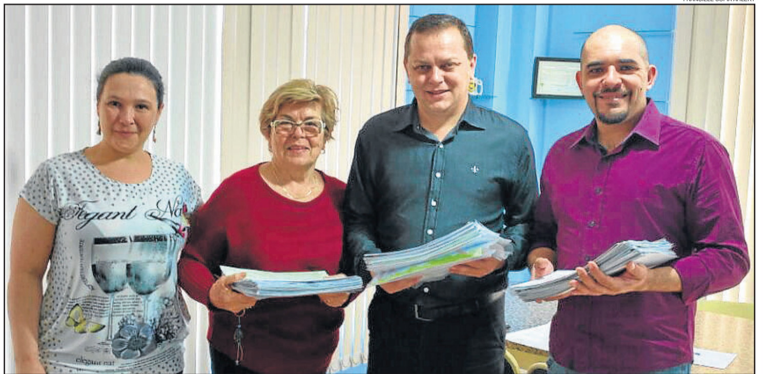
Seleção dos trabalhos ocorreu nesta segunda-feira

Serão premiados os três primeiros colocados de cada uma das quatro categorias. O 1º lugar leva uma bicicleta, além de outros prêmios. Mochilas, vale-livros, vale-presentes são dados aos vencedores. Além disso, uma criança em cada categoria é premiada com um curso de desenho. Nos próximos dias serão contatados os vencedores e será marcada a entrega oficial dos prêmios aos ganhadores da etapa deste ano, que é a 3ª edição do concurso.