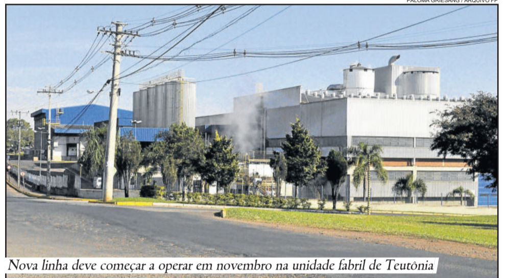
Nova linha deve começar a operar em novembro na unidade fabril de Teutônia

A Lactalis é a maior captadora de leite gaúcho. Em 2017, a empresa deve adquirir cerca de 900 milhões de litros de leite in natura, de 8 mil produtores, o que corresponde a 25% do total produzido no Estado. Desse volume, 80% é industrializado nas cinco fábricas da empresa e enviado para venda em outros estados. A Lactalis emprega 2,3 mil colaboradores, além de mais de 100 extensionistas rurais, que ajudam os produtores. Em 2016, foi a empresa do setor lácteo que mais gerou impostos ao estado gaúcho - R$ 68 milhões.