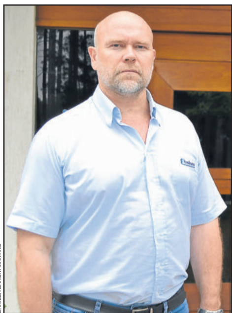
Filho Rafael dá continuidade ao trabalho do pai nas Esquadrias Baiana

Segundo Schneider, as testemunhas ainda estão sendo ouvidas. Faltam pelo menos três pessoas, que são de outras cidades. Uma delas, por exemplo, espera ser ouvida há mais de um ano em Canoas, em função da falta de um juiz na vara. Além disso, mais outras oito testemunhas de Teutônia, como os familiares, e ainda os réus, precisam ser ouvidos. Para somente depois possa haver um julgamento.