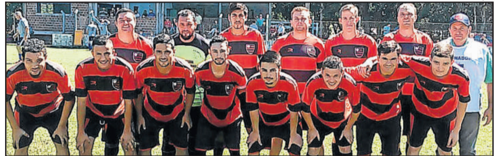
Boa Vista venceu e deixou a lanterna