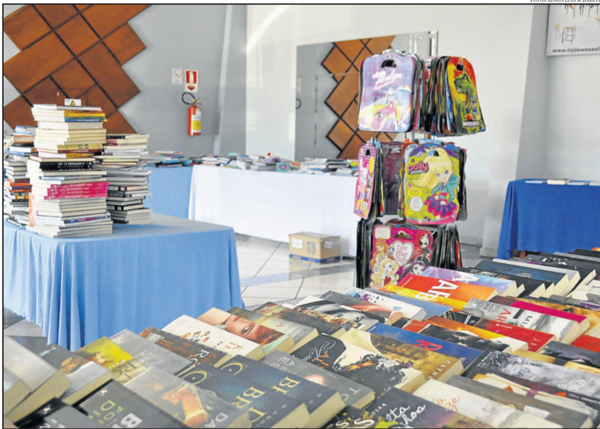
Semana Cultural também terá Feira do Livro