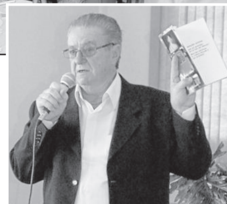
Autor lançou reflexões no livro