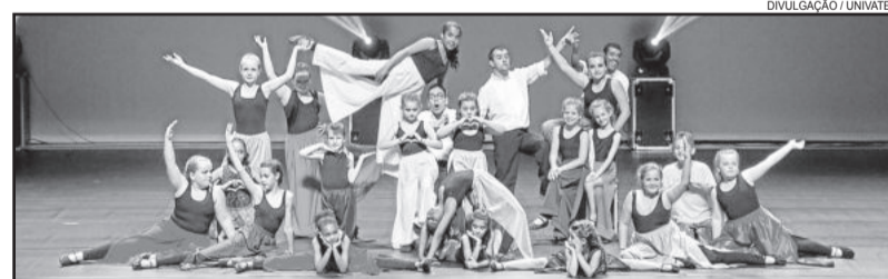
Turma Infantil na dança “Pra ser Feliz”