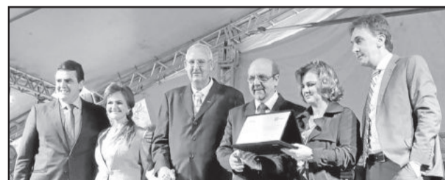
Cooperativa também recebeu homenagem de parceiros