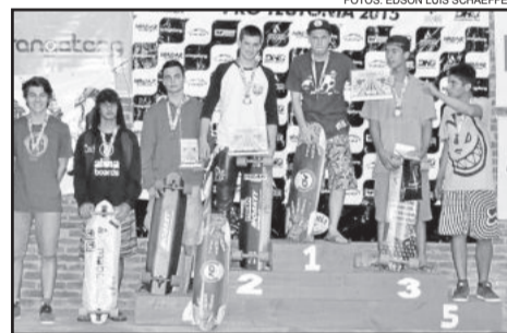
Campeões Open Junior