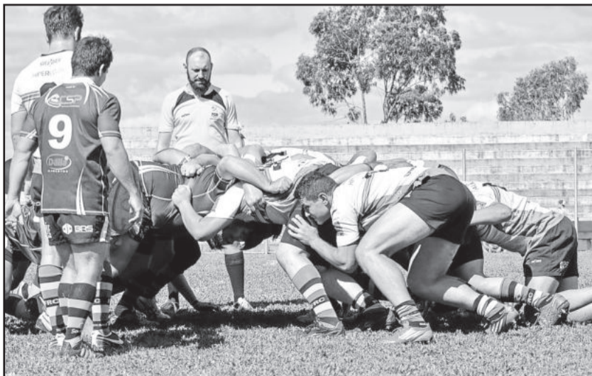
Centauros amargou mais uma derrota na serra, dessa vez contra o Farrapos

passou de 17 pontos. Já os outros clubes da primeira divisão marcaram apenas 13 pontos e a diferença sempre maior de 30 pontos. Segundo a Federação Gaúcha de Rugby (FGR), os resultados demonstram o desenvolvimento do esporte no Estado.