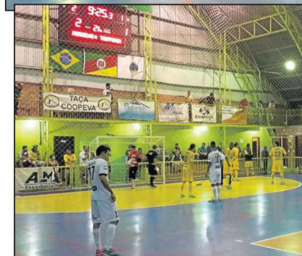
Teutônia Futsal tentou, mas não conseguiu virar