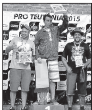
Campeões Open Master