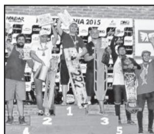
Campeões Classic Luge