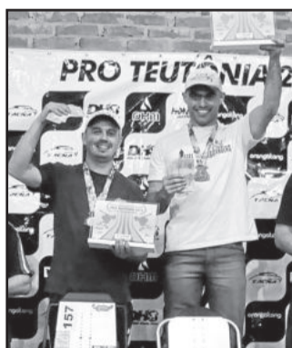
Campeões Street Luge