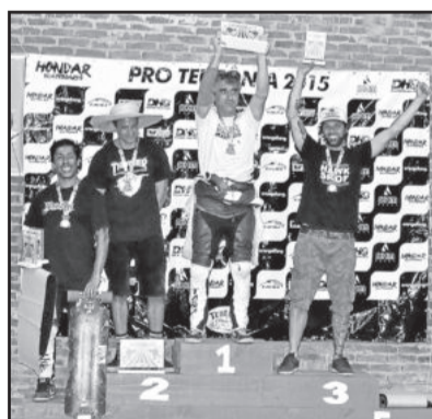
Campeões Open Grand Master