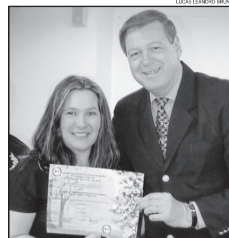
Entrega do certificado de segundo lugar no concurso