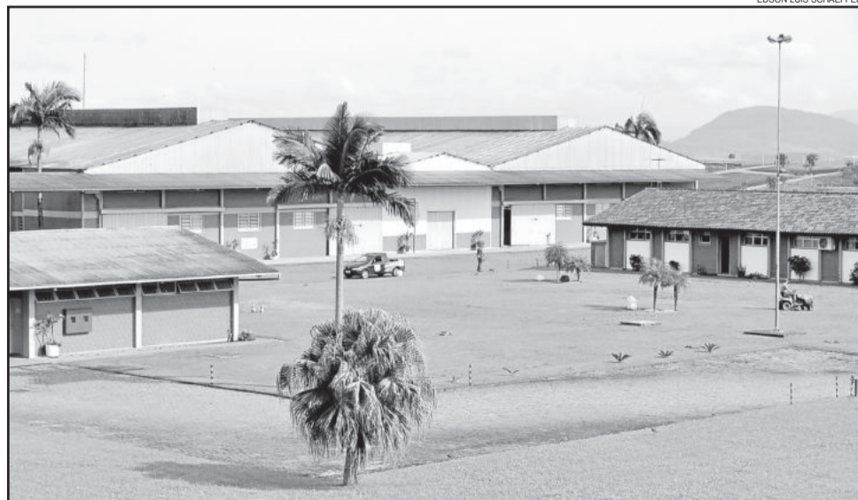
Filial da empresa localizada no Bairro Canabarro

Os sete dias não trabalhados envolviam quatro sextas-feiras do mês de outubro e três do mês de novembro. Nos dias 13 e 20 deste mês, todavia, os funcionários têm expediente normal e aguardam para saber como será o dia 27, última sexta-feira de novembro, quando termina o acordo e o trabalho segue de forma normal, com 8h48min trabalhados por semana. O expediente vai das 7h às 11h36min e das 13h às 17h12min, de segunda a sexta-feira.