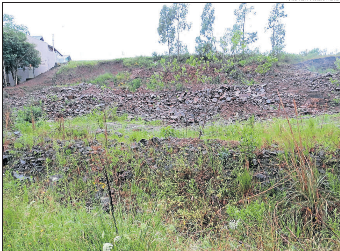
Terreno para construção da nova sede foi cedido pela Administração Municipal de Garibaldi

Atualmente, além de Garibaldi, o Corpo de Bombeiros Voluntários atende ainda os municípios de Boa Vista do Sul e Coronel Pilar. A RSC-