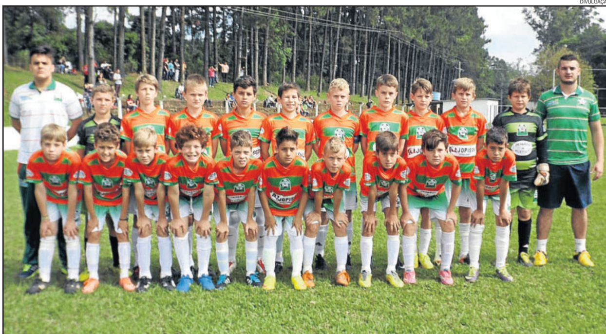
Categoria 2004 da Juventus está nas quartas-de-final do Gauchão Noligafi

Na semifinal, a Sub-15 da Juventus enfrentará o vencedor de Americano (Novo Hamburgo) e Fera (Montenegro), que jogam amanhã para definir a vaga. O certo é que a primeira partida da Juventus na semifinal será fora de casa, e a definição em Teutônia.