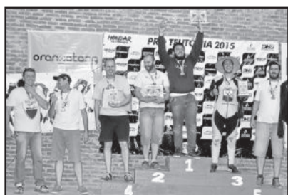
Campeões Street Sled