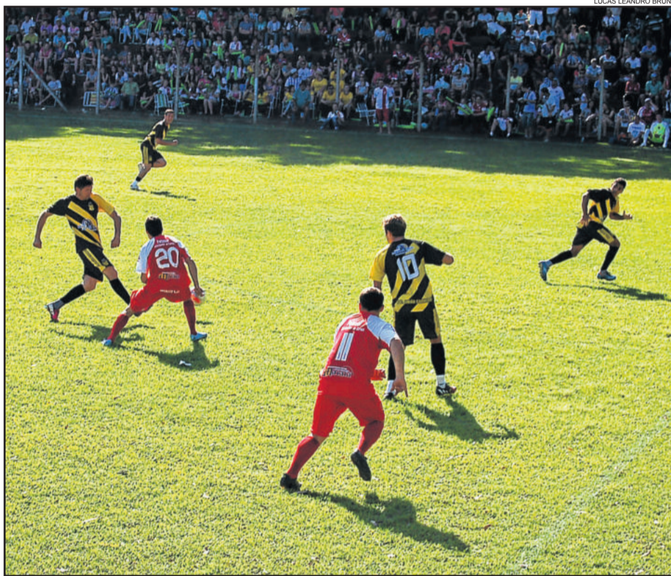
União Carneiros impôs muita velocidade no início de jogo e venceu em Brochier