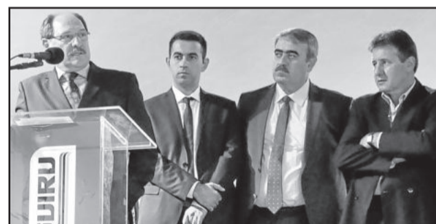
Governador José Ivo Sartori esteve presente, parabenizou a Languiru e disse que modelo é exemplo