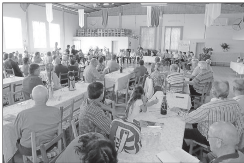
Público prestigiou evento em Linha Frank