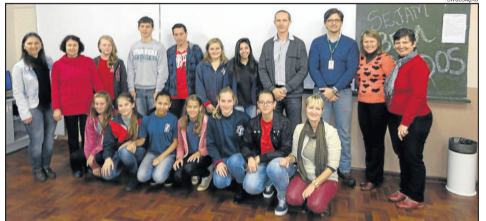
Projeto foi apresentado à Secretaria de Educação e ao Ministério Público