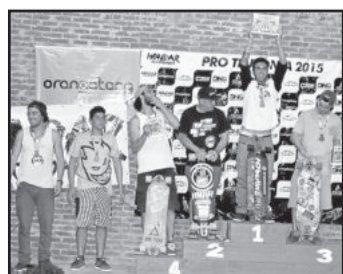
Campeões Open Masculino