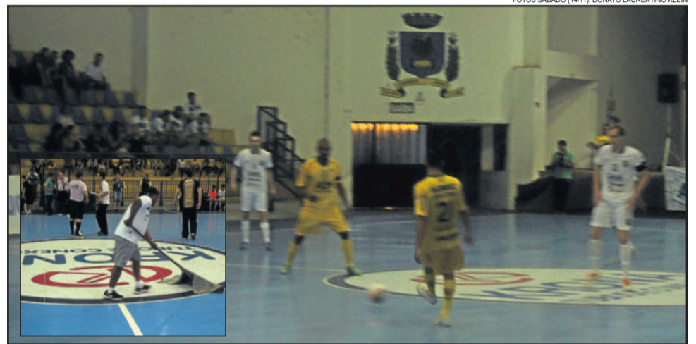
Partida iniciou no sábado, no Ginásio Poliesportivo do Parque do Chimarrão, mas umidade interrompeu jogo, apesar da tentativa de secagem ...