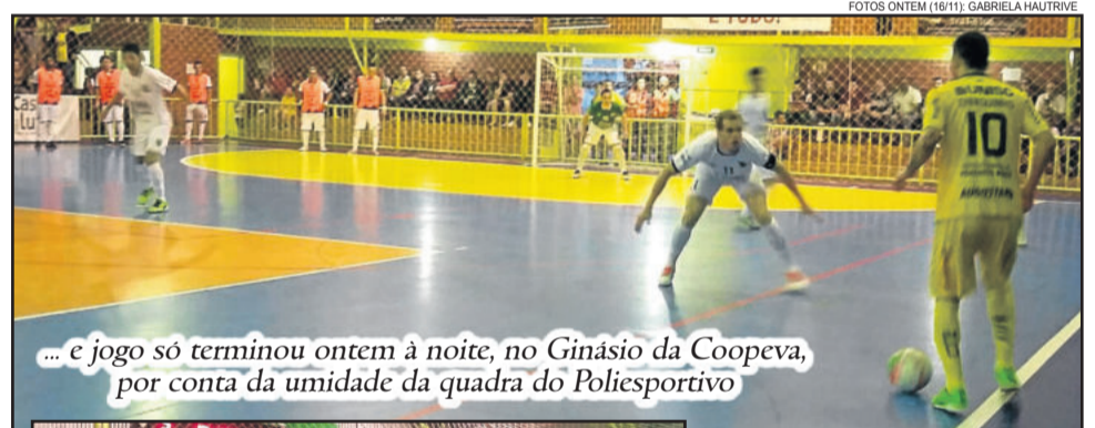
... e jogo só terminou ontem à noite, no Ginásio da Coopeva, por conta da umidade da quadra do Poliesportivo