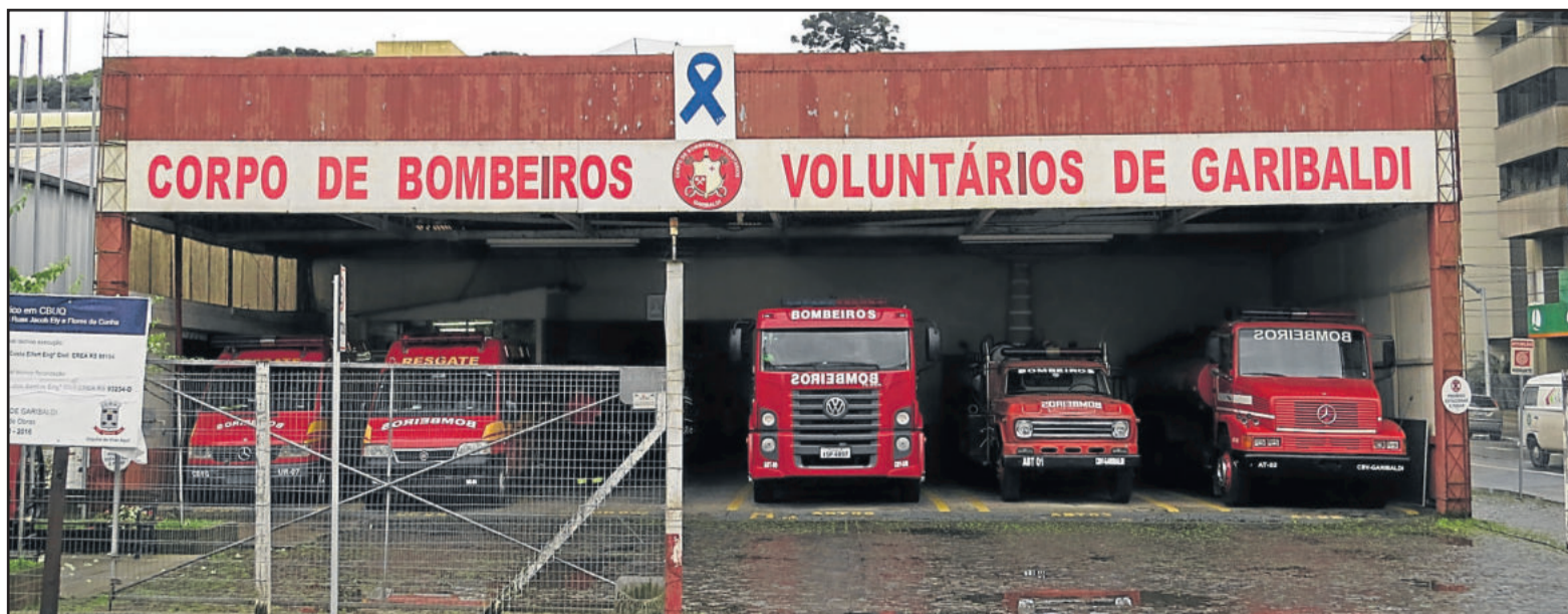
Atual sede da corporação fica em prédio alugado, situado na Avenida Presidente Vargas, no Centro

que atenderá serviços administrativos. Em número de colaboradores, a corporação tem mais de 60. No dia 28 de novembro, dez voluntários receberão formação, totalizando 50 colaboradores voluntários. Outros 12 são funcionários.