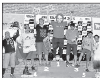
Campeões In Line