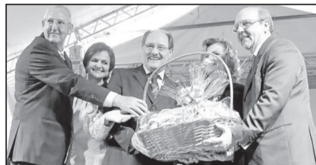
Governador recebeu cesta de produtos da Languiru