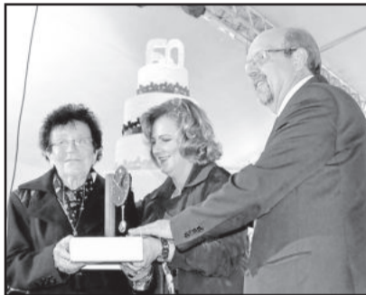
Associados fundadores foram homenageados com lembranças

O presidente da Assembleia Legislativa do RS, deputado Edson Brum (PMDB), parabenizou a cooperativa e os seus associados, e afirmou que o modelo cooperativista é um exemplo a ser seguido pelo Estado. “Tenho