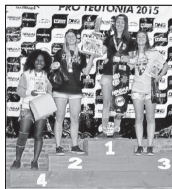
Campeãs Open Feminino