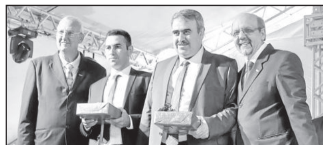
Cientes iraquianos receberam lembrança da cooperativa