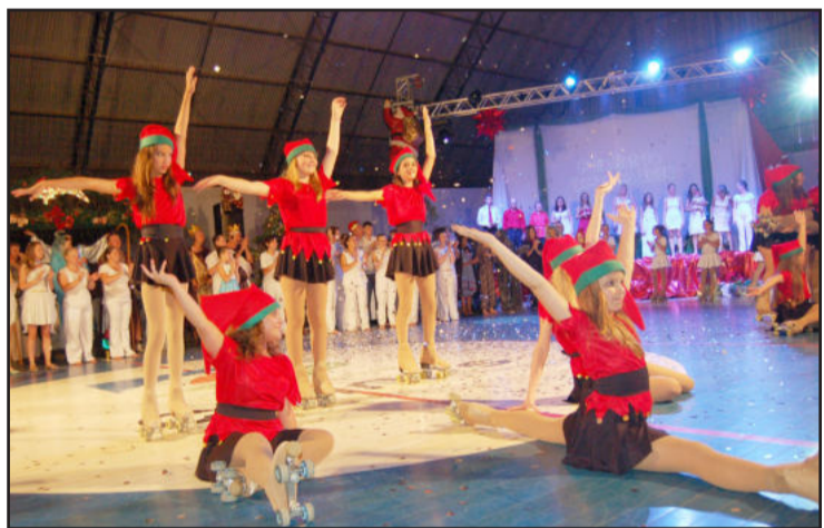
Artistas sobre patins deram brilho especial