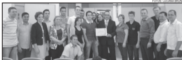
Empresário, familiares e equipe foram homenageados