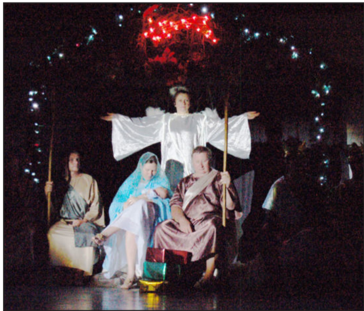
Maria e José, com Menino Jesus, iluminados pelos anjos

Um dos maiores diferenciais do espetáculo de Colinas, produzido por representantes de diferentes segmentos da sociedade, é o brilho