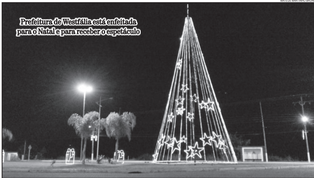
Prefeitura de Westfália está enfeitada para o Natal e para receber o espetáculo

A programação iniciará às 20h30 e contará com as seguintes apresentações: Grande Coral; Emef Olavo Bilac; Espetáculo "Quando chega o Natal" com a Orquestra Municipal de Westfália e o Grupo Teatral Westshowfália; Show Pirotécnico com muitos fogos de artifício; Chegada surpresa do Papai Noel; Sorteio da Campanha Final de Ano Premiada; e, entrega dos pacotinhos de Natal para as crianças cadastradas. A organi-