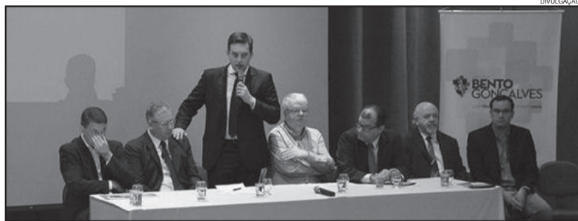
Prefeito Guilherme Pasin, de pé, defende união para que trem saia do papel

O estudo levou em conta duas alternativas para a implantação do modal. A primeira, tecnicamente inviável, considerou o uso do traçado original da ferrovia. Além da baixa velocidade, em diversos pontos seria necessária a construção de diversos viadutos. A segunda alternativa recomendada a implantação de duas linhas.