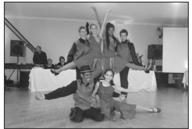
Tango da Vitória