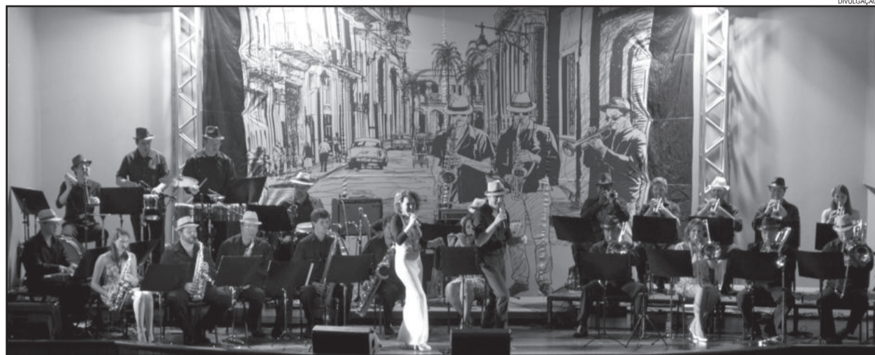
Orquestra Municipal de Garibaldi se apresentará durante o Natal Borbulhante

A mais contagiante de todas as músicas do mundo, será novamente traduzida pela Orquestra Municipal de Garibaldi, no Concerto Sopros do Caribe, onde o canto afro religioso se encontra com a harmonia espanhola e assim como um elegante prato recebe um temperado molho, os acordes aguerridos das guitarras espanholas recebem os ritmos africanos resultando numa combinação que é pura magia. Muito bem, não é Jazz e não é Samba, mas o que é isso? Que tal então chamar de molho? Ou melhor, em espanhol "Salsa"?