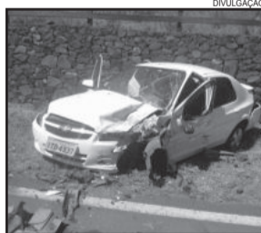
Acidente entre Gol (e) e Prisma aconteceu no sábado