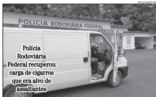
Polícia Rodoviária Federal recuperou carga de cigarros que era alvo de assaltantes

Os assaltantes usaram um automóvel Vectra branco para executar a ação criminosa. Os dois funcionários da Souza Cruz, que foram mantidos reféns, foram deixados no Bairro São Bento em Lajeado e passam bem.