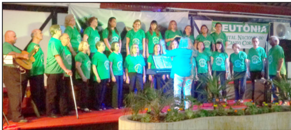
Coral de Uruguaiana fez bela apresentação

O Festival de Corais do Rio Grande do Sul teve início em 15 de janeiro e tem previsão de término para 31 de dezembro de 2013, sob a organização da Federação de Coros do Rio Grande do Sul (Fecors), fundada em 1980 e que tem por presidente Severino Seger. Mais informações podem ser acessadas no site www.fecors.com.br .