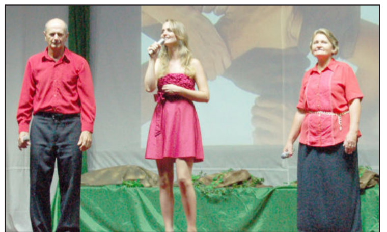
Família emociona cantando

O público foi convidado a ocupar o recinto exterior, em frente ao ginásio, para conferir o show de fogos e a entrega de pacote pelo Papai Noel e Mamãe Noel às crianças presentes à festa.