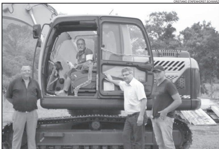
Comitiva recebeu Escavadeira Hidráulica no pátio da Prefeitura

A comunidade westfaliana recebeu um grande presente na manhã desta segunda-feira, dia 16. Em meio as comemorações de final de ano e envolto no clima natalino a Administração Municipal confirmou a aquisição de uma Escavadeira Hidráulica.