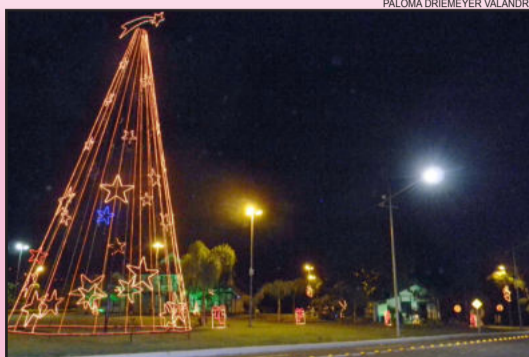
PALOMA DRIEMEYER VALANDRO

Teutônia Município sediou Festival de Coros Página 5