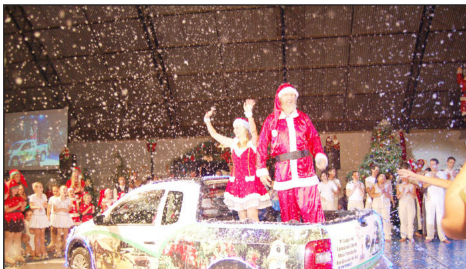
Chegada do Papai Noel