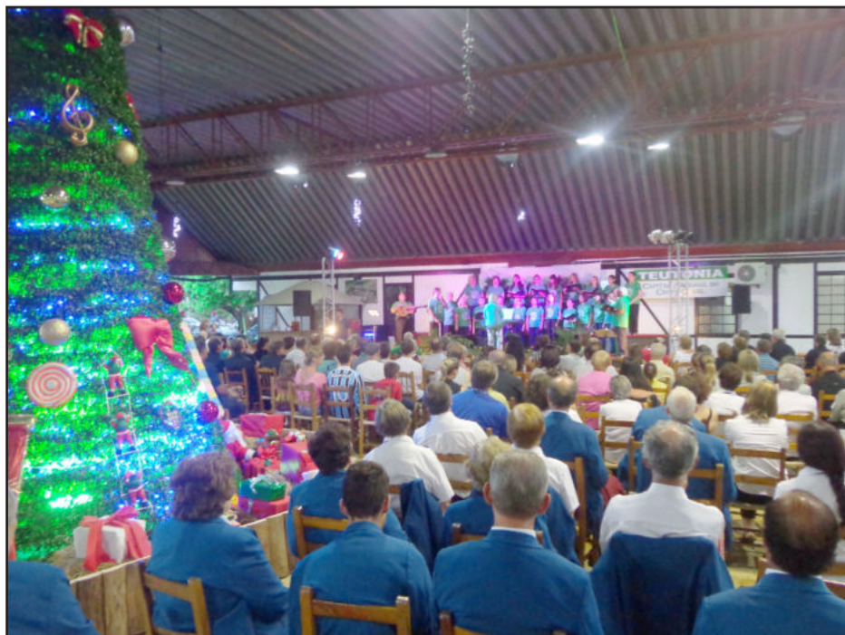
Bom público prestigiou evento