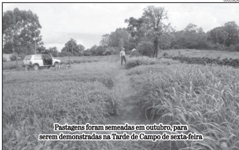
Pastagens foram semeadas em outubro, para serem demonstradas na Tarde de Campo de sexta-feira

Os agricultores terão a oportunidade de participar de seis estações técnicas. A primeira estação é a de abertura e têm duração prevista de 10 minutos, quando serão abordados a importância da produção leiteira, o histórico da produção de leite em Poço das Antas e a situação do setor no Estado, chamada pública do leite e Participação Popular e Cidadã de Pastagens (em 2014