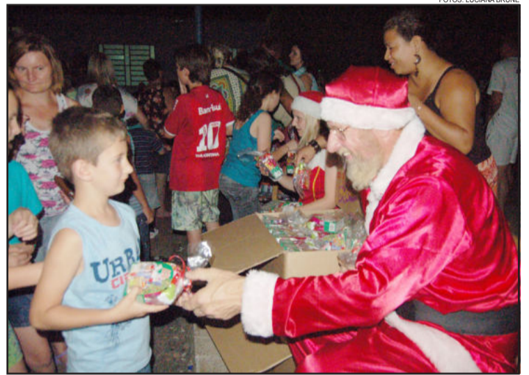
Papai Noel distribuiu pacotes às crianças

da música e do canto. As lindas canções de Natal e com belas mensagens de fé, esperança, amor e paz, são cantadas por cantores da comunidade, de diferentes idades, com uma qualidade ímpar, o que emociona aos presentes.