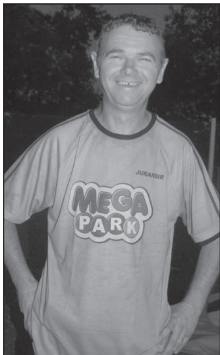
Jurandir da Mega Park