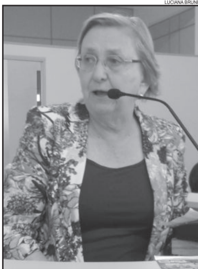
Deputada Zilá deixou sua mensagem

Após acompanhar toda sessão ordinária da Câmara, a deputada também falou sobre a importância de dialogar e debater. "Percebo que aqui acontecem bons debates. E destaco, quando a briga for feia, me convidem para assistir, porque um debate acirrado é importante para aperfeiçoarmos nossa argumentação. É na divergência que se constrói a democracia", afirmou.