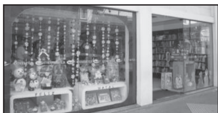
Vitrine da Cometa é grande vencedora do concurso