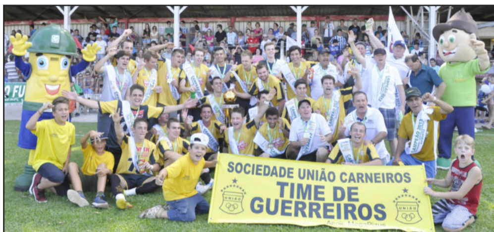
União Carneiros faturou o título na Categoria Aspirantes