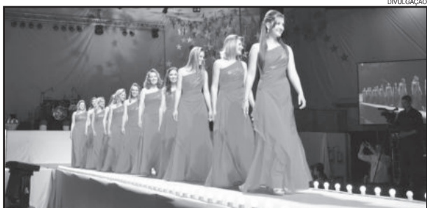
Candidatas do Concurso Senhorita Festiqueijo passarão por um intenso processo de preparação

O evento mais importante de Carlos Barbosa, o Festiqueijo, terá na sua 25ª edição, nova Senhorita e Dama de Companhia, que representarão oficialmente o Festival e o Município por dois anos.