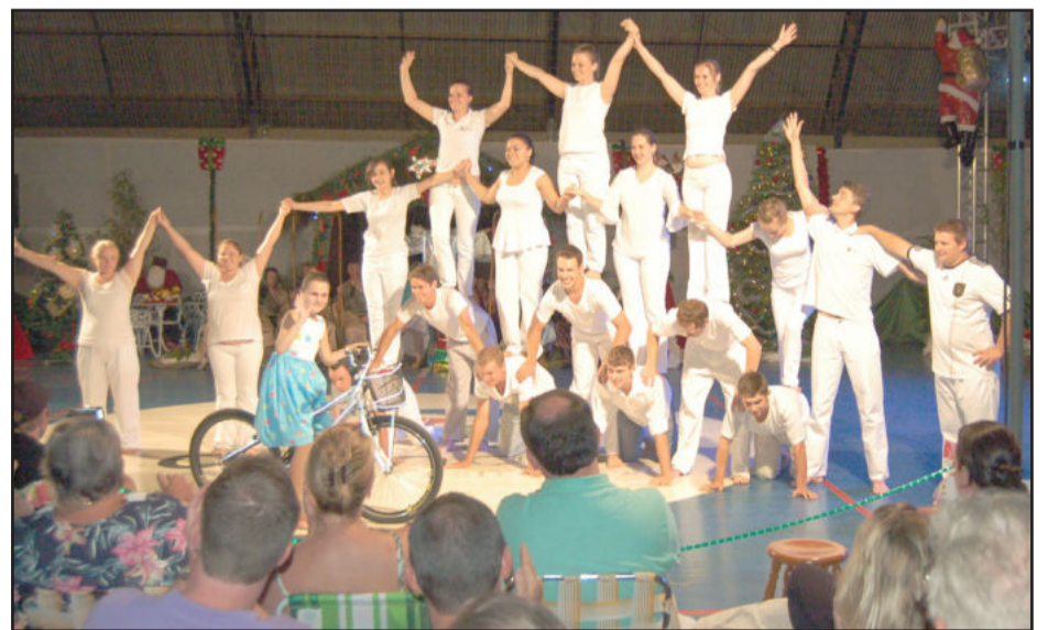
Danças e coreografias