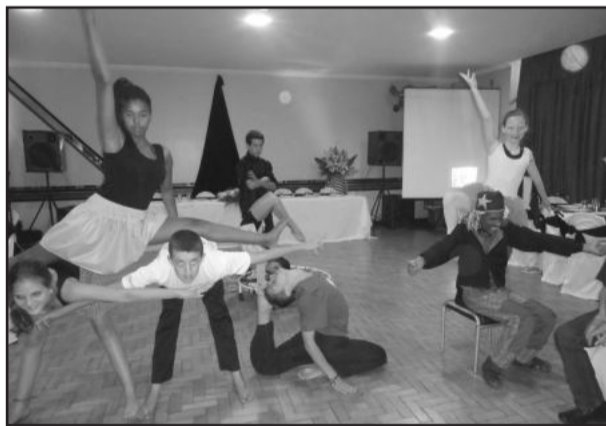
Dança Os Bonecos