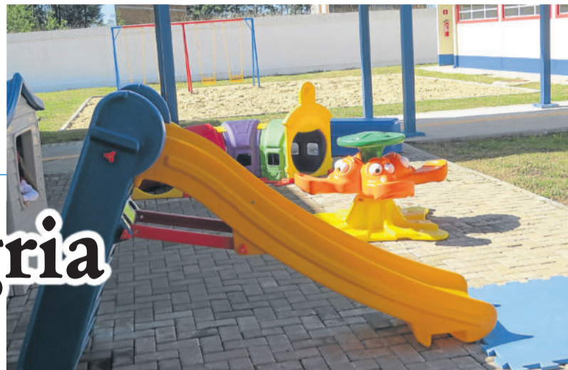
Na parte externa, brinquedos também estão à disposição

Espaço educacional foi inaugurado na manhã de sábado, dia 14, e contou com a presença da comunidade e autoridades