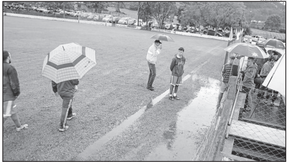
Intensa chuva no início da tarde deixou gramado encharcado na Berlim

Como houve cobrança de alguns ingressos, logo após o cancelamento da rodada a direção do Juventude preocupou-se e tentou devolver o dinheiro aos torcedores. Formou-se longa fila e alguns não pretendiam esperar, furaram a fila e desrespeitaram a direção do Juventude. "De forma nenhuma, o Esporte Clube Juventude de Linha Berlim tentou prejudicar alguém, pois o maior prejudicado sem dúvida, foi o time locatário", destaca nota emitida pelo clube. Por isso, o clube da Berlim decidiu que não cobrará ingresso no jogo final do próximo domingo. Ficará livre para quem quiser doar R$ 5,00 como forma de entrada para a partida. Parte do recurso arrecadado será revertido em benefício do Hospital Ouro Branco.