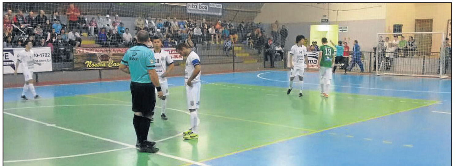
Teutônia Futsal sofreu pela primeira vez 7 gols em uma partida da Série Ouro

* Classificação - Chave 1: ACF, Uruguaiense e União Independente 9; ADCH e Palmeiras 7; ASF 4; UFSM 1; La Máquina 0. Chave 2: Horizontina 10; AIF 8; Cometa, AMF e JáQTáQVá 7; SERCCA 6; Guarani 4; Palmeira Futsal 3; Cerro Largo 2. Chave 3: Parobé 10; ACBF (Cerro Branco) 9; APF 7; Nadas Branco e Atlético Candelariense 5; AMSM 4; Expresso 1; Maxxy Candelas 0.