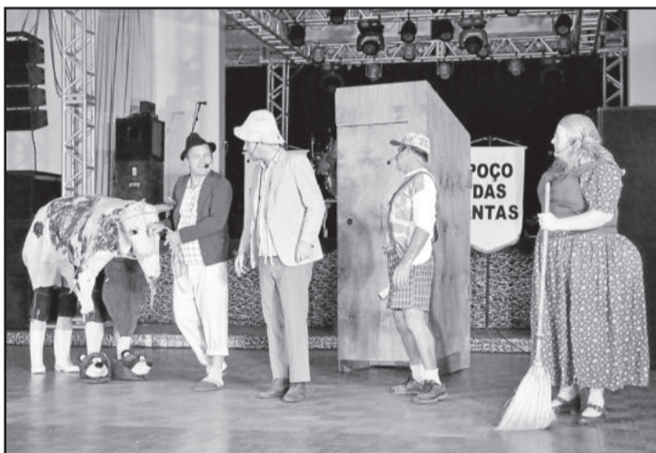
Grupo Helmuth Kuhn apresentou a peça Sangari