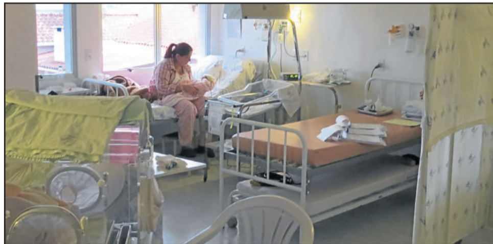
O espaço abriga três crianças que precisam de atendimento com tratamento intensivo