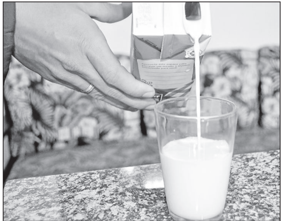
MPF denunciou esquema de corrupção entre fiscais e empresa. Suspeita é que prática ocorre há duas décadas em mais indústrias da região. Qualidade do leite sob suspeita