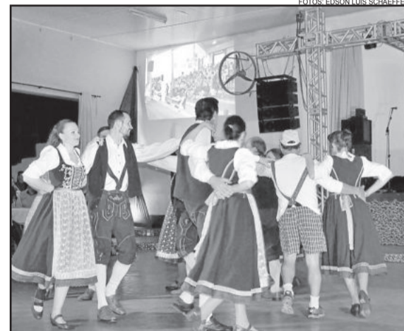
Além do teatro, Grupo Helmuth Kuhn também trouxe a dança folclórica