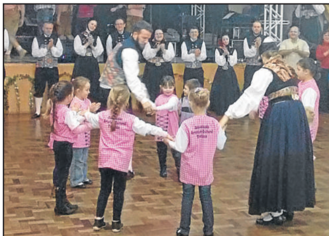
Categoria Mirim (foto) e Infanto-Juvenil também fizeram apresentações