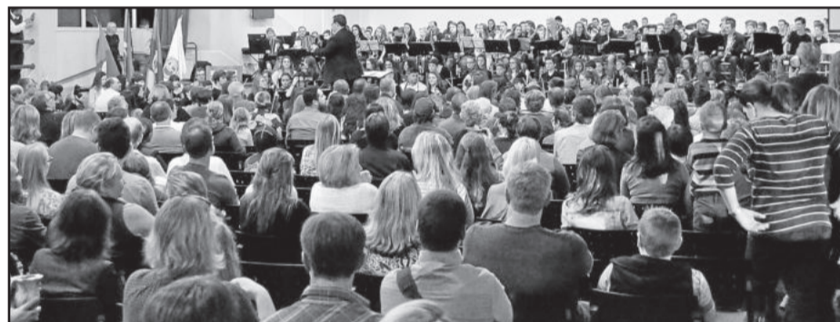
Grande público acompanhou a apresentação

A quinta edição do Sons do Outono já tem data marcada. Tradicionalmente feito no segundo sábado de maio, em 2017 o evento será realizado no dia 13 de maio.