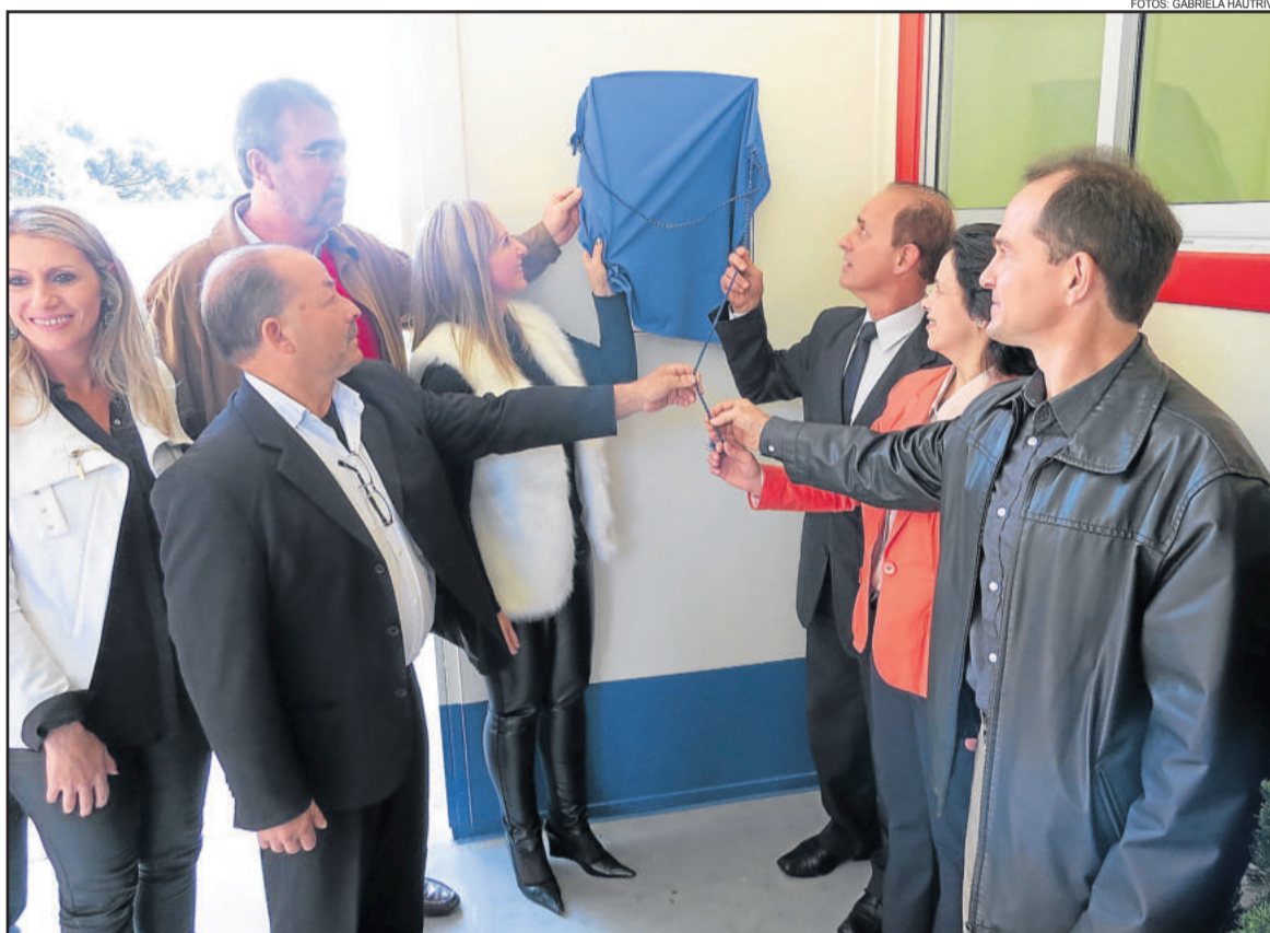
Autoridades fizeram o descerramento da placa inaugural

Conforme o deputado, é a partir de ações como essa que se oferece vida