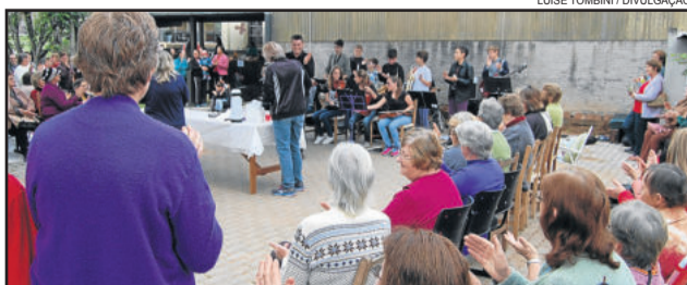
Cerca de 80 mulheres participaram na sexta-feira

O evento foi organizado pela Emater-Rs/Ascar de Imigrante e contou com o apoio da Administração Municipal.