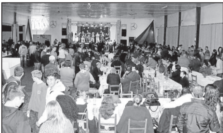
Baile de aniversário reuniu a comunidade poçoantense