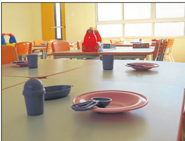
Salas de aula recebem os baixinhos desde ontem