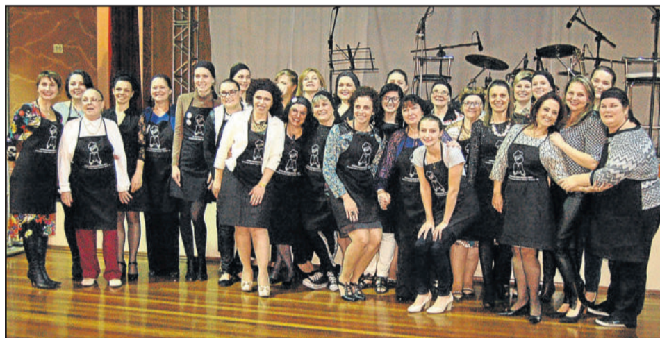
Gourmets voluntárias que prepararam os pratos da noite