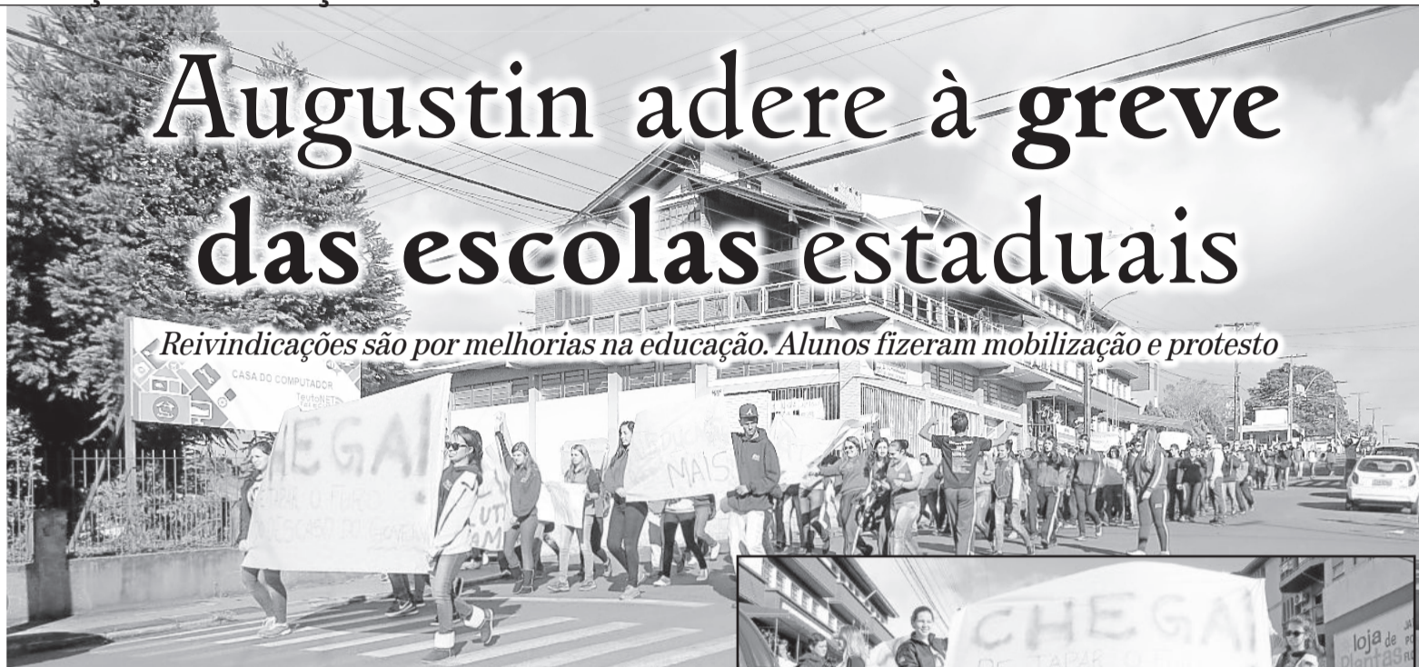
Alunos realizaram caminhada em apoio aos professores e em protesto contra descaso com a educação