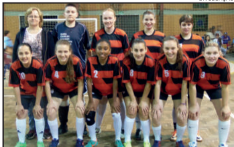
Flamengo defende o título em 2017