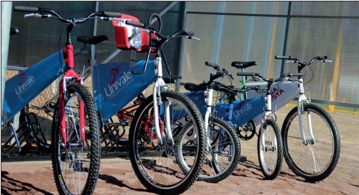
Inauguração do Bike no Parque ocorreu ontem

R ealizar exercícios, caminhar e pedalar. São algumas das muitas possibilidades que os frequentadores do Parque Princesa do Vale possuem no local. Mas desde esta quinta-feira a última opção ganhou ainda mais força. É que mesmo quem não foi até o local de bicicleta ou não faz isso pois não tem uma, poderá a partir de agora pedalar. O programa Bike no Parque, da Secretaria Municipal de Esportes e Lazer (Smel), já disponibiliza, gratuitamente, sete bicicletas para uso de quem tiver interesse e estiver cadastrado.