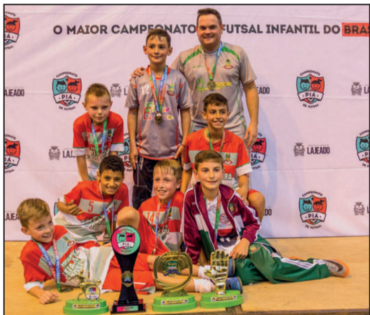
Equipe Santa Clara levantou a taça pela Série Ouro 2007

No futsal feminino, meninas de 2002/2003 e 2004/2005 disputam a competição. Em caso de WO, a equipe responsável será eliminada da competição e não poderá participar da edição do próximo ano. Confira aqui os próximos jogos e os resultados das rodadas anteriores.