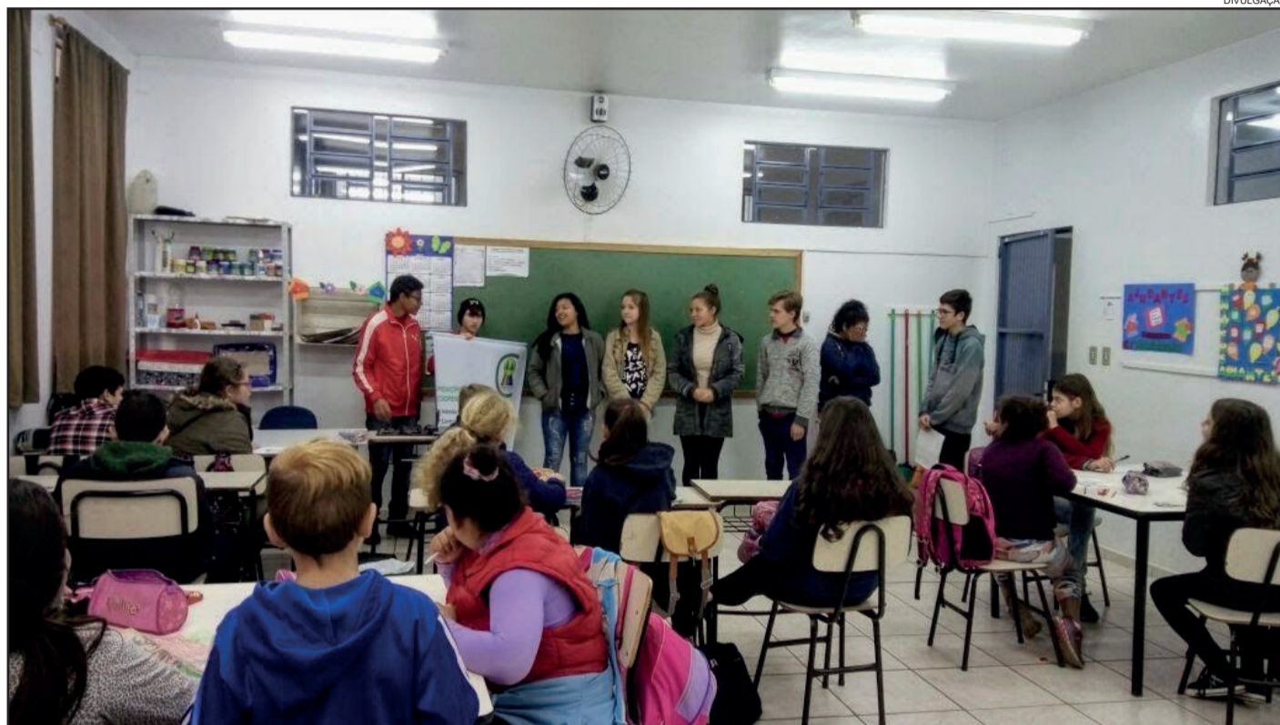
Iniciativa faz parte do projeto Cooperativas Escolares

Um dos objetivos das cooperativas escolares é estimular o trabalho colaborativo, pensando e contribuindo para o desenvolvimento da comunidade. Assim, a Coopemef produz alimentos artesanais para promover a venda e angariar recursos financeiros para a entidade. A produção, além de testar os conhecimentos das crianças, contribui financeiramente para ações realizadas pela cooperativa. Desta forma, a Coopemef desenvolve os valores do cooperativismo, que são discutidos e trabalhados pelo projeto "Cooperativas Escolares", idealizado pela Secretaria Municipal de Educação e pela Sicredi.