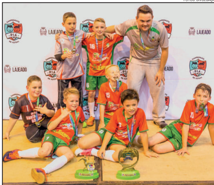
Equipe Santa Clara também levantou o caneco pela Série Ouro 2008