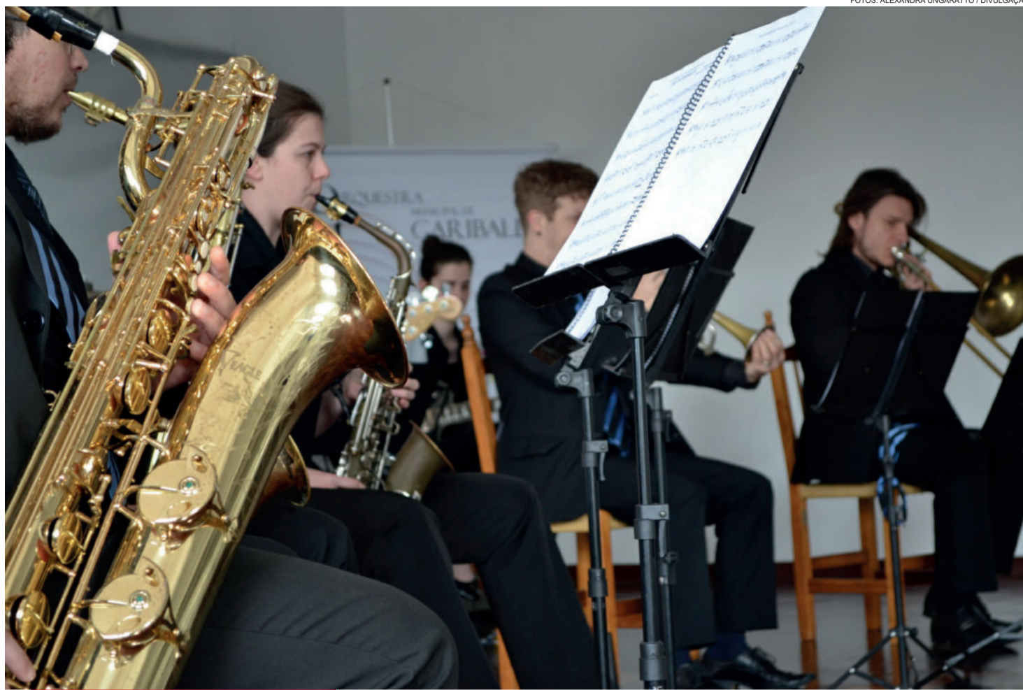
Concerto Didático na escola Pedro Cattani