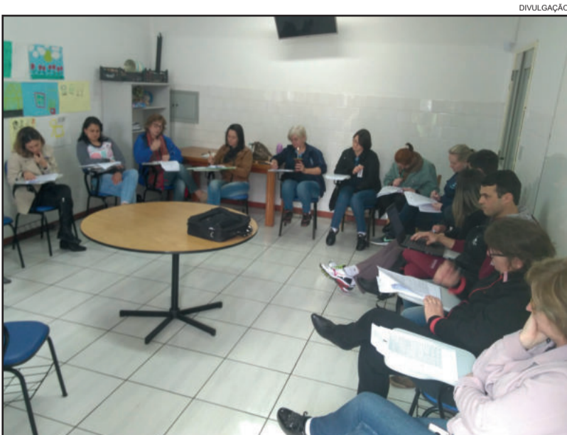
Comissão organizadora se reuniu para definir preparativos do evento

Com o tema “Política Nacional de Vigilância em Saúde e o fortalecimento do SUS como direito à Proteção e Promoção da Saúde do povo brasileiro”, a 1ª Conferência Municipal de vigilância em Saúde acontecerá na terça-feira, 29 de agosto, no auditório da CIC Teutônia. Com grupos de trabalho e mesas de debate, o encontro vai discutir assuntos relacionados ao trabalho da Vigilância em Saúde para a melhoria da qualidade de vida da população e o fortalecimento do Sistema Único de Saúde (SUS). A Vigilância em Saúde é constituída pelas vigilâncias: Epidemiológica, Sanitária, Ambiental e de Saúde do Trabalhador.