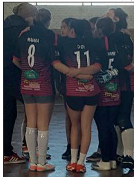
Voleibol movimentou 245 alunos em mais uma etapa do Jiteu

infantil e juvenil, nas categorias masculino e feminino. Os jogos foram realizados nas Escolas 24 de Maio e Teobaldo Closs em Canabarro. Confira os ganhadores: