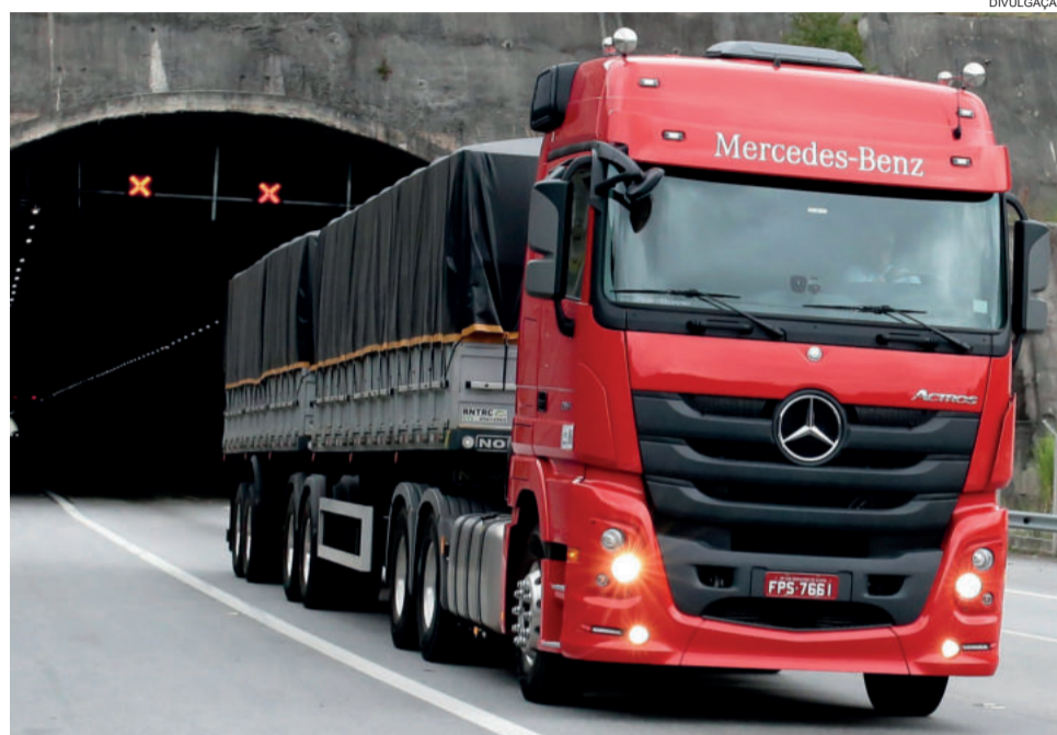
A marca da estrela lidera as vendas de caminhões no estado

Além disso, a manutenção desse caminhão, em um período de cinco anos, é 15% menor em relação aos principais concorrentes. “O Actros é um forte representante da Mercedes-Benz para aumentar ainda mais a preferência dos gaúchos pela nossa marca. Enxergamos potencial para ampliar a participação desse caminhão, uma vez que o produto oferece o que há de melhor em conforto, segurança e desempenho no segmento de extrapesados”, afirma Weiand.