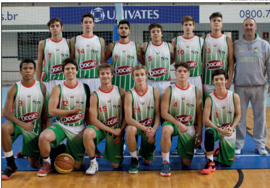
Equipe Sub-17 de Lajeado vai jogar no Paraná

As categorias de base do Ceat/Bira contam com a parceria da Prefeitura Municipal de Lajeado. São patrocinadores a Univates, Docile, Fruki e Joalheria Lenz. São apoiadores a Unimed, Lajeadense Vidros, Kikão Lanches, Padaria Suíça, Restaurante Prêmios, Restaurante Henicka, Restaurante Tombado, Restaurante Q'Delícia e Fisioterapeuta Felipe Graciola.