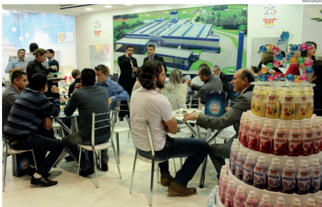
Girando Sol vai novamente participar da Expoagas e destacar produtos como o amaciante concentrado, que agora tem o certificado “dermatologicamente testado”