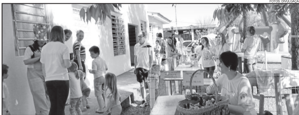
Pátio da escola foi palco da festa

A família Girassol reuniu alunos, professores, pais e demais familiares para uma tarde diferente na escola. A 1ª Festa da Família da Escola de Educação Infantil, localizada no Bairro Languiru, foi uma proposta para estimular a convivência prazerosa da comunidade escolar sem necessidade de uma data comemorativa para reunir a todos.