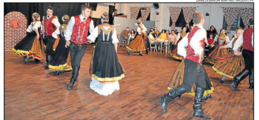
Grupo Oficial do Morgenstern em sua apresentação em 2015

Atrações: 15h - Bierwagen percorre as ruas da cidade; 19h - início da recepção dos grupos; 19h - início do jantar; 20h - início das apresentações dos grupos convidados; 22h - apresentação do grupo anfitrião; 23h - início do baile com animação da banda K'necus.