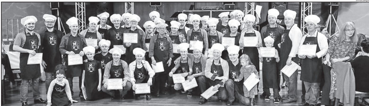
Última edição do Jantar Homens na Cozinha ocorreu em 2015

Será mais um show de solidariedade, manifesta no trabalho dos gourmets, da diretoria do Clube de Mães, dos colaboradores da Cirandinha e do Opa Haus, da comunidade que apóia e no ato de cada pessoa que participa do evento, através da compra de seu ingresso. Uma ação coletiva que beneficia crianças e idosos atendidos pelas entidades.