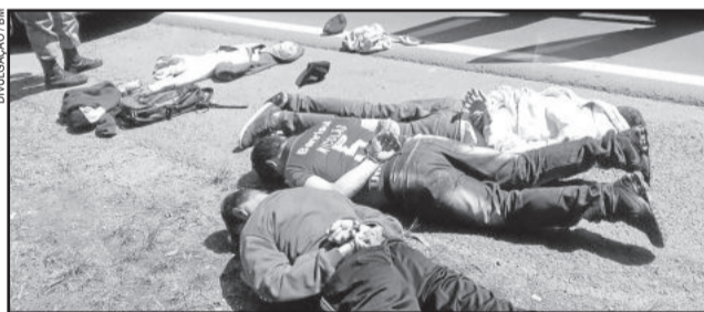
BM prendeu os três homens após interceptá-los na estrada

Foram recuperados todo dinheiro roubado e um notebook. Os policiais ainda apreenderam um revólver, que estava com os ladrões.