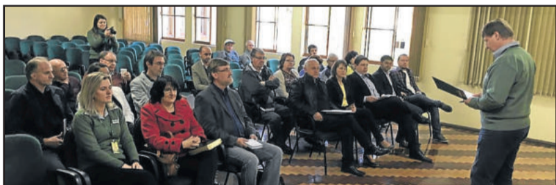
Candidatos tiveram primeiro encontro com lideranças no mini-auditório