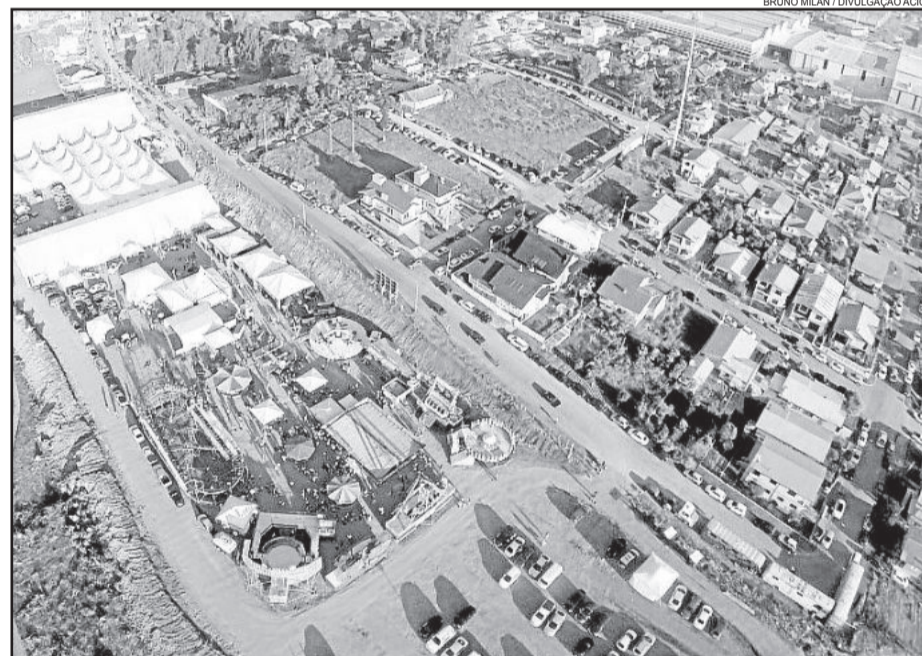
Parque de Eventos Guido Pasqual Sganderlla recebe segundo fim de semana de atrações

Informações: www.expocarlosbarbosa.com.br / (54) 3461.7600