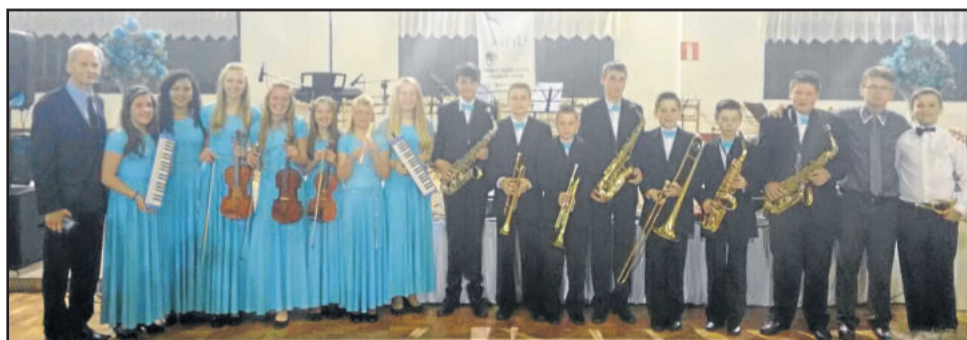
Atualmente, Orquestra Sinfônica é composta por 15 jovens