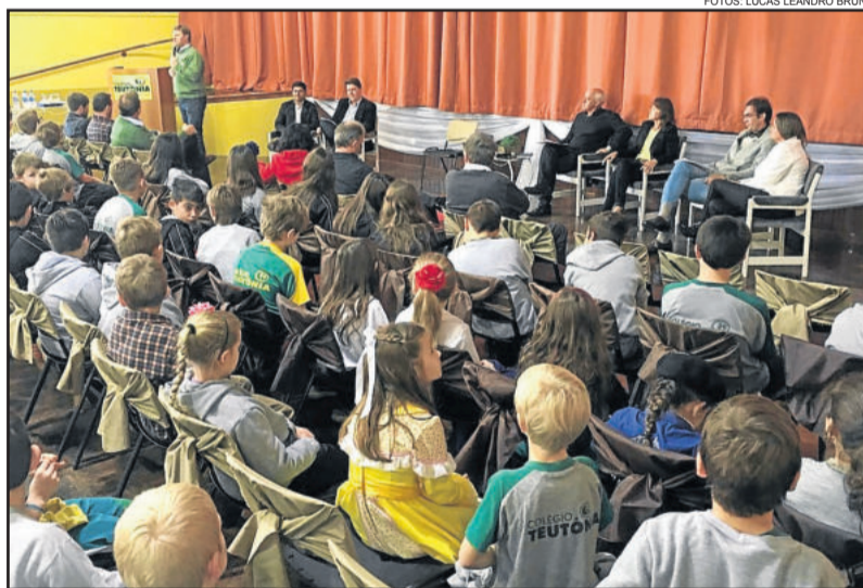
No auditório central, falaram para os estudantes