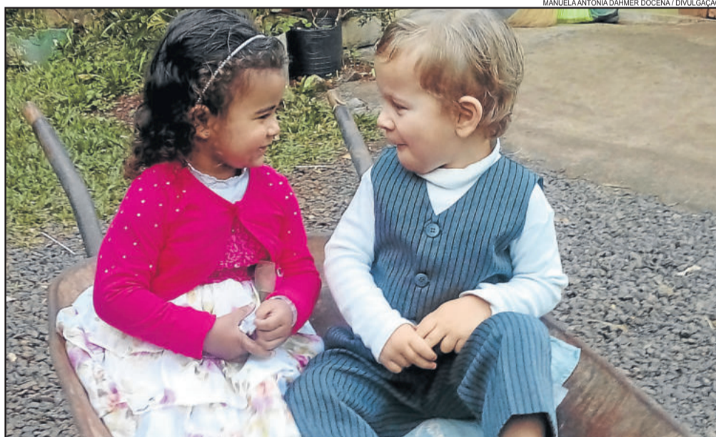
4º lugar 2016. O SORRISO SINCERO E AMIGÁVEL ENTRELACANDO A DIVERSIDADE CULTURAL