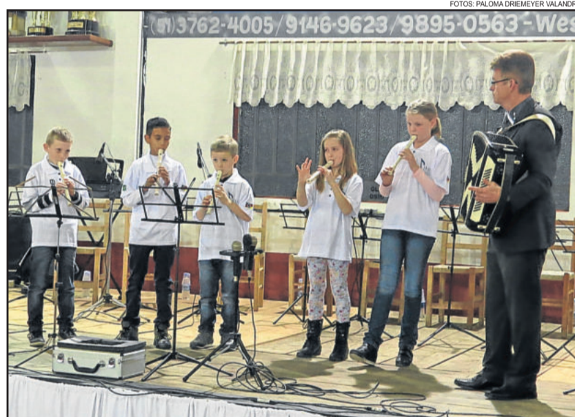
Alguns alunos do Projeto Música na Escola abriram as apresentações