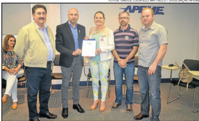
Lideranças da APEME, AGAMÓVEIS e AVIGA, reunidas com os candidatos a prefeito e vice-prefeito de Garibaldi