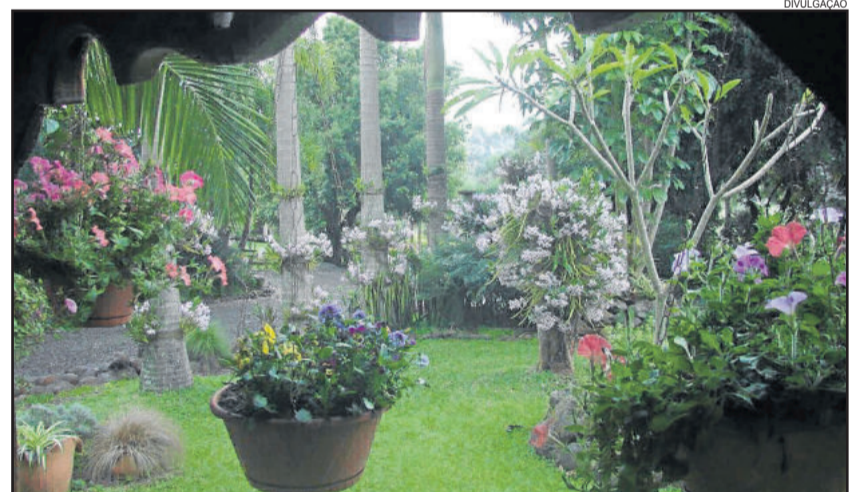
Jardim O-concur de Colinas