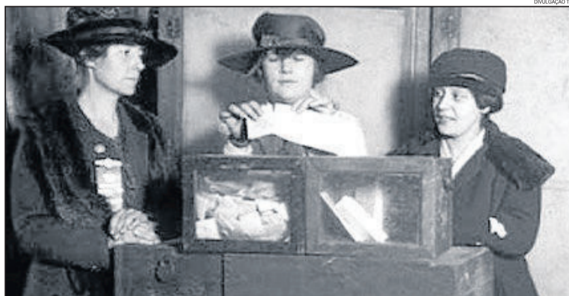
Voto da mulher foi garantido em 24 de fevereiro de 1932

Tem-se como marco da consolidação da participação feminina na política a decisão do Congresso Nacional (logo após a 4ª Conferência Mundial das Mulheres ocorrida em Beijing, na China) de adotar uma política de cotas para tentar reverter a exclusão das mulheres brasileiras