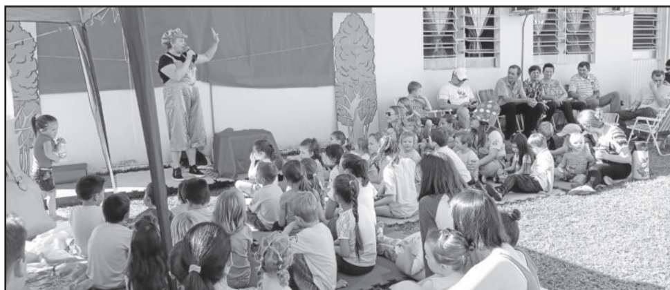
Hora do Conto para alunos

Apesar do imenso calor que fez na tarde de sábado, o público compareceu e desfrutou da festa, que se transformou num momento de descontração e confraternização entre as famílias que têm seus filhos na escola.