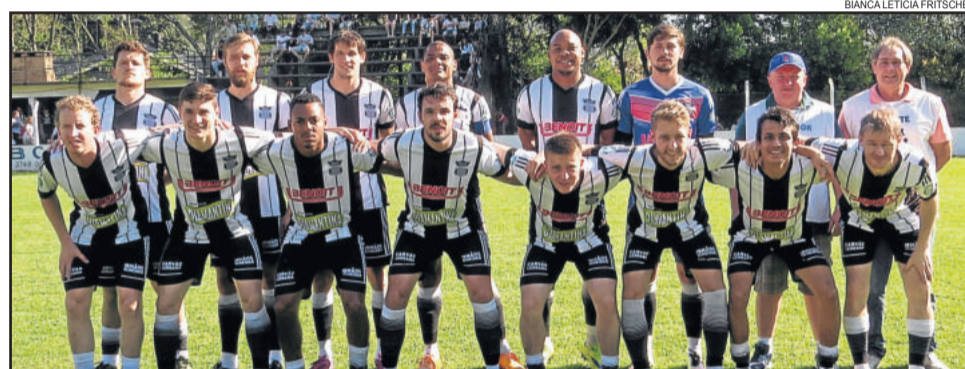
ECAS enfrenta o Amigos de Arroio do Meio na próxima fase

A segunda fase da 19ª Copa Certel Sicredi inicia às 13h30min para a categoria Aspirantes e às 15h30min para os Titulares. A Rádio Popular 96,9 FM realiza ampla cobertura dos jogos neste domingo.