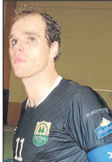
Capitão Karoki está fora hoje

A última rodada da repescagem será dia 24 de setembro. Teutônia atuará em casa contra a Assaf, de Santa Cruz do Sul.