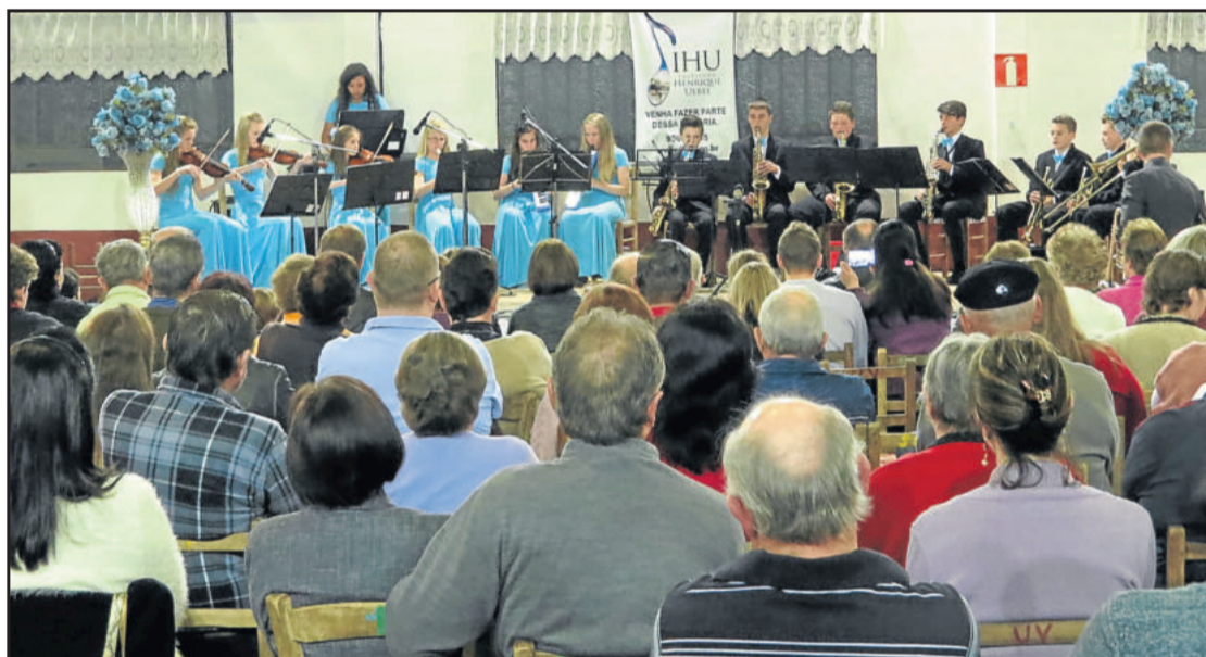
Pais, familiares e comunidade prestigiaram o concerto de estreia da Orquestra