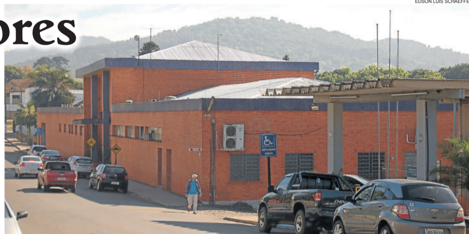
Demissões na Couros Bom Retiro são necessidade em função da retração do mercado, conforme informou a direção da empresa

Em uma publicação no Facebook de uma funcionária demitida, ela relata que não faz mais parte do quadro funcional da empresa, outras pessoas comentaram que estariam “na mesma lista” nos próximos