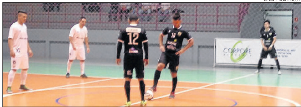
Em Bento Gonçalves, ASTF (preto) conseguiu o empate