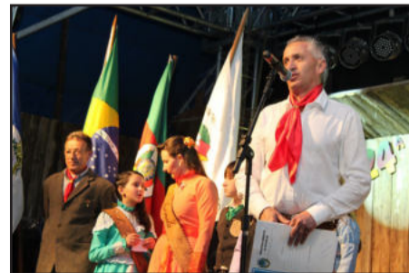
Prefeito Tarso Bastiani abrindo o evento