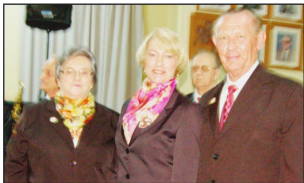
Filha (e) homenageou os pais