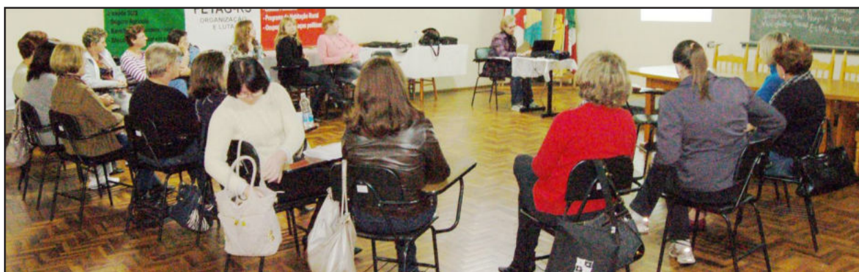
Liga Feminina realizou prestação de contas de dois anos de atividades