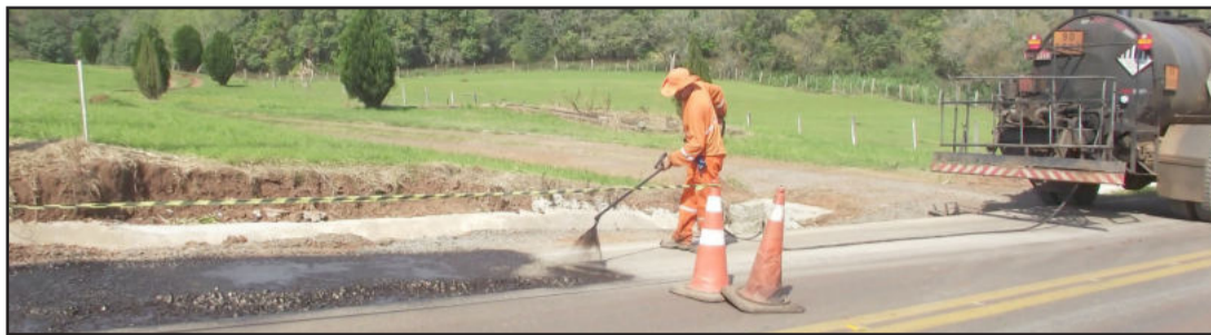
Obras sendo realizadas na Transvale

A rodovia Transvale, que interliga os municípios de Paverama e Teutônia, está recebendo reparos em pequenos trechos. Ocorreram infiltrações e consequentemente a deterioração de partes da rodovia. A empresa responsável pela obra está dando o suporte necessário para o reparo. Pequenas interrupções no trânsito são necessárias para a realização do trabalho.