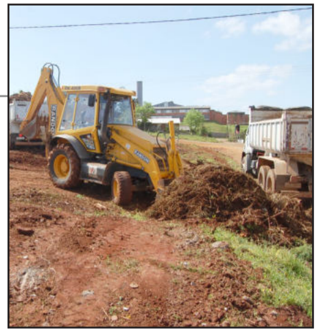
Área de 4 ha foi doada pela prefeitura para a construção das 30 moradias