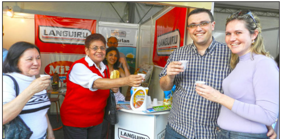
Visitantes degustaram Chocolan na Santa Flor

Região de grande importância econômica para o Estado, o Vale do Taquari registrou, novamente, a realização de