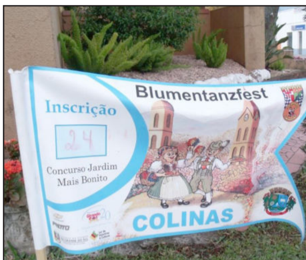
Jardins concorrentes receberam banners indicativos

Este ano, a Baile das Flores de Colinas terá uma programação especial. Hoje, dia 17 de setembro, acontece o tradicional jantar-baile com apresentações artísticas de mais de 20 grupos visitantes e o show do grupo anfitrião Morgenstern. A festa será animada por duas bandas: Banda K'necus e Banda Alma Nova. O início da programação será às 19 horas. A promoção é do Centro Cultural Morgenstern e da Administração Municipal de Colinas.