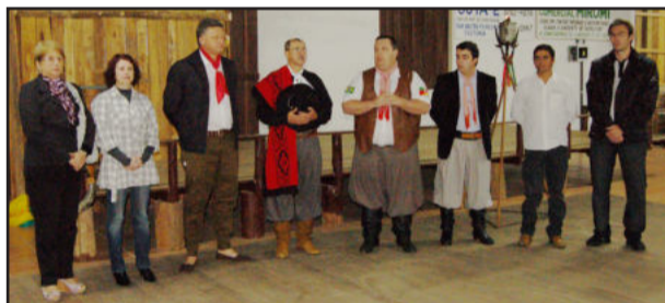
Programação integra entidades tradicionalistas de Teutônia

Parabéns ao grupo tão grande e esforçado que mantém a tradição em Teutônia", enfatizou.