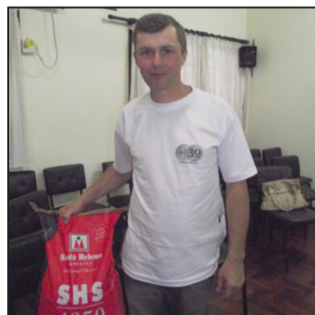
Ganhador do sorteio