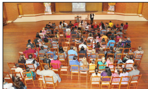
O evento contou com a presença de muitos teutonienses

nal do SBT e receberão dicas de moda, saúde e beleza para se prepararem para o dia em que acontecerá o grande evento final. Este evento acontecerá no teatro do Bourbon em Porto Alegre, no dia 20 de novembro, onde os modelos desfilarão diante de uma plateia de agências selecionadoras de modelos kids e teen. Todos os modelos da Top Kids são selecionados por uma ou mais agências. Algumas delas são: agência Up Model's, agência Guri e Guria, agência Charme Sul, agência Contexto, agência Vibe Model's, agência Joy Model's, agência People e agência Premier Model's. Do evento também participará o ator Yudi Tamashiro, atuante no programa Bom Dia e Cia do SBT, que foi selecionado pela Top Kids e estará presente para interagir com as crianças e adolescentes.