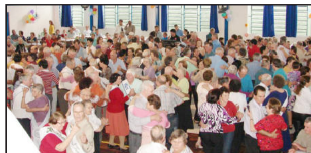
Pista de dança está sempre tomada pelos festeiros