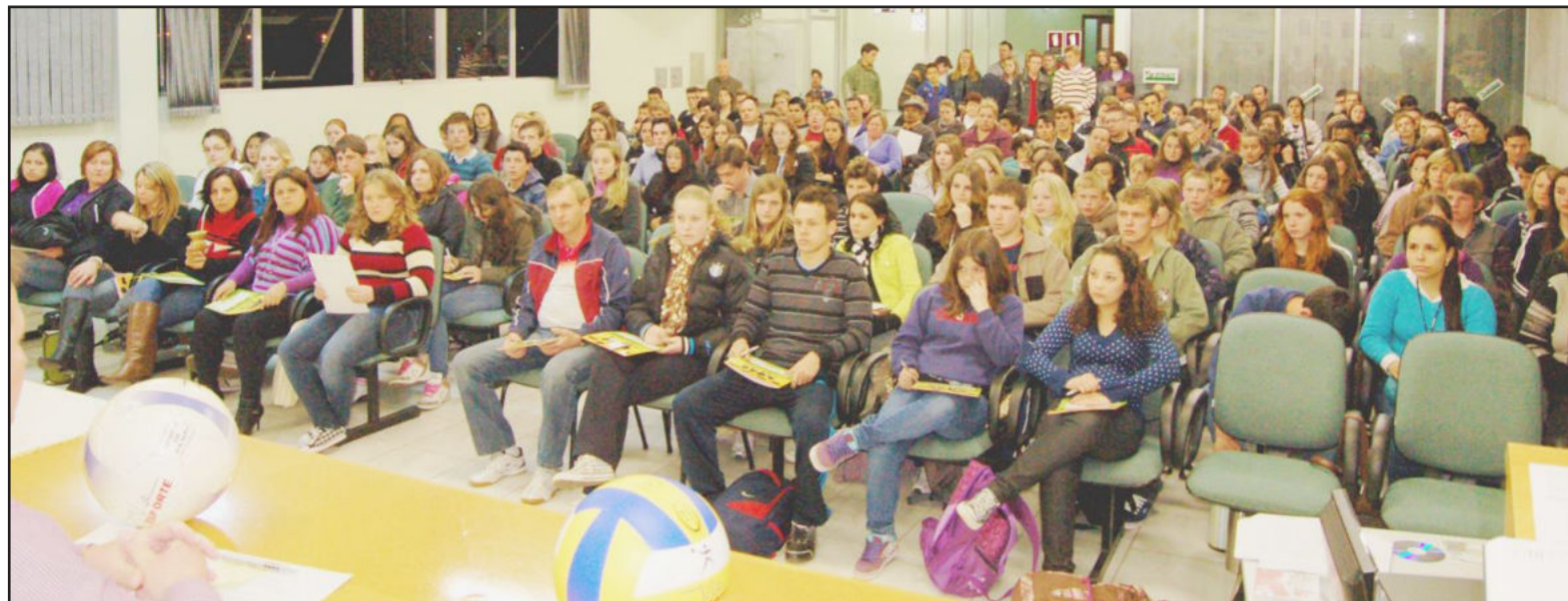
Auditório do Sitalte lotou de jovens na Conferência da Juventude

Município promoveu a 1ª Conferência Municipal da Juventude nesta semana