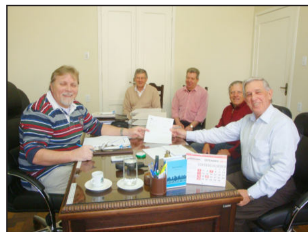
Prefeito Celso Brönstrup e os representantes da Comunidade

A Comunidade Evangélica de Estrela recebeu mais R$ 29 mil do Município, por meio da Secretaria de Educação. A oficialização da entrega do auxílio ocorreu na manhã desta quinta-feira, dia 15, no gabinete do prefeito.