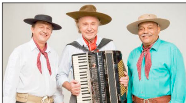
Grupo os 3 Xirus animará o evento na segunda

A saída do transporte do interior do município de Colinas será às 12 horas, e o roteiro será como de costume.