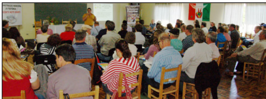
Seminário de Incentivo às Agroindústrias Familiares teve expressiva participação

Representantes da Sicredi Ouro Branco e do Banco do Brasil apresentaram linhas de crédito disponíveis para produtores rurais investirem em agroindústrias. Após, os produtores ainda degustaram produtos preparados pela comissão organizadora do seminário, aproveitando o momento para trocar experiências.