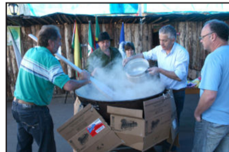
Comida típica e campeira são atrações