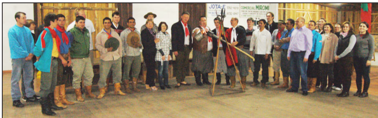
Acesa a chama crioula em Teutônia

Abertura oficial marcou integração de entidades tradicionalistas