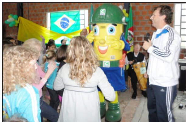
Festa da Escola Getúlio Vargas mobilizou a comunidade de Linha Harmonia