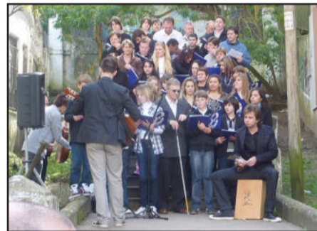
Apresentação realizada em Porto Alegre