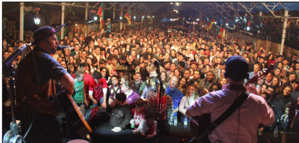
Expressivo público prestigia atrações em Muçum