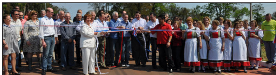
Inauguração foi realizada ontem

A faixa de ciclovias, também inaugurada na manhã de ontem dá sequência ao anel cicloviário de Lajeado, compreendido pela Avenida Amazonas e ruas Beija Flor, Sabiá, Bento Rosa e Bento Gonçalves, totalizando 6 km de extensão e que demandou R$ 250 mil em investimentos.