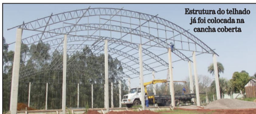
Estrutura do telhado já foi colocada na cancha coberta

A cancha coberta na Cidade Baixa recebeu a estrutura do telhado. Nos próximos dias será colocado o telhado, permitindo assim que possa ser