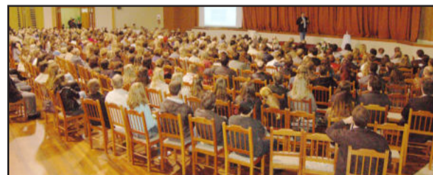
Cerca de 400 pessoas participaram da palestra

O palestrante destacou o desenvolvimento humano, defendendo que a competência pessoal e profissional do indivíduo é a soma de vários hábitos e características, sejam elas físicas, emocionais ou espirituais. A palestra foi uma iniciativa do Subcomitê da Qualidade de Teutônia, em parceria com a CIC Teutônia, o Comitê Regional da Qualidade do Vale do Taquari e a ACIL Lajeado.