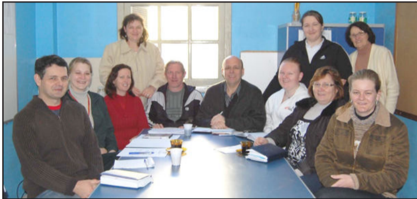
Alguns membros do Conselho na reunião do dia 12

Na segunda-feira, dia 12, em reunião extraordinária, o Conselho analisou Plano de Trabalho enviado à Funasa, para o tratamento do sistema de esgoto, a ser implantado na Sede e no Bairro Daltro Filho. “O objetivo do Conselho é a qualidade de vida e o eficaz atendimento à população na área da Saúde, além de