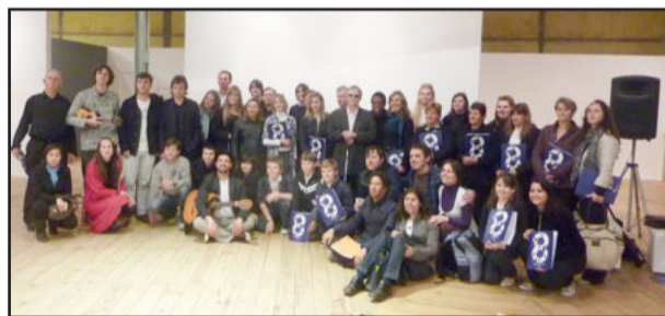
Integrantes do Coro de Queixas e apoiadores

Representantes da Arca estiveram presentes nas duas performances do Coro de Queixas de Teutônia, conferindo a belíssima e descontraída performance do grupo. Lembrando que o Coro de Queixas se apresenta dia 01 de outubro, às 19 horas, na Associação da Água, durante o 1º Salão de Artes Visuais - A Vida Tomando Forma, que integra a programação da 4ª Teutoart, evento promovido pela Arca em parceria do Centro Cultural 25 de Julho, com apoio da Prefeitura Municipal de Teutônia e diversas empresas da região.