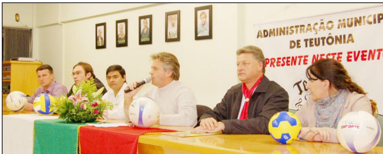
Autoridades destacaram, na abertura, a importância de ouvir o jovem