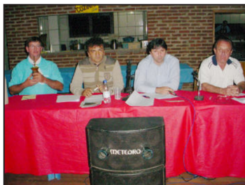
Mesa diretora no CTG