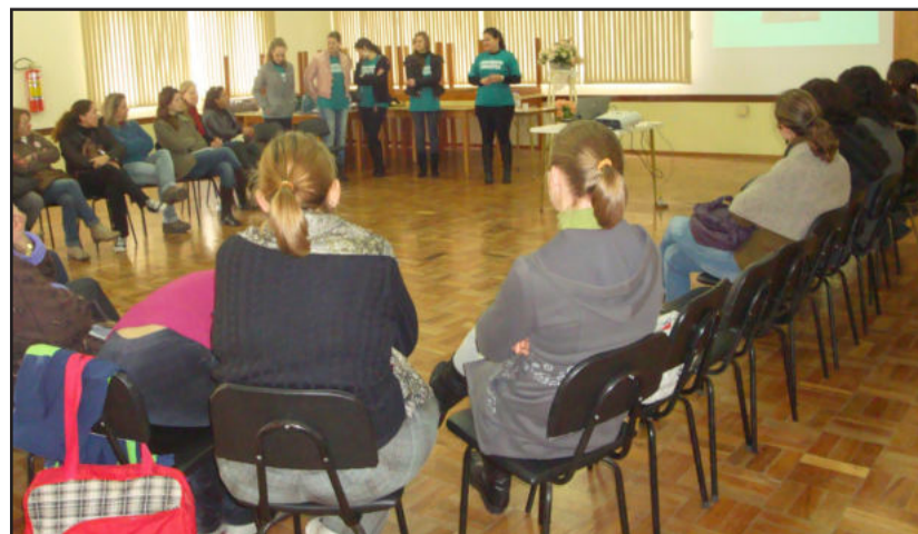
Encontro ocorreu no Salão Paroquial de Estrela

vidades de observação, orientação e avaliação do desenvolvimento neuropsicomotor das crianças de 0 a 4 anos.