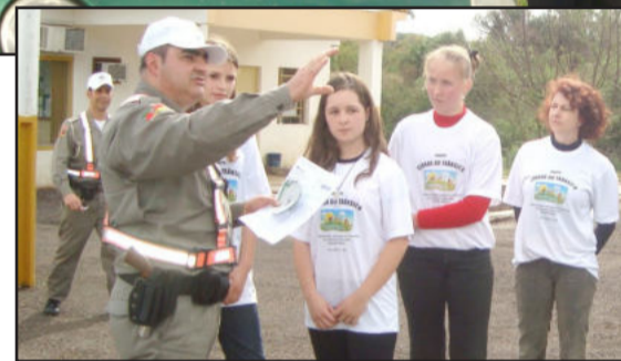
Mini blitz é realizada por policiais e estudantes para orientar motoristas

chert, direção e alunos da EMEF Teobaldo Closs.