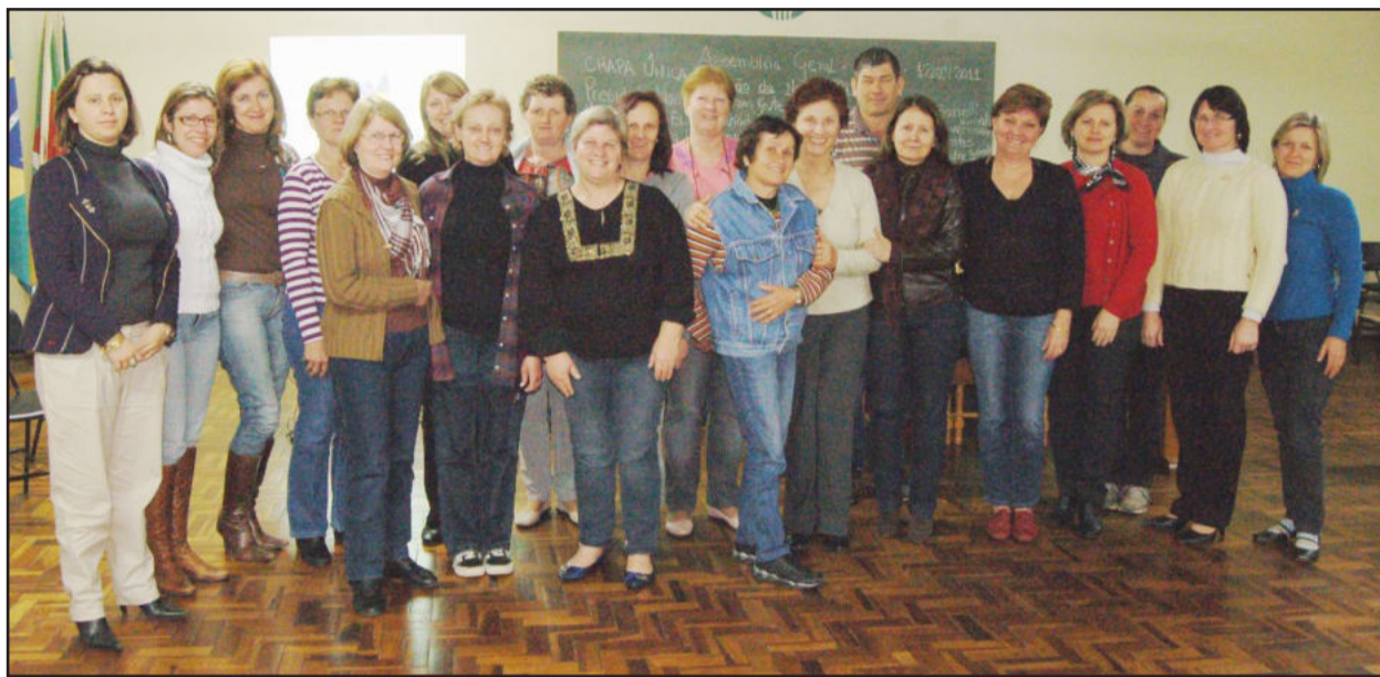
Nova diretoria e voluntárias da Liga Feminina de Combate ao Câncer de Teutônia

Entidade completou dois anos nesta quinta-feira, dia 15 de setembro