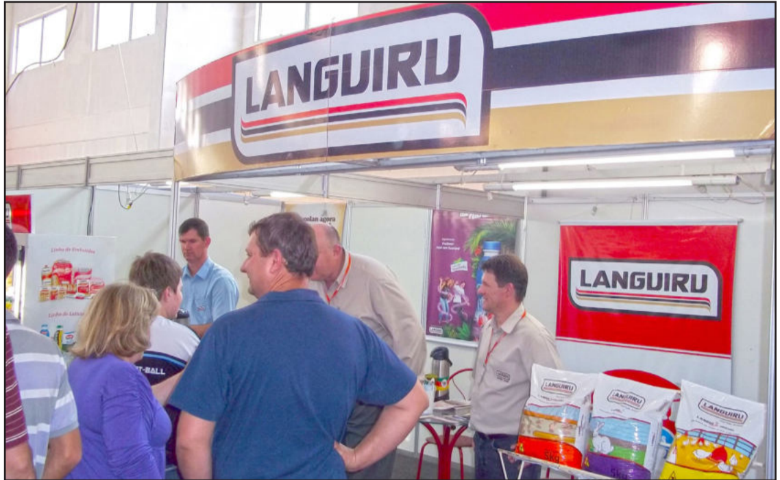
Estande da Languiru recebeu associados e clientes na Multifeira