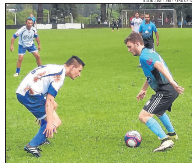
25 de Julho (camisetas brancas) e Saidera tiveram desempenhos distintos nos dois tempos do jogo