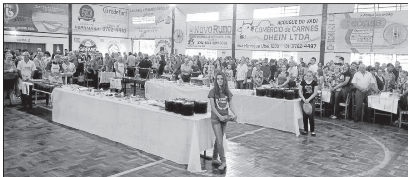
Mais de 850 pessoas participaram da celebração