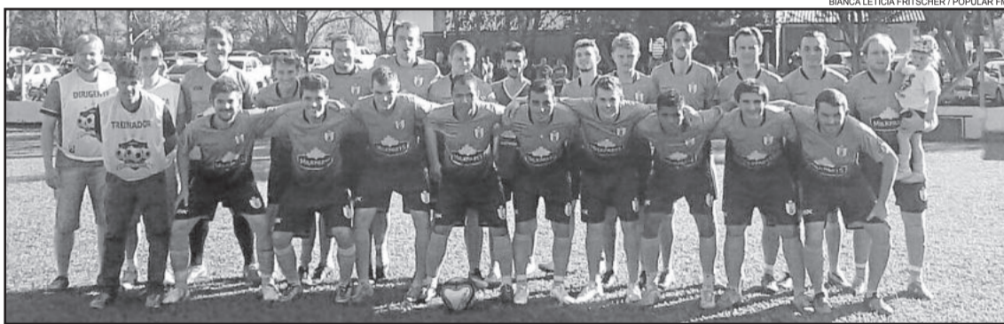
Única equipe que restava de Teutônia, Saidera perdeu e se despediu do Regional