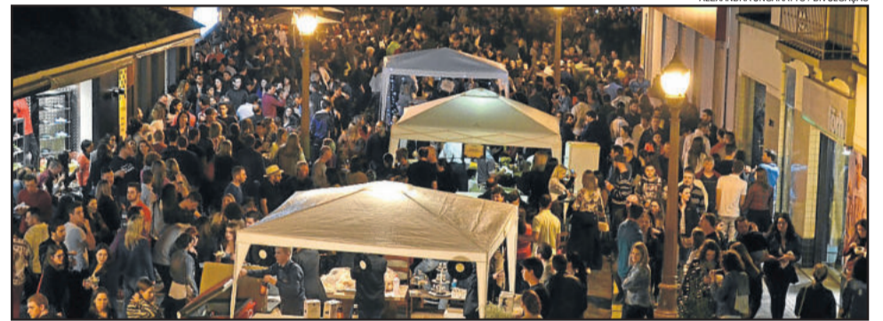
Mais de 15 mil pessoas acompanham o evento

tura de Garibaldi, por meio da Secretaria de Turismo e Cultura. O evento conta com o apoio das secretarias de Obras, de Segurança e Mobilidade Urbana, de Agricultura e Pecuária, de Meio Ambiente, do Sindicato de Hotéis, Restaurantes, Bares e Similares (SHRBS) de Garibaldi e da Brigada Militar. A realização do Encontro de Carros Antigos do Vintage é promovida pelo AntiGar - Carros Antigos de Garibaldi e o Veteran Car Club dos Vinhedos.