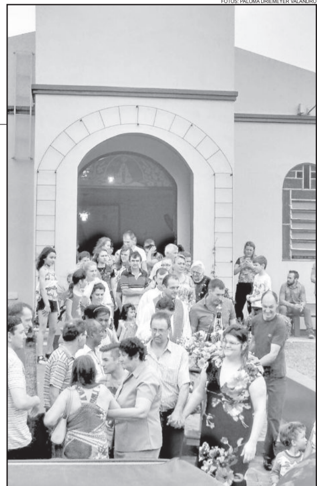
Nossa Senhora Aparecida foi conduzida, em cortejo, da igreja até o salão

A diretoria da Comunidade Católica Nossa Senhora Aparecida estende agradecimentos à comunidade local e regional, que fez do evento um sucesso em mais uma edição. Também agradece aos apoiadores, que tornaram possível mais esta festa anual.