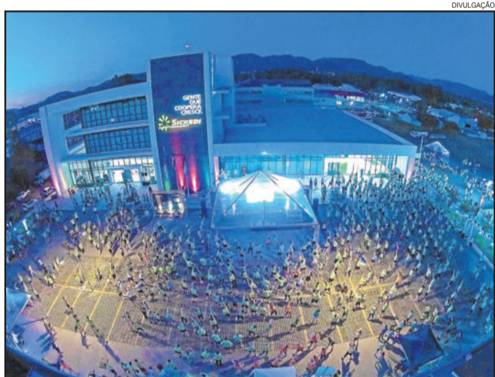
Inscrição é de 1Kg de alimento não perecível

No dia 05 de novembro acontece a segunda edição da Sicredi Touch Night Run, corrida e caminhada noturna com largada junto a Sede Administrativa da Sicredi Ouro Branco RS, em Teutônia. Esta é a última semana para se inscrever. As inscrições vão até o dia 26 de outubro e podem ser feitas no site www.tichetagora.com.br/sicredi ou em uma Unidade de Atendimento da Sicredi Ouro Branco RS.