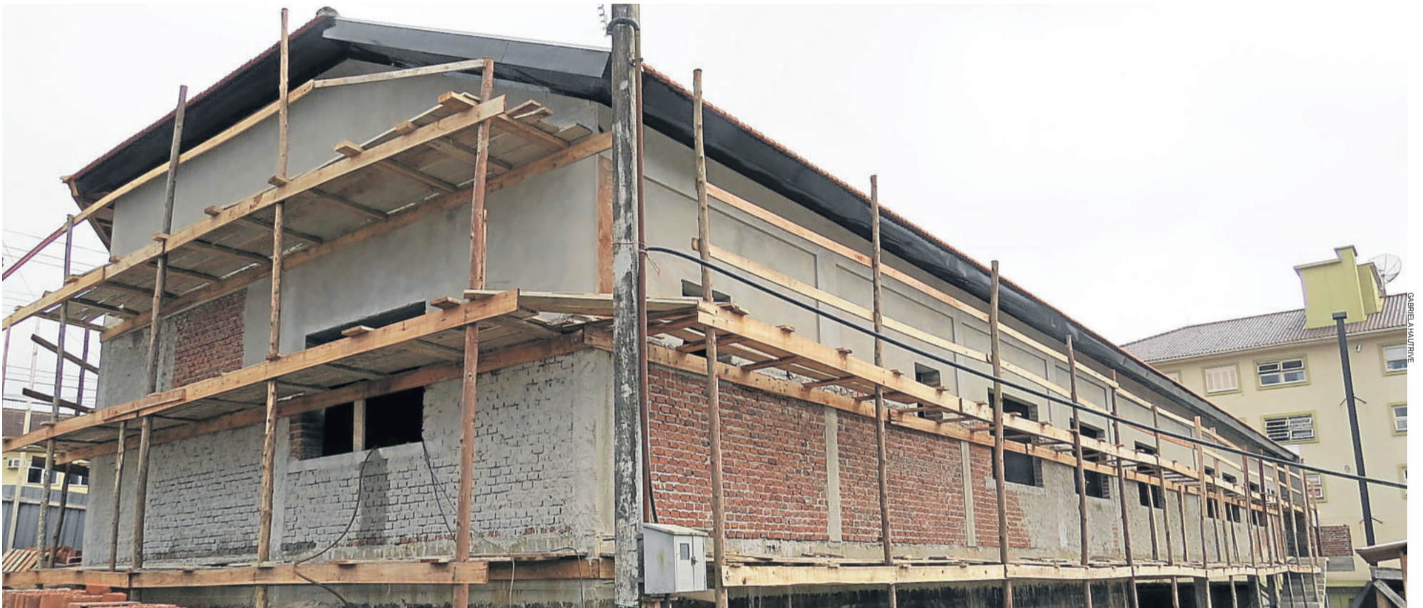
Primeira parte do novo prédio da BM deve ser inaugurada ainda neste ano. Na foto, os fundos das novas instalações. TEUTÔNIA > 4