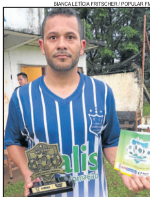
Riopardinho, do União Campestre, craque nos Titulares