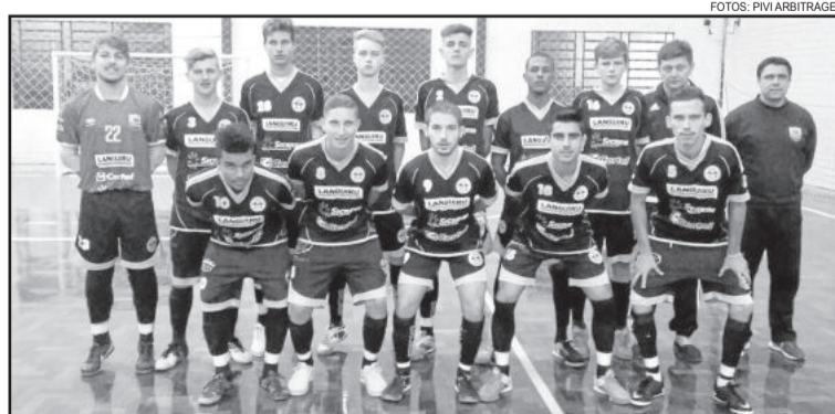
Teutônia Futsal, Sub-20 no Abertão de Futsal do Gaúcho