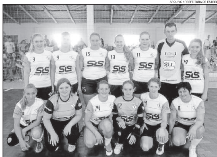
Linha Geraldo Alta vai marcar presença mais uma vez com muitas atletas

O início dos Intercomunitários está agendado para o dia 8 de maio, com a canastra, e o fim para outubro, na Glória, com a realização da Festa dos Campeões e entrega da premiação. Mais informações pelo telefone 3981-1045 e e-mail smel.esporte@estrela.rs.gov.br.