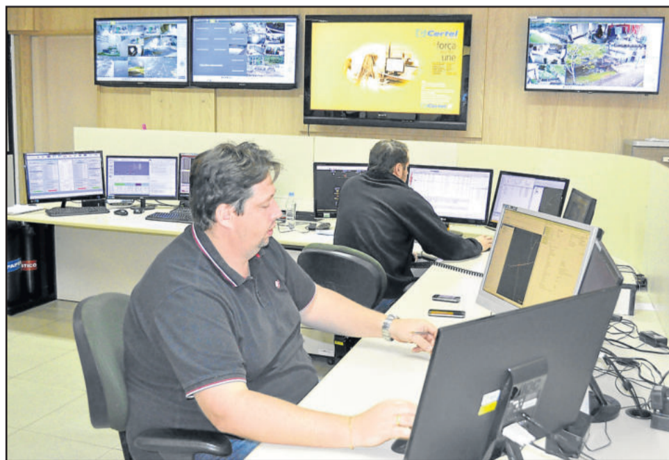
Visando a agilidade nos atendimentos, a Certel conta com o monitoramento das redes

A Certel conta a tecnologia a seu favor, em que é possível visualizar todo o sistema elétrico da cooperativa através de sistemas de georreferenciamento. Assim, é possível monitorar toda a rede elétrica com mais facilidade, permitindo uma série de vantagens, desde a melhor localização de um transformador até