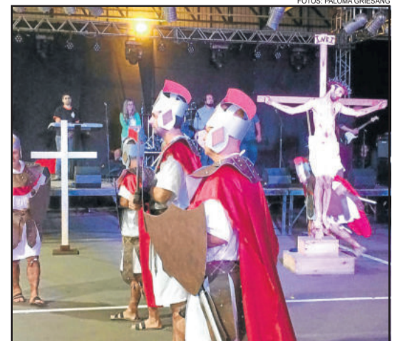
Grupo teatral da IEQ Sede encenou a Via Sacra