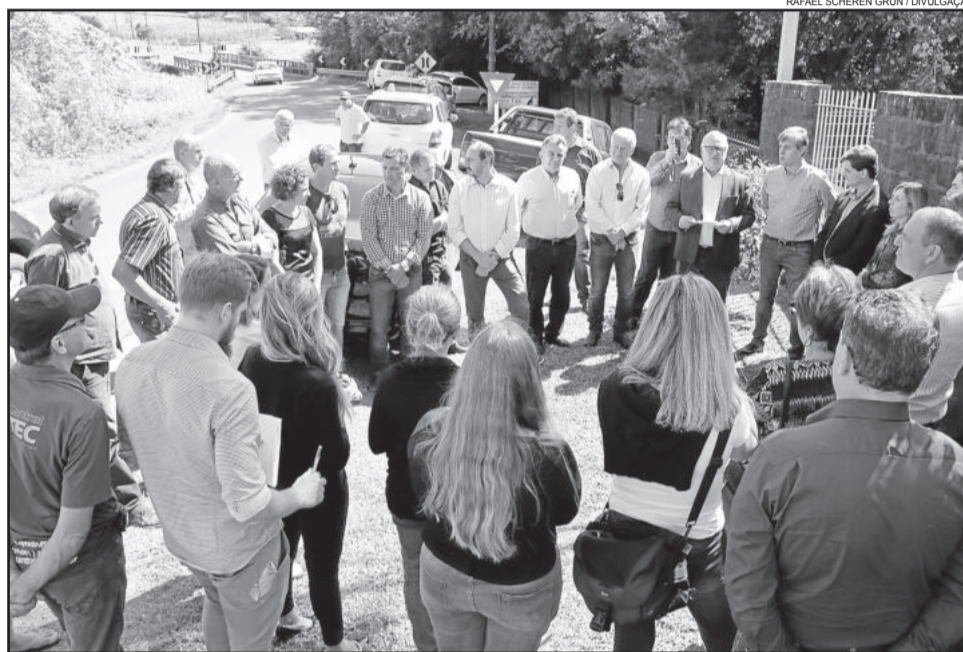
Autoridades no ato que marcou a ordem de início da construção da nova ponte da ERS 413

A nova estrutura será erguida a um custo de R$ 870 mil. A contrapartida do município será o aterramento das cabeceiras da ponte. Hoje, a estrutura permite a passagem de um único veículo por vez, o que provoca filas em ambos os lados. Com a construção da nova ponte, que ficará à esquerda da atual (no sentido Lajeado-