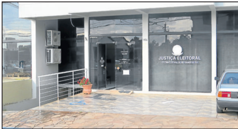
Cartório Eleitoral fica localizado na Avenida 1 Leste, em frente à Câmara de Vereadores

O Cartório Eleitoral está localizado na Avenida 1 Leste, em frente à Câmara de Vereadores, e funciona de segunda-feira a sexta-feira das 10h às 17h, sem fechar ao meio-dia.