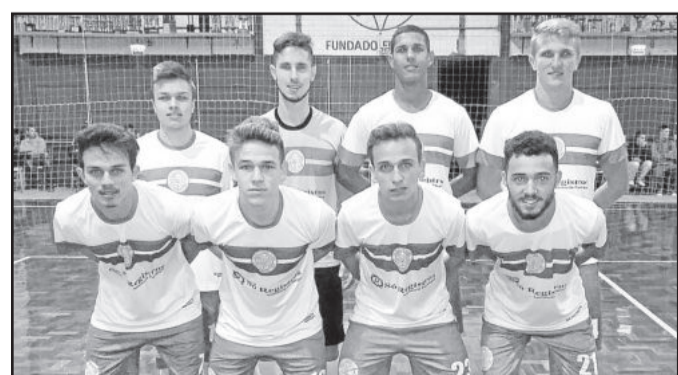
Celtic Park Pub, Sub-20 no Abertão de Futsal do Gaúcho

Nesta quarta-feira, dia 19, o Abertão de Futsal do Gaúcho volta a ter jogos, válidos pela 4ª rodada. Serão três jogos de Força Livre e uma partida do Veterano. Após esta rodada, o campeonato dá uma parada e só volta a ter jogos dia 28 de abril.