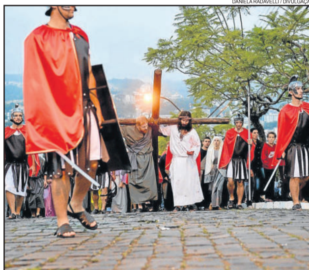
O ponto alto, com maior participação, foi a Celebração da Paixão e Morte de Cristo

Informações sobre cada uma das Celebrações, bem como galeria de fotos, podem ser encontradas no site www.paroquiasaopedrogaribaldi.com.br e Fan Page da Paróquia São Pedro. Mais informações sobre o Movimento de Emaús podem ser acessadas na Fan Page Emaús Garibaldi.