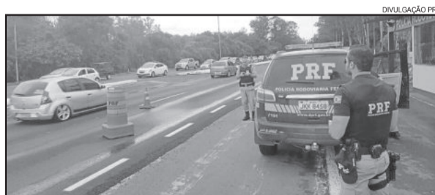
Equipe da PRF atuou durante todo o feriado no Vale do Taquari

Uma mulher e sua filha de cinco anos morreram após sair de pista e colidir com uma árvore. Ambas estavam sem cinto.