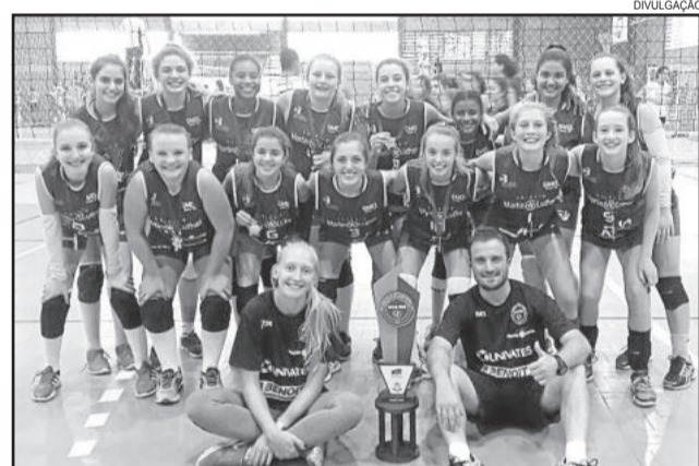
Equipe mirim estreou com título em 2017