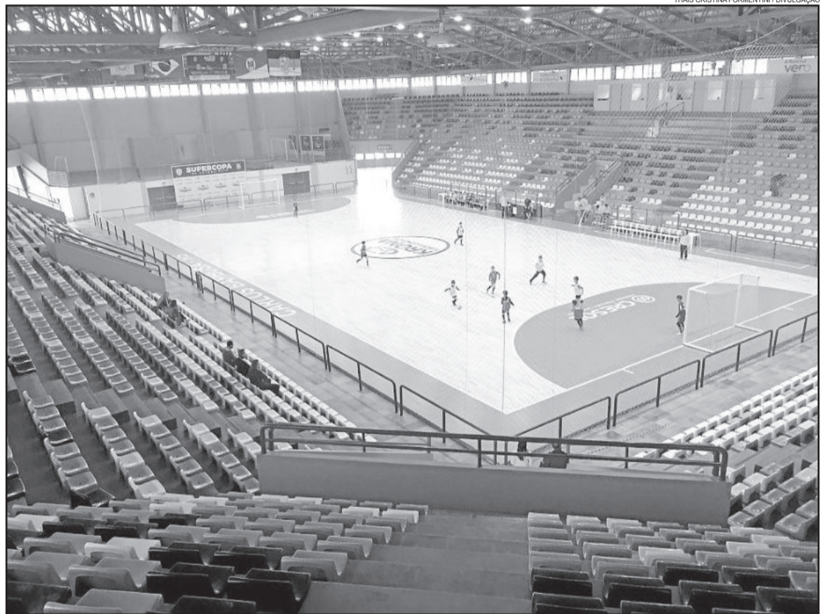
4 mil cadeiras foram instaladas no Centro de Eventos de Carlos Barbosa