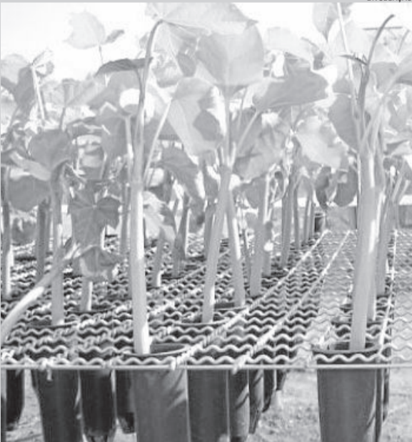
São disponibilizadas cerca de 100 espécies de mudas