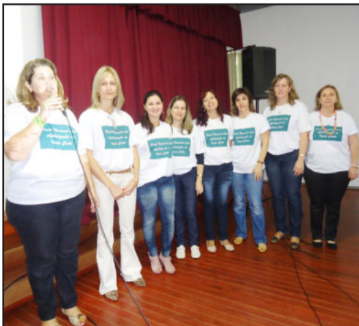
Orientadoras de estudo ligadas à 3ª CRE