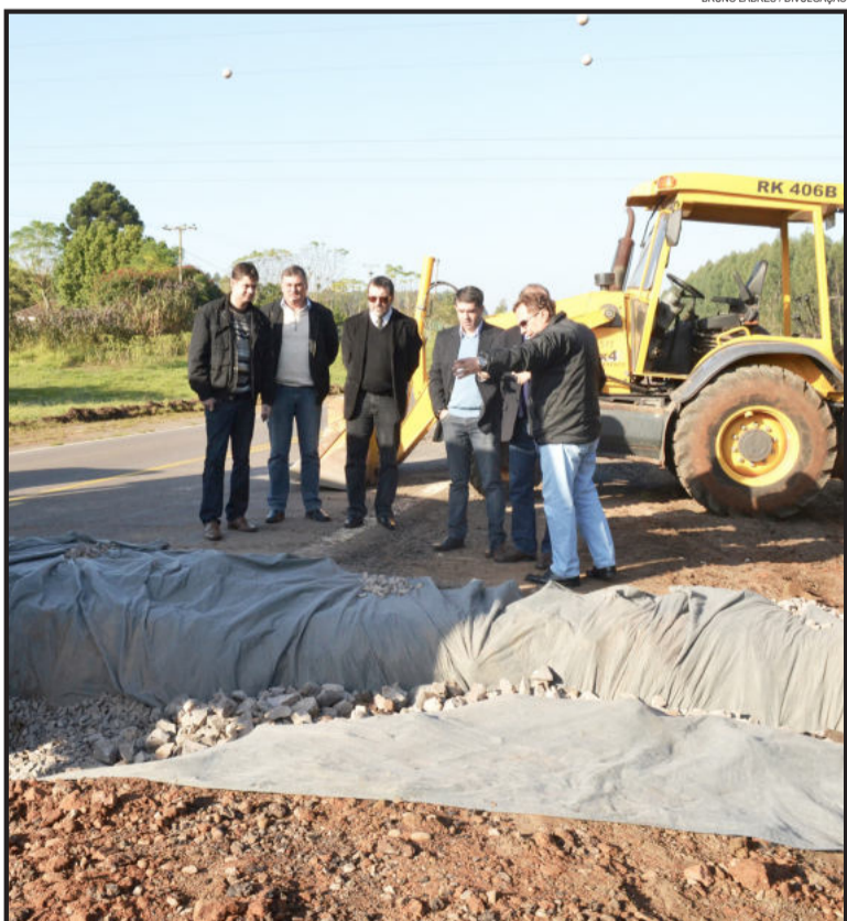
Obras estão em andamento na rodovia de acesso a Taquari