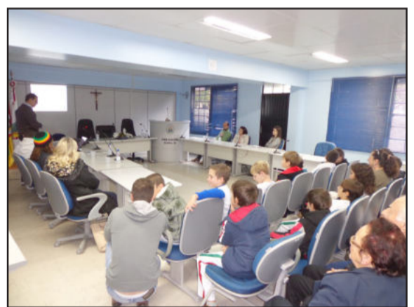
Evento foi realizado no plenário da Câmara de Vereadores