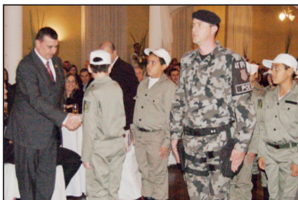
Brigada Mirim se apresentou ao comandante geral da BM