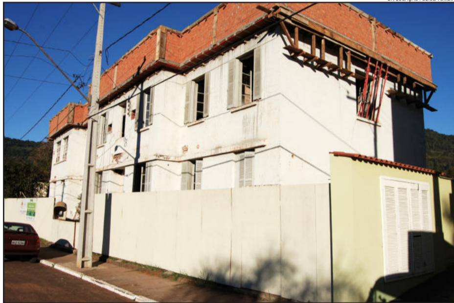
Centro de saúde