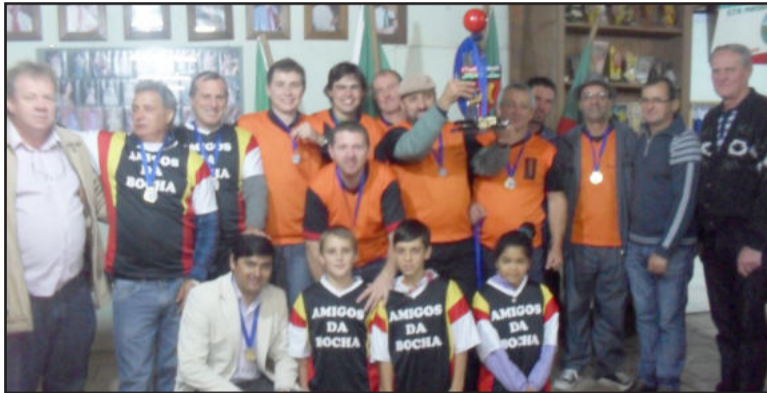
1º lugar no Municipal de Bocha, Amigos da Bocha