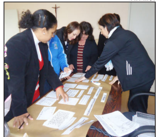
Orientadoras reunidas na CRE