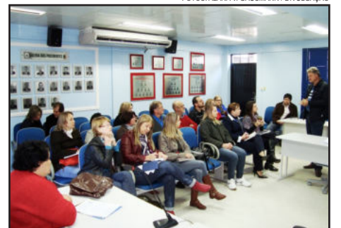
Teutônia projeta ações para o projeto Natal, Tempo que Encanta