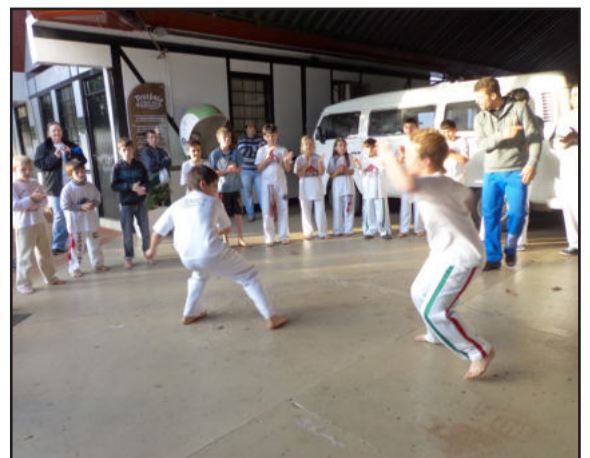
Evento finalizou com roda de capoeira no Centro Administrativo