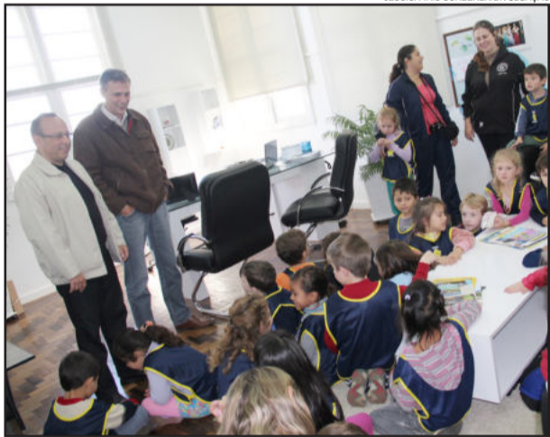
Alunos estiveram no gabinete do prefeito