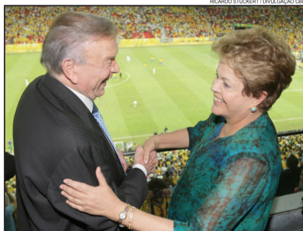
Dilma assistiu ao jogo ao lado do presidente da CBF, José Marin, com quem não gosta de aparecer muito

A Copa das Confederações está sendo um teste para a realização da Copa do Mundo de 2014, também no Brasil. Diversos problemas atormentaram os torcedores: cadeiras inexistentes, longas filas nos bares, falta de alimentos, banheiros fechados, falhas no transporte público e dificuldades com internet móvel. As falhas na organização terão um ano para serem corrigidas. Porém, alguns pontos são elogiados, como, por exemplo, a entrada rápida nos estádios e acessibilidade para cadeirantes.