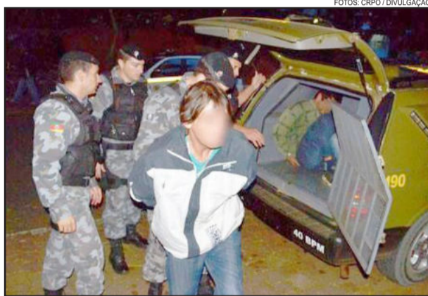
Mobilização dos policiais do 40º BPM prendeu os quatro assaltantes de Bom Retiro