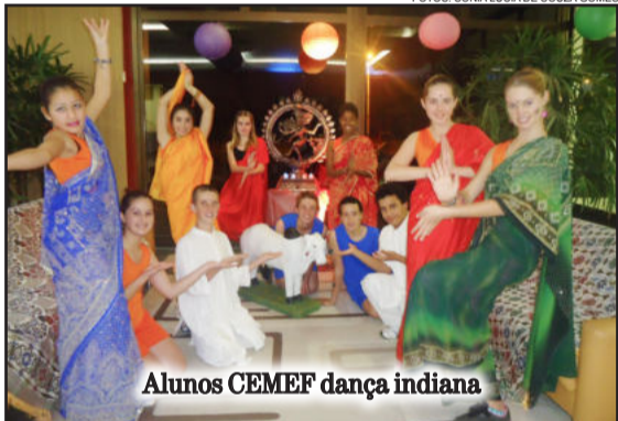
Alunos CEMEF dança indiana