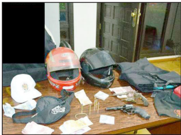
Materiais e dinheiro apreendidos após prisão de assaltantes da Agência dos Correios de Bom Retiro do Sul

Foi efetuado o cerco por guarnições de Teutônia, Estrela e Bom Retiro do Sul. Eles foram localizados, abordados e identificados: um homem de 51 anos e outro de 30 anos, ambos foragidos do regime semi aberto do Presídio Estadual de Lajeado. Também foram presos um homem, de 42 anos e outro de 28 anos. De posse da quadrilha foi encontrado um revólver calibre 38, um revólver calibre 32, várias munições, um colete balístico e o dinheiro roubado. Foram presos e encaminhados a DPPA onde foi lavado flagrante.