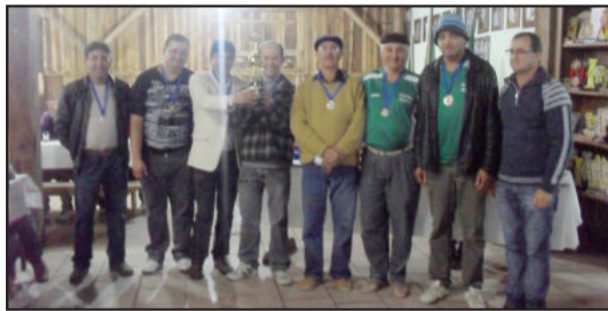
3º lugar no Municipal de Bocha, CTG Porteira dos Pampas