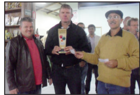
4º lugar no Municipal de Bocha, Área Verde