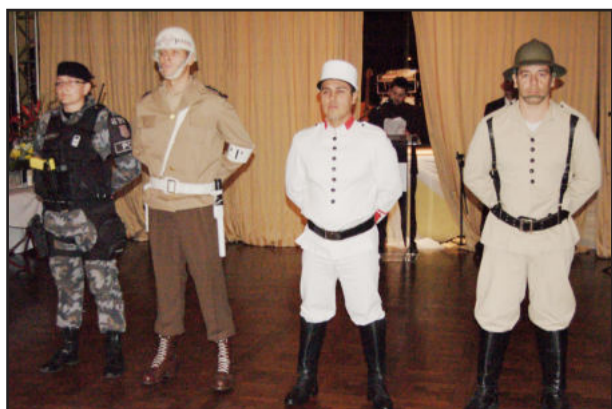
Foram apresentadas fardas históricas