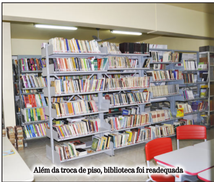
Além da troca de piso, biblioteca foi readequada