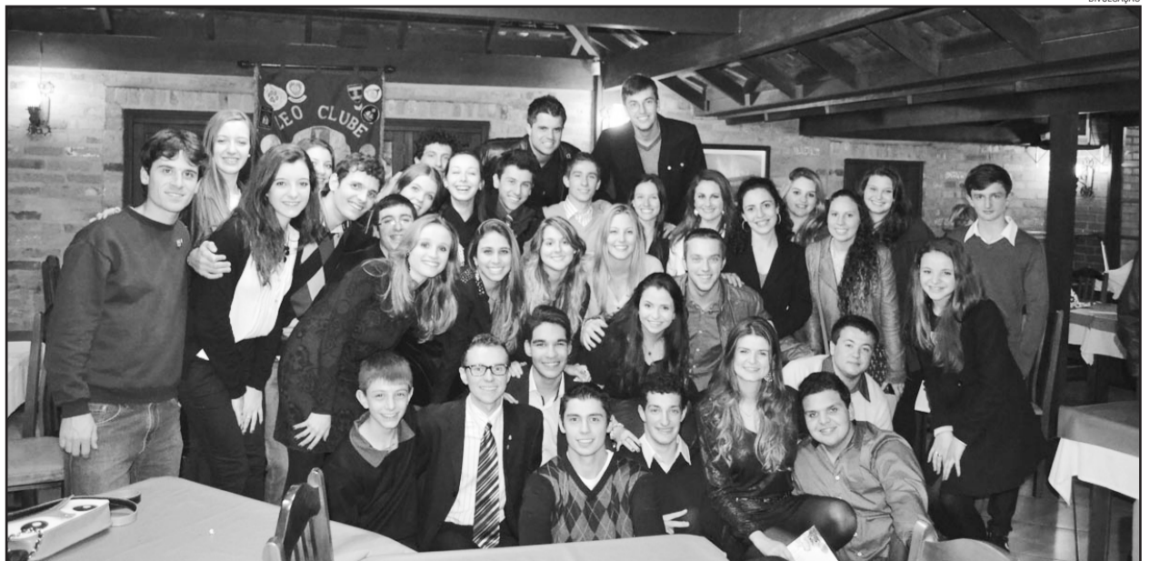
Nova diretoria foi empossada na noite de sábado