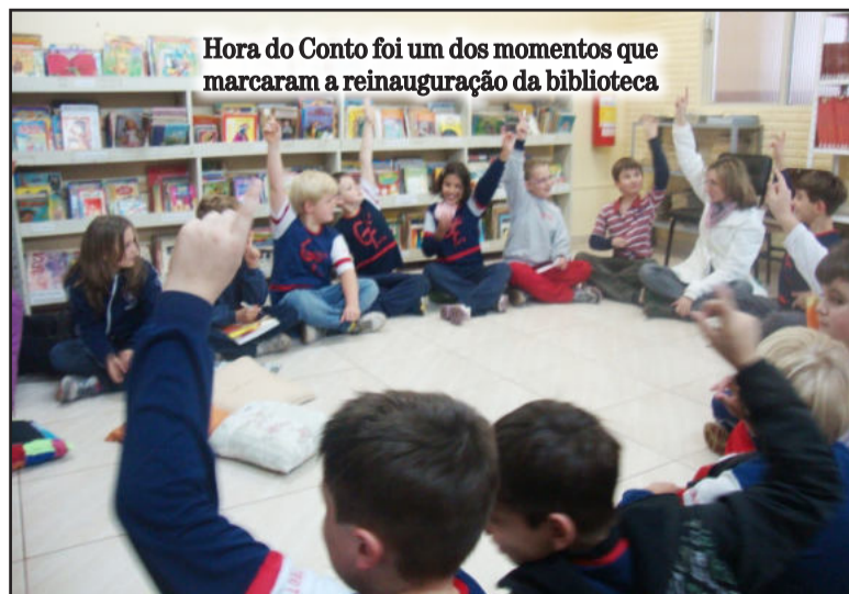
Hora do Conto foi um dos momentos que marcaram a reinauguração da biblioteca