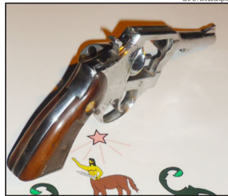
Arma foi apreendida pelos policiais militares

Os policiais receberam as características de um indivíduo que tripulava uma moto Honda/Broz, vermelha. Armado, ele teria ameaçado algumas pessoas no Bairro Centenário. Os policiais abordaram o condutor da moto e localizaram um revólver marca Taurus, calibre .38, numeração raspada e municiado com cinco cartuchos intactos. Diante dos fatos, ele foi encaminhado à Delegacia de Polícia de Lajeado para lavar o flagrante.