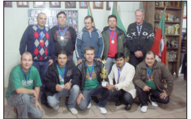
2º lugar no Municipal de Bocha, Amigos do Zequinha