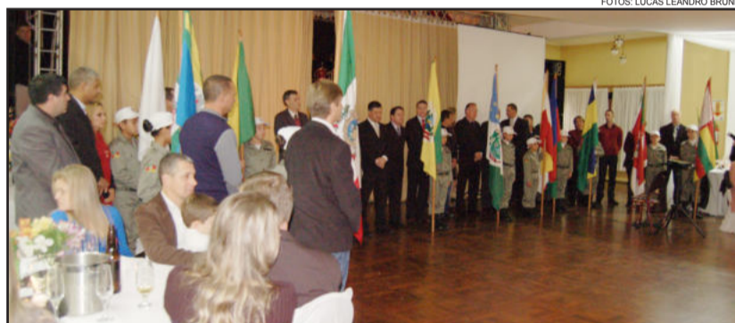
Líderes municipais e policiais militares conduziram bandeiras dos municípios

Ainda aconteceu a entrada das bandeiras dos municípios atendidos pelo 40º BPM, com sede em Estrela, acompanha-