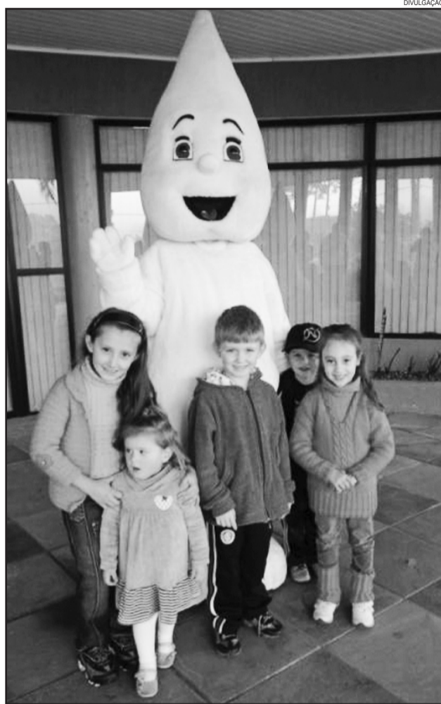
Campanha de Vacinação contra a Paralisia Infantil

A Campanha contra a Poliomielite se estende até o dia 21 de junho, próxima sexta-feira, e a dose da vacina é aplicada na sala de vacinas do Centro Municipal de Saúde, das 8h às 12h e das 13h30min às 17h30min. Os responsáveis deverão trazer a Carteira de Vacinação das crianças.