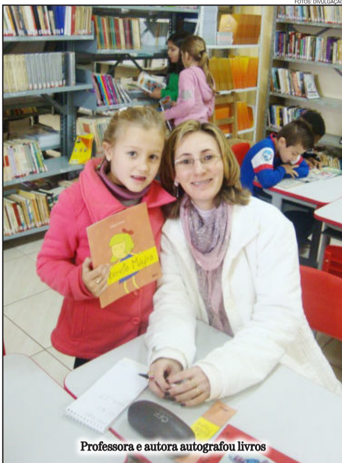
Professora e autora autografou livros

Os livros podem adquiridos com a autora e em livrarias locais.