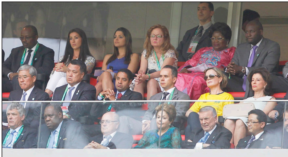
Presidente Dilma ficou constrangida após vaias na abertura da Copa das Confederações, apesar do pedido de respeito de Joseph Blatter

A Copa das Confederações, realizada neste ano no Brasil, teve início no sábado, dia 15, e já está 'dando o que falar'. Logo no primeiro dia, momentos antes do jogo de abertura entre Brasil e Japão, realizado no Estádio Nacional Mané Garrincha, em Brasília, a competição foi marcada pela mobilização de brasileiros que são contra os gastos com a competição.