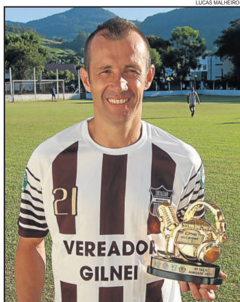
PC, do ECAS, foi o craque dos Titulares