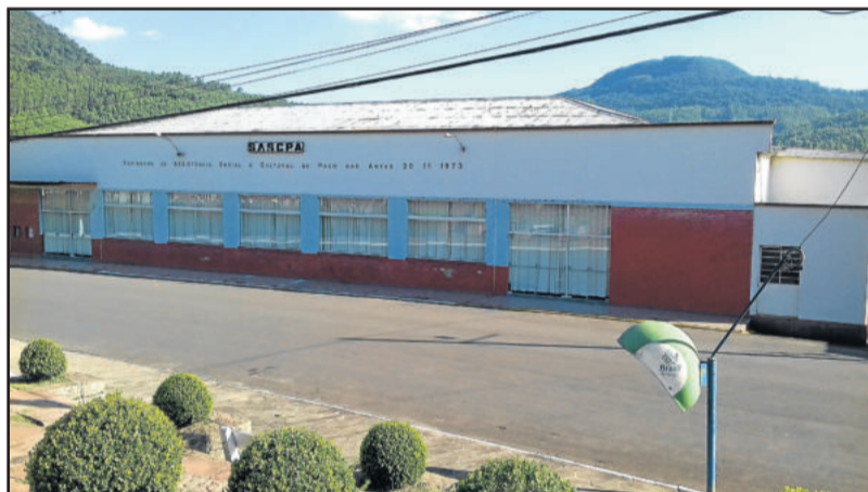
Nas noites de Kerb, haverá praça de alimentação em frente à SASCPA

A SASCPA e a Flach Eventos já tem agendado para o dia 27 de fevereiro deste ano o 16º Festival do Choppe. Entre as atrações já confirmadas estão a Orquestra La Montanara e Rogério Magrão e Banda.