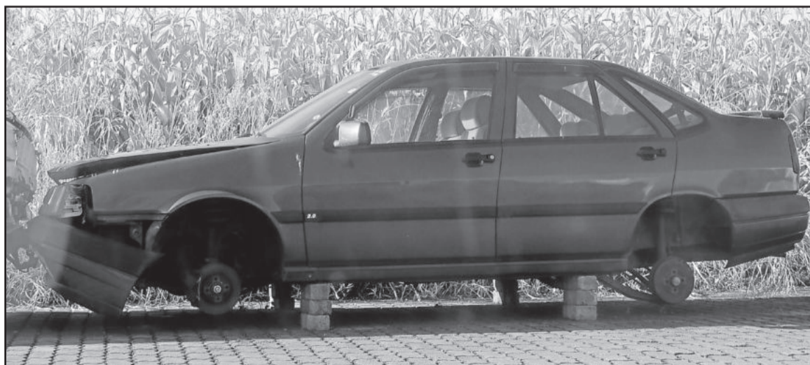
O veículo Tempra está sem as rodas e pneus

ECONOMIA NO TRANSPORTE DE ENCOMENDA? REDE ENCOMENDAS Facilitando a sua vida. Sta. Cruz do Sul - Venâncio Aires Vale do Taquari Caxias do Sul - Porto Alegre 3720-3157