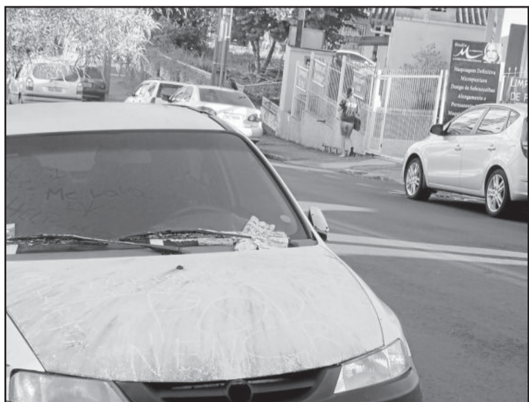
O carro GM Celta está na Rua 3 de Outubro, Bairro Languiru

ção quando o carro está em via pública”, explica. Na capital, o condutor é avisado que seu veículo corre risco de ser guinchado por estar em determinado local e após um prazo de 30 dias ele é removido e encaminhado a um depósito.