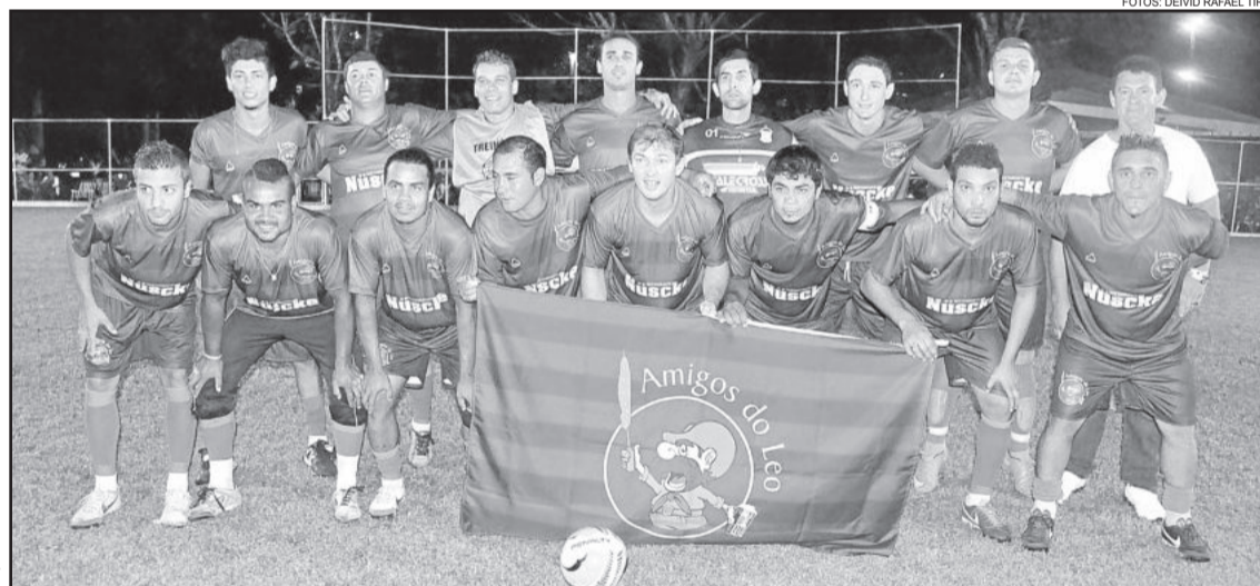
Amigos do Leo/Amaral DPVAT