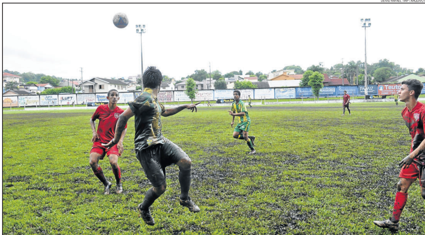
Abertura da competição ocorre a partir do dia 22 e terá mais de 100 equipes em 6 categorias

Completando a abertura, na noite do dia 22, ocorre a cerimônia no campo do Gaúcho, no Bairro Teutônia, e o primeiro jogo da competição que será do time da casa, a Juventus. Ocorre ainda uma competição entre Amigos da Eurovale e Amigos de Teutônia. A equipe da Eurovale deve ser formada por ex-atletas profissionais e a de Teutônia pelos servidores do município. “Estamos tentando montar uma equipe da Prefeitura para competir e não fazer muito feio. Vamos fazer algo diferente, fazer uma integração, várias pessoas de outros setores participarão”, conta. Ter a presença de ex-jogadores tem como objetivo também incentivar os novos atletas. “O pessoal da Eurovale está tentando trazer ex-jogadores profissionais para estarem na abertura e terem um contato mais próximo com essas crianças que estão ali e sonham em um dia ser um Neymar, um Ronaldinho Gaúcho e tem essa oportunidade”, comenta. A secretária destaca ainda a presença de olheiros de times durante a competição.