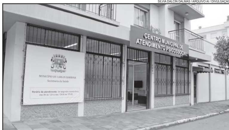
Até janeiro, atendimentos no Cemaps passaram de 1.600

O Centro Municipal de Atendimento Psicossocial de Carlos Barbosa (Cemaps) completa, no dia 20 de janeiro, seis meses de atividades. Desde a entrega da estrutura à comunidade, foram realizadas 1.663 consultas, sendo 241 na área do Serviço Social, 656 em Psicologia, 727 em Psiquiatria e 39 em Clínico Geral. Atualmente, estão cadastrados 2.426 pacientes, sendo que 1.255 estão ativos, ou seja, recebendo atendimento.