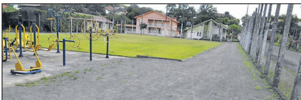
Área de lazer na Rua Maurício Cardoso, no Bairro Teutônia, também está em boas condições