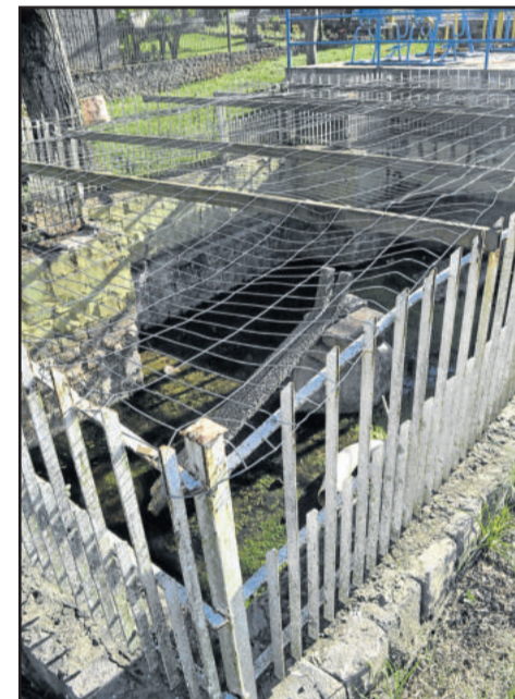
Fosso na área de lazer da Rua Edvino Schaeffer tem água acumulada