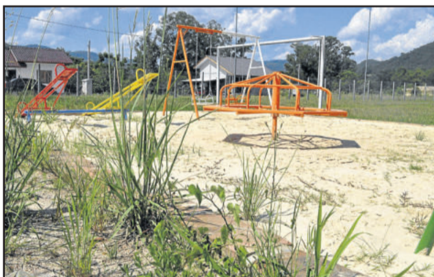
Na Cuba, vegetação está tomando conta da área de lazer