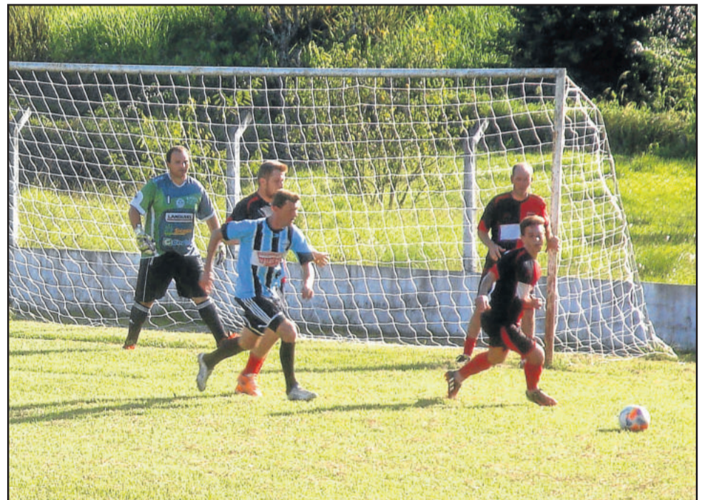
Flamengo, com a bola, pretende melhorar o entrosamento a partir da próxima rodada