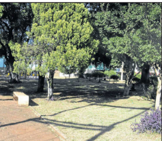
Canabarro está em boas condições de uso

As praças e áreas de lazer são de uso público. Por isso, cabe a cada um fazer a sua parte, a dar destinação correta ao lixo, ajudar a manter equipamentos, bem como denunciar atos de vandalismo.