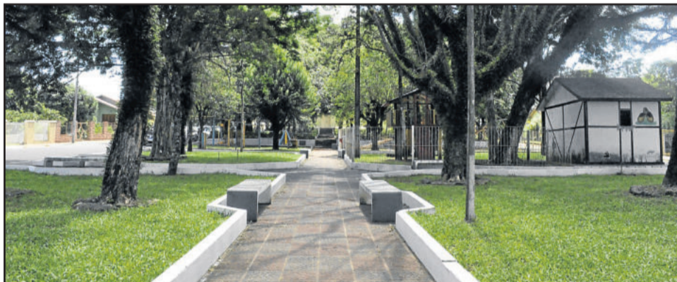
Praça no Bairro Teutônia está em boas condições de uso