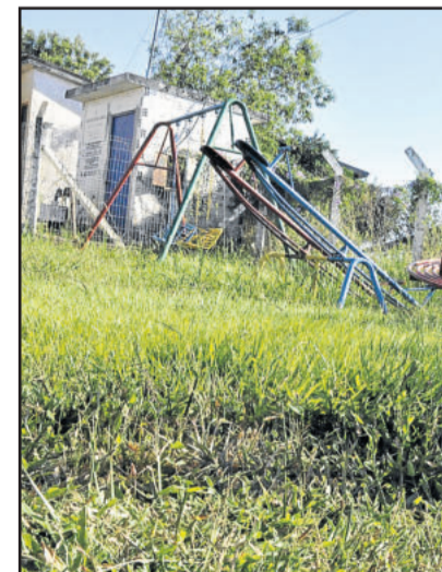
Na Rua Ernani Júlio Sippel, área de lazer