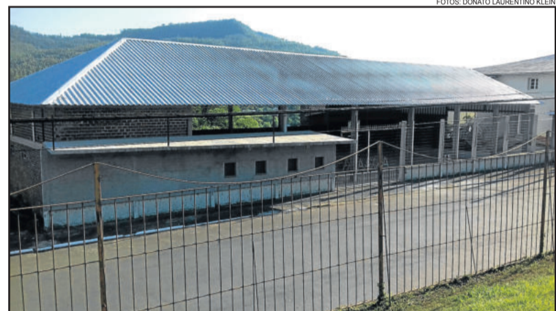
Pavilhão da segunda pista foi reformado para bem acomodar a todos