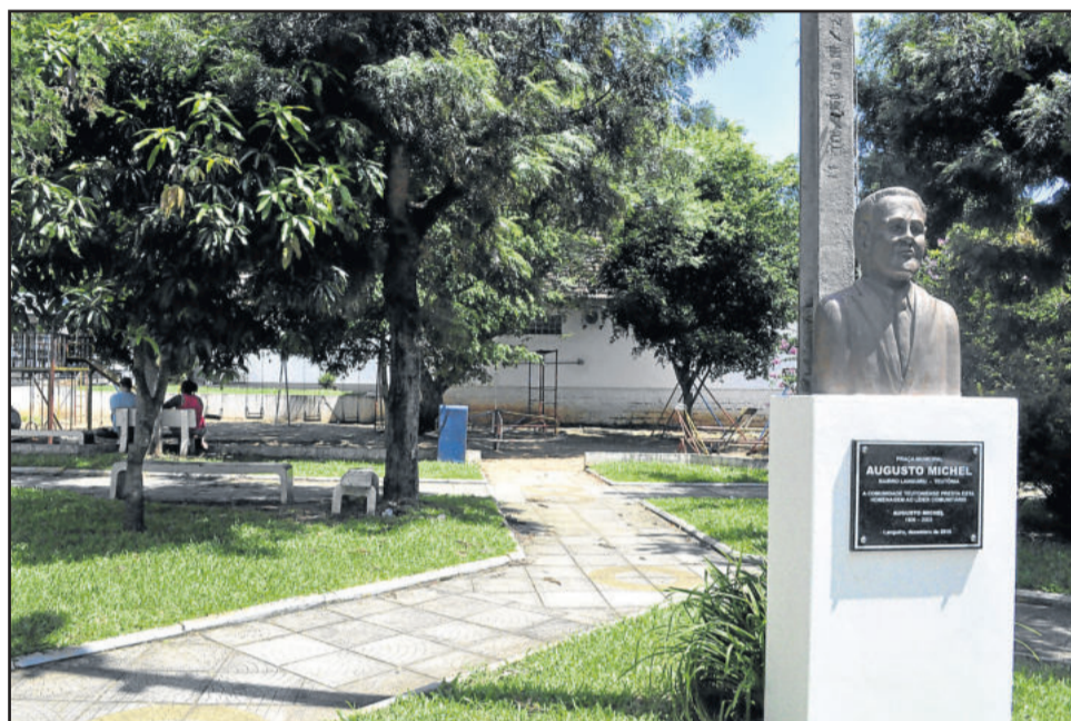
Praça Augusto Michel, no Bairro Languiru, está em boas condições