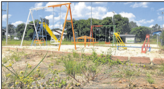
Vegetação começa a tomar conta da área de lazer na Rua Gustavo Luersen, no Bairro Teutônia

Na implantação de uma área verde, a Prefeitura espera uma contrapartida por parte da comunidade beneficiada. "A Prefeitura não segue manter todas as praças sozinha. É preciso que a comunidade, as associações de mor