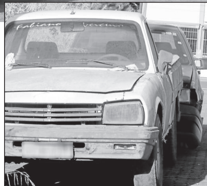
A caminhonete em estado precário está com bastante poeira ferrugem e com a lataria danificada

Os outros dois carros que encontramos estão localizados na Rua 8 Norte, no Bairro Centro Administrativo. Estão estacionados um atrás do outro. Um Fiat Tempra, ano 1992, cor azul, placa de Teutônia e uma caminhonete Peugeot, modelo 504 D, cor branca, placa de Estrela. O Tempra encontra-se sem pneus e rodas, a tinta descascando por conta das condições climáticas. A caminhonete está em estado precário, com bastante poeira, ferrugem e com a lataria danificada. Os veículos estão em uma rua de pouco movimento, mas que fica próxima da Prefeitura Municipal, local em que será a Festa de Maio e deve tirar vagas de estacionamento dos visitantes.