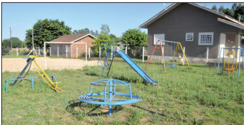
Área de Lazer na Rua Evaldo Schaeffer, no Bairro Canabarro, também está sendo tomada pela vegetação