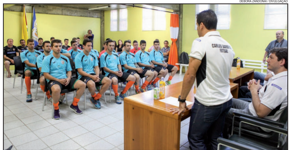
Atletas se reapresentaram na manhã desta segunda-feira