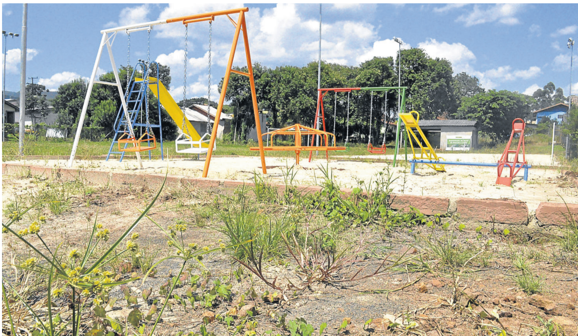
Limpeza desses espaços esbarra em poucos servidores para efetuar o serviço. Em algumas áreas, situação das praças é reflexo do descaso de alguns usuários. Em outras, a conservação está boa. TEUTÔNIA > 8 E 9