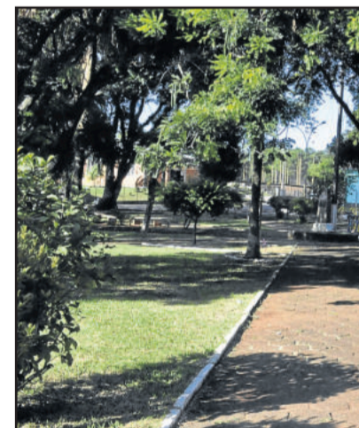
Praça do Bairro Canabarro