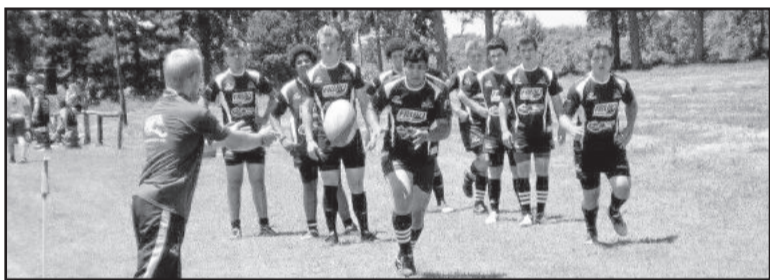
Treino acontecerá no campinho ao lado do Supermercado Languiru

anos. É um trabalho em parceria com a Confederação Brasileira de Rugby (CBRu). O Centauros, juntamente com os demais clubes da primeira divisão, estão em um bom nível", avalia. Recentemente, o clube recebeu um kit de treino da CBRu como premiação por atingir exigências de nível técnico, que visam a qualificação e a profissionalização do rugby brasileiro. Em 2016, a marca do crescimento do rugby é o retorno do esporte aos jogos olímpicos, que acontecerão no Rio de Janeiro e terão a participação das seleções brasileiras. "Como um todo isso vem se desenvolvendo, estamos em um constante crescimento", conclui.