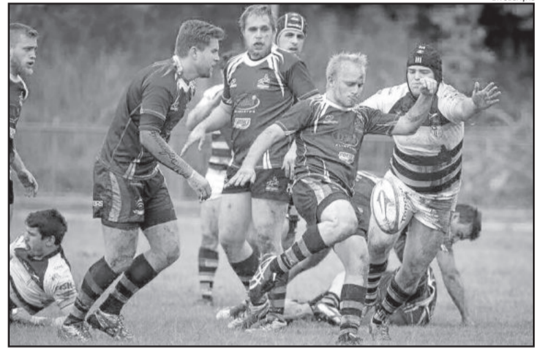
Clube busca aumentar quadro de atletas para competições estaduais e nacionais em 2016

O rugby atualmente é um dos esportes que mais cresce no Brasil. De acordo com dados da Confederação Brasileira de Rugby (CBRu), hoje o país conta com seis federações (SP, RJ, MG, PR, SC e RS), que reúnem 7 mil atletas federados e mais de 60 mil praticantes. São cerca de 300 agremiações do esporte. O Centauros Rugby Clube de Estrela representa a região na primeira divisão do Campeonato Gaúcho, além de participar de competições em nível nacional, tanto na categoria masculina quanto na feminina.