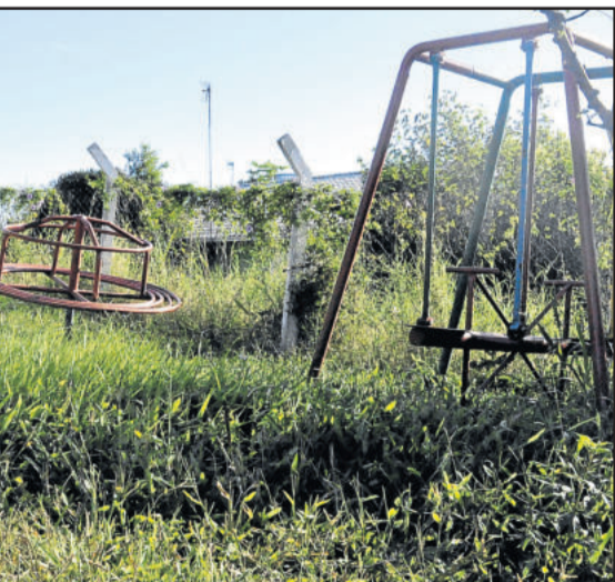
Área de lazer do Loteamento Sippel, no Bairro Canabarro, precisa de manutenção