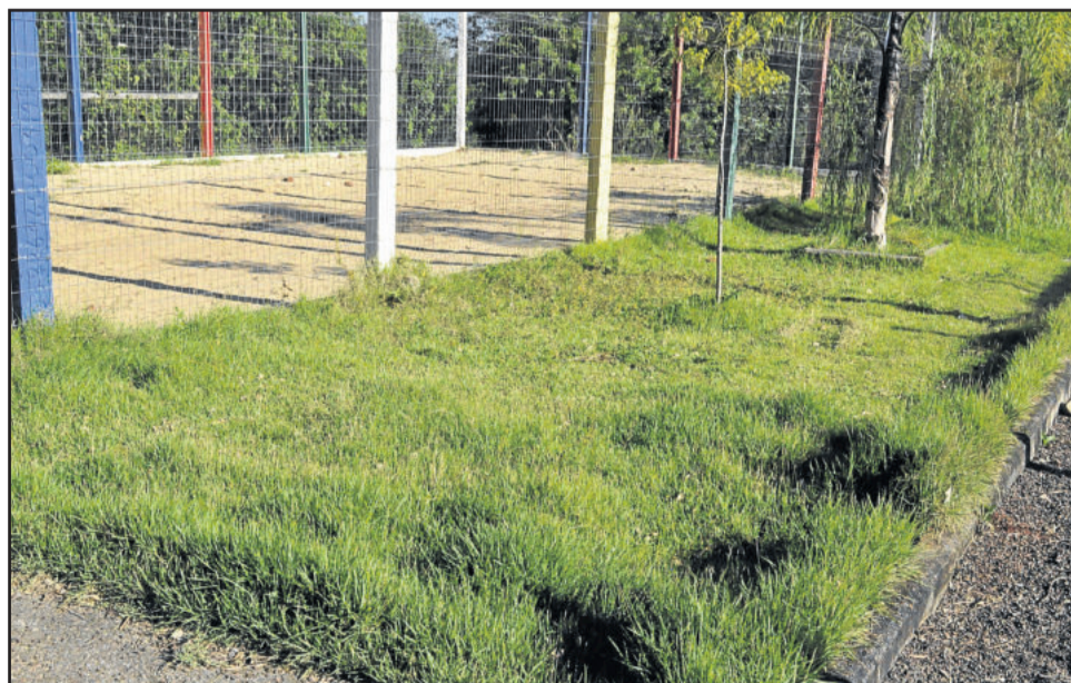
Área de lazer do Loteamento Arco Íris carece de roçadas, mas é um dos locais em que os moradores mais se esforçam para contribuir na manutenção