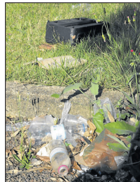
Lixo foi encontrado na área de lazer do Loteamento Arco Íris