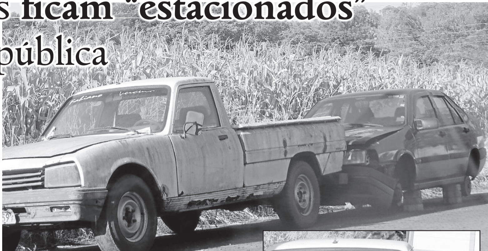
Um Fiat Tempra e uma caminhonete Peugeot estão parados na Rua 8 Norte, Bairro Centro Administrativo

Entretanto, conforme o capitão, em caso de contaminação na natureza ou risco de saúde de uma pessoa,