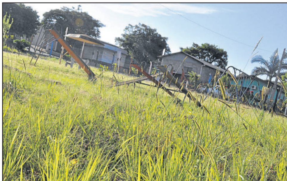
Na Rua Edvino Schaeffer, no Bairro Canabarro, área de lazer começa a ser tomada pela vegetação