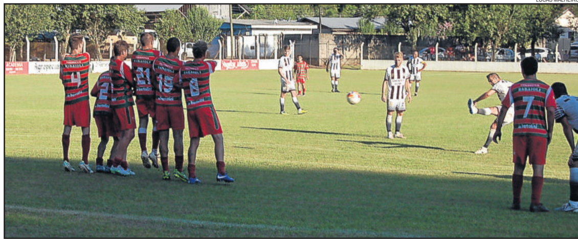
PC cobra a falta que resultou no segundo gol do ECAS