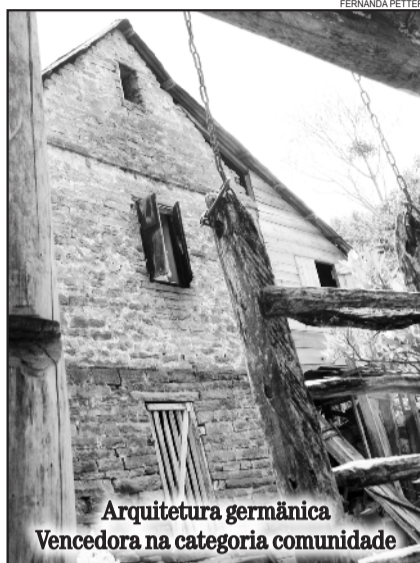
Arquitetura germânica Vencedora na categoria comunidade