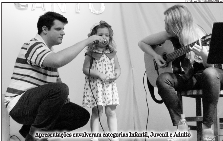
Apresentações envolveram categorias Infantil, Juvenil e Adulto