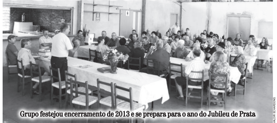
Grupo festejou encerramento de 2013 e se prepara para o ano do Jubileu de Prata