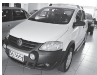
Crossfox 1.6 R$ 30.800