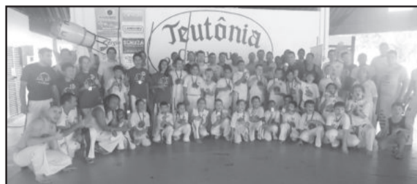
Cemef Grupo Oxósse de Capoeira na Prefeitura