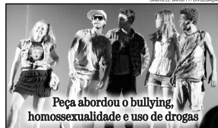
Peça abordou o bullying, homossexualidade e uso de drogas