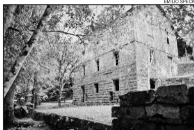
Molino Vecchio Vencedor na categoria profissional