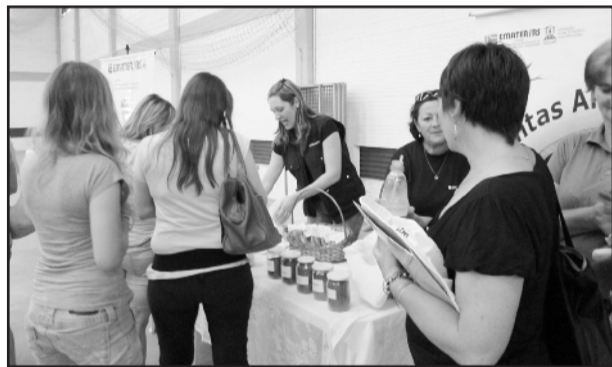
Oficina da Emater

A Polícia Civil da DEAM-Lajeado e da DPR-Lajeado, que idealizou o evento, agradece aos parceiros que acreditaram na proposta de fazer um dia especial para combater a violência contra a mulher por um outro viés: reforçando sua autoestima.