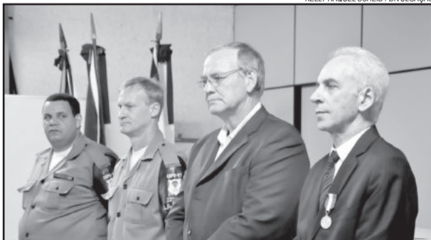
Solenidade homenageia destaques no setor de segurança pública