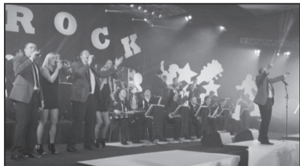
Orquestra de Teutônia