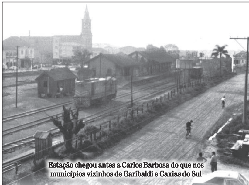
Estação chegou antes a Carlos Barbosa do que nos municípios vizinhos de Garibaldi e Caxias do Sul

Constituindo a identidade do barbosense, o Parque é local de lazer e encontros, onde famílias e amigos reúnem-se aos fins de tarde e final de semana para conversar, tomar chimarrão e descontrair. Também é palco das principais celebrações como a do aniversário do município, do dia do trabalhador, do Natal no Caminho das Estrelas e de comemorações de campeonatos da ACBF. Atualmente, o prédio da Estação abriga a Secretaria da Indústria, Comércio e Turismo, o Cine Ideale e a Casa do Artesão, que em breve, passará por um processo de restauro.