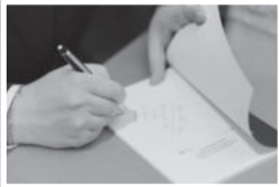
O autor autografou livros para os convidados