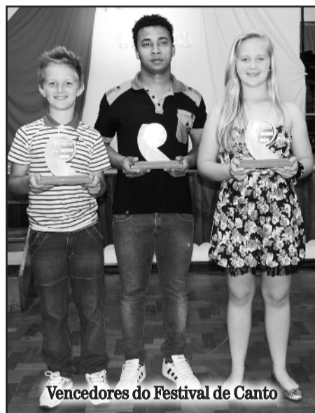
Vencedores do Festival de Canto

O Festival de Canto de Imigrante é uma realização da Secretaria de Educação, Cultura, Desporto e Turismo, em parceria com a Associação Cultural de Imigrante.