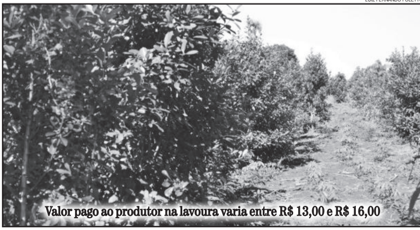
Valor pago ao produtor na lavoura varia entre R$ 13,00 e R$ 16,00