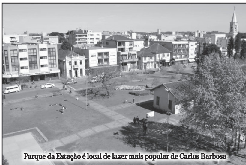
Parque da Estação é local de lazer mais popular de Carlos Barbosa