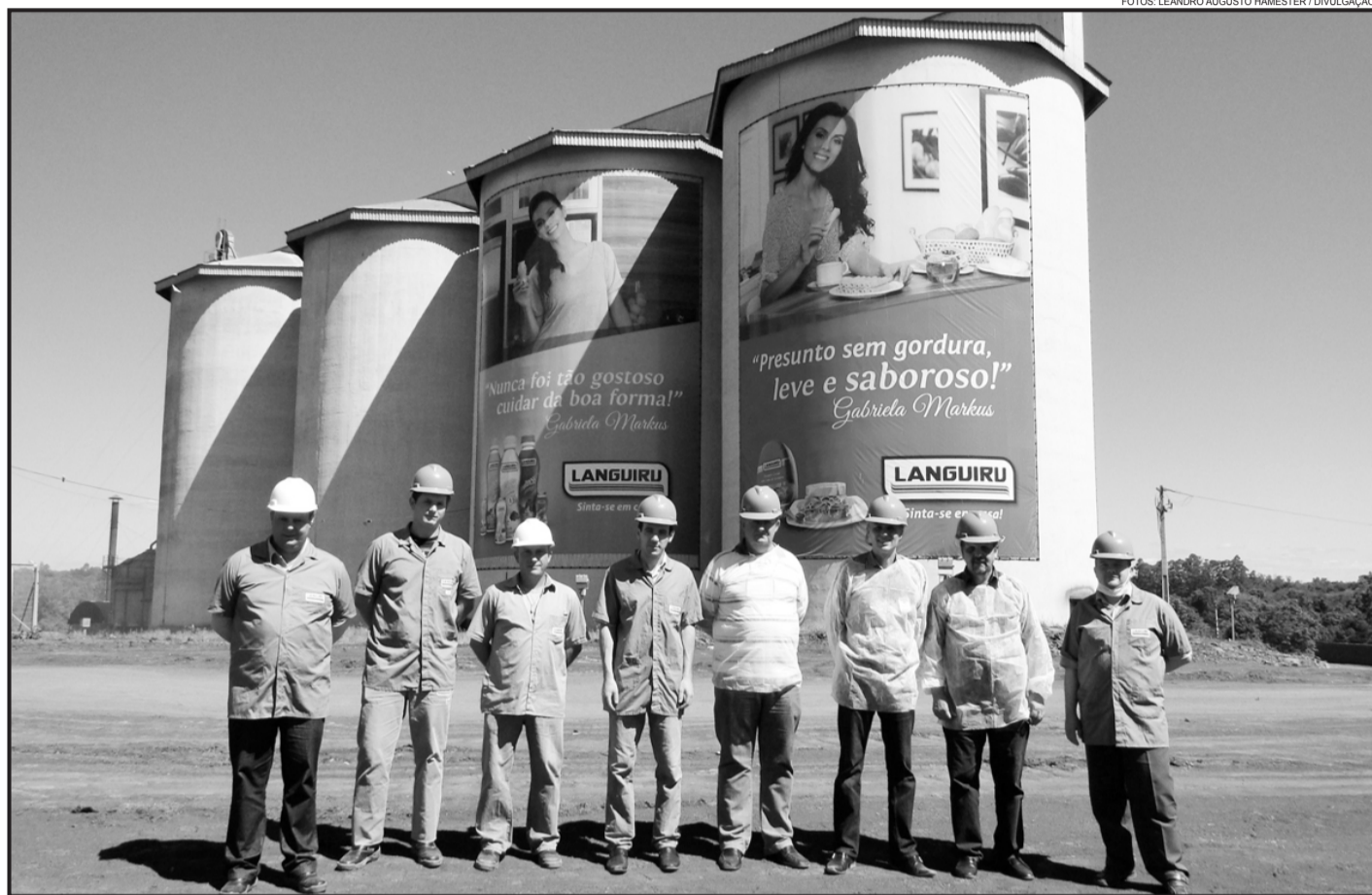
Grupo visitou obras do novo estacionamento da unidade industrial