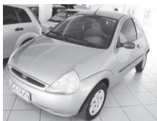
Ka GL 1.0 R$ 10.900

Aberto de segunda a sexta das 8h às 18h30min. Sem fechar ao meio dia e nos sábados das 8h às 16h.