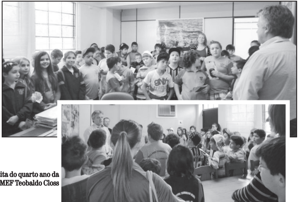
Visita do quarto ano da EMEF Teobaldo Closs

O prefeito Renato Airtom Altmann e o chefe de gabinete Délcio José Barbosa receberam, no início do mês, os alunos do 4º ano do Ensino Fundamental da Escola Municipal Teobaldo Closs, do Bairro Canabarro. Os estudantes seguem estudos de conhecimento dos poderes e aproveitaram para visitar o Executivo, conhecendo um pouco das atividades do prefeito.