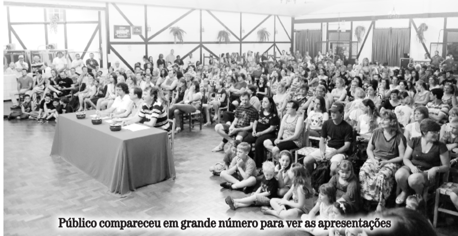
Público compareceu em grande número para ver as apresentações