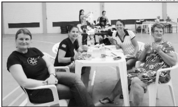
Oficina de Bijuterias