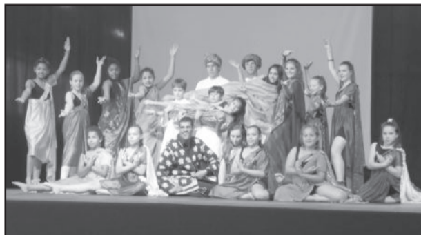
Grupo de Danças do Cemef