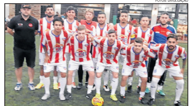
Lesionados de Lajeado passou no Shootout