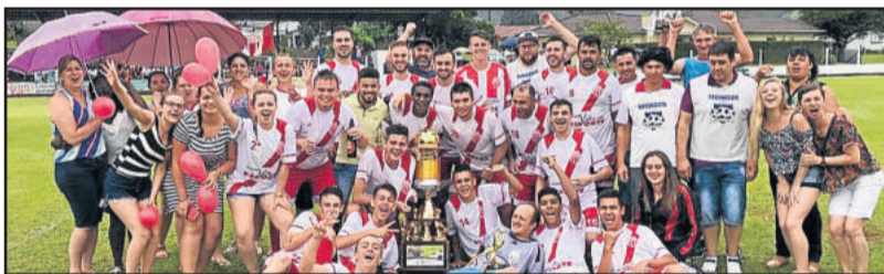
Atlético Gaúcho, campeão dos Aspirantes