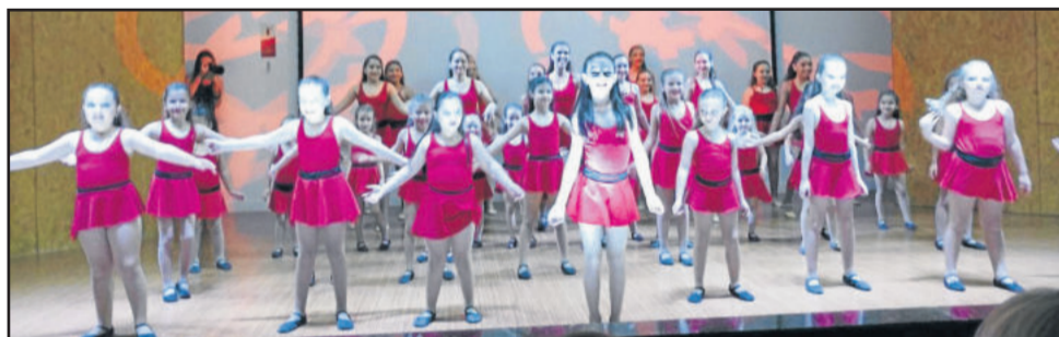
Bailarinas reunidas no início do show

cresça e possa realizar seus sonhos, em especial a todos que contribuíram também com a realização dos dois espetáculos de fim de ano. A professora destaca que foi um ano de um aprendizado sem tamanho, com famílias envolvidas em prol de um único objetivo: levar nossa Arte para a contribuir com um mundo melhor. Assim, a escola também prestou uma homenagem especial às famílias, pais, avós, dindas, todos que não mediram esforços para ser suas artistas brilhando e encantando o público. Nas duas noites, foi apresentado um videoclipe especialmente produzido para marcar a participação destas pessoas importantes na vida das bailarinas. O vídeo pode ser conferido na página da VF Produtora, que fez a produção, e da própria Escola Movimentu's Danças no facebook.