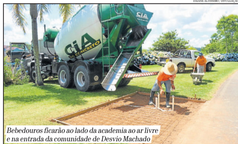
Bebedouros ficarão ao lado da academia ao ar livre e na entrada da comunidade de Desvio Machado