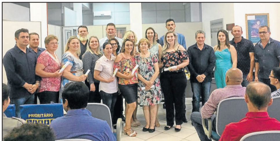
Membros do Conselho Municipal de Educação receberam diplomas de reconhecimento