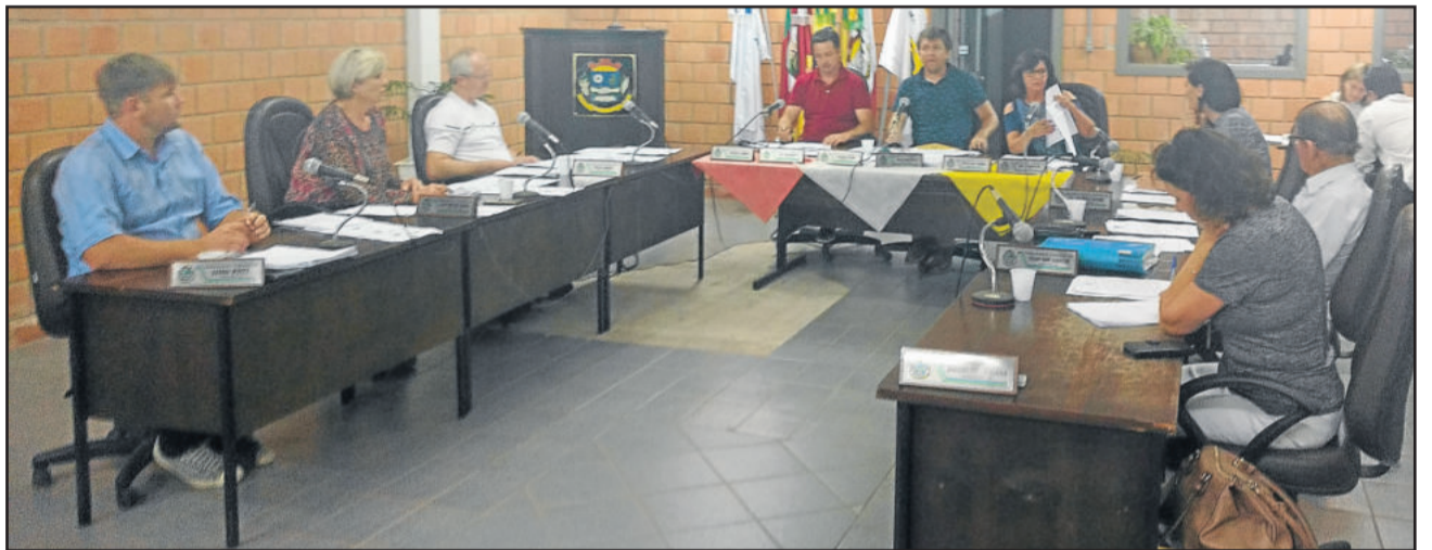
Última sessão ordinária do ano teve votação de vários projetos

Estão na Casa Legislativa ainda para apreciação os projetos 058 e 062. O primeiro acabou nem sendo incluso na pauta. Propõe atualizar o valor relativo à Bolsa Permanência no Programa Mais Médicos ao profissional estrangeiro vinculado ao programa. A nova redação especifica o valor de