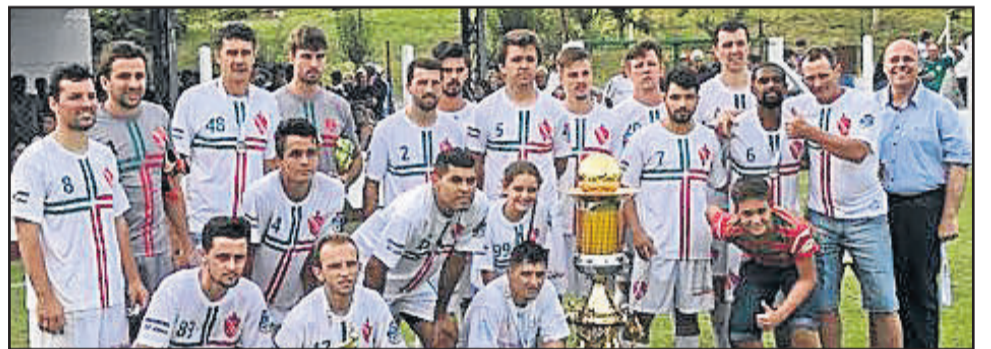
Riograndense, de Imigrante, vice-campeão dos Titulares