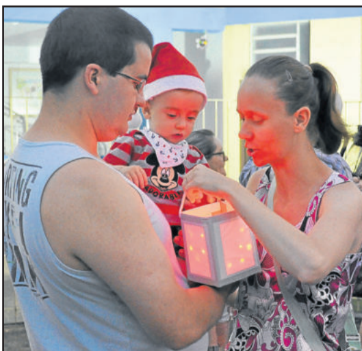
Desfile reuniu muitas famílias e crianças

confirmavam o que ela havia dito no início da caminhada: ver as pessoas felizes e cantando era a garantia de felicidade e orgulho.