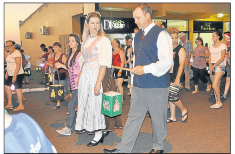
Tradições alemãs foram lembradas durante a caminhada