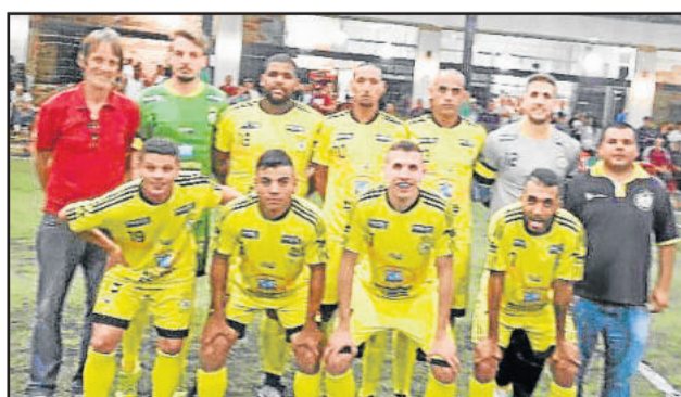
AABBOC de Canoas chegou novamente à final