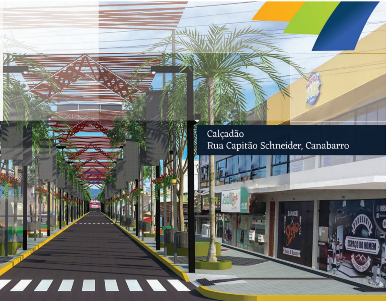
Calçada Rua Capitão Schneider, Canabarro