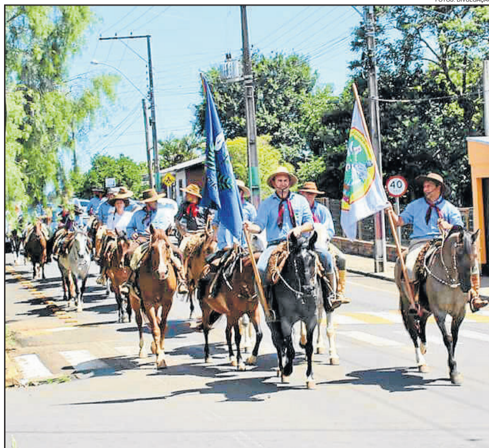
Cavalgada percorreu ruas de Teutônia