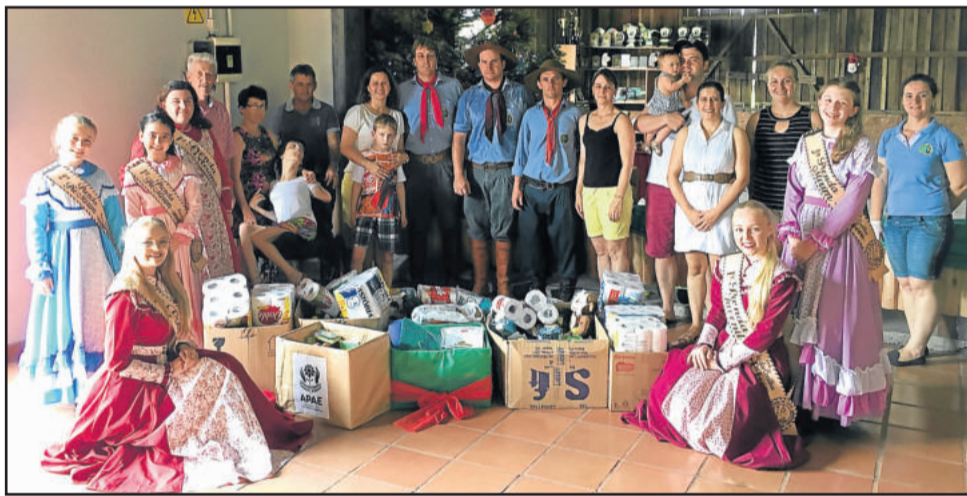
Apae foi beneficiada com donativos

Na oportunidade houve a apresentação da nova patronagem do Rincão das Coxilhas para 2018: