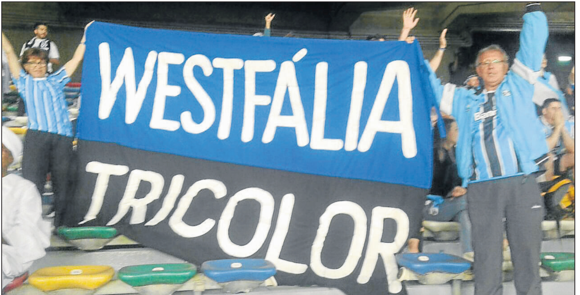
Eldo e Sílvia levaram o nome de Westfália para a final do Mundial em Abu Dhabi