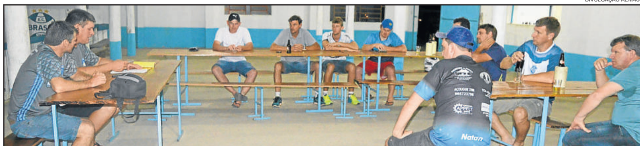
Equipes aguardam confirmação de apoio público para ingressar na competição