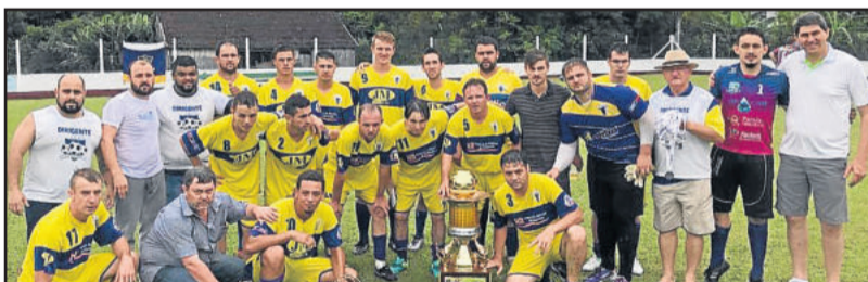
Independente, de Paverama, vice-campeão dos Aspirantes