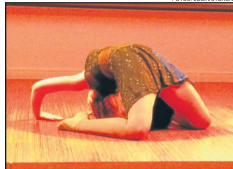
Flexibilidade, desenvoltura e muita coordenação em cena