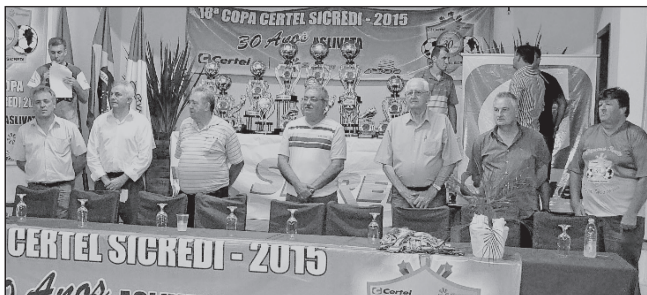
Mesa oficial contou com autoridades, representantes das cooperativas parceiras e diretoria da Aslivata