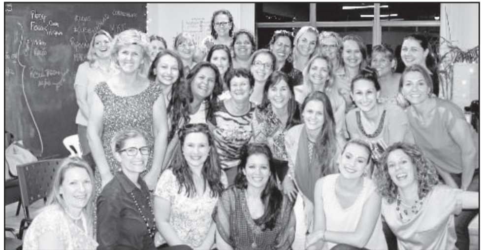
Grupo de mulheres empreendedoras assistiu palestras no encerramento do Programa de Mentoria