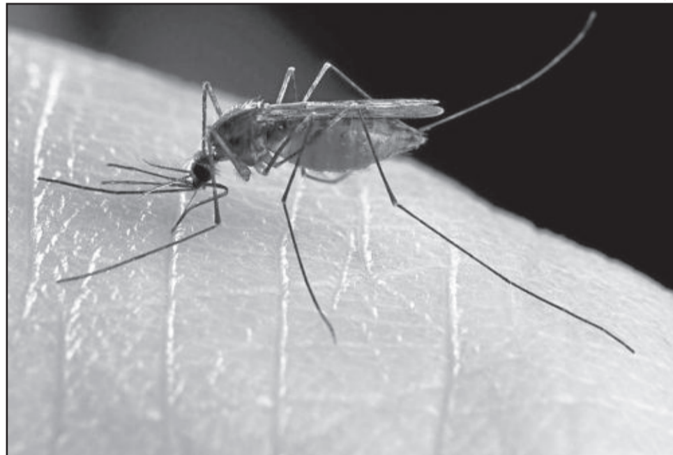
Mosquito borrachudo, um incômodo para muitas pessoas

competir com a matéria orgânica. A larva não vai se alimentar necessariamente do BTI que vou largar. Ele precisa ingerir o produto para morrer, pois o BTI paralisa o intestino da larva”, explica Cardoso.