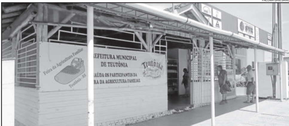
Feira fica ao lado do STR em Canabarro