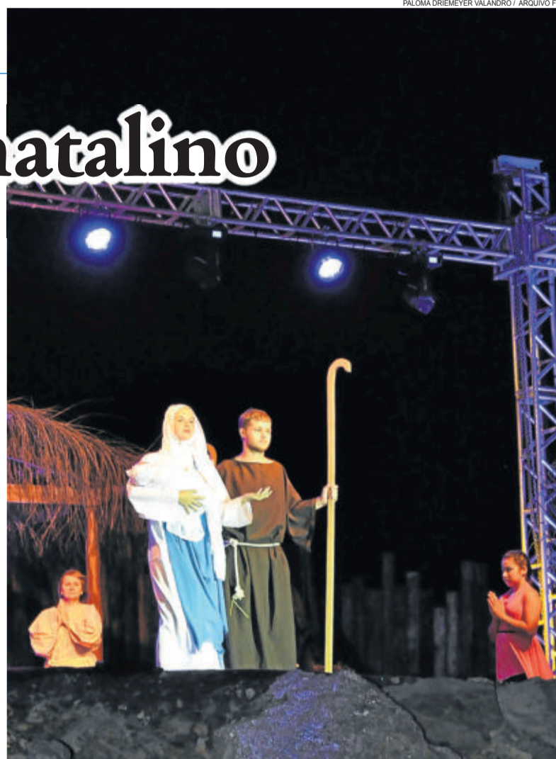
No ano passado, atores locais encenaram a peça teatral 'Fé e Alegria'

O 5º Natal Iluminado tem o patrocínio de Cooperativa Languiru, Sicredi, EXPOPEDRAS, Jaime Euri Grave & Cia, Hollmann & Bagio, Xile Paisagismo, Eletro Luz, Frigorífico Angus e Metalúrgica Krabbe.