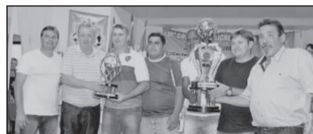
Pinheiros, de Taquari, vice-campeão dos Aspirantes