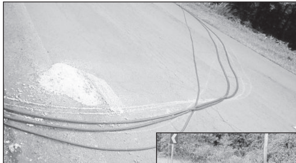
Fios ainda estavam sobre a pista ontem de manhã