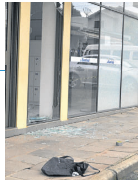
Porta foi quebrada com uma marreta

Caso o crime tivesse ocorrido durante o dia, a provavelmente a ação seria igual ao assalto às agências bancárias de Imigrante e o impacto na cidade seria muito maior.