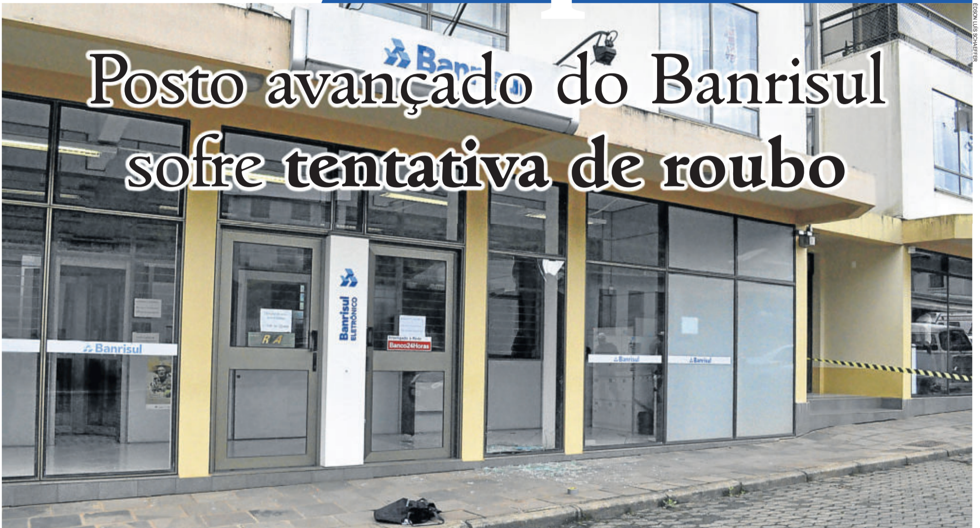
Explosivos utilizados pelos criminosos não detonaram e nenhuma quantia de dinheiro foi levada. BOA VISTA DO SUL > 6