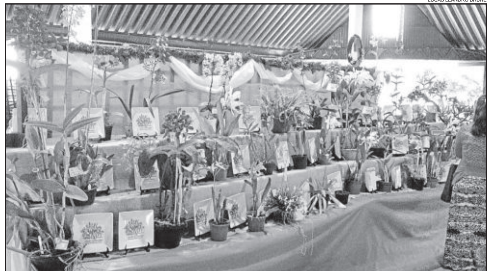
Exposição Regional de Orquídeas

Hoje, sábado, e amanhã, domingo, acontece no Centro Cívico da Prefeitura Municipal de Teutônia a 4ª Exposição Regional de Orquídeas e 1ª Exposição Estadual de Cattleya leopoldi. A promoção é da Associação de Orquidófilos de Teutônia, com o apoio da Administração Municipal de Teutônia, Polo do Vale