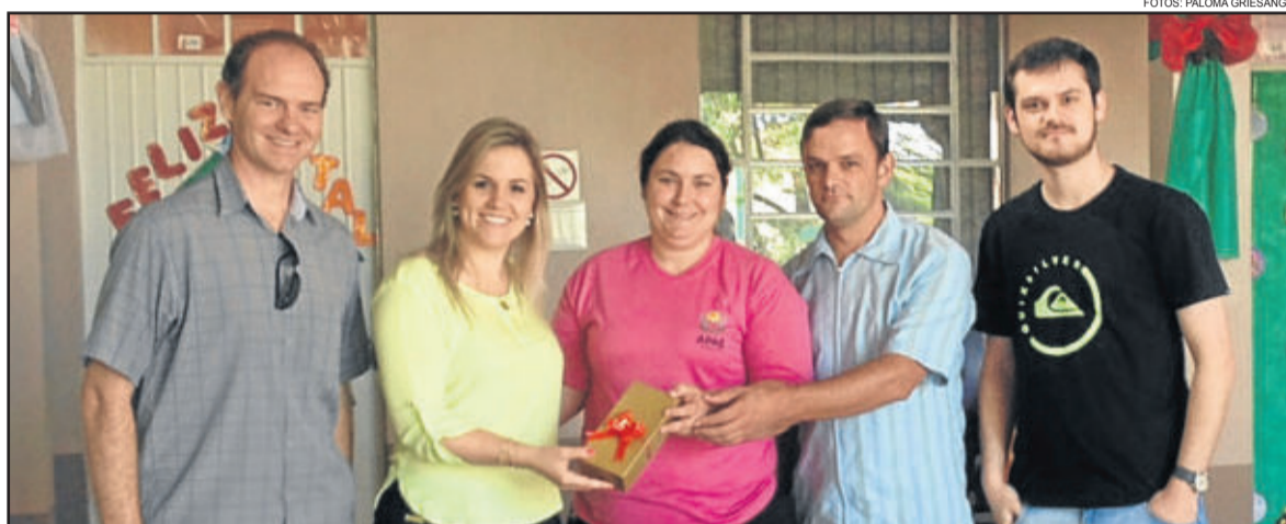
Doação foi entregue à diretora da Apae