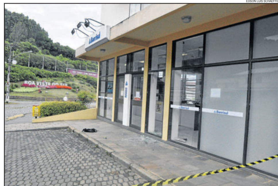
Posto avançado do Banrisul foi alvo de tentativa de roubo