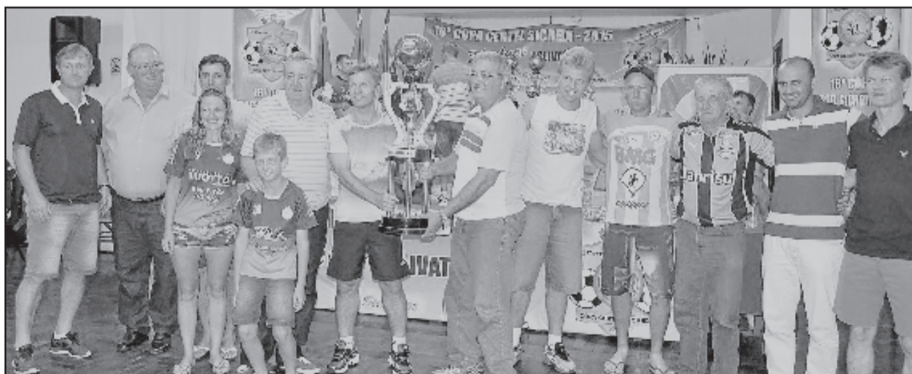
Juventude de Linha Frank, de Teutônia, campeão dos Veteranos, campeão da disciplina e destaques individuais

Ocorreu na noite de quinta-feira, dia 17, a cerimônia de premiação do 30º Campeonato Regional organizado pela Associação de Ligas do Vale do Taquari (Aslivata). A 18ª Copa Certel Sicredi em 2015 homenageou os 30 anos da Aslivata. O evento ocorreu no Clube dos 15, em Lajeado, e contou com a presença de autoridades, clubes e imprensa.