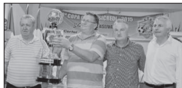
União Carneiros, vice-campeão dos Titulares