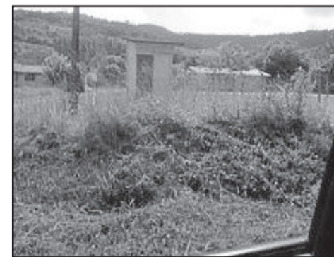
Para Althaus, situação no entorno dos poços estão precárias

Hoje, são 13 poços de responsabilidade do Município. A manutenção destes poços deve ser feita mensalmente, sendo realizado pelo Departamento Municipal de Abastecimento de Água de Paverama, que conta com dois servidores.