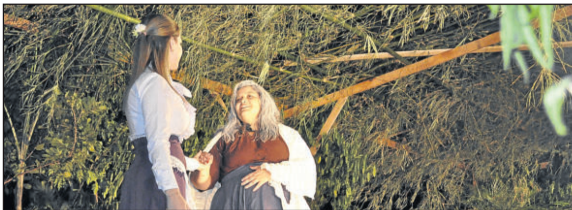
Atores simularam a história do nascimento de Jesus no estilo Gaúcho