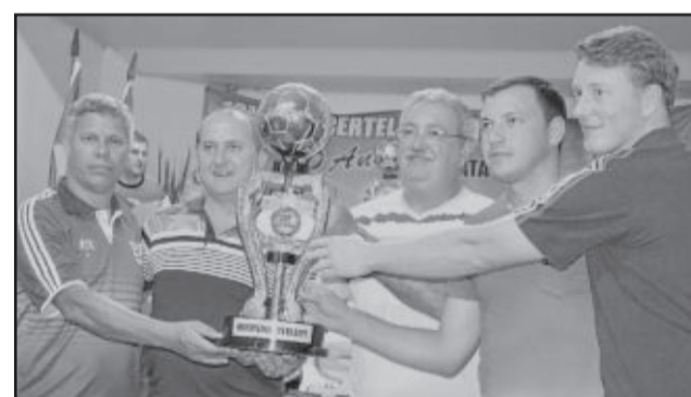
Assespe, de Venâncio Aires, campeã da disciplina nos Titulares