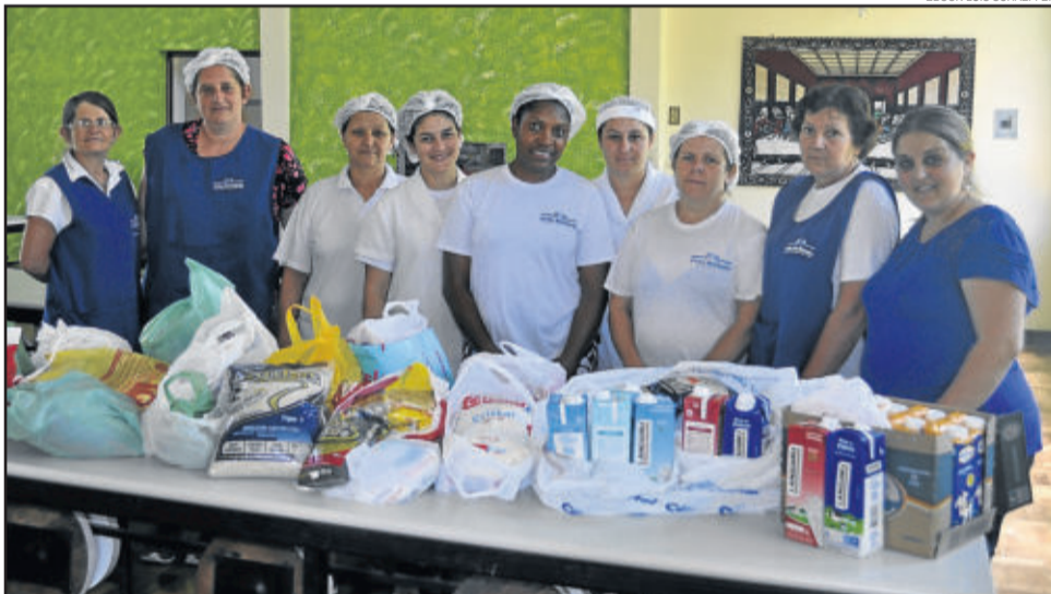
Donativos sendo entregues à Associação Beneficente Pella Bethânia