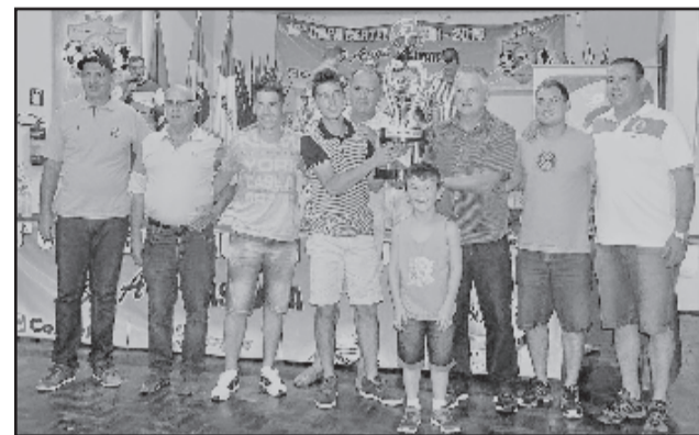
União de Palmas, de Encantado, vice-campeão dos Veteranos

No total, foi entregue uma premiação de R$ 16 mil em dinheiro, troféus, medalhas e faixas.