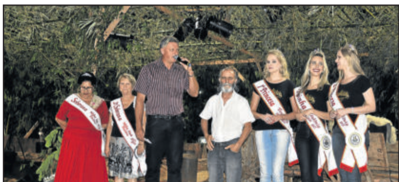
Presença das Soberanas do município (d) e da 3ª idade