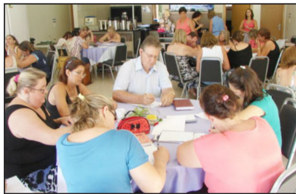
Direções tiveram momentos de planejamento