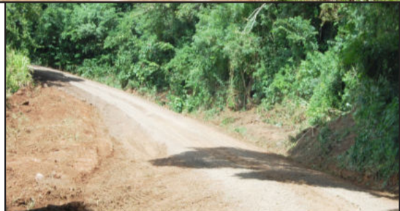
Reparo na Linha Castro Alves está finalizado