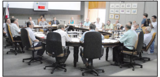
Legislativo de Lajeado aprovou ampliação dos serviços nas creches