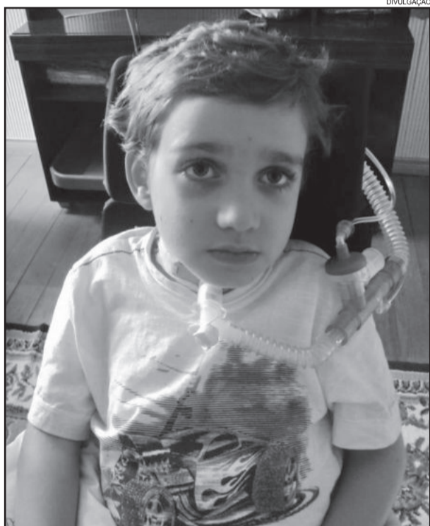
Advogados do governo do Estado preparam defesa para derrubar a liminar que garante viabilização de marca-passos diafragmático

O acidente ocasionou uma lesão medular e afetou a função respiratória do menino, que depende de um ventilador mecânico