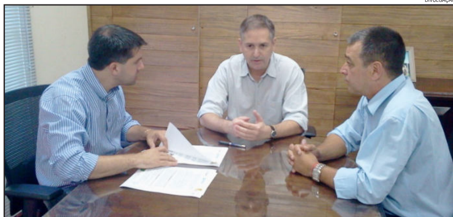
Reunião tratou do protocolo de intenções entre Prefeitura e FDRH

O protocolo de intenções estabelece uma parceria entre a Prefeitura e a FDRH, que disponibiliza os demais serviços da fundação como a Gestão de Concursos Públicos e a promoção de cursos através do Sistema Integrado de Formação Continuada na Administração Pública, por meio da Rede Escola de Governo. Os cursos da FDRH visam à formação de gestores públicos e agentes sociais e promovem a qualificação do atendimento público.