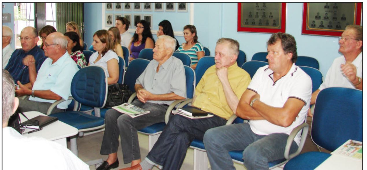
Reunião discutiu planejamento de atividades para a Terceira Idade