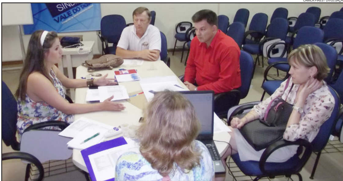
Comissão organizadora intensifica preparação do evento

É com o objetivo de aliar duas frentes atuais e essenciais no mercado - capacitação e inovação - que o Sindilojas Vale do Taquari prepara um evento inédito voltado ao comércio. Na quinta-feira, dia 14, a comissão organizadora realizou mais um encontro na sede da entidade, em Lajeado, a fim de planejar a programação. Entre as definições estão a data e local da atividade. Será no dia 25 de abril, no Clube Sete de Setembro, em Lajeado.