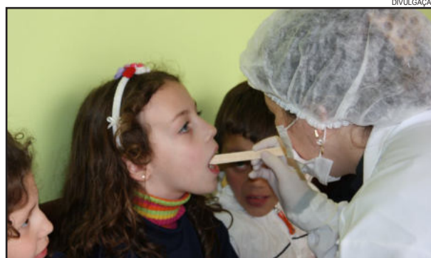
Atendimento odontológico está disponível no Bairro Fenchamp

A Secretaria de Saúde comunica que desde ontem, segunda-feira, dia 18, há atendimento odontológico diariamente no Posto de Saúde do Bairro Fenchamp. O dentista atende de segunda a sexta-feira, das 7h15min às 11h20min. Mais informações através do telefone (54) 3464-1541.