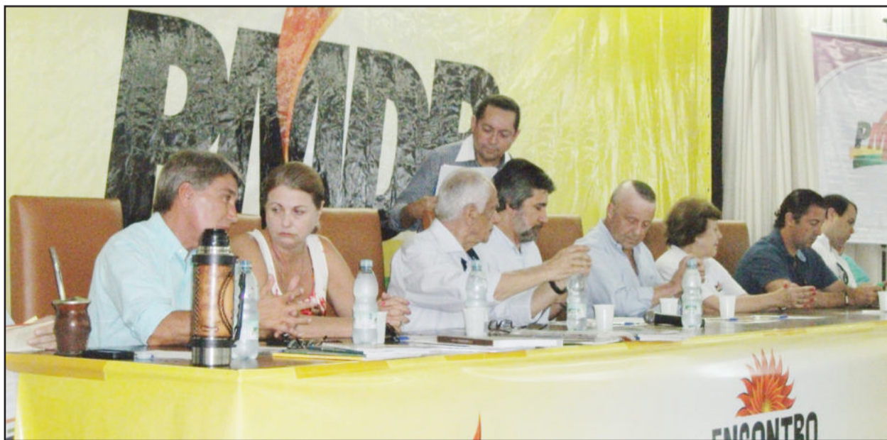
PMDB realizou seu encontro de verão no sábado, em Tramandaí