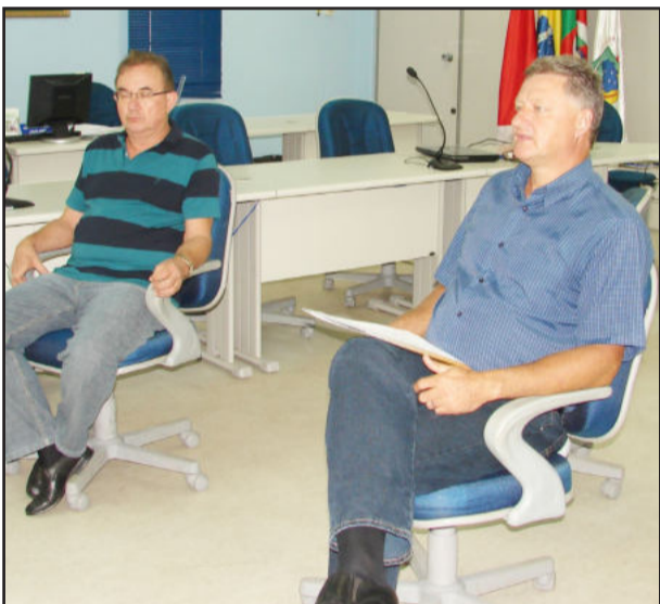
Reunião aconteceu na Câmara de Vereadores de Teutônia