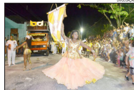
Outra atração foi a Império da Zona Norte, de Porto Alegre