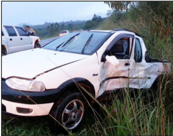
Condutor da strada foi preso em flagrante