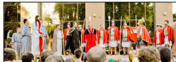
Julgamento de Jesus

Pelo décimo quarto ano, o Movimento Emaús de Garibaldi realiza as encenações da Paixão, Morte e Ressurreição de Cristo em Garibaldi, juntamente com a Paróquia São Pedro de Garibaldi. A programação conta com apoio do Movimento de Cursilhos da Cristandade, Projeto Crescer e Prefeitura Municipal de Garibaldi. Aproximadamente 100 pessoas estarão envolvidas nas encenações.