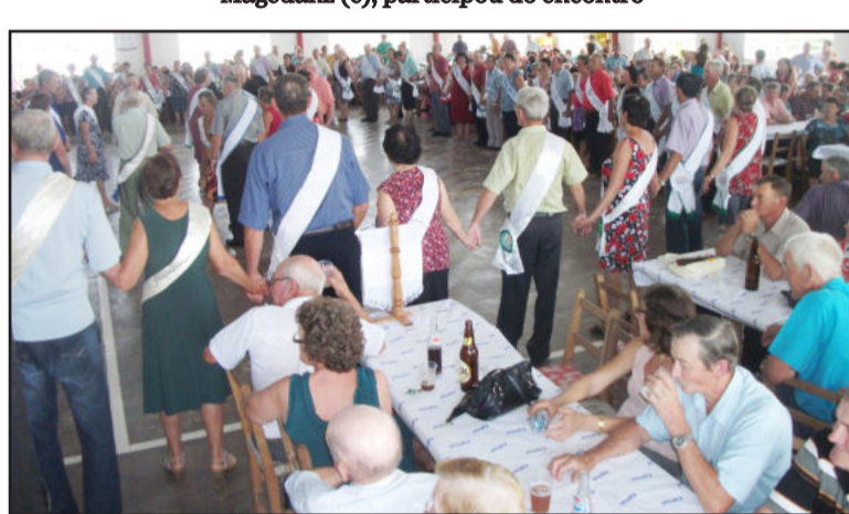
Momento da escolha do Rei e da Rainha do Grupo