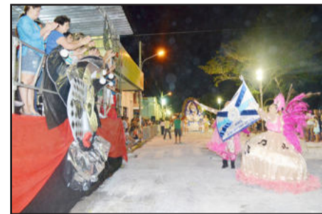
Escola Inhandava, de Bom Retiro do Sul, relembrou os seus 30 anos de atividades