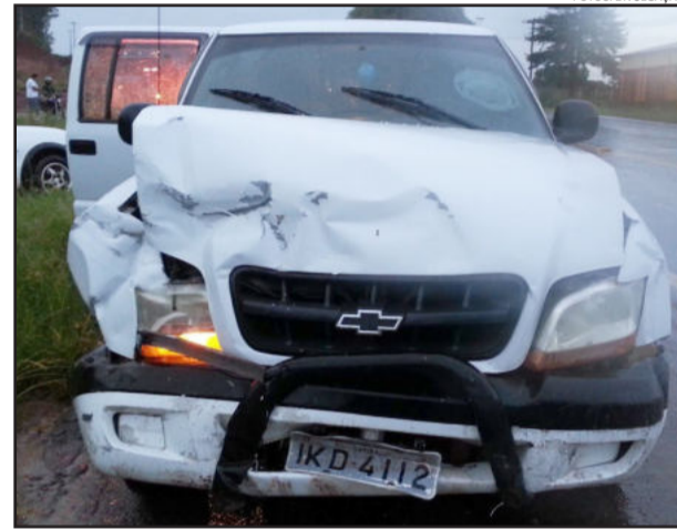
S10 teve a frente destruída