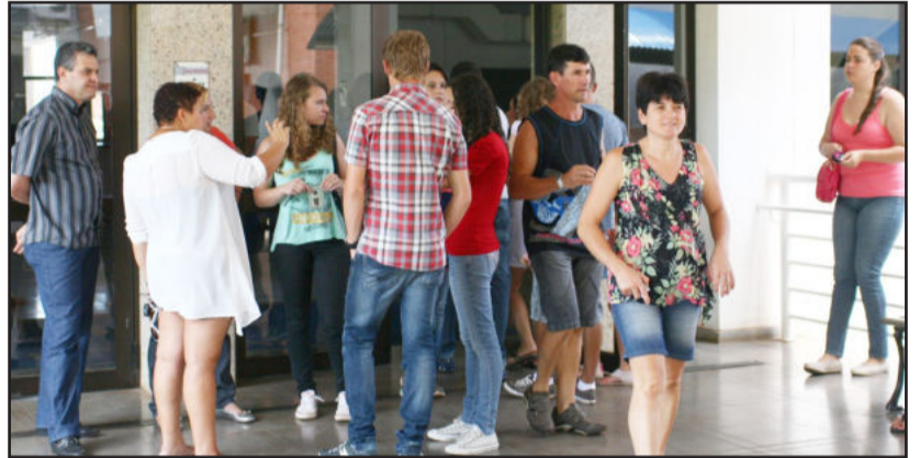
Movimentação foi intensa no campus

O listão dos aprovados no Vestibular Complementar da Univates será publicado até a próxima quarta-feira, dia 20, no site da Univates. As ma-