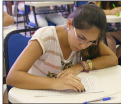
Estudantes fizeram a prova do Vestibular Complementar, que consistia em redação sobre o tema meio ambiente