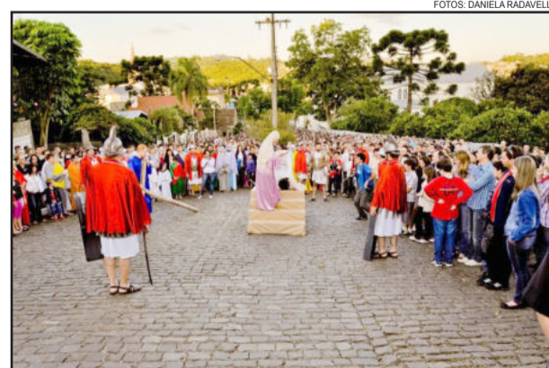
Veronica enxuga o rosto de Jesus

Na Sexta-feira, 29, acontece a Celebração com a bênção da Macela, às 9 horas na Igreja Matriz.