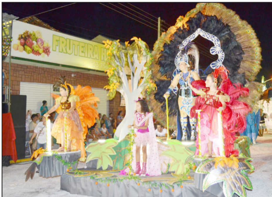
Batutas da Orgia foi uma das atrações do Carnaval taquariense