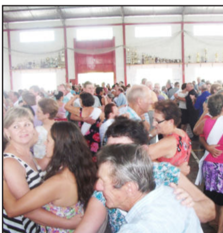
Turma se divertiu às vésperas do Carnaval