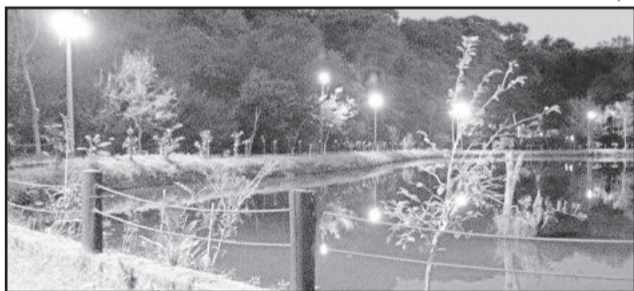
Parque do Engenho já conta com iluminação e receberá chafariz