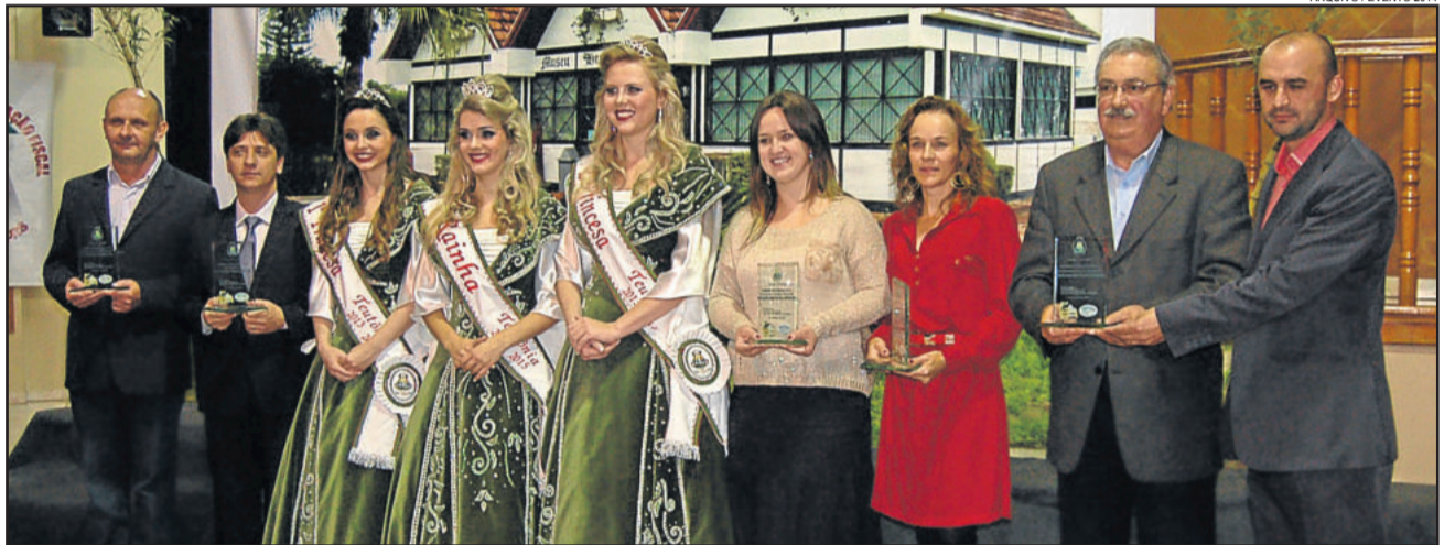
Em 2014 também foram premiadas as maiores empresas em crescimento na produção primária, ISS, Simples Nacional, Prestadores de Serviços e Empresarial

Na abertura do evento haverá a participação especial da Orquestra Municipal de Teutônia.