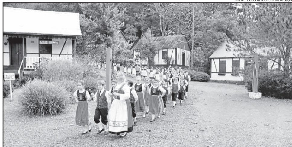
Polonaise formada por mais de 400 crianças abrilhantou o evento

Neu Vienn, da Escola Municipal de Ensino Fundamental (Emef) Nova Viena, de Lajeado, Schen Ist Die Jugend, de Marques de Souza, Wasser Mühle, da Emef São João, de Lajeado, Talquelle, de Nova Hartz, Frühlingstanze, da Emef Dom Pedro I, de Lajeado, Polka, de Santa Cruz do Sul, Blauen Kranz, da Emef Capitão Felipe Dieter, de Lajeado, Sonnenlicht, de Imigrante, Grüner Jager, de Venâncio Aires, Helmuth Kuhn, de Arroio do Meio, Lustiger Volkstanzgruppe, da Emef João Batista de Mello, de Forquetinha, Blumenthal, da Emef Pedro Welter, de Lajeado, e Sonnenstrahl, de Três Coroas, foram os grupos que participaram do encontro. Reunidos após a abertura oficial, os grupos formaram uma Polonaise considerável, que percorreu os caminhos do parque abrilhantando o começo do encontro de danças. Durante a tarde, após as apresentações de cada grupo, ocorreu uma gincana de integração.