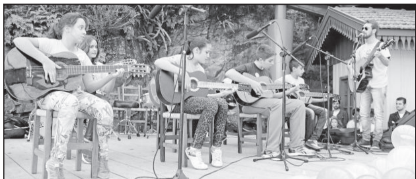
Cada escola realizou uma apresentação artística