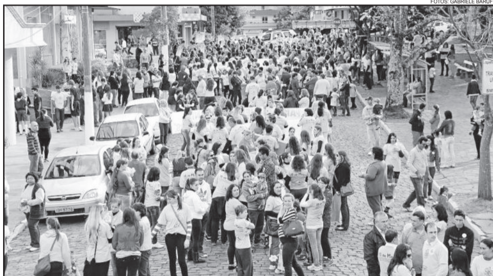
Bom público prestigiou o evento