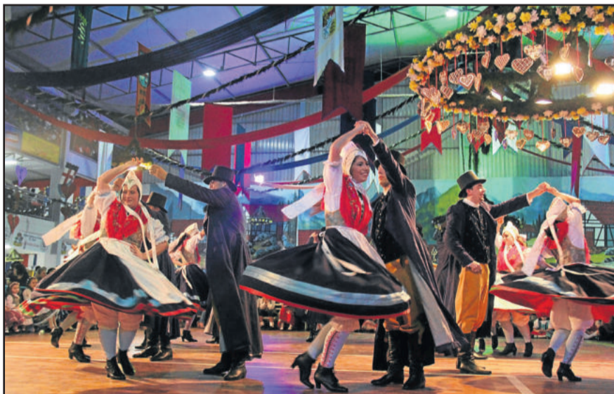
A ornamentação e os dançarinos deram tom especial ao baile

Mais de 1,4 mil pessoas festejaram a Maifest no Festival do Chucrute