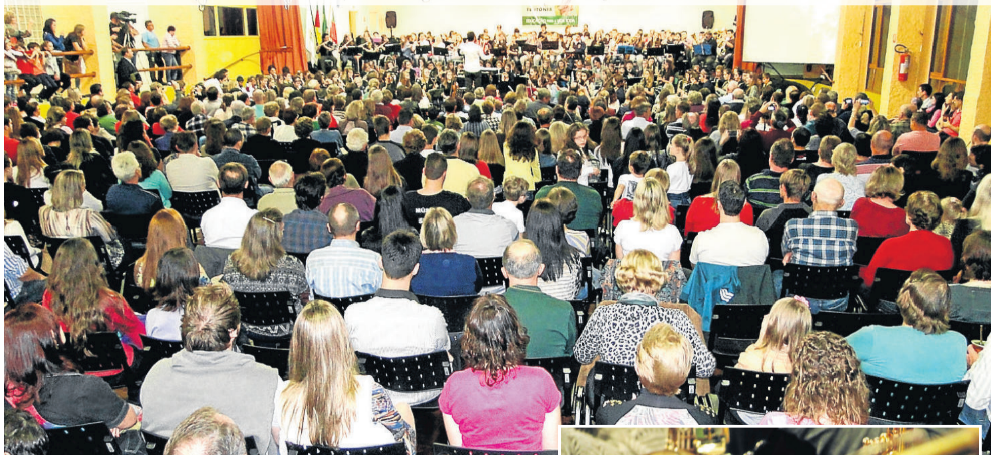
Auditério Central do Colégio Teutônia lotado para o concerto da Grande Orquestra, ao final do evento

Evento contou com a participação de cerca de 230 instrumentistas de 16 grupos de diferentes municípios