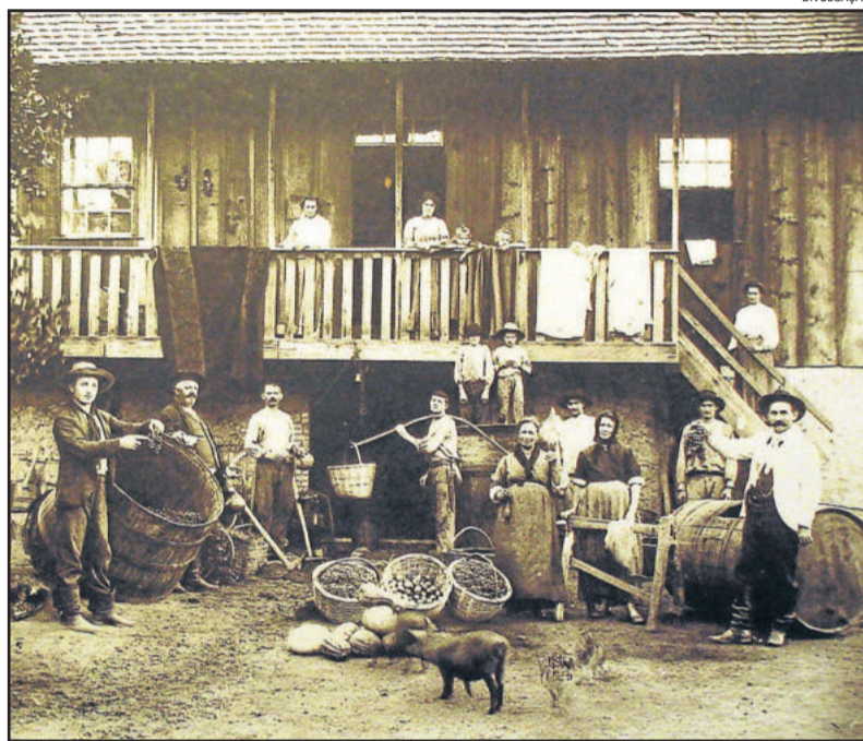
Colonos italianos expõem seus produtos em feira na zona rural de Caxias do Sul em 1918.