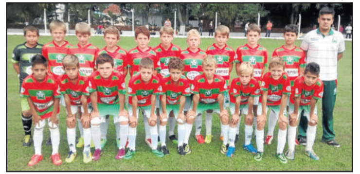
Categoria 2005 goleou, fora de casa, o Projeto Fera