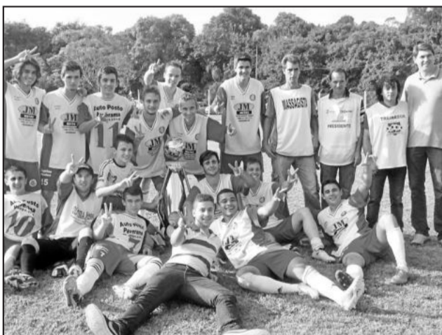
Aspirante do Internacional campeão

A Coordenadoria de Esportes informa que durante essa semana será divulgada a data de entrega oficial das premiações para as equipes e destaques individuais.