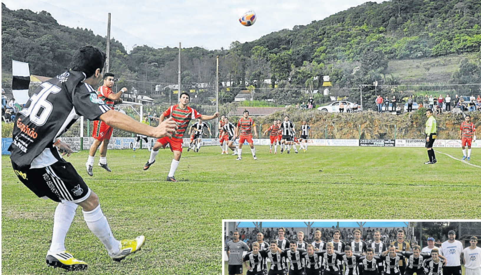
Ecas empatou, mas conseguiu vaga na final