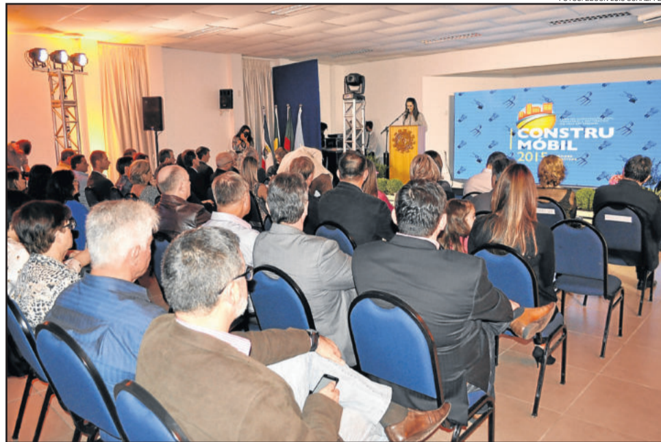
Lançamento da Construmóbil 2015 evidenciou a importância da feira para a região