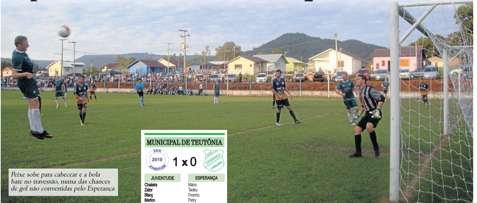
Peixe sobe para cabecear e a bola bate no travessão, numa das chances de gol não convertidas pelo Esperança