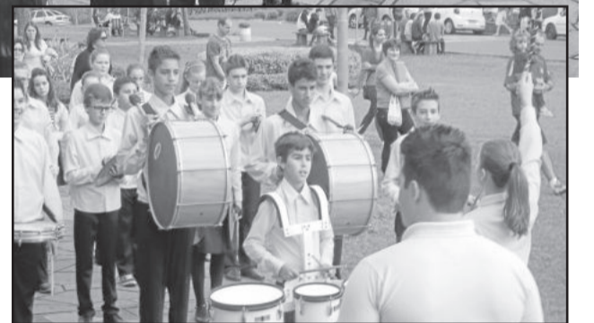
Banda Marcial deu início ao movimento

Ação contou com parceiros da Secretaria que estão engajados na causa