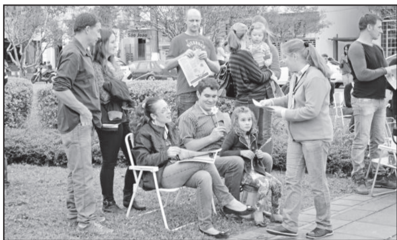
Mobilização ocorreu no Parque da Estação, onde havia grande concentração de pessoas