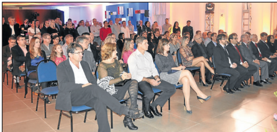
Autoridades, empresários do setor e imprensa acompanharam o lançamento do evento

A Construmóbil está em sua sétima edição. A primeira foi realizada em 2003 com o propósito de integrar e fomentar o desenvolvimento da cadeia produtiva de três setores de grande representatividade para o Vale do Taquari: construção civil, mobiliário e decoração. A realização é da Acil e do Governo de Lajeado.