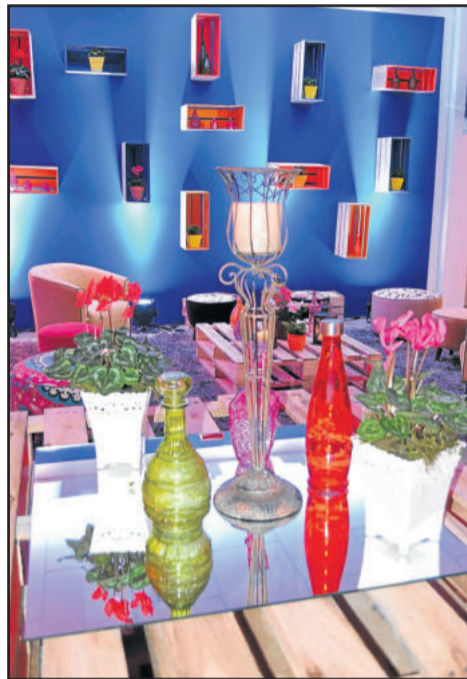
Decoração durante o lançamento já mostrou tendências sustentáveis e criativas que serão apresentadas na feira

Este ano, a intenção é fortalecer ainda mais a marca Construmóbil e confirmar a sua importância para o desenvolvimento dos negócios dos setores envolvidos. A feira ainda é considerada uma vitrine para a apresentação de tendências e lançamentos de produtos e serviços. A expectativa é de grandes negócios, já que mais de 70% dos espaços de exposição já estão comercializados, tanto nos três pavilhões, quanto nos espaços externos. As novidades do mundo da decoração de interiores poderá ser conferida na Mostra Arquitetura & Design. A Construmóbil ainda prevê rodadas de negócios e palestras técnicas.