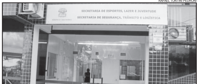
Nova sede está localizada na Rua Buarque de Macedo

bém estão instaladas as Secretarias da Educação e do Meio Ambiente e Planejamento Urbano, bem como o Ecoponto de resíduos eletrônicos e o arquivo público.