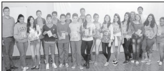
Emef Prof. Theobaldo Closs