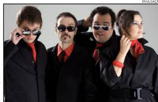
Bidê ou Balde

Com a apresentação de Bidê ou Balde e Anjos do Hanggar, são cinco shows no total em dois dias de programação. Todos eles têm entrada franca.