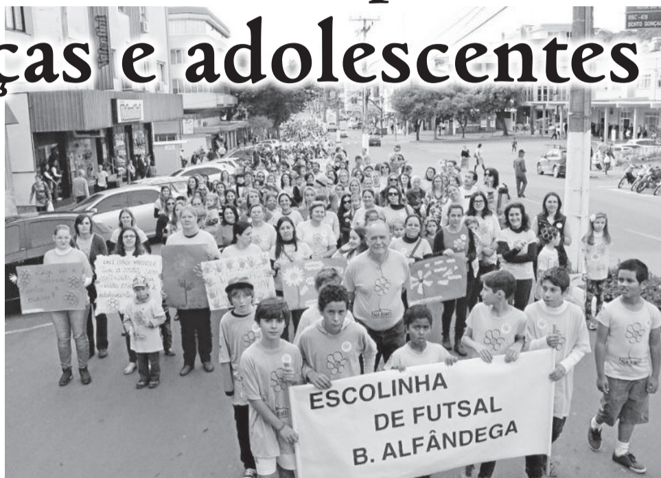
Caminhada Faça Bonito ocorreu no sábado, dia 16