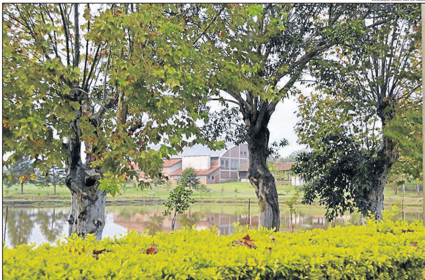
Culto festivo do Dia Sinodal da Igreja será no ginásio (ao fundo) da Associação Pella Bethânia

plica que o encontro festivo vai muito além de reunir os membros da IECLB da área que abrange o Sínodo, uma vez que a data coincide com o dia de Pentecostes. “Este ano, no dia 24 de maio, será o dia de Pentecostes. A bíblia relata que, neste dia, os discípulos estavam reunidos em um só lugar e veio sobre eles o Espírito Santo, dando início à igreja cristã. Nós fazemos a memória de Pentecostes reunindo toda a Igreja do Vale do Taquari em um