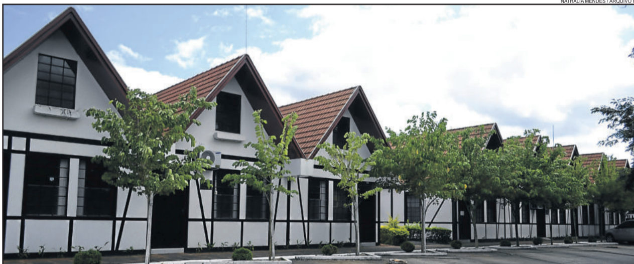
Centro Administrativo será palco de algumas das atrações de aniversário

24 de maio - 13h30min - Show da Família da Rádio Popular FM, no Pavilhão Multiuso, com ingresso grátis