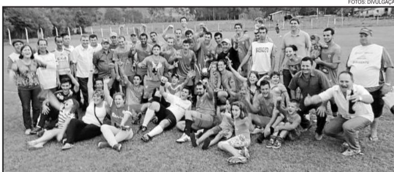
Internacional campeão Titulares