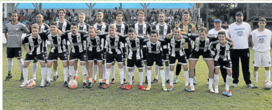
Ecas aguarda o outro finalista