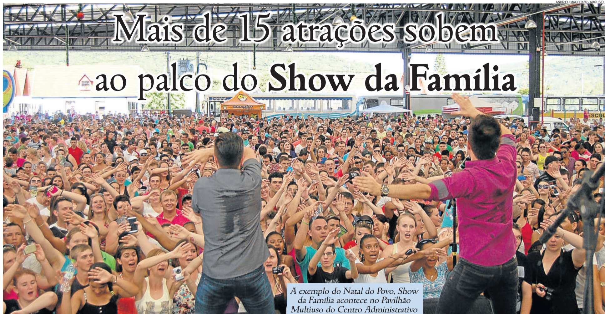
A exemplo do Natal do Povo, Show da Família acontece no Pavilhão Multiuso do Centro Administrativo

Evento acontece no próximo domingo, dia 24 de maio, no Pavilhão Multiuso