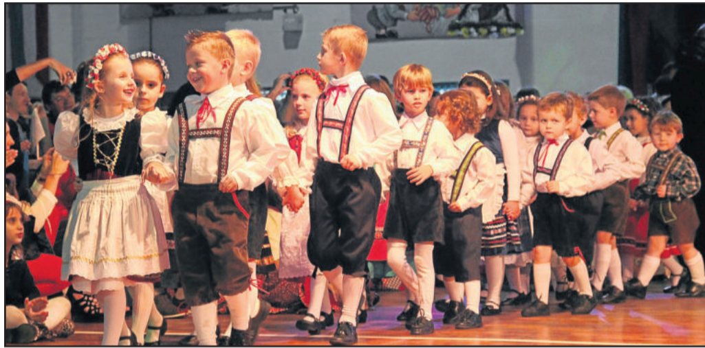
Dançarinos de todas as idades animaram a festa