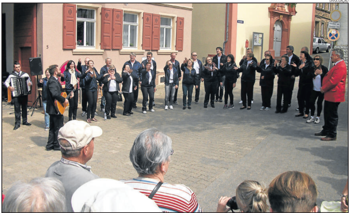
Grupo já realizou algumas apresentações

Na manhã de ontem, dia 18, o grupo realizou mais algumas visitas turísticas pelo Rio Reno e cidade vizinhas. Hoje, o coral realiza uma apresentação no Kurpark, na cidade de Bad Kreuznach.