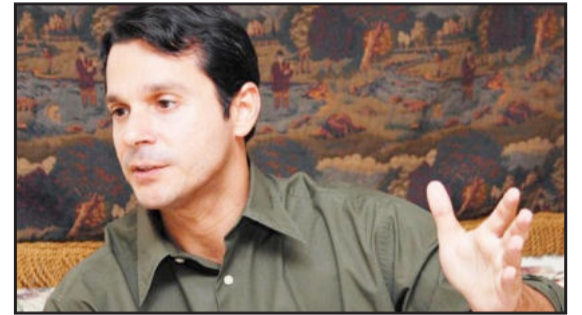
Deputado José Antônio Reguffe

Este teve coragem de mudar. Por que os demais não seguem o exemplo? E não é moralismo nem politicagem de parte do deputado! É austeridade e economia! Isto sim é respeito ao dinheiro público!