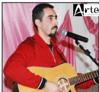
Palestrante também cantou para o público