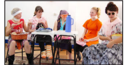
O teatro também fez parte das homenagens

viram atentamente as dicas e conselhos, entre os quais, "que somos responsáveis pelo nosso sucesso ou fracasso, e que nunca devemos desistir de nossos objetivos".