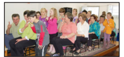
A interação entre netos e avós