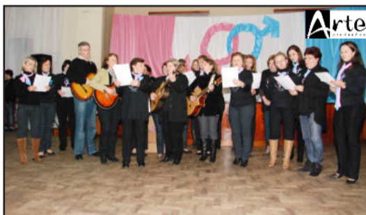
Voluntários apresentaram uma canção