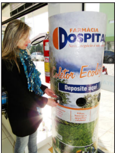
Coletor ecológico está disponível na Farmácia Dospital instalada junto ao HOB

Todo material depositado no coletor ecológico da Farmácia Dospital é recolhido pela empresa Ecolog, que realiza o transporte e providencia o seu encaminhamento ao destino final correto e reprocessamento dos resíduos. Saiba mais sobre a empresa no site www.ecologambiental.com.br .