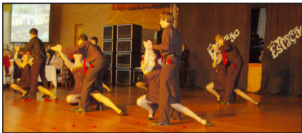
Tango foi uma das interpretações dos alunos do Colégio Teutônia