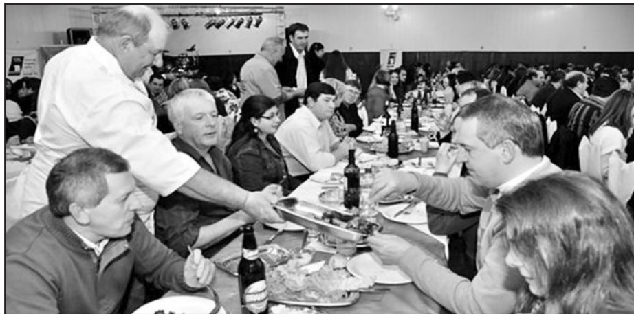
Jantar do Comerciante e Comerciário foi realizado na noite de sábado

A terceira edição do Jantar do Comerciante e do Comerciário consolida o evento junto ao setor comercial de Garibaldi. Realizado pela CDL, com apoio da CDL Jovem e da CIC, o jantar aconteceu na noite de sábado, dia 16, no salão comunitário Santo Antônio, do Bairro Champagne. A festa também contou com a presença de autoridades e representantes de diversos setores da economia garibaldense.