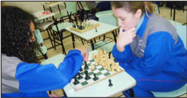
Jogos de Xadrez definiram os classificados para a etapa municipal