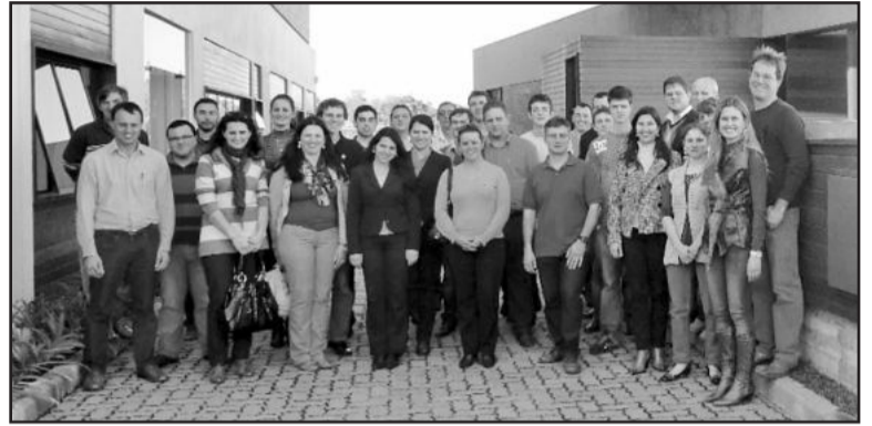
APEME realizou visita técnica à Bortolini Móveis

A Associação de Pequenas e Médias Empresas de Garibaldi (APEME) promoveu, na tarde do dia 15, uma visita técnica à empresa Bortolini Móveis. A empresa inaugurou suas novas instalações em 2010. A ação integra o Programa de Visitas Técnicas desenvolvido pela APEME desde 2008.