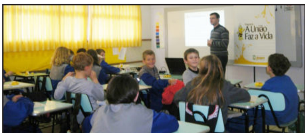
Alunos da Escola Municipal Vila Schmidt tiveram minicurso de Educação Financeira

O mini curso trouxe aos alunos noções básicas de como poupar e investir bem seu dinheiro, de onde ele vem e como ele geralmente é gasto. A união entre a escola e o Programa A União Faz a Vida objetiva a formação dos alunos em cidadãos saudáveis, já que as estatísticas mostram que a saúde financeira das pessoas influencia diretamente na saúde física e mental da população.