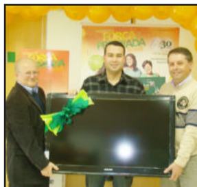
Associado da Sicredi Ouro Branco recebe prêmio da Campanha Promocional Força Premiada Sicredi

Confira os associados que foram contemplados nos primeiros sorteios: