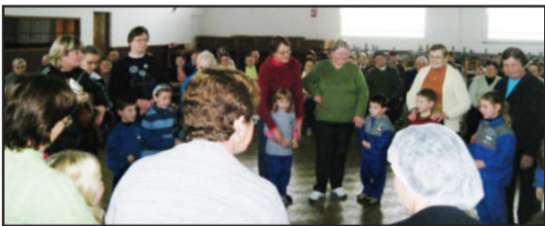
Atividades entre avós e alunos marcaram integração na EMEF Vila Schmidt