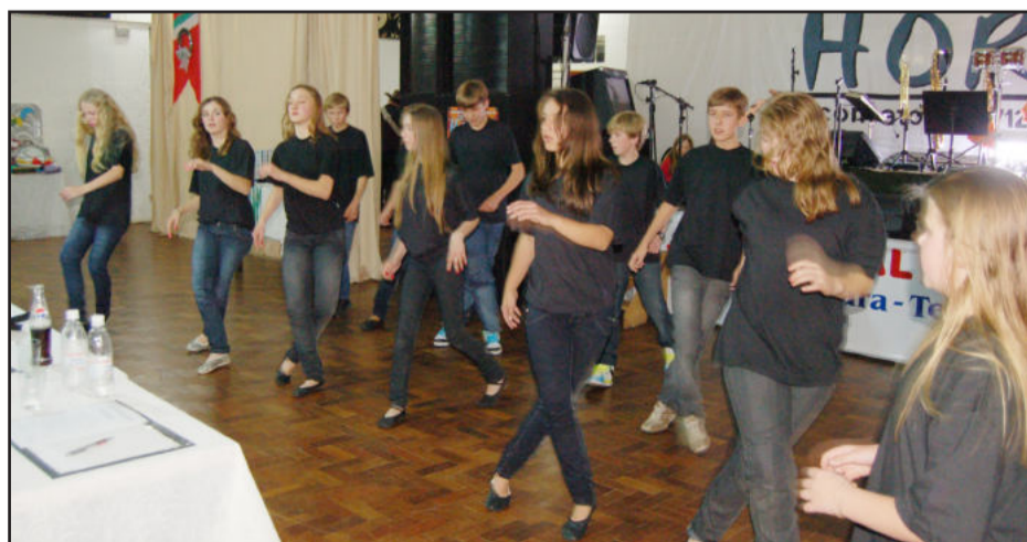
Alunos da Escola Dom Pedro I apresentaram danças no evento