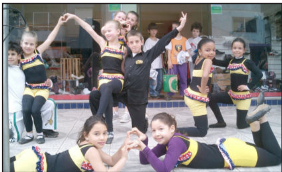
Turma Mirim de Dança Cemef com a coreografia Biquíni, homenageando os anos 60

Em nome do Centro Municipal de Ensino Fundamental Leonel de Moura Brizola - Cemef agradecemos a toda a comunidade pelo apoio dado à festa e também à loja DMF Calçados que nos cedeu gentilmente sua calçada para as apresentações.