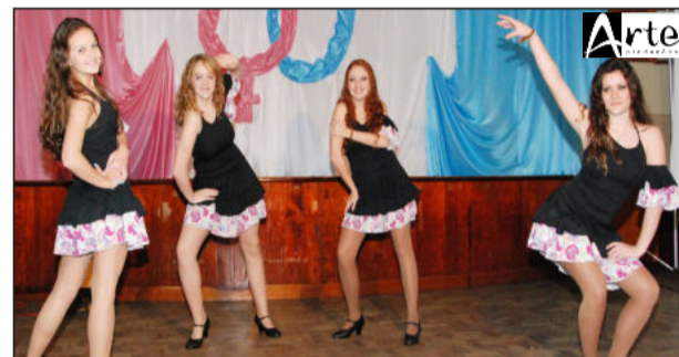
Expressarte Grupo de Danças fez várias apresentações