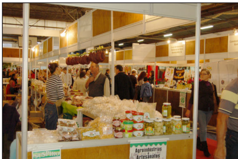
Cerca de 29 mil pessoas prestigiaram a Agroind

A comercialização se deu nas agroindústrias, que mostram a variedade de sua produção. Do queijo de Minas Gerais, artesanato sustentável do Paraná aos embutidos e conservas do Rio Grande do Sul, o públi-