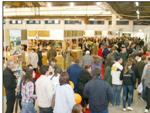
Visitação foi mais intensa no domingo