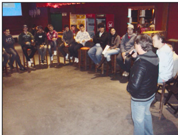
DJ's do Vale do Taquari debatem cenário na região