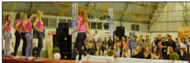
Candidatas e candidatos desfilaram na sexta à noite no ginásio do Icecg