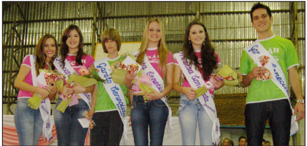
Garotos e Garotas Cenecistas 2011

O ginásio Ernani Júlio Sippel sediou, na noite de sexta-feira, dia 15, a escolha dos novos Garotos e Garotas Cenecistas. O Grêmio Estudantil Águia de Haia (Gecáh) e o Instituto de Educação Cenecista General Canabarro (Icecg) promoveram o evento, que teve a participação de pais, alunos e da comunidade escolar.