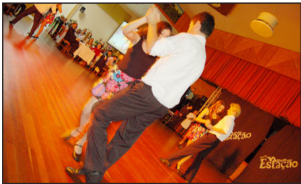
Alunos tiveram 30 dias para aprender os passos de seu ritmo e apresentar como tarefa da gincana

Cerca de 30 dias antes do Jantar-Baile, os estudantes da 8ª série do Ensino Fundamental até o 3º Ano do Ensino Médio foram desafiados a ensaiar um ritmo musical. A partir de sorteio ficou definido qual série iria interpretar cada ritmo. Atento, o público assistiu em pé e aplaudiu as apresentações de forró, salsa, tanto e rock'n roll.