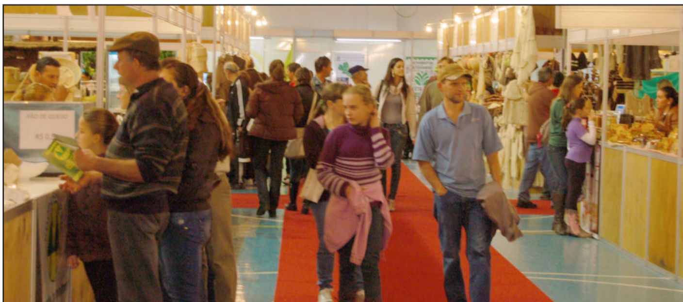
Evento iniciou no dia 13 e se estendeu até o domingo, dia 17 de julho. Cerca de 29 mil pessoas passaram pelo Parque do Imigrante, em Lajeado, e Agroind fechou com R$ 10,7 milhões em negócios. Páginas 8 e 9