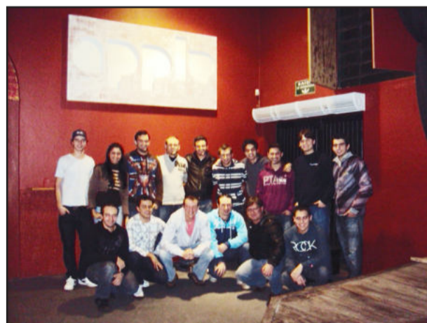
DJ's da região visualizam oportunidades no mercado

O próximo encontro, 3º Debate de DJ's do Vale do Taquari, será no mês de outubro, novamente em Lajeado.