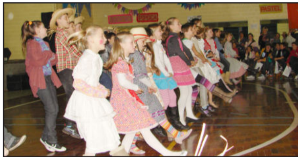
As crianças compareceram com trajés caipiras

Além das apresentações dos alunos, ainda esteve à disposição outras atrações, como: Pescaria, Dança da Quadrilha, Cadeia e os tradicionais comes e bebes juninos. Para finalizar a noite, houve baile animado por Contato Show.