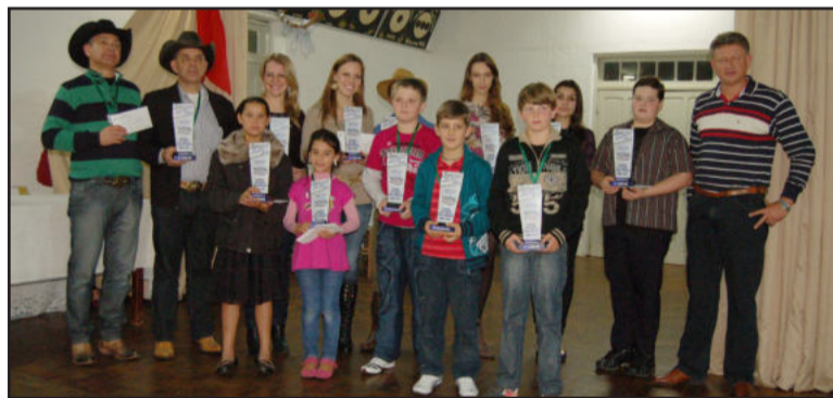
Destaques das 3 categorias foram premiados com o Troféu Teutônia 30 Anos na noite de sábado. Página 11