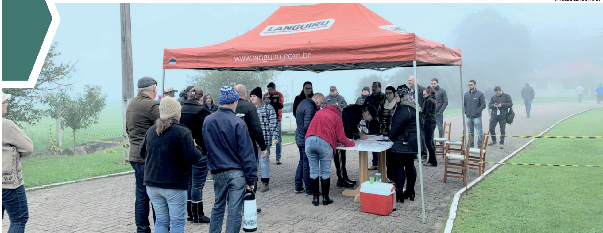
Assembleia foi realizada na manhã desta terça-feira (18/7) na Associação de Funcionários da Languiru