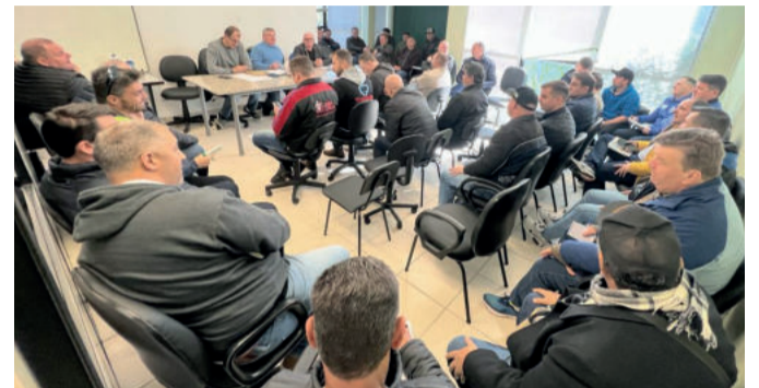
Clubes encaminharam mais de um dirigente para acompanhar e aprovar mudanças