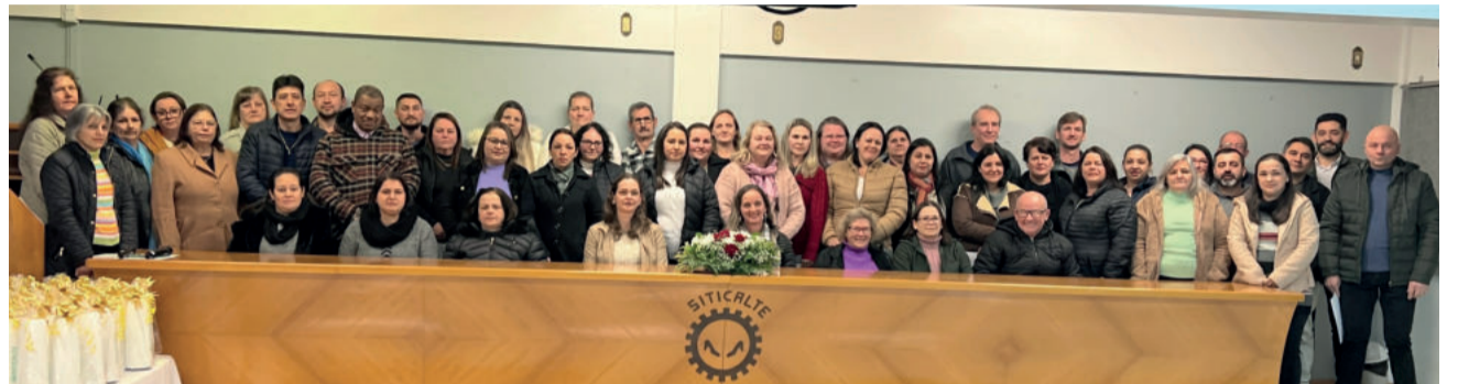
Associados com 20 anos ou mais de filiação foram homenageados