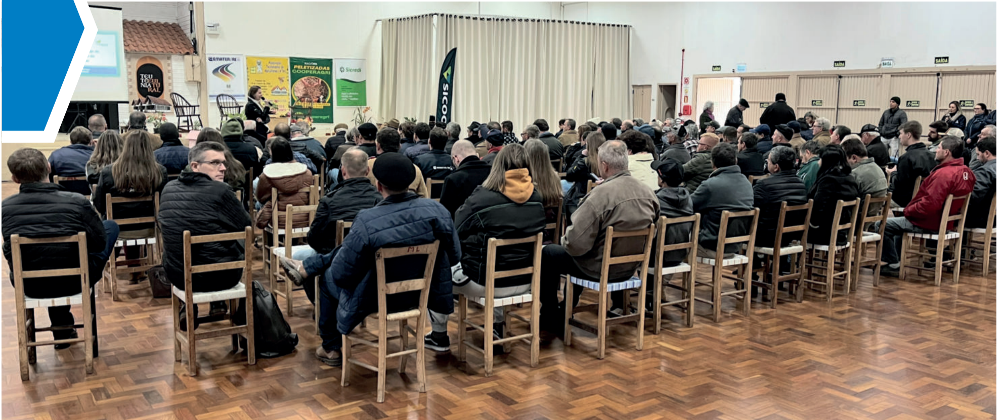
Cerca de 200 produtores participaram do Seminário Regional