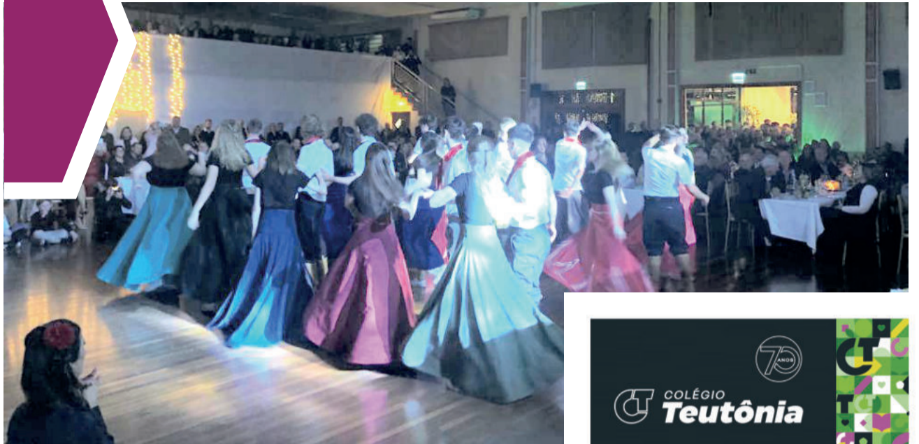
Estudantes, professores e funcionários representaram as regiões do Brasil por meio de coreografias de danças

Tudo começou a partir da postagem de uma reclamação referente à recusa na expedição de um alvará para uma festa. O delegado da cidade, que já havia respondido a uma ação criminal amplamente noticiada pela mídia, logo foi apontado como o responsável pela proibição e virou alvo de vários comentários. O réu aproveitou-se da situação para imputar ao policial um suposto desvio de verbas, fato nunca comprovado. Agora ele terá que pagar indenização ao delegado, em valor de R$ 5 mil, conforme decisão do Juizado Especial Cível e Criminal e de Violência Doméstica e Familiar contra a Mulher da comarca de Balneário Piçarras-SC. Cabe recurso.