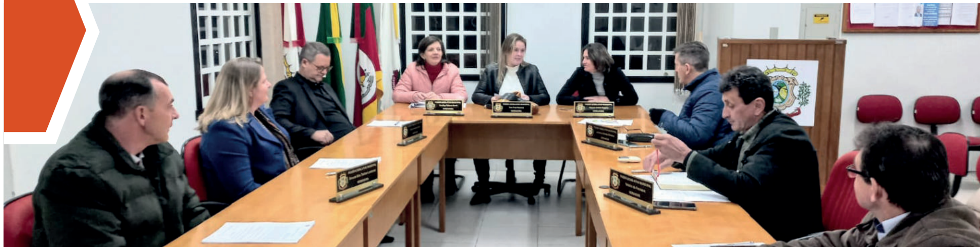
Vereadores se reuniram nesta segunda-feira (17/7)