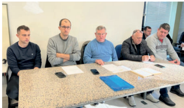
Diretoria da Aslivata decidiu implantar cadastro digital dos atletas

A maioria dos clubes optou por 4 chaves com 4 clubes. Os três melhores de cada chave avançam para a segunda fase. Os 12 clubes formarão um ranking (1º ao 12º) e se cruzarão – passam os 6 melhores. A partir daí serão três cruzamentos que apurarão três semifinalistas (vencedores) – só nesta fase o melhor perdedor avança junto para a semifinal, no entanto ficará como o quarto colocado, perdendo eventuais vantagens de campanha.