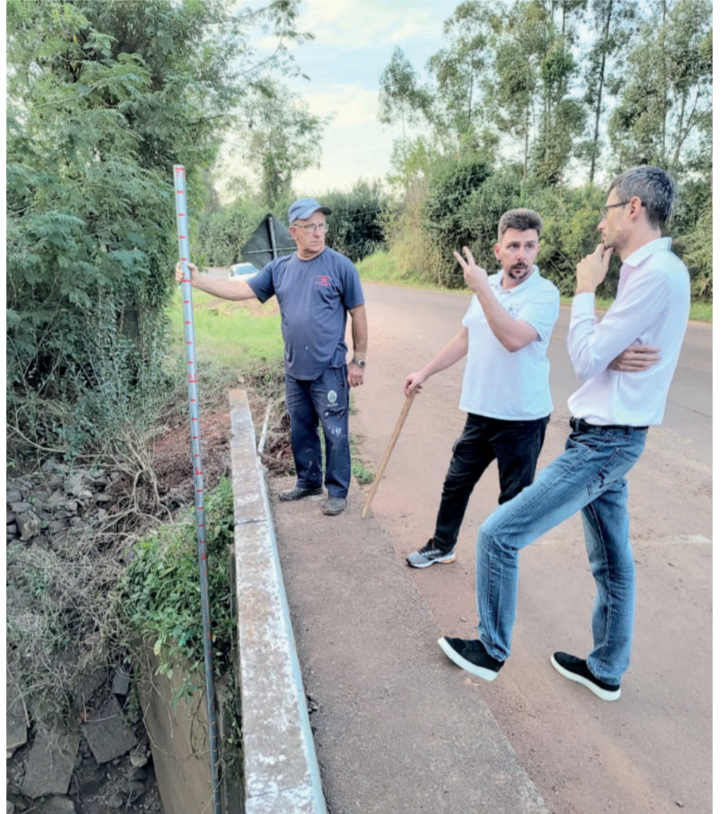
Teutônia instalou uma régua na ponte sobre o Arroio Posses dia 6 de julho