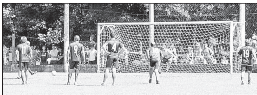
Pelé cobrou pênalti e abriu o marcador