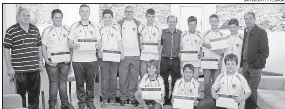
Entrega de certificados para alunos da Escolinha de Bocha

Receberam certificado nesta edição 12 alunos.