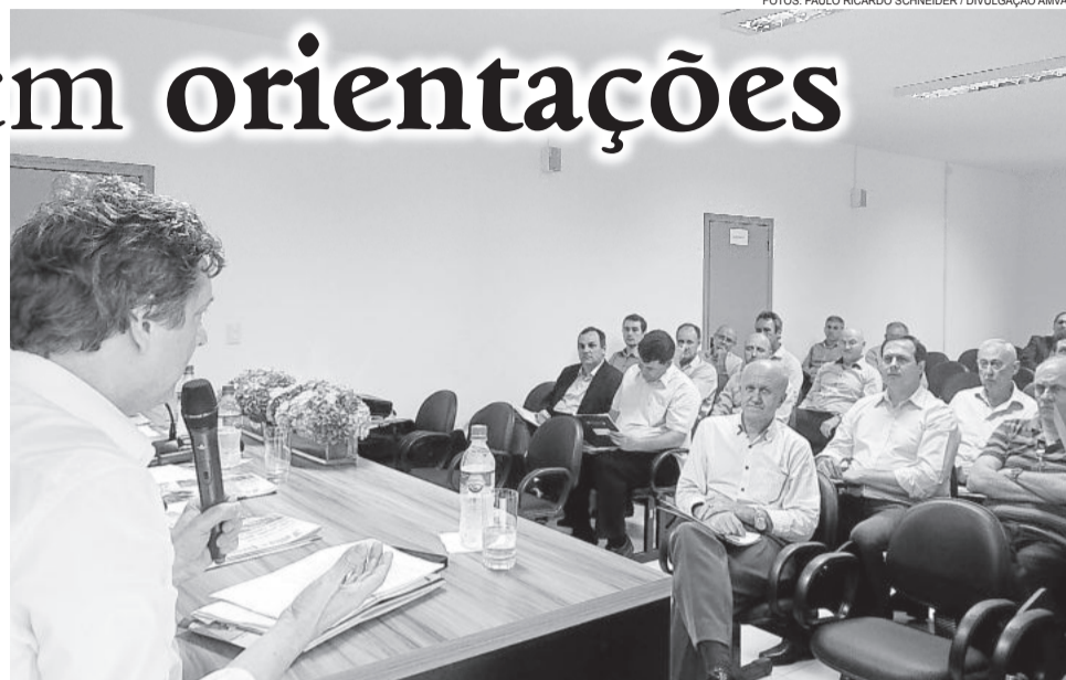
Prefeitos estiveram reunidos em Progresso no último dia 27

pagamento- que segundo ele é a maior unidade de custeio das prefeituras - programas vinculados com o governo, revisão anual dos funcionários, empenho de obras previstas, entre outros.