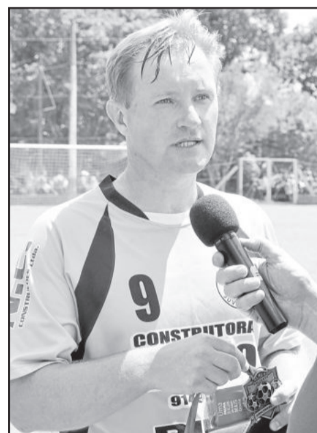
Pelé fez 4 gols na final e foi decisivo para o Juventude

poder participar deste grupo vencedor que foi montado pelo Juventude por dois anos seguidos. Como no ano passado deixamos o título escapar em casa, esse ano o grupo se mobilizou, durante todo o campeonato procurou a melhor formação e chegou na fase quente com equipe bem entrosada. Dentro do vestiário, todo mundo conversando, todos participando e se esforçando. Por isso, a equipe chegou na final e conseguiu uma vitória muito boa dentro de casa", salientou.