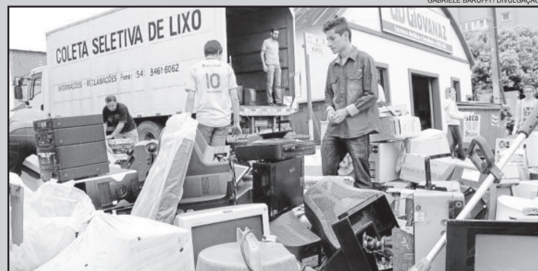
9,2 toneladas de equipamentos eletrônicos foram coletados

A Secretaria agradece e parabeniza a população garibaldense que se mobilizou para descartar corretamente seus resíduos, contribuindo para a proteção e preservação ambiental. E ainda, solicita às empresas, comércio e prestadores de serviços que colaborem destinando seus resíduos diretamente às empresas habilitadas e licenciadas. À população, que devolva no local de compra as pilhas, baterias, pneus e lâmpadas fluorescentes usados, conforme estabelece a legislação.