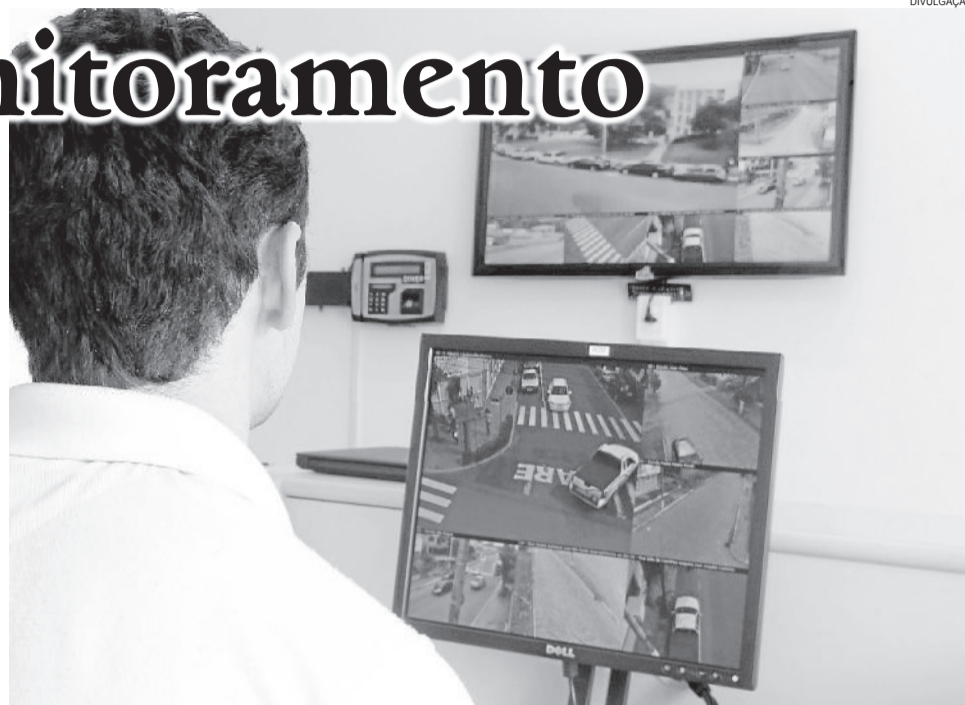
O acompanhamento das imagens será feito por cinco servidores nomeados

Já os locais onde existem câmeras instaladas e em funcionamento são: Rua Fioravante Baldasso, cruzamento com a Rua Buarque de Macedo; Rua Vereador Ubaldo Baldasso, em frente à ACI; Rua Buarque de Macedo, cruzamento com a Rua 21 de Abril; BR 470, próximo ao trevo de acesso à cidade; Rua Maurício Cardoso, cruzamento com a Rua Rio Branco; Rua Borges de Medeiros, cruzamento com a Rua 15 de Novembro; Rua Buarque de Macedo, na Rótula da Santa Clara;