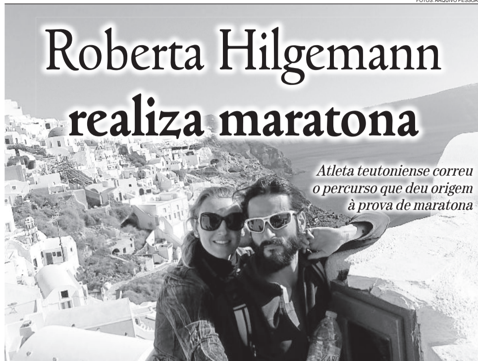
O casal aproveitou para apreciar a paisagem da Grécia

Atleta teutoniense correu o percurso que deu origem à prova de maratona