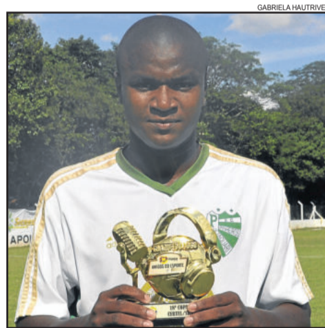
Darling, do Pinheiros, foi o craque da partida nos Aspirantes