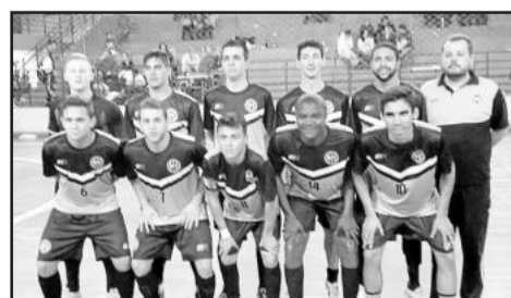
Danados - Força Livre