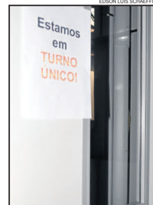
Algumas prefeituras já tem adotado o turno único

> Roca Sales: Adotou o turno único desde o dia 8 de julho, nas secretarias de Agricultura, de Serviços Urbanos e Trânsito e de Obras, das 7h às 13h. Somente trabalham