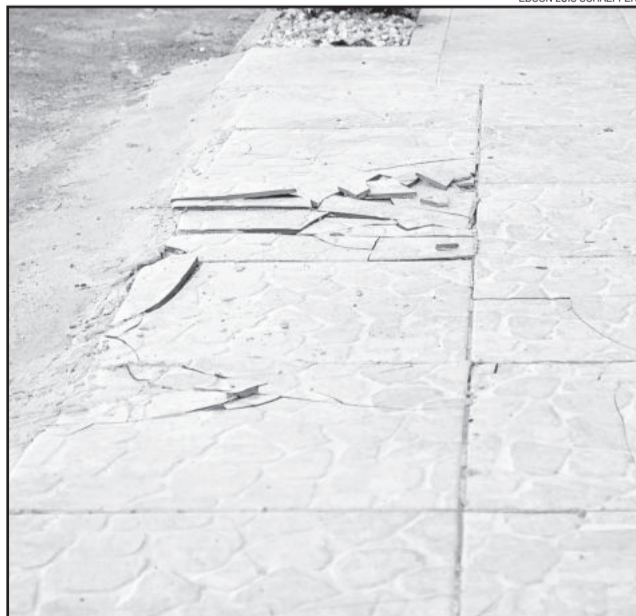
Vários pisos foram quebrados