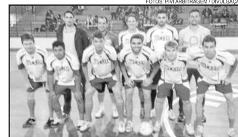
Terraplenagem Teutônia - Força Livre