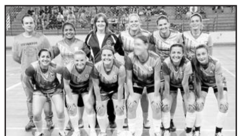
Malaguetas - Feminino