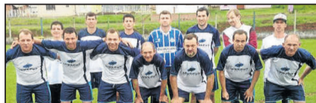
Arroio Alegrense de Forquethinha