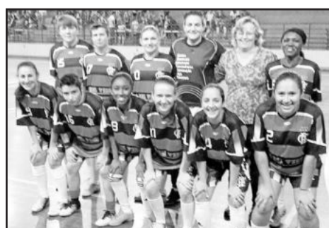
Flamengo - Feminino