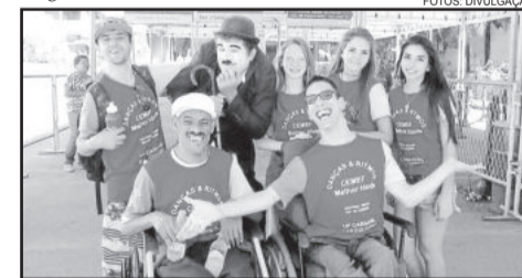
Vantuir, Jones, Jhonattan, Tamires, Francieli, Mayara com o ator C.Chaplin

Estou muito feliz com essa turma, que é alegre, divertida, guerreira e artista. Continue assim e... vamos voar mais longe?