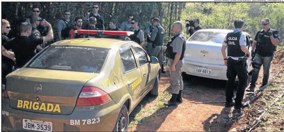
Assalto a duas agências bancárias trouxe apreensão à comunidade imigrantense