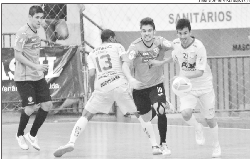
Zico escapa da marcação dos jogadores da Assoeva

A vitória deixou a ACBF na liderança isolada do Estadual com 49 pontos. O próximo jogo será em casa, na terça-feira, 1º, contra o Cachoeira.