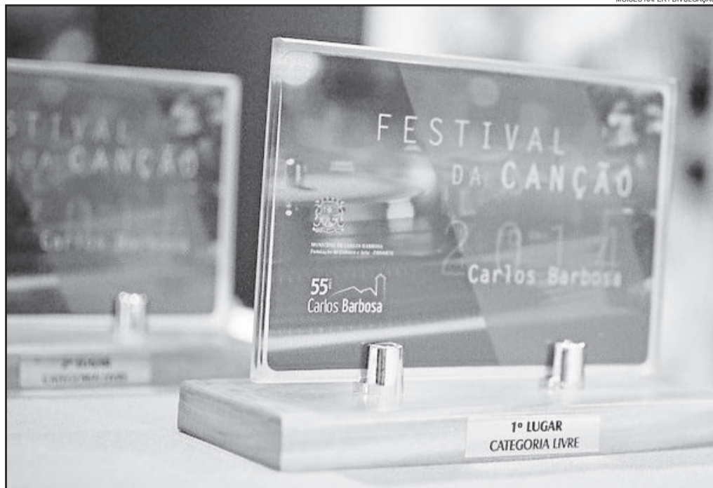
Serão premiados os três primeiros colocados em cada categoria