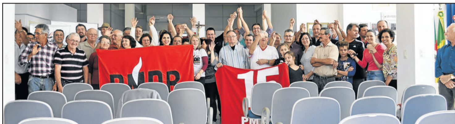
Convenção reuniu membros do partido na Câmara de Vereadores de Teutônia

No sábado, o PMDB realizou suas convenções simultaneamente em todo o Estado. Foram eleitos os diretórios municipais, os delegados à Convenção Estadual, as executivas municipais e os conselhos de ética e fiscal.