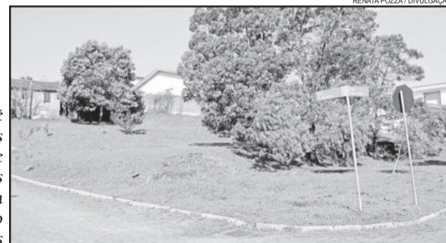
Lote 6 é um dos sete disponíveis na alienação de bens