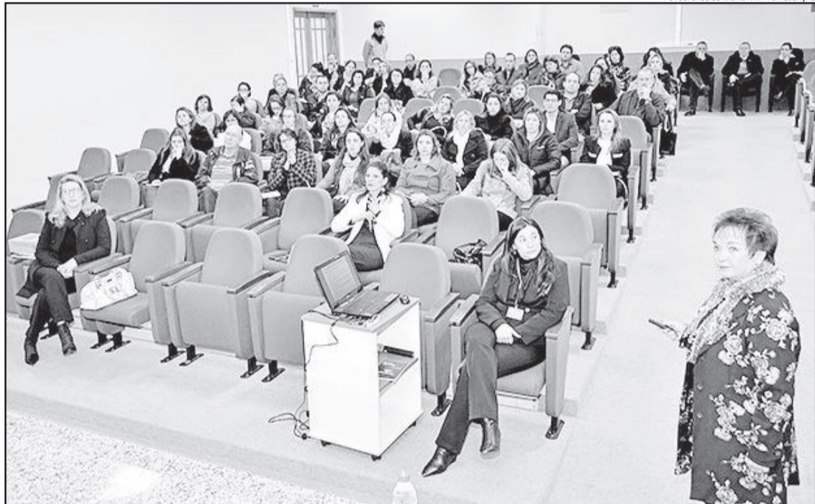
Empresários tiraram suas dúvidas no encontro

A entidade segue trabalhando firme para viabilizar os cursos e fazer com que as empresas consigam se adequar à legislação. Depois de vários de-