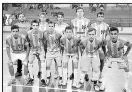
UPAL - Sub-20