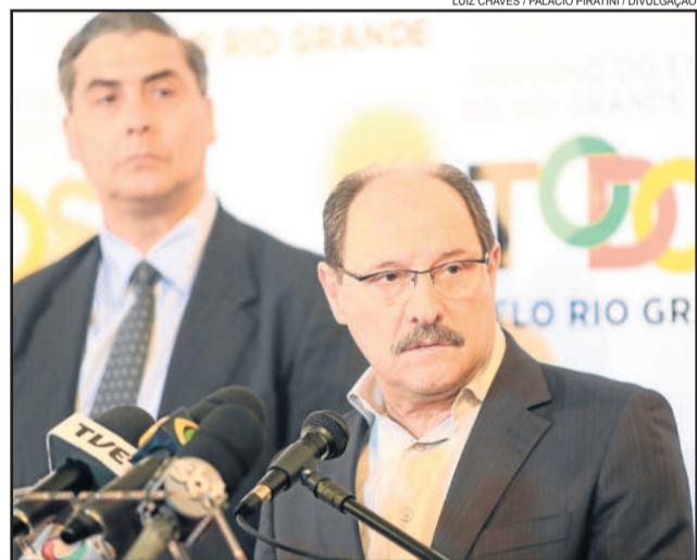
Anúncio oficial do parcelamento foi feito na manhã desta segunda-feira pelo governador José Ivo Sartori