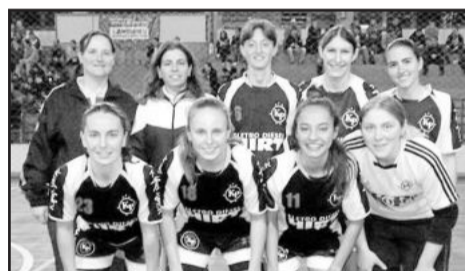
Eletro Diesel Hirt - Ki Poder - Feminino