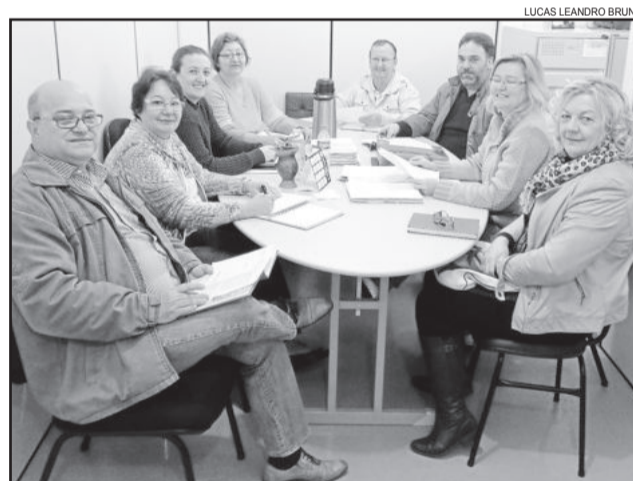
Comissão eleitoral organiza detalhes do pleito para escolha dos conselheiros tutelares

b) representar junto à autoridade judicial nos casos de descumprimento injustificado de suas deliberações.