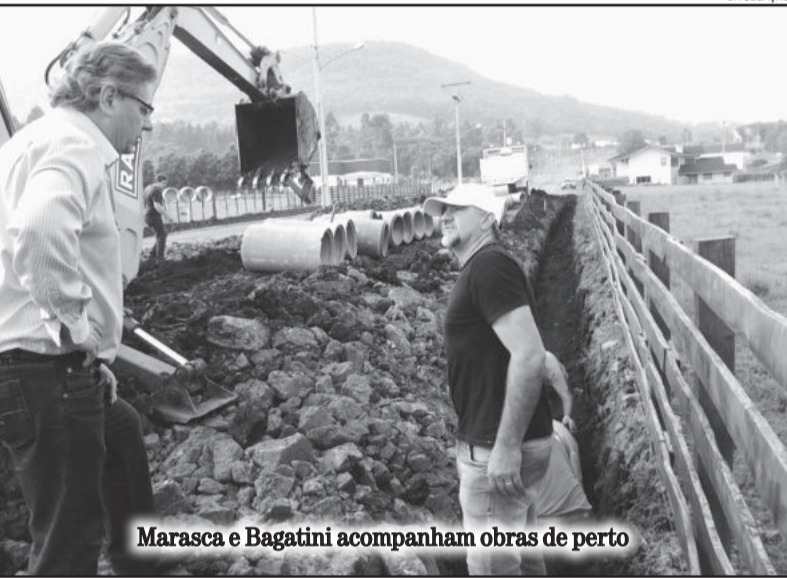
Marasca e Bagatini acompanham obras de perto

ria Ltda. Valor: R$ 283.500,00 Ministério das Cidades/ Caixa Repasse Ministério: R$ 245.850,00