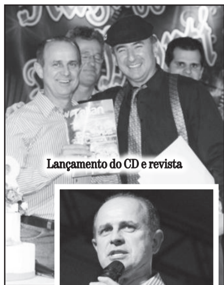
Lançamento do CD e revista