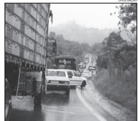
Cresce movimentação popular em favor de melhorias nas estradas da Serra Gaúcha