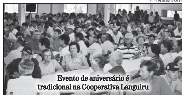
Evento de aniversário é tradicional na Cooperativa Languiru

do Sul e nos Supermercados Languiru de Poço das Antas e de Bom Retiro do Sul. Importante lembrar que no dia do evento não haverá venda de cartões.