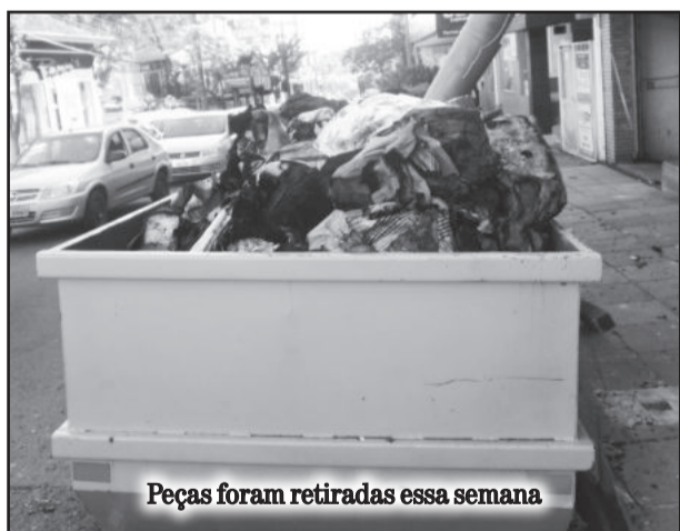
Peças foram retiradas essa semana

Catadores aproveitaram para pegar as peças, que ficam em um tele-entulho na Rua João Batista de Mello. Eles argumentam que algumas podem ser aproveitadas após serem lavadas. Os itens foram encaminhados ao Aterro Sanitário, no Bairro Conventos.