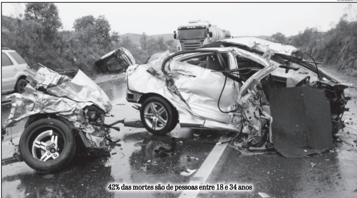
42% das mortes são de pessoas entre 18 e 34 anos

Um estudo divulgado nesta semana pelo Detran RS apontou que de 2007 a 2012, 558 pessoas morreram vítimas de acidentes de trânsito no Vale do Taquari. Lajeado é o município que ocupa a primeira posição no ranking, com 128 mortes. Estrela é a segunda colocada, com 58, e Teutônia é a terceira, com 50 vítimas fatais em seis anos. O estudo revelou ainda que 80% das vítimas eram do sexo masculino e 20% do sexo feminino.