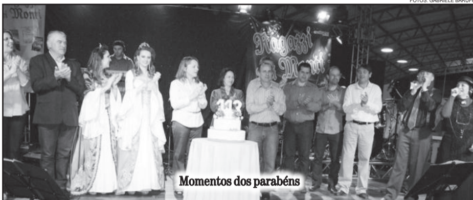
Momentos dos parabéns

Parabéns aos filhos desta terra! Parabéns Garibaldi! Uma cidade cheia de motivos para nos orgulhar. Garibaldi, 113 anos, Orgulho de Viver Aqui!