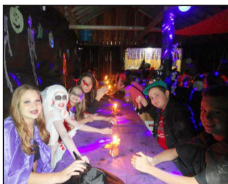
Muitas pessoas da região foram surpreendidas pela pergunta, dirigida por crianças: doces ou travessuras?