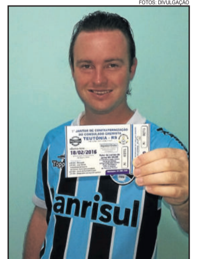
Käfer destaca que os cartões de janta já estão à disposição com os cônsules adjuntos e em pontos de venda em Teutônia.