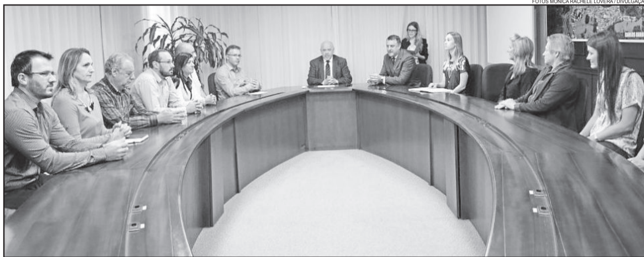
Ato de transmissão ocorreu com a presença de secretários, vereadores e servidores municipais