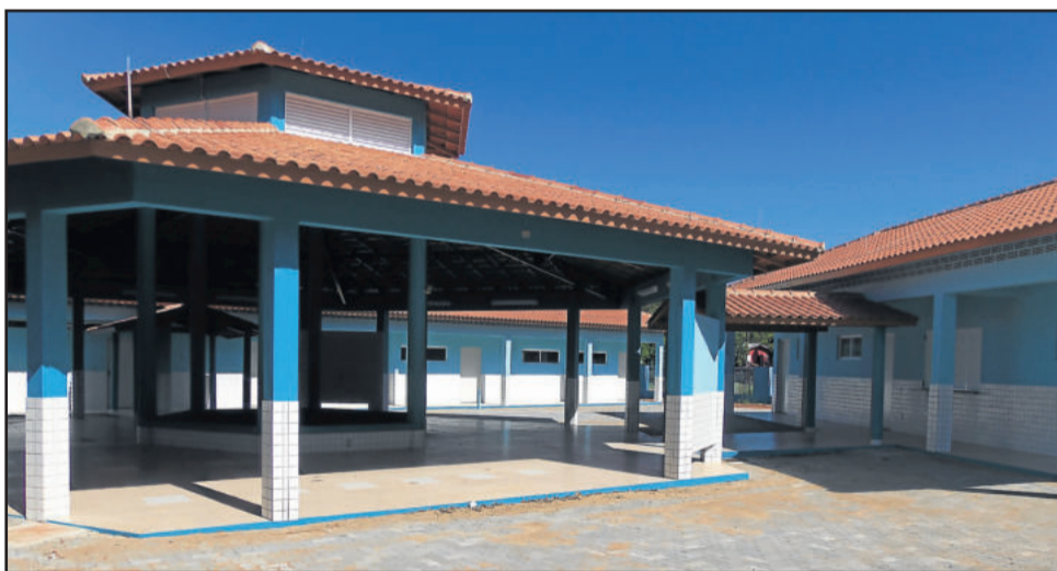
Escola da Fazenda São José