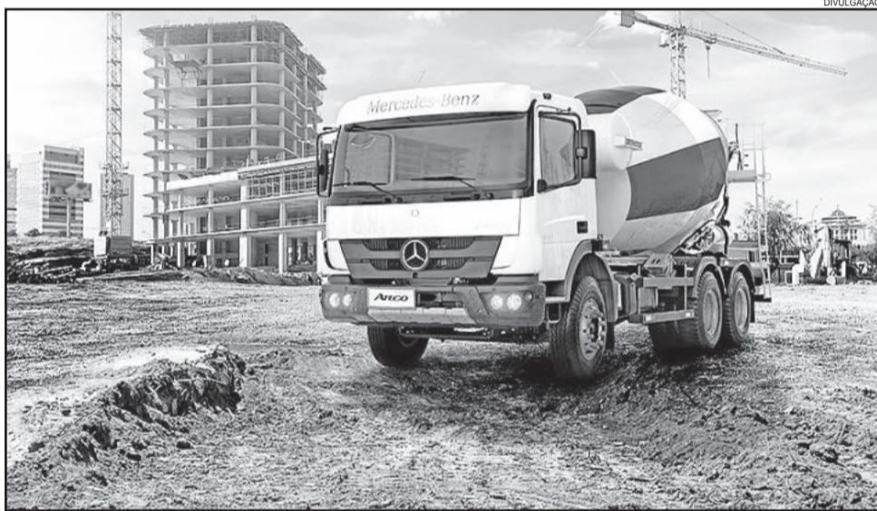
Atego 2730 6x4

Segundo o diretor, o objetivo é aumentar o padrão de robustez do Atego e aprimorar sua plataforma para facilitar e otimizar ainda mais o trabalho e o tempo de implementação. "Sem abrir mão do elevado padrão de conforto e praticidade de sua cabina, mantendo também os elementos de sua avançada tecnologia, qualidade, segurança, excelente desempenho e reduzido custo operacional. Ou seja, agregamos mais valor ao Atego, ampliando as vantagens e benefícios para os clientes", destaca Weiland.