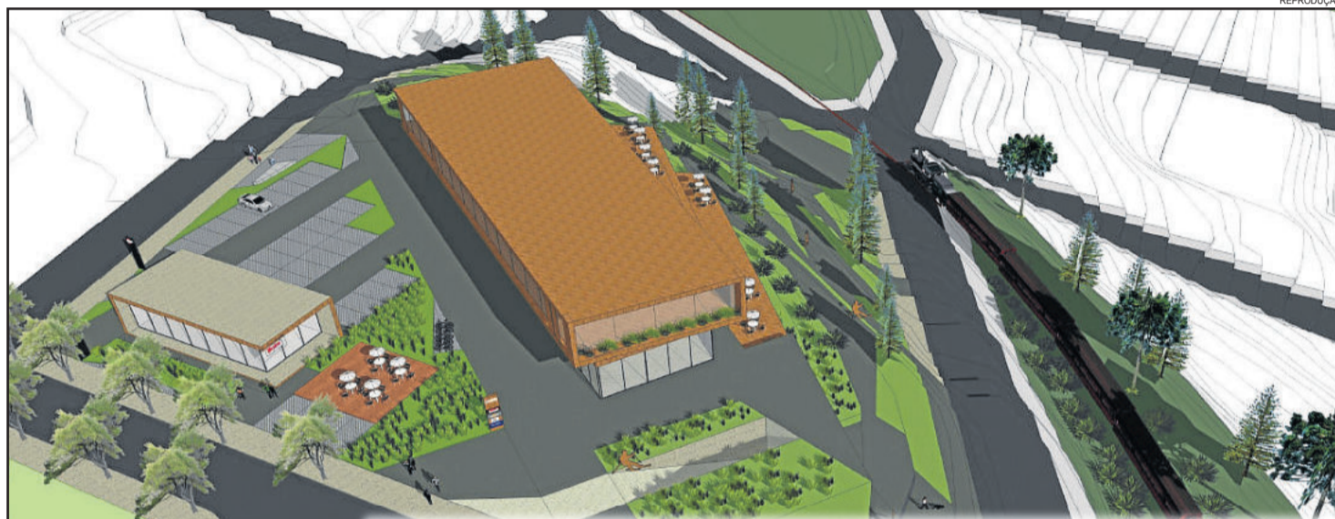
Perspectiva da Área Comercial e Praça do Esqui

O licenciamento ambiental constitui a primeira etapa de análise para a viabilidade do empreendimento no local. A partir do licenciamento o projeto deverá ser encaminhado para aprovação urbanística, atestado de viabilidade junto a CORSAN para os sistemas de abastecimento de água e esgotamento sanitário, e demais documentos exigidos pela lei.