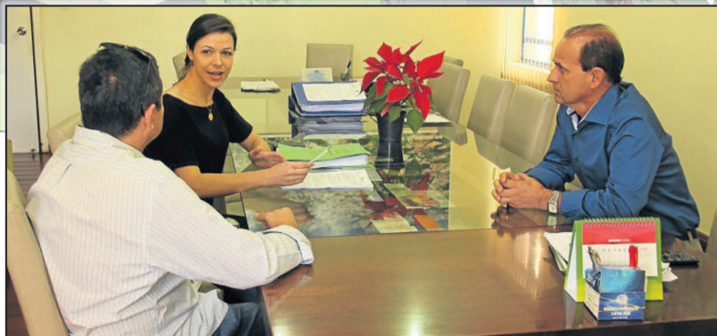
Licença ambiental de instalação do Loteamento Residencial Parque do Esqui foi entregue pela Administração Municipal