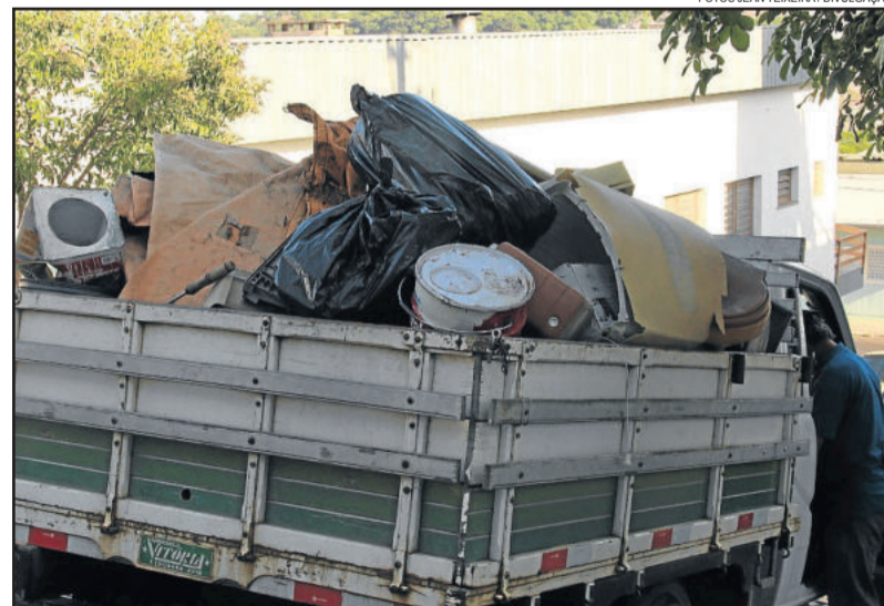
Durante a ação, foram recolhidos quatro caminhões de resíduos com diversos materiais em desuso (foto acima). Além disso, 300 pneus também foram coletados (foto ao lado), visando evitar a proliferação do mosquito Aedes Aegypti