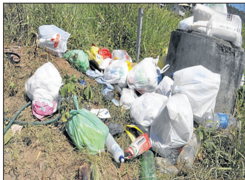
Diversos tipos de lixo ficam espalhados às margens da Estrada Velha