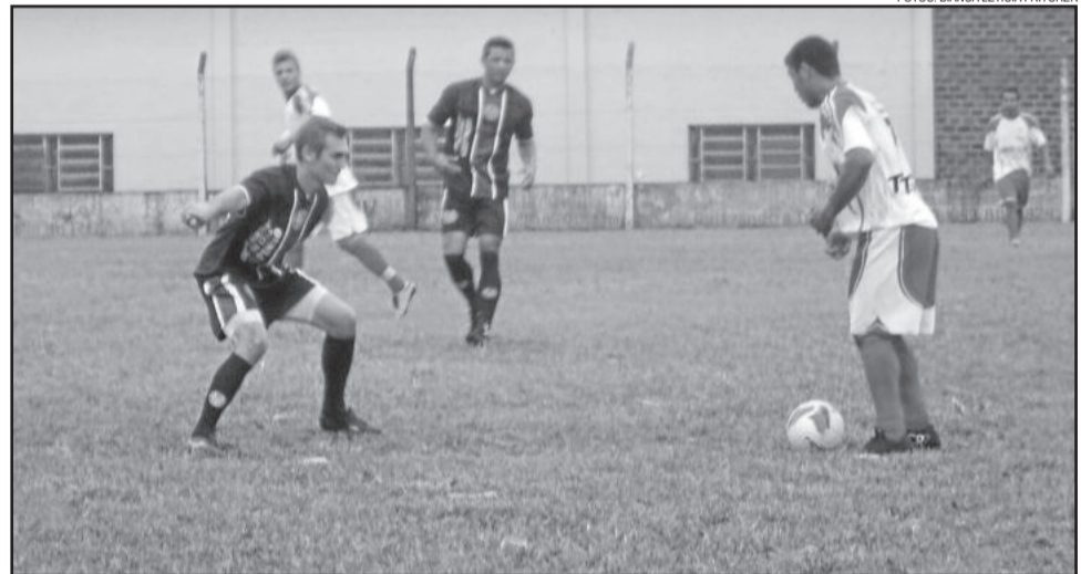
União da Germano de Dari (com a bola) empatou diante do Alto Taquari