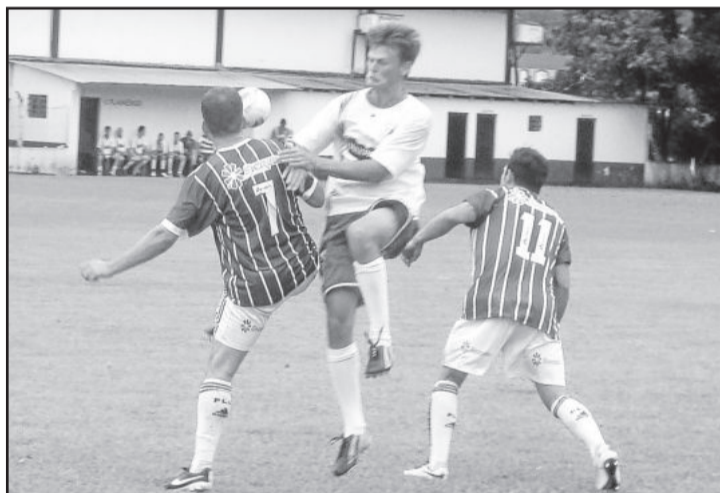
Apesar da chuva, campo ofereceu boas condições de jogo