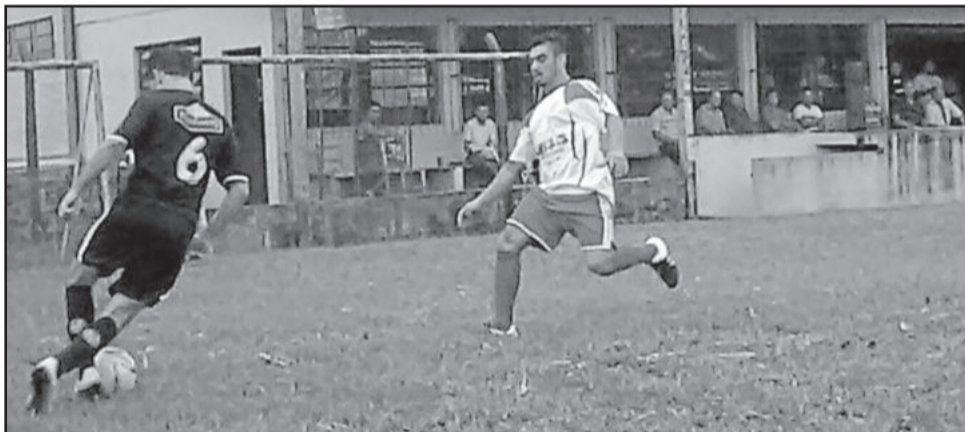
Alto Taquari saiu na frente, mas não conseguiu segurar o empate

jogadas individuais melhorou na partida, porém sem alterar o placar. Partida finalizada em 1x1, com muitas reclamações de ambas as equipes, que tiveram um jogador expulso cada, além de uma chuva de cartões amarelos.