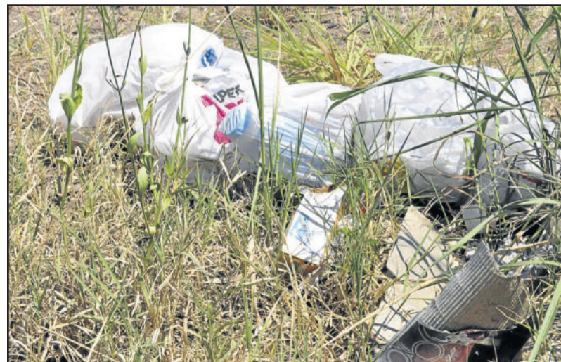
Em alguns locais não há lixeira e os sacos são colocados no chão