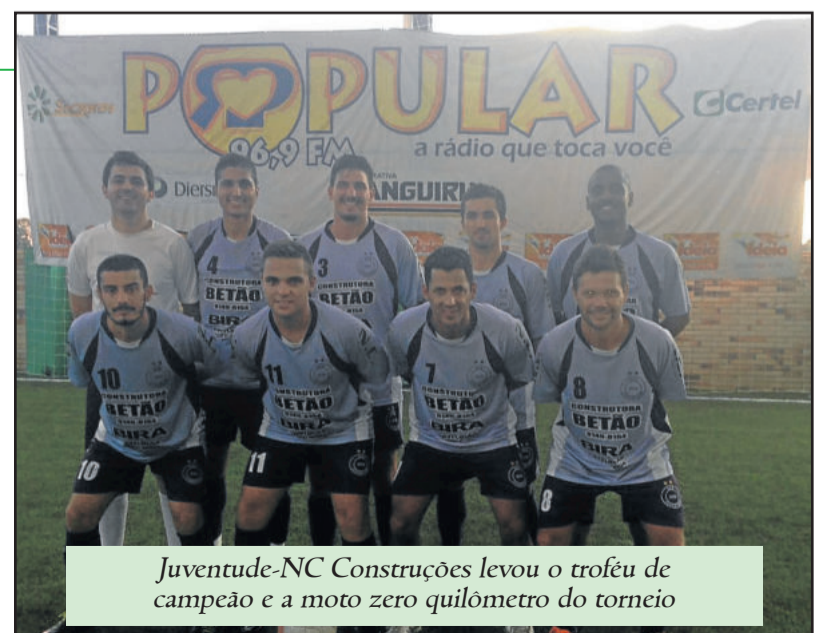
Juventude-NC Construções levou o troféu de campeão e a moto zero quilômetro do torneio