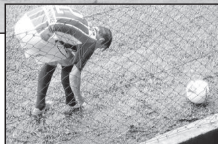
Água ficou restrita às margens do gramado

"ameaçada". O gol de desconto para 5x4 "ateou fogo" no jogo, que terminou aos 48 minutos.