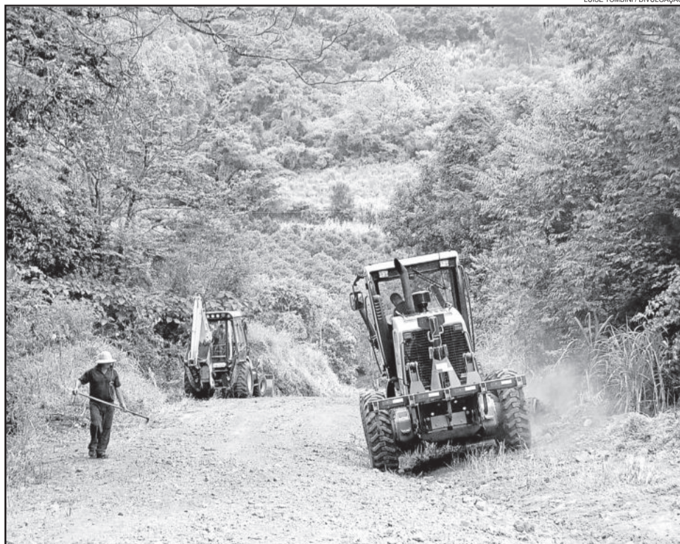
Estradas como a Harmonia Alta foram recuperadas