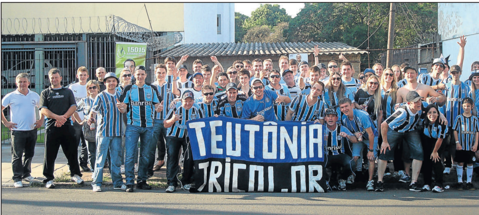
Consulado Gremista vai organizar partida e jantar na Associação da Languiru

te momento. Teremos a presença de ídolos que, posso garantir, ninguém imagina que vamos trazer. Mas o objetivo maior é reunir torcedores daqui e de outras regiões com o intuito de confraternizar e celebrar essa paixão traduzida pelo manto azul, preto e branco", garante. Käfer lembra que as jantas são limitadas e pede para que os torcedores se agilizem na procura por cartões. "Todos os gremistas poderão acompanhar a partida e os shows sem pagar ingresso, no entanto, para servir bem, vamos limitar o número de jantas. O torcedor que jantar estará concorrendo a uma camiseta oficial autografada pelo Roger Machado", salienta.