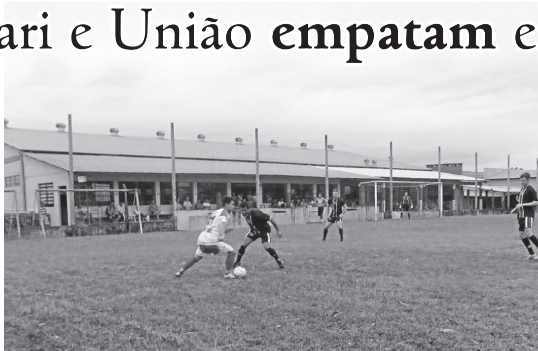
Mesmo com tempo chuvoso, partida ocorreu na Linha São Jacó