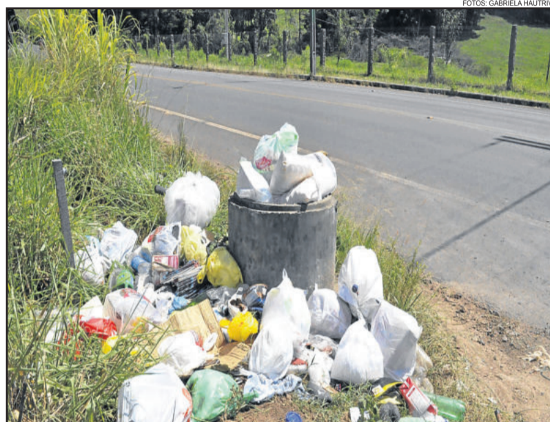
O lixo está jogado na beira da estrada, entre os bairros Languiru e Canabarro

A melhor e mais barata forma de acabar com o problema, segundo Rückert é que haja parceria entre a população e o sistema de coleta. “Precisamos de munícipes colaborando na colocação do lixo em embalagens adequadas no dia correto e a empresa de coleta prestando o serviço de maneira correta e limpa”, sustenta. O subsecretário diz que muitas vezes é difícil equilibrar a equação, mas os responsáveis pelo setor de meio ambiente estão sempre cobrando melhorias e tentando solucionar os problemas que surgem.