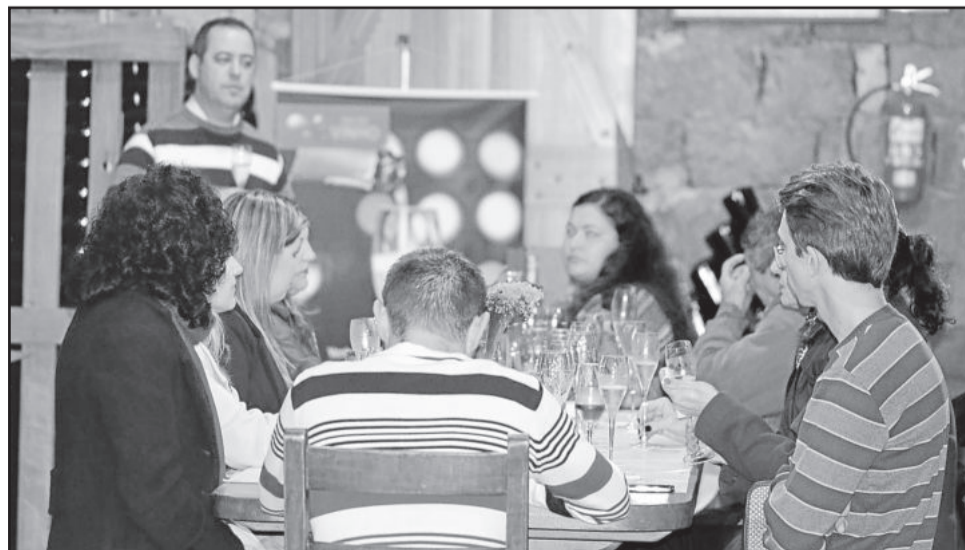
Momentos de aprendizado e de difusão do conhecimento cultural