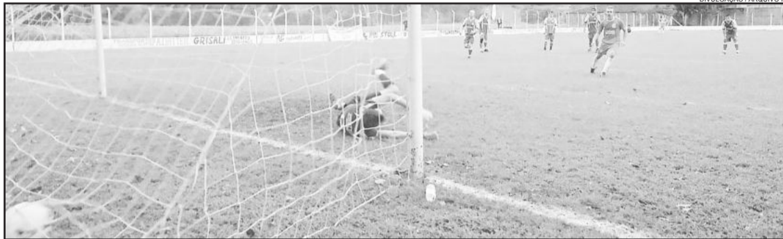
Jogo da volta será no campo do União em Tamanduá