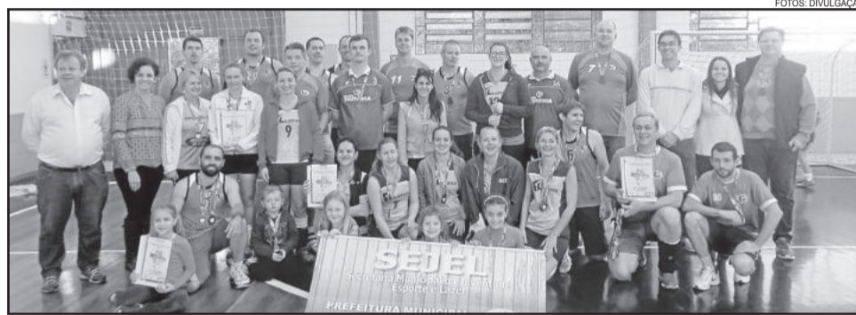
Campeões do 3º Citadino de Vôlei confraternizaram juntos

A competição foi organizada pela Associação dos Clubes Amadores de Teutônia (ACAT), com apoio da Administração Municipal de Teutônia, através da Secretaria