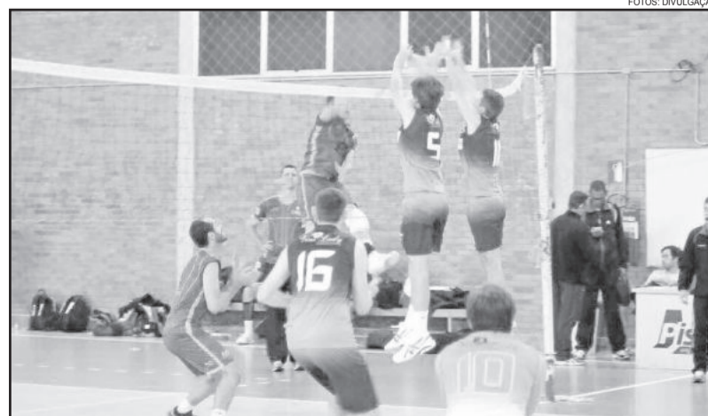
A segunda etapa do circuito será realizado em Santa Cruz