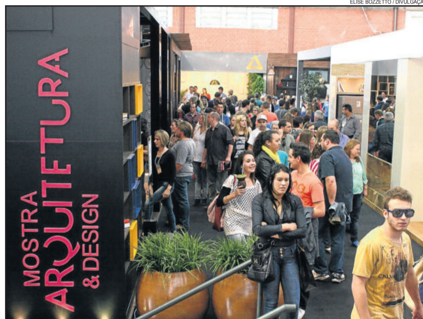
Mostra Arquitetura & Design já tem nove espaços vendidos