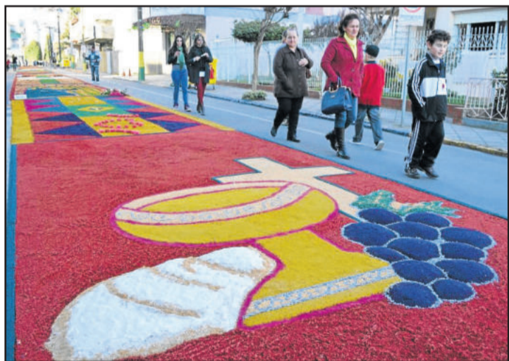
Procissão será a partir da Igreja Matriz, logo após a missa de Corpus Christi