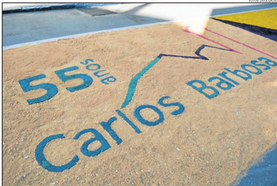
Tradicional procissão será realizada nesta quinta-feira, dia 4