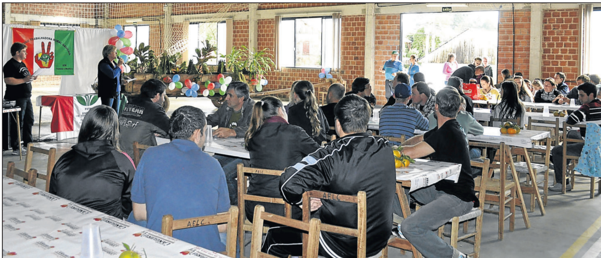
Encontro reuniu jovens rurais de Teutônia e Westfália