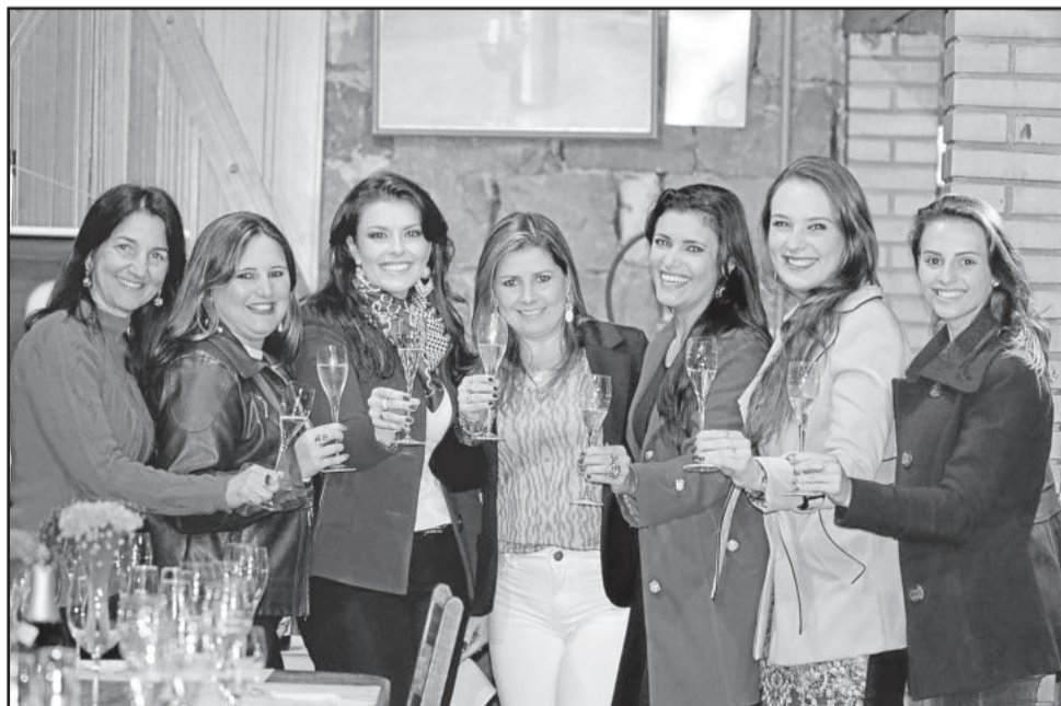
Degustação e brinde são marcas registradas na Confraria do Espumante

Todas as vinícolas locais serão contempladas com a iniciativa, que é aberta para homens e mulheres com mais de 18 anos.