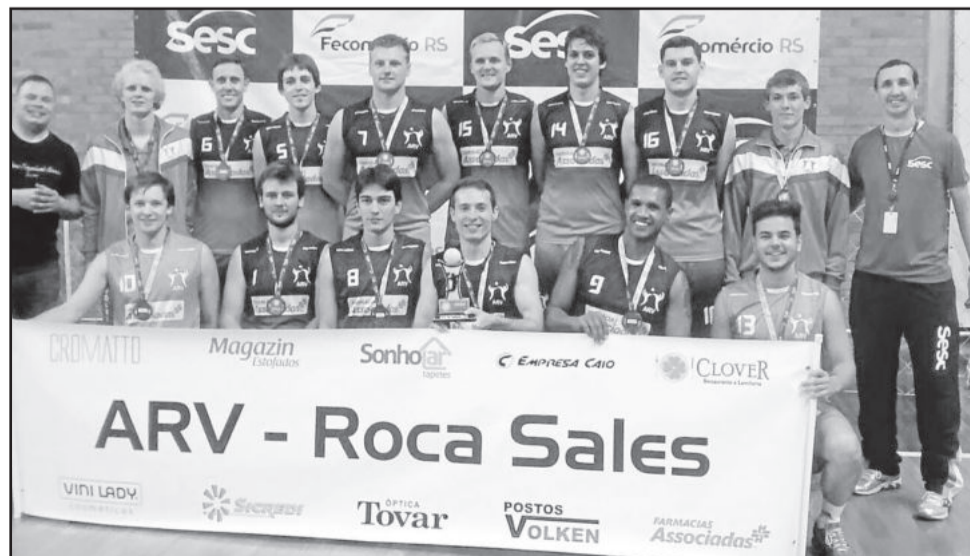
ARV/Roca Sales disputará domingo a terceira competição no ano

Essa iniciativa mostra mais uma vez o quanto a Associação Rocasalense de Voleibol, juntamente com o Sicredi, busca incentivar a prática do esporte, além de buscar maneiras de envolver a comunidade local em torno do esporte e do lazer.