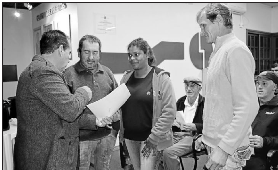
Moradores ficam contentes ao receber a escritura de seu imóvel

O município busca também a regularização dos imóveis na faixa de domínio da BR-386. Silva relembra o pedido já feito junto ao Dnit. “Encaminhamos pedido de doação das ruas laterais. Deve fazer meio ano que oficiamos o Dnit, tivemos reunião e solicitamos a doação dessas áreas. Para nossa surpresa negativa, o Dnit nos respondeu através de ofício, na semana passada dizendo que a justificativa não era suficiente para encaminhar a doação ao município”, relata. Segundo ele, a negação se dá pela necessidade de envolvimento do Congresso Nacional por envolver bem público. “Mas, essa semana o prefeito esteve conversando com o engenheiro do Dnit, e o município não vai desistir. Porque se houve omissão do Dnit e essas pessoas estão lá com seus prédios, nós temos que buscar uma solução para que eles tenham uma garantia jurídica”, conclui.