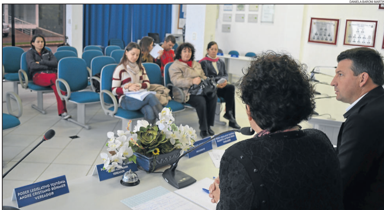
Audiência pública propõe melhor utilização dos espaços de lazer