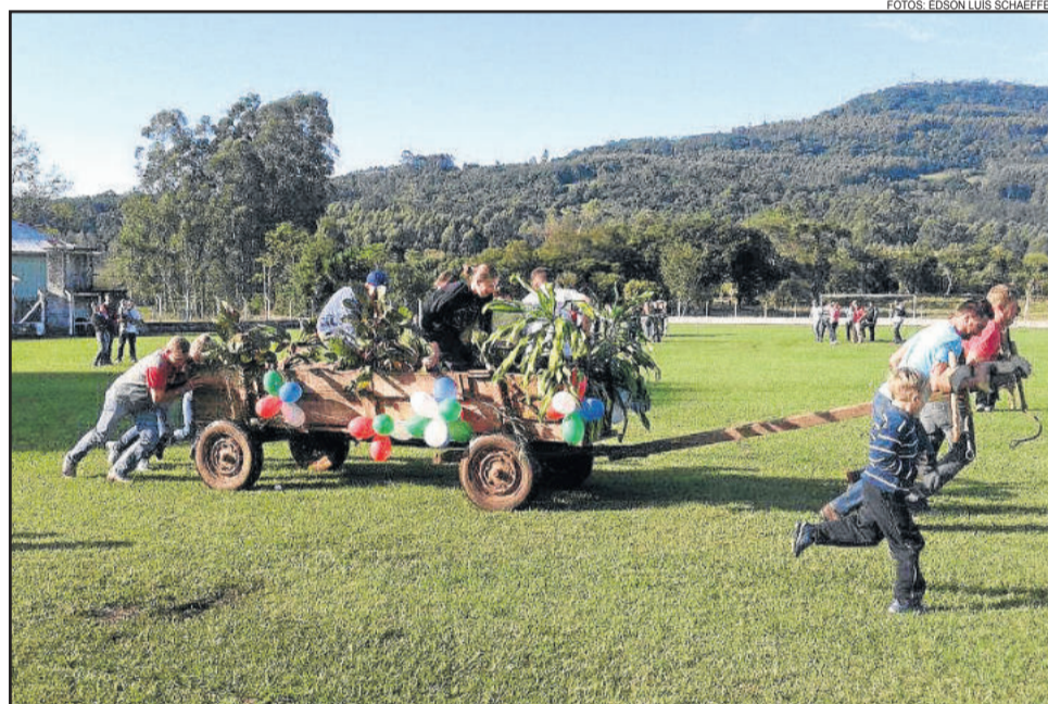
Jogos rurais, como a corrida de carroça, foram alguns dos atrativos do encontro