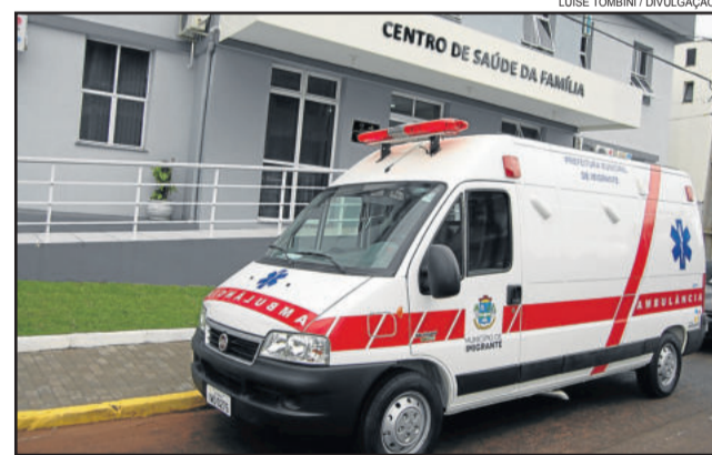
Ambulância foi adquirida por meio de pregão presencial

Além deste valor, foram investidos mais R$ 7.370,00 para acrescentar alguns itens que trarão maior agilidade e qualidade de atendimento aos pacientes.