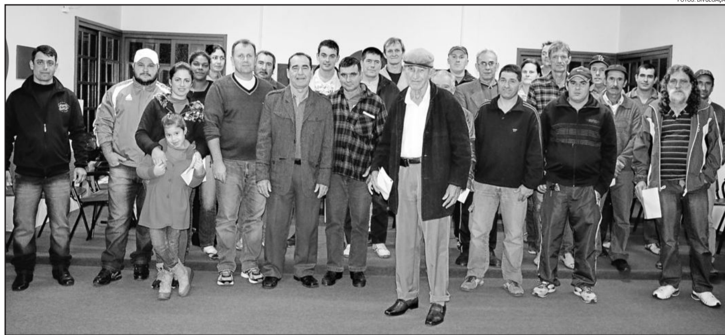
28 proprietários receberam escritura dos imóveis na sexta-feira

A meta da administração é ter, até o fim do mandato, 80% dos lotes encaminhados para regularização. “Não estarão todos com titulação, mas a parte de procedimentos que o município tem que fazer com certeza estará encaminhado para a Justiça, e lá tem o seu tempo”, afirma. O período para a regularização ser efetuada é de cerca de dois anos, de acordo com Silva. “A Justiça precisa ouvir testemunhas, tem o Ministério Público, tem que ser oficiado à Fazenda Pública Federal, Estadual e Municipal, para ver se