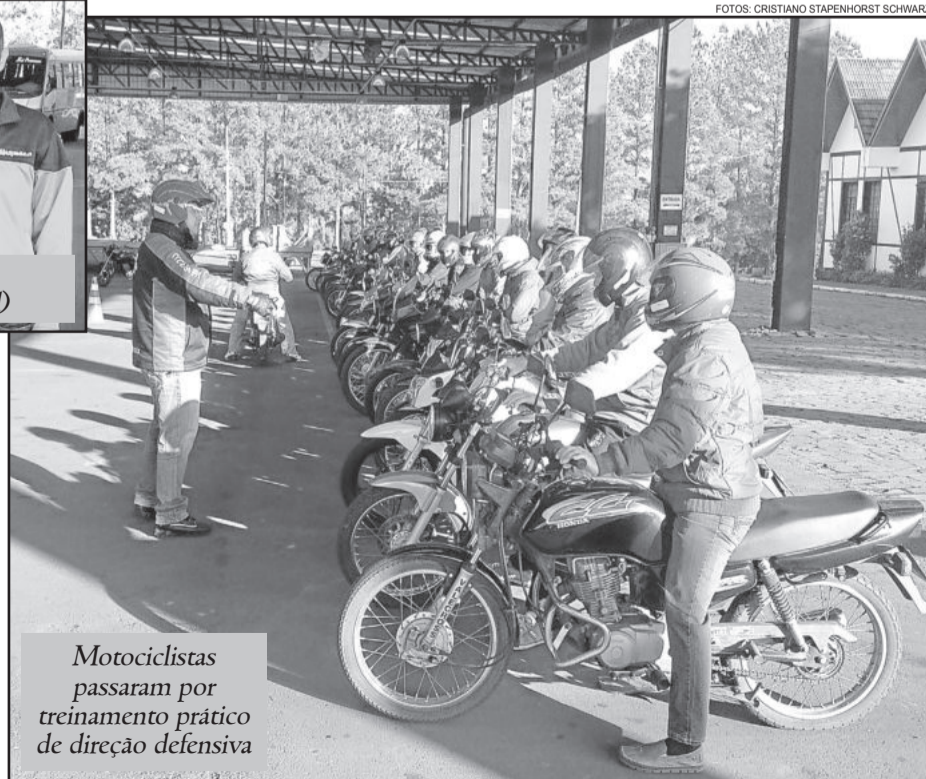
Motociclistas passaram por treinamento prático de direção defensiva

Ao final do treinamento os participantes receberam certificados.