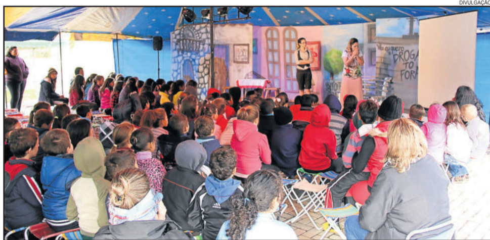
Teatro apresentado para um público de cerca de 150 pessoas buscou conscientizar sobre violência e abuso

A peça foi apresentada pela manhã e à tarde, para os usuários dos serviços do Cras, Creas e Slan. O evento é alusivo ao Dia Nacional do Combate ao Abuso e Exploração Sexual de Crianças e Adolescentes, que aconteceu no dia 18 de maio.