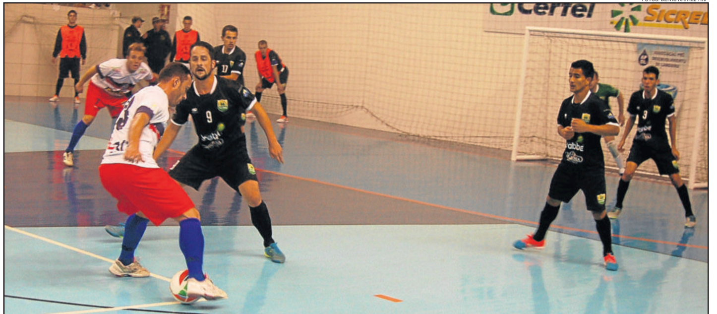
Marcação da Teutônia Futsal funcionou e a equipe não foi muito ameaçada no jogo de sábado

A etapa final foi menos atraente. O torcedor esperava mais gols, mas a equipe da casa diminuiu o ritmo e o adversário se encolheu. Com o jogo mais truncado e gol não saindo, o torcedor começou a ficar impaciente. Alguns reclamavam. Outros preferiram o silêncio. Somente aos 16min15seg, Éverton voltou a marcar para a ASTF, depois de uma jogada pelo