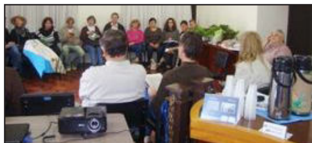
Reunião da Articulação de Agroecologia do Vale do Taquari

Finalizando a reunião realizada em Colinas, os produtores agroecológicos do Município ofereceram uma degustação de seus produtos produzidos em Colinas.