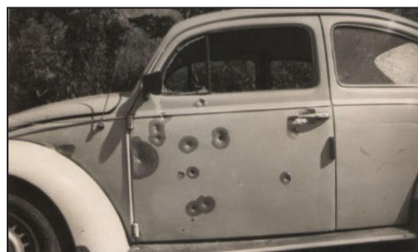
Fusca guerreiro: com ele, Lismar e a família foram a Planalto, onde a violência era uma constante na década de 80