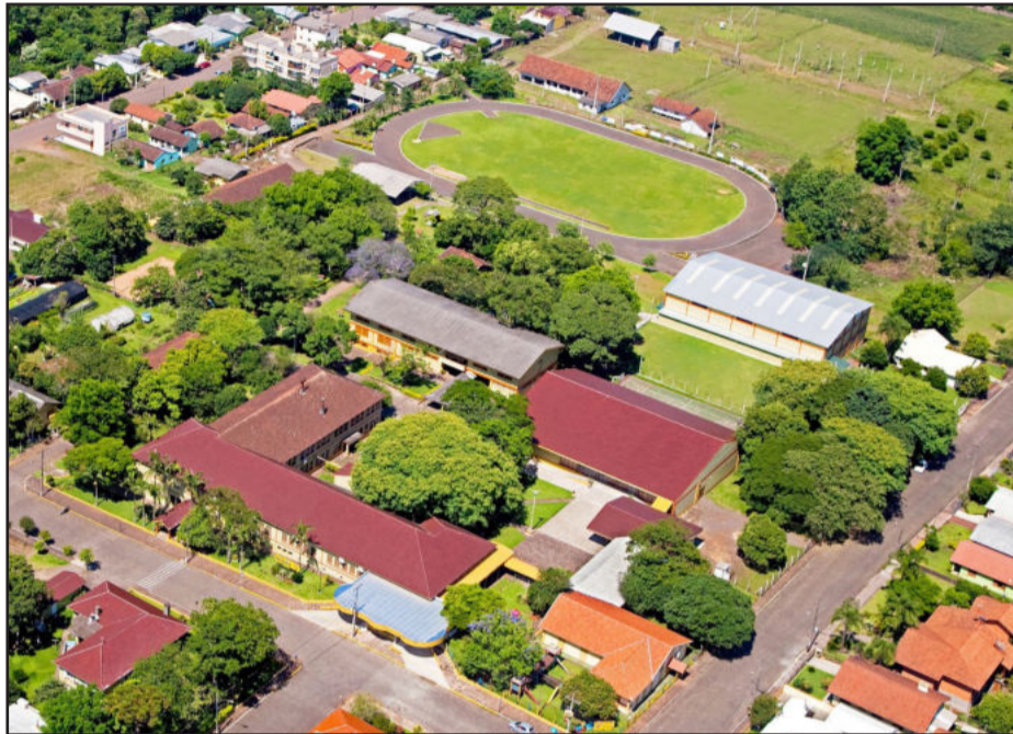
Depoimentos mostram o crescimento do Colégio Teutônia ao longo de seus 59 anos

Material será mostrado no 5º Fórum Tecnológico do Leite, dias 21 e 22 de setembro, com o tema "Tecnologias e conforto animal para a produção de leite"