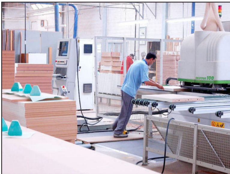
Vários setores da economia, como a indústria, ajudaram índices de Garibaldi