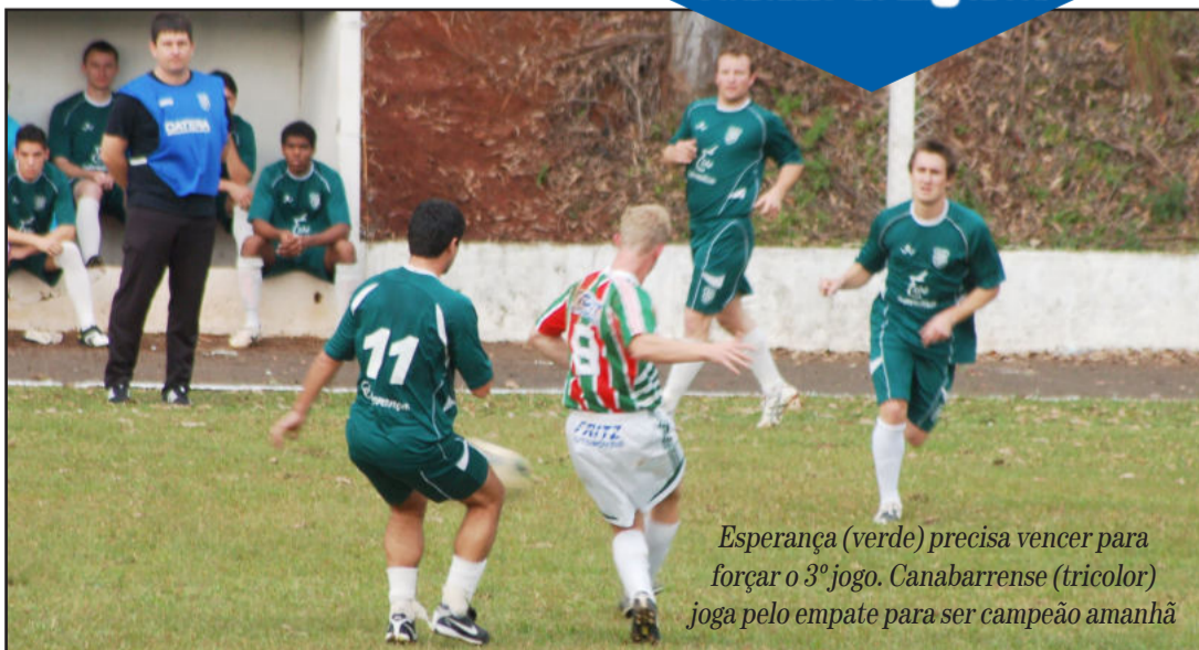
Esperança (verde) precisa vencer para forçar o 3º jogo. Canabarense (tricolor) joga pelo empate para ser campeão amanhã

Funcionários dos Correios foram flagrados pelo gerente e Brigada Militar na hora que iriam destruir 14 mil cartas. Material foi recuperado (abaixo). Páginas 2 e 3