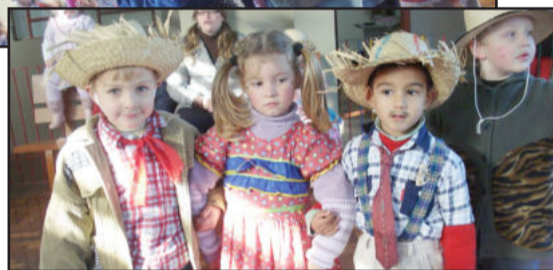
Arraiá da Creche Azaléia reuniu professores, coordenadores, direção e alunos