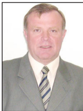
Prefeito de Imigrante, Paulo Gilberto Altmann

O prefeito Paulo Gilberto Altmann ficou muito feliz com a classificação de Imigrante em 22º lugar na distribuição de renda no Estado. "É mais uma prova do crescimento e desenvolvimento de Imigrante. Para o Município isso é excelente, pois quem faz o Município são as pessoas que vivem no mesmo. Quem gera a riqueza são essas pessoas. Culturalmente, Imigrante já é um Município de pessoas trabalhadoras, ordeiras e que querem crescer e, por consequência, geram o crescimento também do Município. É um índice que prova os resultados positivos de todo trabalho", destacou. Imigrante ficou em 22º lugar, com 90,38% da população figurando nas classes A, B e C.