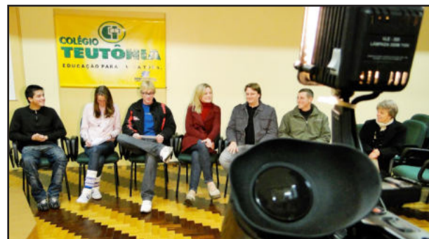
Gravação do documentário esteve dividida em quatro etapas e contou com a participação de professores, alunos e comunidade

O Fórum Tecnológico do Leite também marca o Dia Estadual do Leite, comemorado na terceira quarta-feira do mês de setembro. A data especial tem por objetivo destacar a importância do alimento para a população e incentivar o consumo da bebida entre os gaúchos, que possui alta concentração de cálcio, essencial para a formação dos ossos, vitaminas e minerais.