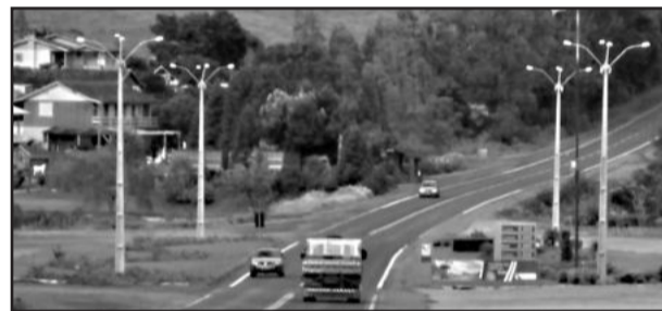
Mais iluminação em trevos do interior

Um novo projeto da Secretaria prevê em teste com lâmpadas de LED. Dois postes serão colocados em frente ao prédio da antiga Estação Ferroviária. A luz fornecida é branca, que melhora a visibilidade, e o sistema não utiliza energia elétrica, carregando as baterias através de captação da energia solar. Se aprovado, os postes de LED devem ser utilizados em outros pontos da cidade, especialmente nos trevos de acessos às comunidades que ainda não possuem iluminação.