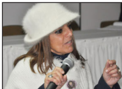
Céci tirou dúvidas sobre o funcionamento do Conselho Municipal do Idoso