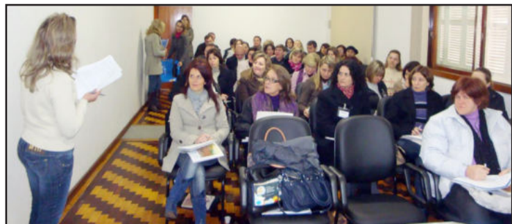
Encontro reuniu cerca de 40 pessoas

Cerca de 40 pessoas participaram nesta quinta-feira, dia 30 de julho, na sede da Associação dos Municípios do Vale do Taquari (Amvat) em Estrela, do encontro mensal da Associação dos Secretários Municipais de Educação do Vale do Taquari (Asmevat).