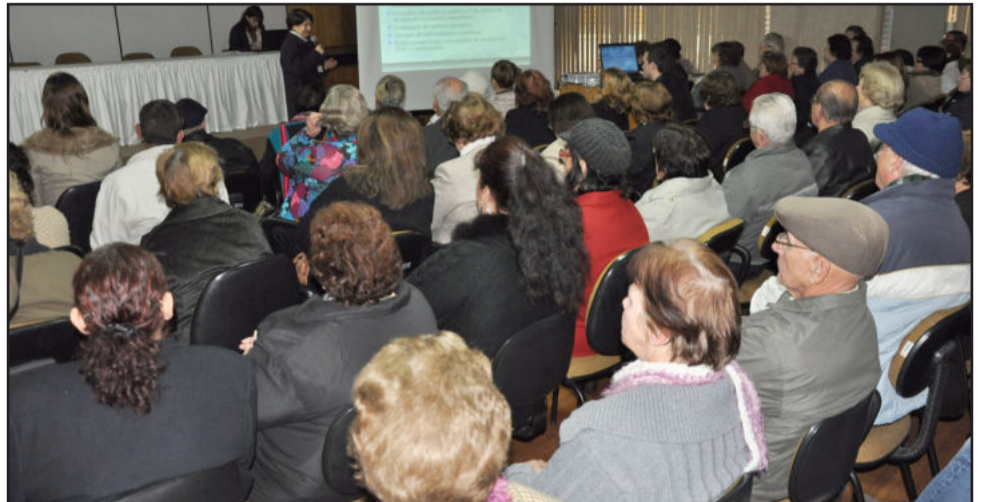
Grande número de idosos participou da conferência

1ª Conferência Municipal do Idoso discute políticas públicas de proteção a terceira idade em Lajeado