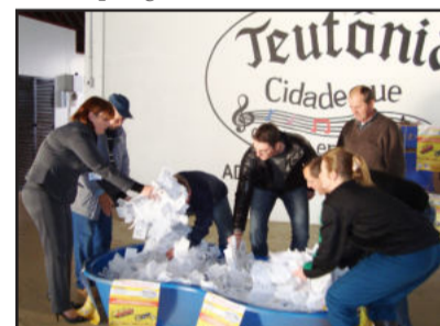
Terceiro sorteio da campanha foi nesta quinta-feira, dia 30 de junho

contemplada com um televisor LCD 32 polegadas. No dia 29 de abril houve o segundo sorteio, que contemplou Lisiane A. Hack Schwingel, residente no Bairro Canabarro, com um aparelho televisor LCD 32 polegadas.