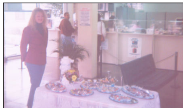
Nestes 33 anos, agências da Caixa mudaram visual interno, externo e questões de segurança