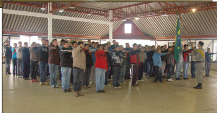
Juramento à Bandeira de dispensa de incorporação classe 1992 e anteriores