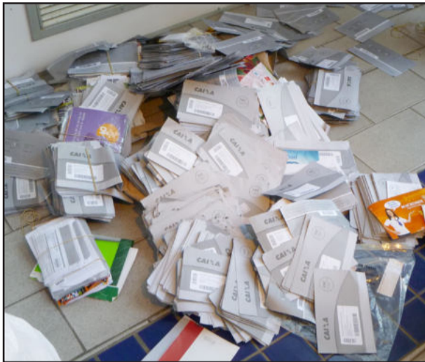
Quando foram flagrados, os dois carteiros tentavam queimar cerca de 14 mil correspondências

Segundo nota emitida pela Polícia Federal, a suspeita dessa ação de destruição ocorreu a partir da reclamação de clientes. Fontes da Brigada Militar ressaltam que algumas pessoas da empresa suspeitaram da queima, principalmente porque os dois carteiros teriam alegado que se tratava de material velho, para justificar a queima.