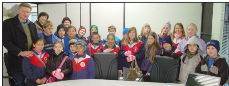
Alunos do 4º ano da EMEF Leopoldo Klepker visitaram o gabinete do prefeito