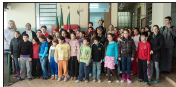
Alunos da EMEF 24 de Maio puderam fazer CPF na própria escola

A Escola Municipal de Ensino Fundamental 24 de Maio, localizada no Loteamento 8, Bairro Canabarro, realizou no dia 22 de junho, em parceria com a agência dos Correios, o cadastramento dos alunos de 5ª a 8ª série interessados em obter o registro no Cadastro de Pessoas Físicas (CPF), nas dependências do educandário.