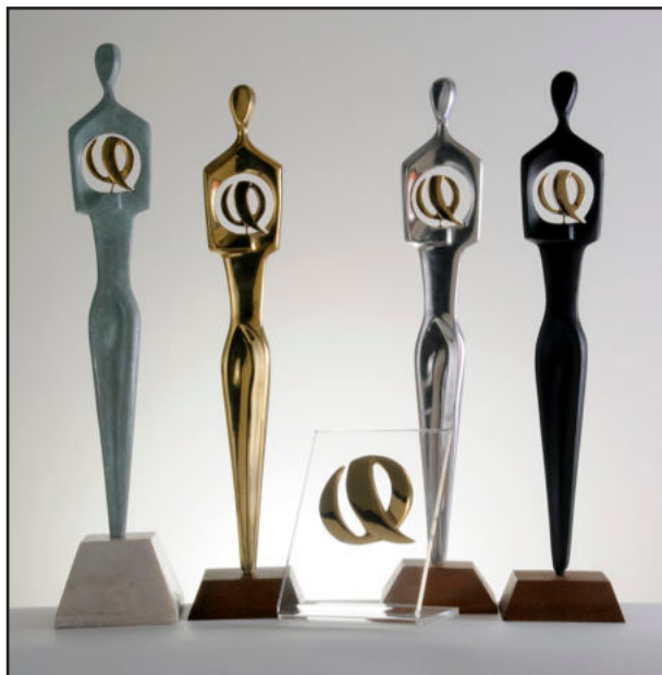
Destaques da economia gaúcha serão premiados nas categorias Medalha de Bronze e Troféus Bronze, Prata, Ouro e Diamante

O Comitê Regional da Qualidade do Vale do Taquari voltou a ser reconhecido entre os 81 do Estado, figurando entre os dez de maior destaque no Rio Grande do Sul, e igualmente será premiado na próxima terça-feira.