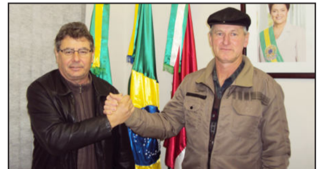
Prefeito e vice-prefeito de Westfália comemoram a conquista

para evitar o êxodo rural. Com 427 propriedades rurais distribuídas nos mais de 6 mil hectares de área da cidade, a agricultura é apontada pela administração municipal como principal responsável pelo desenvolvimento da cidade. O setor metalúrgico, com duas empresas responsáveis por 100 empregos diretos, é outro destaque econômico da cidade. A estrutura viária tem quase 80% das vias asfaltadas.