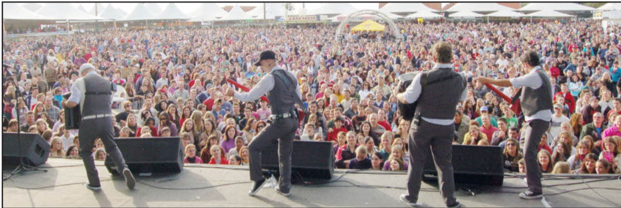
Show da Família é uma das marcas da emissora

A Rádio Popular FM completou, ontem, dia 1º de julho, seus 22 anos de transmissão em caráter definitivo e ininterrupto. A trajetória de sucesso e amizades iniciou no ano de 1989, a partir de quando iniciou a construção de seu trabalho, que hoje está presente em mais de 50 municípios, com entretenimento e informação aos ouvintes.