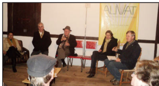
Sarau Literário reuniu escritores no Parque Histórico

Feira do Livro - A Alivat vai participar da Feira do Livro de Lajeado, que acontece de 9 a 14 de agosto, no Parque do Imigrante. A Academia vai estar presente com um estande contendo os livros dos autores do Vale do Taquari.