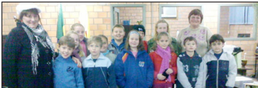
Alunos assistiram os trabalhos da Câmara

Os projetos 041 e 042 ficaram baixados, apesar de terem entrado com pedido de regime de urgência. Na votação, o regime de urgência foi aprovado por cinco votos a quatro, mas após muito debate, os projetos acabaram baixados para propiciar melhor análise dos vereadores e devem ser votados na próxima terça-feira, dia 5 de julho.