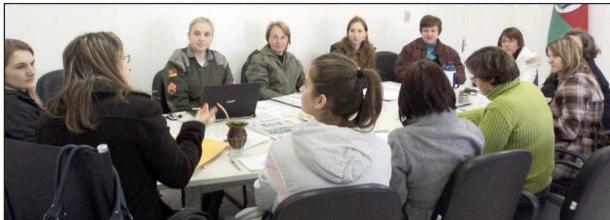
Membros do Conselho Municipal de Assistência Social estiveram em reunião

Na próxima quinta-feira, dia 7, o Município realizará a 8ª Conferência Municipal da Assistência Social, que acontece no salão da Oase, junto à Comunidade Evangélica, das 8h30min às 16 horas. A conferência é realizada pelo Conselho Municipal de Assistência Social, juntamente com a Prefeitura, por meio da Secretaria Municipal de Saúde e Assistência Social.