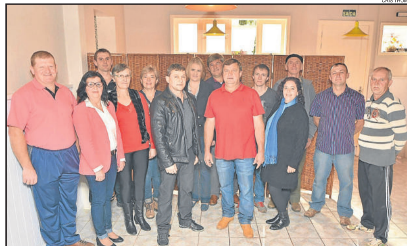
Oposição definiu seus candidatos neste sábado

O prazo para registro de candidatos pelos partidos políticos e coligações nos cartórios termina às 19 horas, do dia 15 de agosto. Já o período da campanha eleitoral começa no dia 16 de agosto.