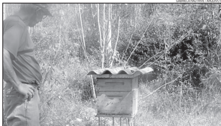
Produtores estão apreensivos com furtos de caixas e saques de mel

Os associados vítimas dos furtos realizaram registro de ocorrência na Delegacia de Polícia. Os municípios com mais registros são Teutônia, Fazenda Vilanova e Paverama. A Associação dos Apicultores já tem algumas pistas referentes a forma que estão ocorrendo os furtos. “Dentro dos próximos dias a associação deve emitir mais uma outra nota oficial sobre o assunto”, relata Brune.