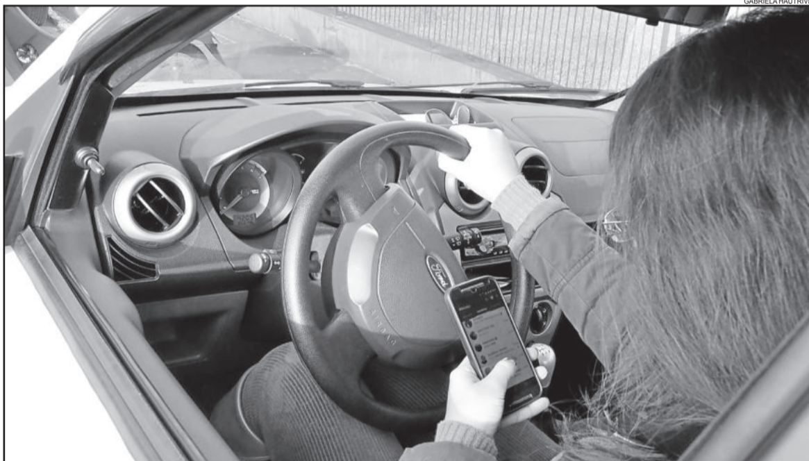
Mexer no celular enquanto dirige será multa gravíssima

celular, tanto no viva voz quanto segurando o aparelho, distrai o condutor, e ele presta atenção na conversa e não fica 100% atento ao trânsito. "Nosso cérebro não conse-