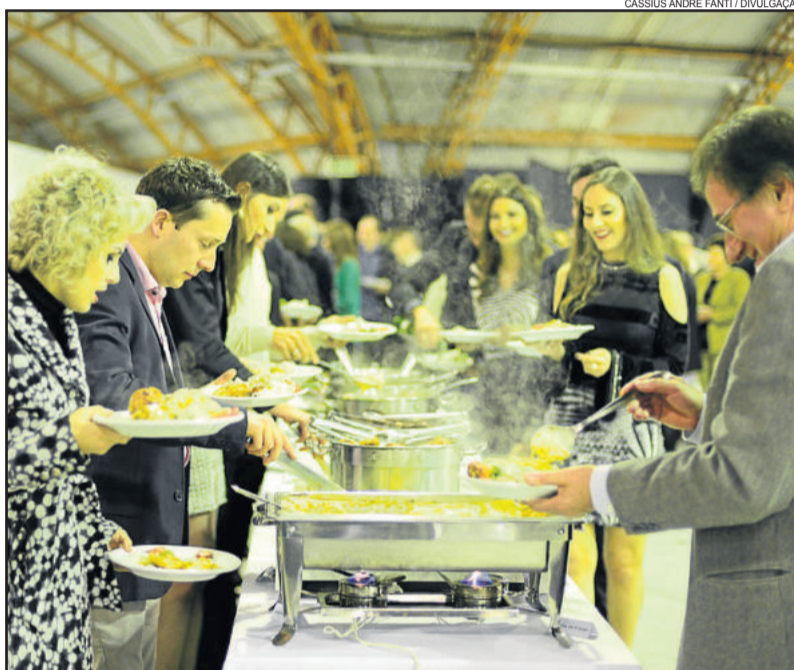
Cardápio contou com pratos que tinham a carne de frango como ingrediente especial

Organizado pela CIC, em benefício ao Consepro, o Festival do Frango e do Vinho contou com participação de outras entidades municipais: CDL Garibaldi, CEC, Prefeitura Municipal, Câmara de Vereadores, AVG, AFC, Antigar, Polícia Civil, Bombeiros Voluntários, Brigada Militar, Aviga, Lions Clube, Rotary Club, AMG, OAB, SHRBS, Agamóveis, Apeme e STR.