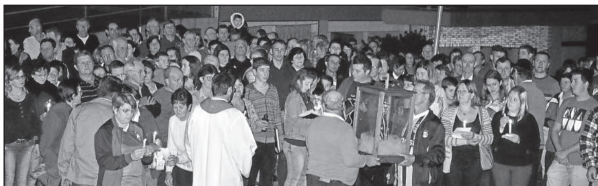
Procissão conduziu a imagem de Nossa Senhora Aparecida até a Igreja Matriz em Poço das Antas