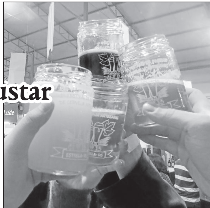
Mais de 90 tipos de Cerveja foram oferecidos no evento

O sábado, dia 30, foi para encher os olhos e o paladar dos degustadores e apreciadores de uma boa cerveja. Reunidos no ginásio Cristo Rei, em Estrela, diversas pessoas provaram mais de 90 estilos de cervejas artesanais, distribuídos em 20 cervejarias no 2º Festival de Inverno da Cerveja Artesanal, promovido pela Associação dos Cervejeiros Artesanais (Acerva) de Estrela.