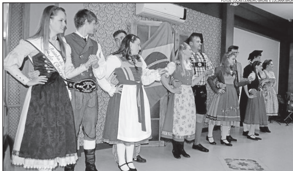
Grupo de danças folclóricas de Estrela