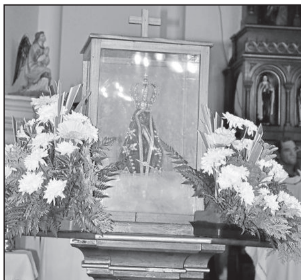
Imagem está percorrendo paróquias e comunidades de todo o país

Os 300 anos da aparição da imagem de Nossa Senhora Aparecida no Rio Paraíba do Sul serão em 2017. Mas visando que a imagem chegue até todas as paróquias do Brasil, a peregrinação já ocorre desde o início de 2016.