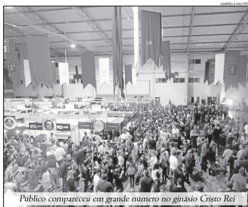
Público compareceu em grande número no ginásio Cristo Rei