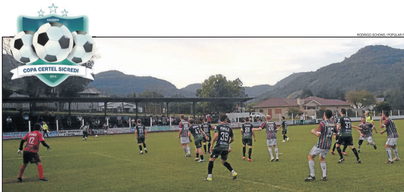
Fluminense tentou buscar o empate, porém perdeu em casa

Na rodada deste domingo, quatro equipes venceram fora de casa: Ouro Verde, São Cristóvão, Arroio Alegrense e Ribeirense conseguiram os três pontos jogando longe de suas praças esportivas.