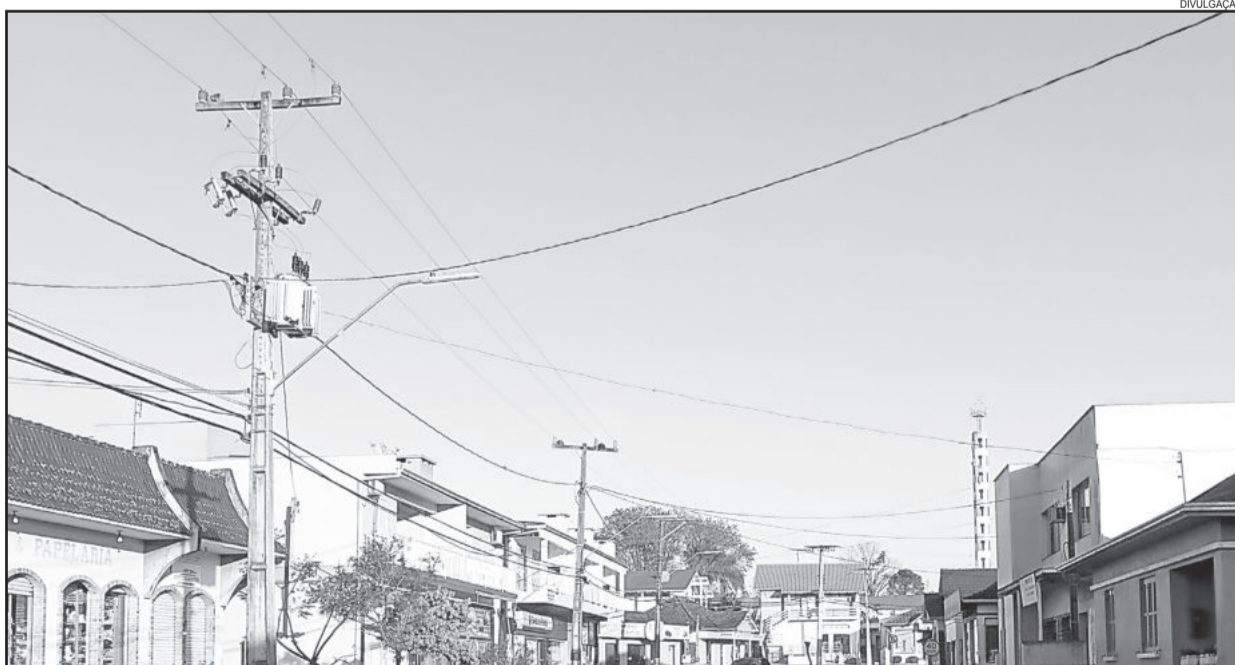
Postes da Rua 4 de Julho receberam lâmpadas LED

A ideia do projeto piloto, sem custos para o Município, é avaliar, na prática, como funciona a iluminação com esse tipo de lâmpada. Caso seja aprovado pela população, existe a possibilidade do sistema ser adotado definitivamente pelo Município.