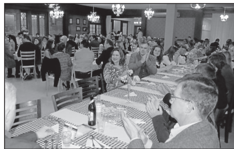
Salão de eventos lotado para momento de resgate da cultura alemã.

A gastronomia foi um dos pontos altos do evento, junto com as apresentações artísticas, que demonstraram o talento de pessoas de diferentes idades. No jantar, pratos típicos da culinária alemã foram saboreados: chucrute, schwei-