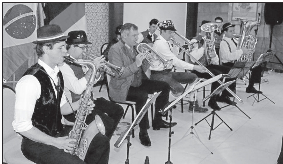
Banda típica alemã