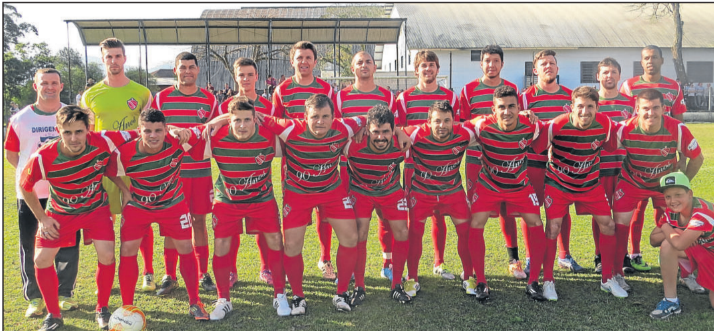
Riograndense perdeu pela primeira vez

ARBITRAGEM - Adriano Soares, auxiliado por Maicon Flores e Renato Andres LOCAL - Campo do Rui Barbosa - Colinas DATA - 31/07/2016