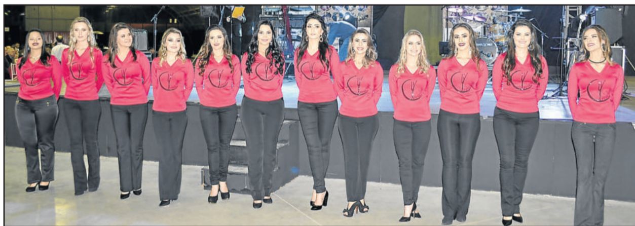
Festival do Frango e do Vinho foi marcado pela apresentação das 12 candidatas a soberanas da Fenachamp