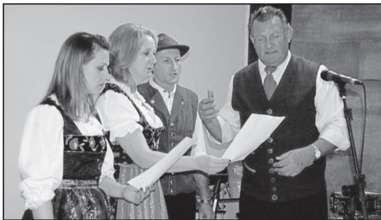
Grupo de canto de Brochier e Maratá se apresentou

Na noite também foi realizado o convite para o grande evento que ocorrerá no dia 20 de agosto, no ginásio da Univates, reunindo 780 instrumentistas, durante a programação do Encontro Nacional de Conjuntos Intrumentais, de 18 a 20 de agosto. Nesta semana, especialmente quinta e sexta à noite, será necessária a hospedagem de 250 jovens músicos na região. O Colégio Teutônia solicita que os interessados em auxiliar, oferecendo hospedagem a algum jovem, façam contato com as instituições.