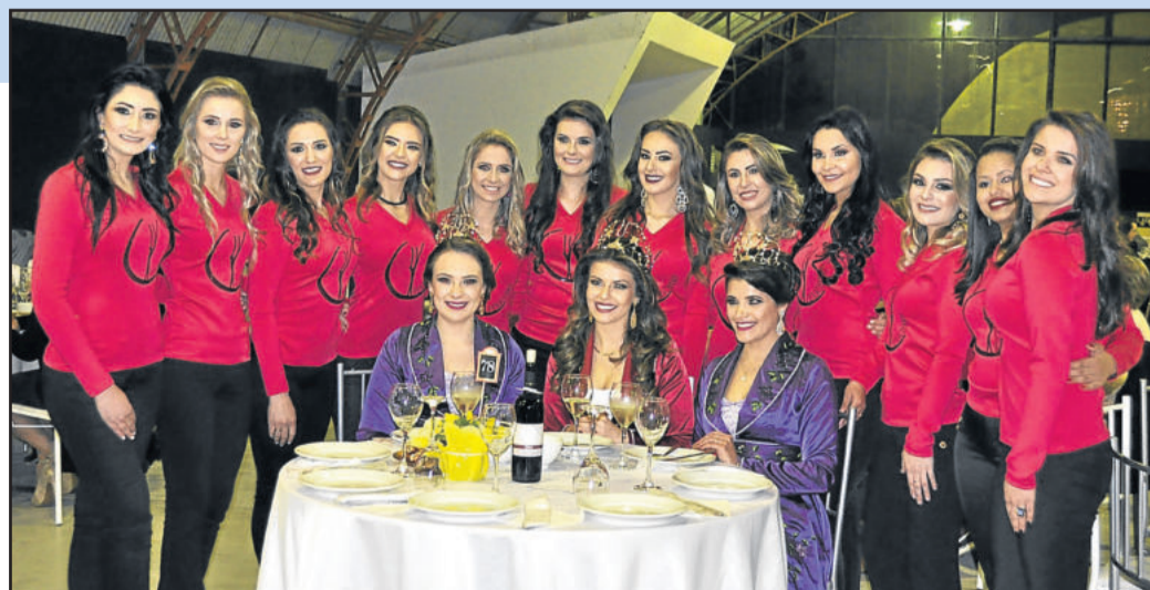
Candidatas com as atuais soberanas da Festa do Espumante Brasileiro

No sábado à noite, foi a primeira vez que as candidatas apareceram de forma oficial, em conjunto, à comunidade garibaldense. A partir de agora, a agenda será intensa, reunindo treinamentos e visitas aos pontos turísticos da cidade. A próxima edição da Fenachamp será entre os dias 5 a 29 de outubro de 2017, no Parque da Fenachamp, em Garibaldi.