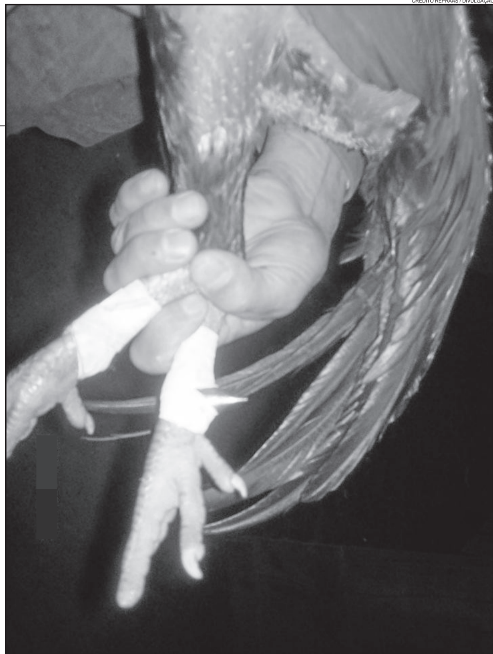
Animais são preparados com esporas de metal para os combates

“Sabemos que a briga de galo é um fenômeno natural, que ele briga por orgu-