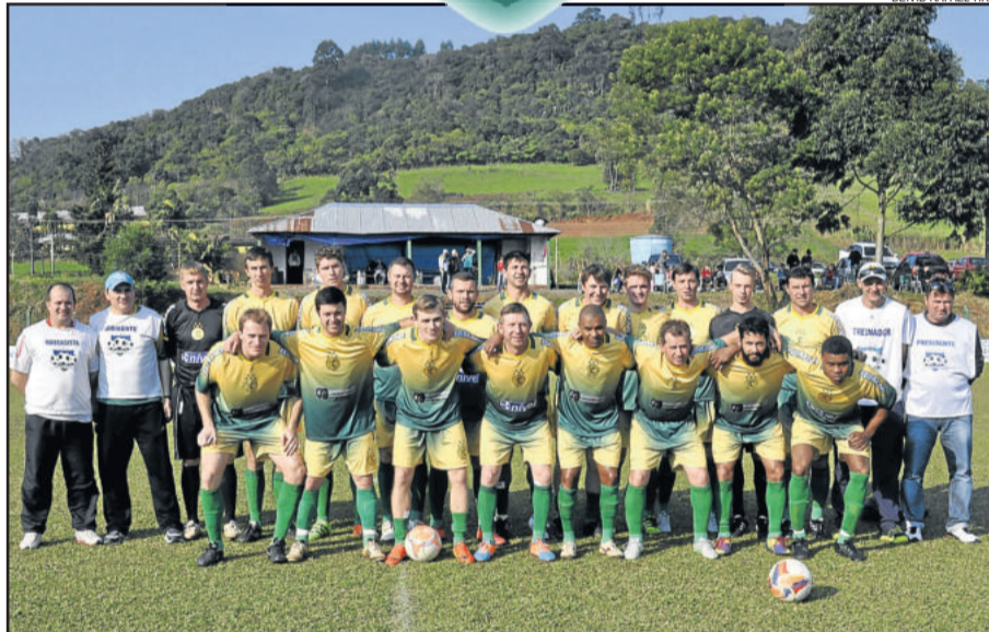
Canarinho de Cruzeiro do Sul venceu a segunda seguida e é um dos líderes