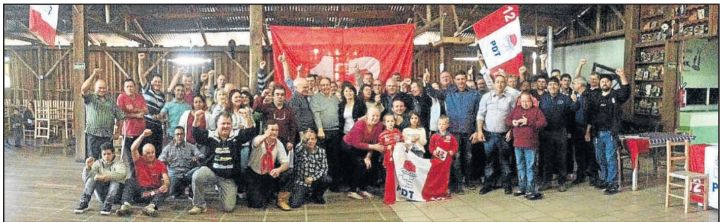
PDT, PT e PTB confirmaram coligação

desta edição, os partidos não tinham liberado a lista de candidatos a vereador. Os partidos têm até 15 agosto, às 19h, para registrar as candidaturas nos cartórios. Já o período da campanha eleitoral começa no dia 16 de agosto.