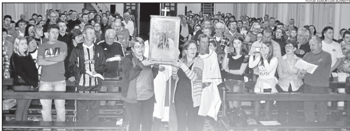
Imagem foi conduzida até a Igreja Matriz de Poço das Antas, onde houve missa

No Centro, dezenas de pessoas aguardavam, à luz de velas, a chegada da Santa na Praça Municipal, onde ainda houve um Momento Mariano. Com canções de fé e devoção e orando a oração de Ave Maria, a