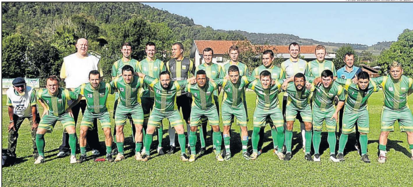
Ouro Verde venceu pela primeira vez na competição