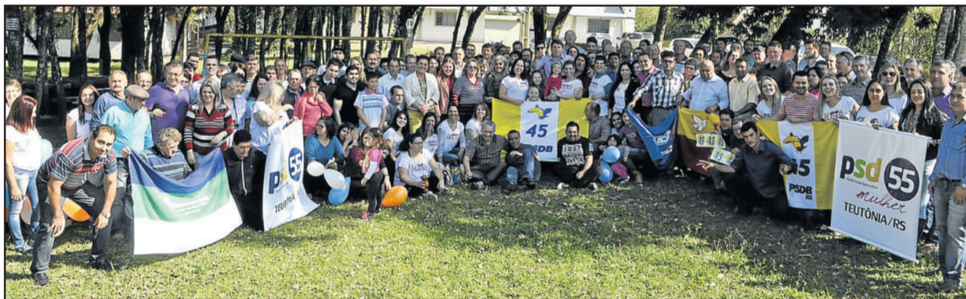
Convenção reuniu PSDB, PSD, DEM, PRB e PSB