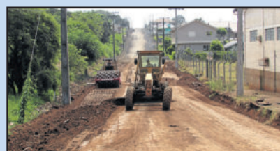
Rua Décio Böhmer