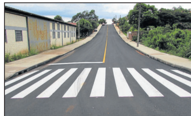
Rua Bruno Driemeyer