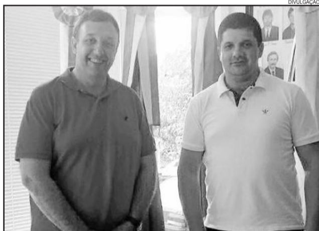
Encontro aconteceu na Câmara de Anta Gorda

A entidade será parceira da UVB na realização do Seminário Nacional de Capacitação Legislativa. O evento acontece em Encantado (RS), nos dias 11, 12 e 13 de junho, integrando a programação da Suinofest, feira do município.