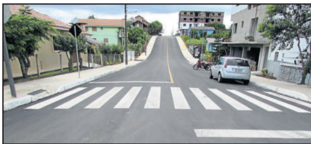
Rua Edvino Horst

As oito vias integram o conjunto de obras do PAC2, que prevê a pavimentação asfáltica da pista de rolamento e a construção da calçada de passeio onde não existe em 26 ruas do Município. Na licitação, o valor final ficou em R$ 8,9 milhões (R$ 8.998.850,10), e a empresa Conpasul apresentou a melhor proposta. Deste total, cerca de R$ 8,5 milhões são recursos do PAC2 e em torno de R$ 500 mil são contrapartida de recursos próprios do Município.