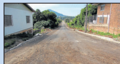
Rua Asido Dreyer

As três vias fecham o conjunto de obras do PAC2, que prevê a pavimentação asfáltica da pista de rolamento e a construção da calçada de passeio onde não existe em 26 ruas do Município. Na licitação, o valor final ficou em R$ 8,9 milhões (R$ 8.998.850,10), e a empresa Conpasul apresentou a melhor proposta.