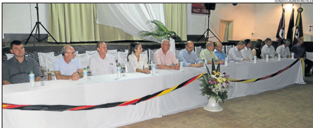
Lançamento do KerbFest ocorreu na noite de sexta-feira, dia 16