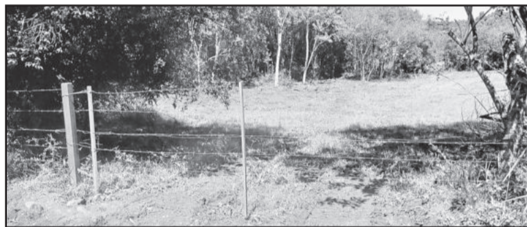
Escavadeira de Teutônia realizou manutenção em córrego, em propriedade particular de Estrela, sem licença

O sargento da PATRAM disse à reportagem que a denúncia foi anônima.