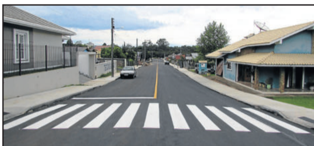
Rua Erno Beckmann