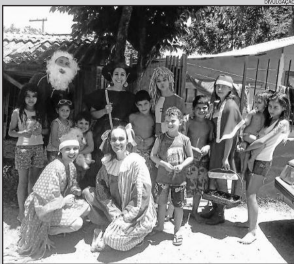
PIM completa em fevereiro um ano de atuação em Lajeado