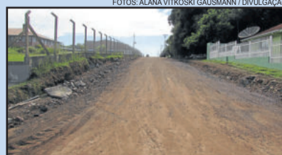
Rua Leopoldo Knöpker