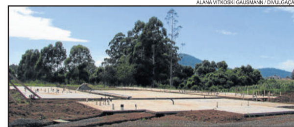
Evolução das obras de construção da Escola de Educação Infantil do Bairro Alesgut

Esta será a terceira Escola Municipal de Educação Infantil (EMEI) de Teutônia. A Administração Municipal já inaugurou em 2011 a EMEI Sonho de Criança do Bairro Canabarro (construída a partir de 2010) e em 2013 realizou o processo de municipalização da EMEI Meu Cantinho, da Vila Popular. "Gradualmente, vamos municipalizando as creches conforme a disponibilidade de recursos", destaca o prefeito Renato Airton Altmann.