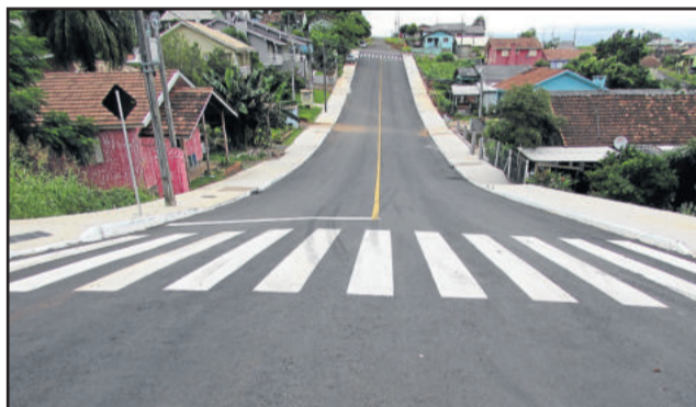
Rua Raimundo Dahmer