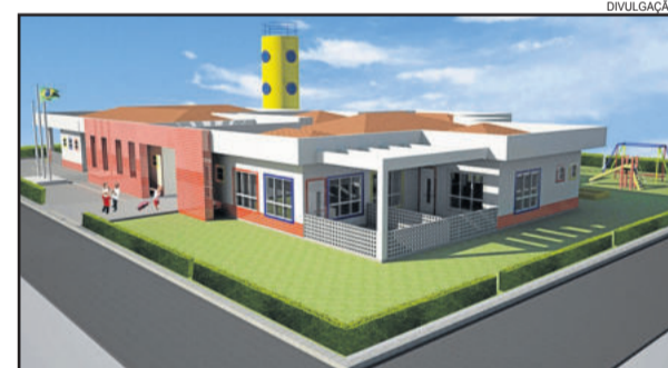
Projeção de como será a nova escola infantil do Alesgut