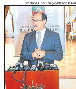
Sartori fez anúncio ontem

Sartori ressaltou que o projeto concedendo reajustes ao governador, ao vice-governador, aos secretários, deputados estaduais, ao Ministério Público, Judiciário e à Defensoria Pública foi aprovado em 2014 pelo Legislativo, com apoio de todos os partidos. O governador enfatizou que respeita as outras instituições, de forma a preservar a harmonia dos Poderes de Estado.