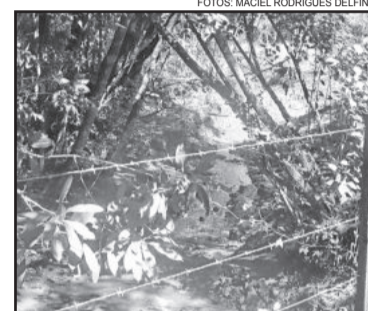
Limpeza para escoar a água

Procurado pela reportagem para comentar um possível envolvimento na denúncia, a assessoria de Comuni-