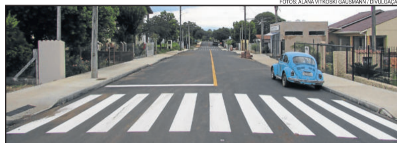
Rua 7 de Setembro