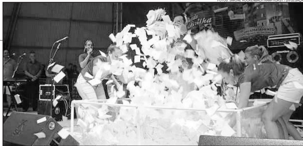
Sorteio final teve participação de 330 mil seladinhas

A intensa programação do Lajeado Brilha teve várias atividades além da etapa promocional. Chegada do Papai Noel com espetáculo de teatro e artes circenses, Casa do Papai Noel, passeios de Cedelinho, Cortejo de Natal com trenó e música na rua. O Lajeado Brilha 2014 tem o patrocínio de Imojel, Benoit e Sicredi e apoio de PAP Urbanizadora, Bebidas Fruki e Prefeitura de Lajeado.