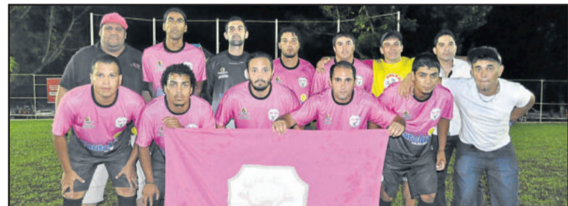
Com algumas novidades, Kaxa Baxa venceu por placar apertado diante do Gaúcho