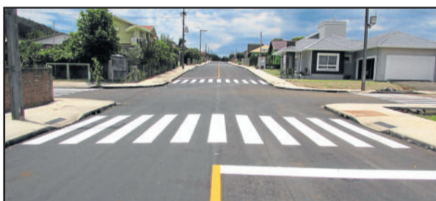
Rua Osvaldo von Mühlen