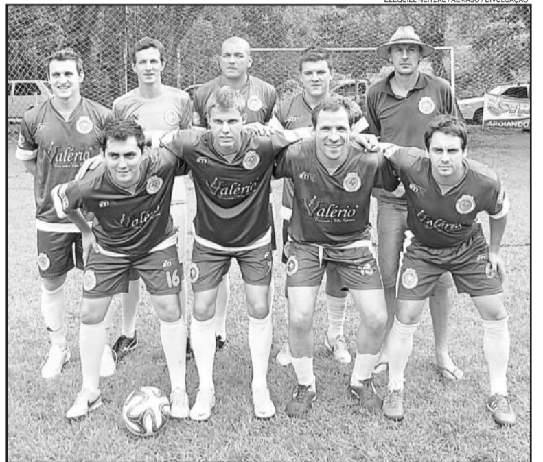
Atual campeão, Maravilha, deu adeus ao campeonato após empatar com o Xurupita de Travesseiro

Schmitt (9 pontos), Só Feras (9), Jucatra (7), TQ Vôlei Show (7), Brothers (2) e Camping do Stackão (2)