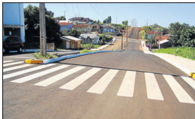
Avenida 01 Leste