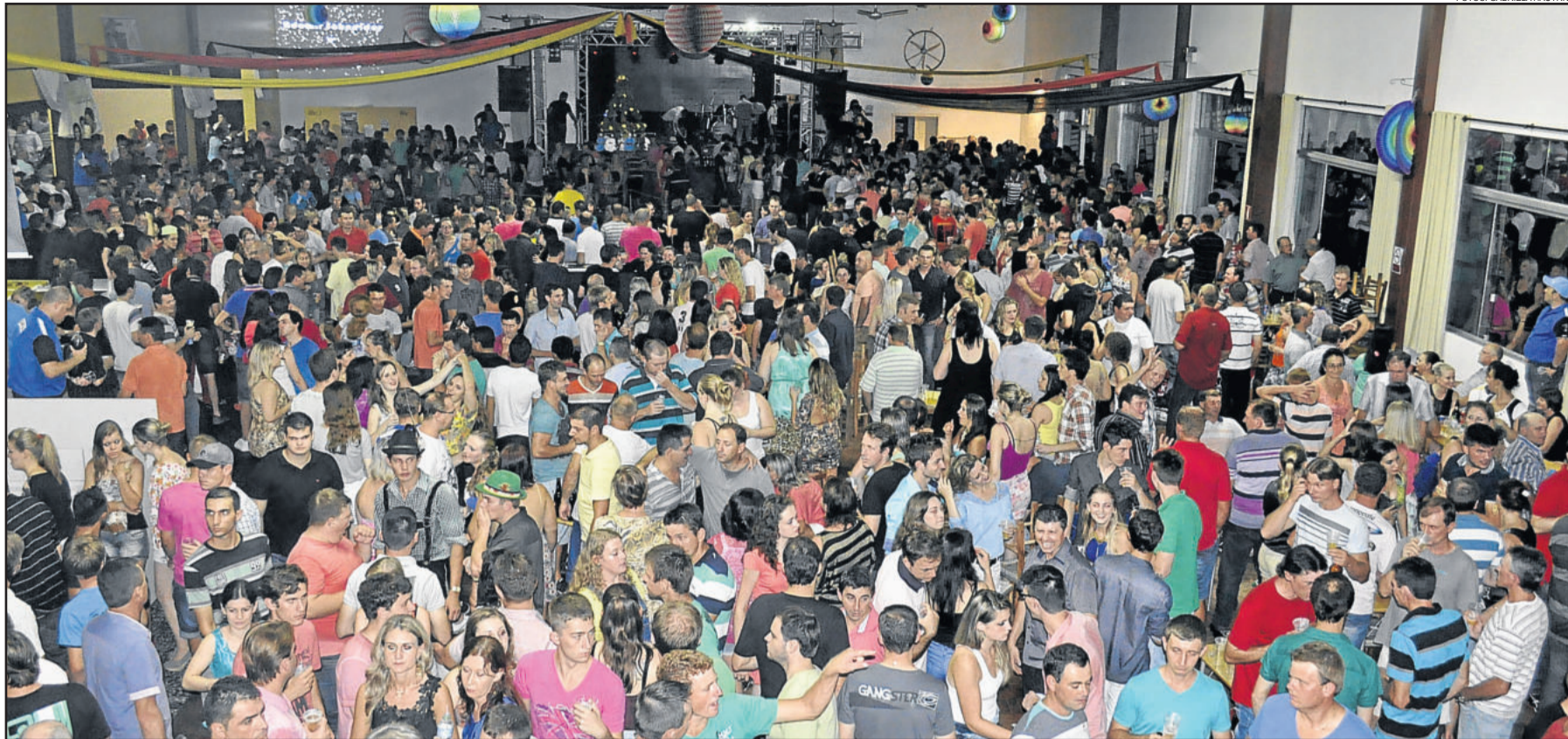
Público lotou a SASCPA na noite de sábado, dia 17