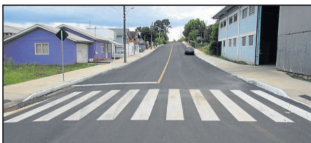
Rua Jorge Wiethölter