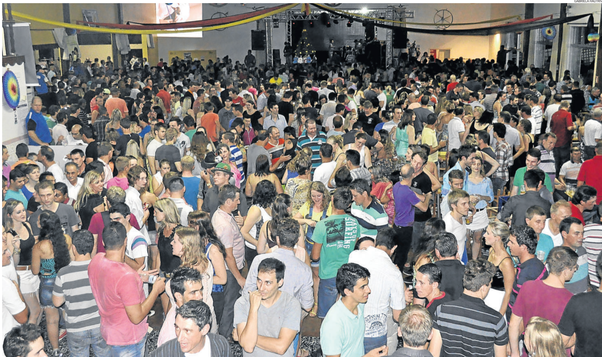
Quase 5 mil pessoas estiveram na primeira noite do KerbFest da SASCPA. Hoje à noite acontece o segundo baile. POÇO DAS ANTAS > 4 E 5

PAVIMENTAÇÕES DO PAC 2 ESTÃO NA RETA FINAL