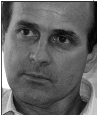
Prefeito eleito firma compromissos

6 - Criação de políticas de incentivo ao Turismo e atração de novos negócios.