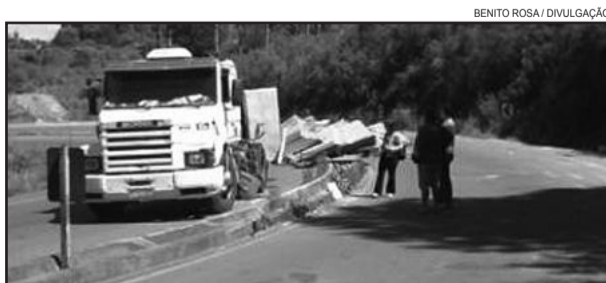
Mais um tombamento de caminhão RSC-453

No mesmo local, muitos outros acidentes semelhantes já aconteceram. Em um deles, uma criança de 3 anos morreu, em 2009, quando um ônibus que fazia a linha Três Passos-Garibaldi tombou neste mesmo local. A curva, em aclive, não é contornada pelos motoristas desavisados que chegam até ela depois de um longo trecho de descida em linha reta.