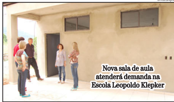
Nova sala de aula atenderá demanda na Escola Leopoldo Klepker