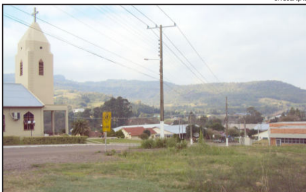
Estado autoriza licitação para construir a Escola Estadual

O terreno está apto para receber a estrutura do novo educandário que alavancará ainda mais a educação em Westfália. A estrutura contará com salas de aula, laboratório de ciências e de informática, secretaria, salas de direção e professores, biblioteca, sanitários, cozinha refeitório, despensa e circulações com área de 672,05 m 2 e, ampliação com construção de prédio em alvenaria com área de 142,70 m 2 , constando de salas de estudos para professores, sala ambiental, guarita, totalizando área de 814,75 m 2 , cercamento com área de 283,62 m 2 .