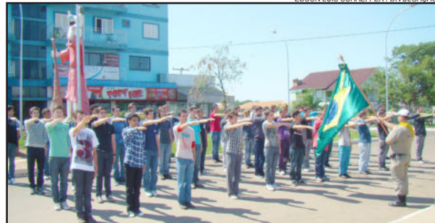
Quarenta e oito jovens prestaram o Juramento à Bandeira em Fazenda Vilanova