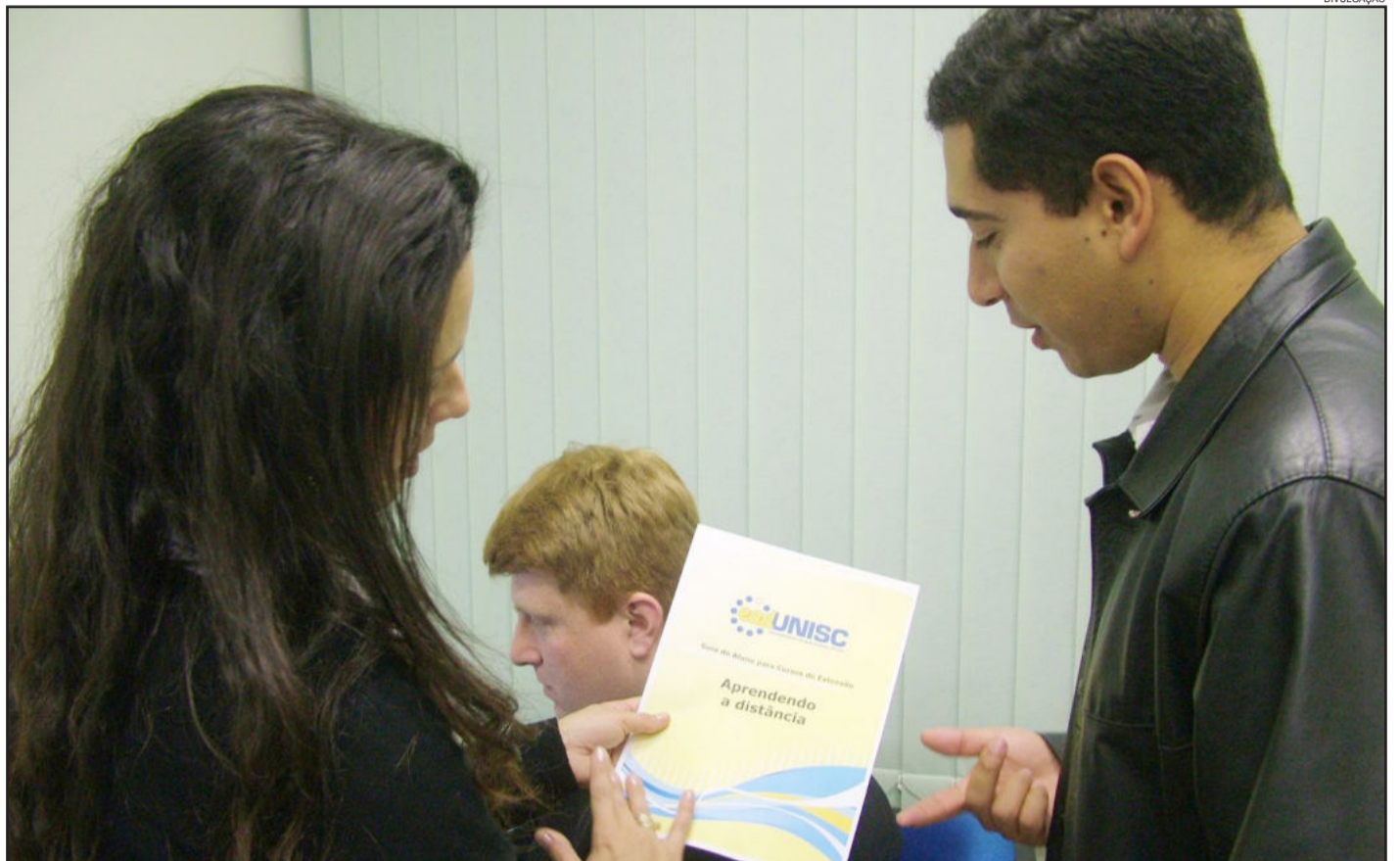
Seguindo o que outras instituições fazem há vários anos, como a Unisc, a Univates também abrirá o primeiro curso de Ensino Superior a distância, programado para o próximo semestre. Páginas 10 e 11