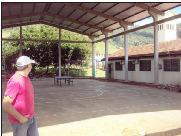
Escola da Paissandu

NOTÍCIAS DA CÂMARA MUNICIPAL DE Westfália