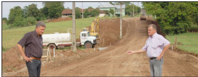
Obra de pavimentação de Linha Clara

No dia 28 de janeiro de 2012 foi inaugurada a pavimentação asfáltica da Estrada de Linha Ribeiro, outra obra aguardada há vários anos pela população. A obra impressiona pelas suas dimensões, com aterro e galerias para evitar interrupções em caso de enchente do Arroio Posses. São 1.786 metros de extensão por 6 metros de largura para a pista de rolamento. O investimento é de aproximadamente R$ 1,2 milhão. Esta é uma das poucas obras que a Prefeitura financiou via Caixa RS, além de recursos próprios aplicados como contrapartida.