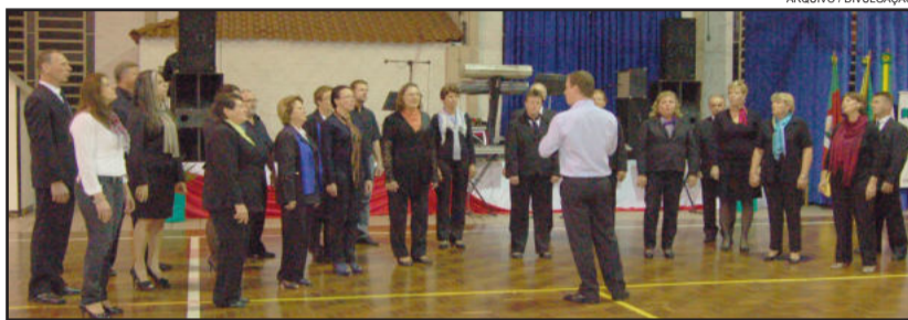
Coral Municipal de Teutônia é promotor do Festival de Coros

Neste ano, o Festival FECORS está sendo realizado de maio a dezembro, em mais de 40 cidades, contando com a participação de 280 coros e em torno de 6.500 coristas. Isto se tornou possível através da Lei de Incentivo à Cultura do Governo do Estado, com o patrocínio da Cooperativa Piá, Lojas TAQÍ, PanFácil, Solar e Dickow (Arroz Rei Arthur).