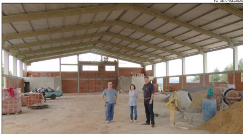
Construção do ginásio da Escola Alfredo Schneider

O ginásio de esportes, que fica na Rua Leopoldo Knöpker, no Bairro Teutônia, será em alvenaria e concreto pré-moldado. A área total contempla R$ 1.382,69