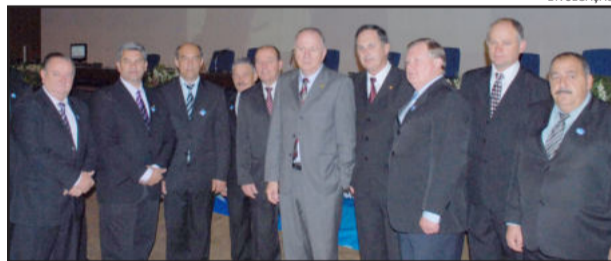
Prefeito Elemar Dickel esteve em Brasília