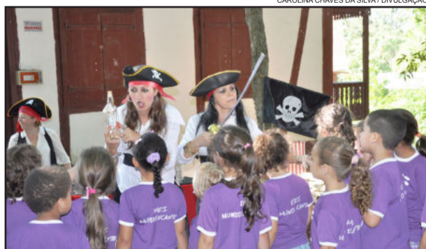
"As piratas" passaram orientações à criançada