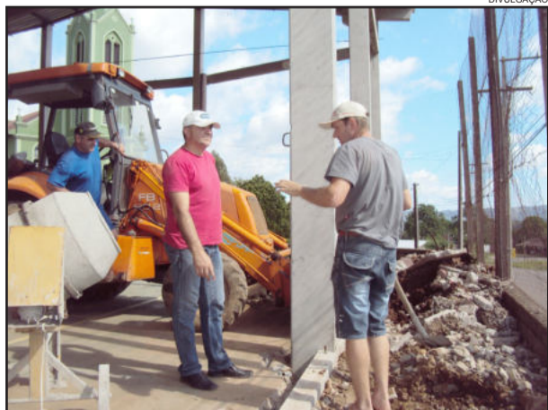
Escola da Berlim