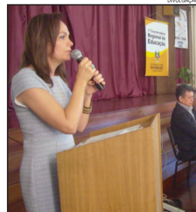
Coordenadora na abertura do evento

No turno da tarde o trabalho teve continuidade, através de oficinas, onde os grupos identificaram as diversas formas de conflito e violência na sala de aula, no ambiente escolar e no entorno das escolas.