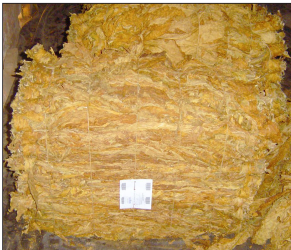
O B01 é a classe mais valorizada pela indústria fumageira

tante no cenário mundial de tabaco, possui a liderança no ranking de exportação desde 1993 graças à qualidade e integridade do produto que é comercializado para mais de 100 países. Outro forte fator concorrencial junto aos clientes internacionais é a produção sustentável conduzida no país, levada muito a sério por nossas empresas associadas, em sua maioria exportadoras”, avalia Schünke. Atualmente, mais de 85% do tabaco brasileiro é exportado.